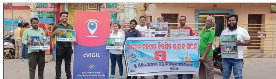
ସି-ଭିଜିଲ ଆପ୍ରେ ଭୋଟର ସଚେତନତା କାର୍ଯ୍ୟକ୍ରମ କରାଯାଇଛି।

ସି-ଭିଜିଲ ଆପ୍ ମାଧ୍ୟମରେ କିପରି ଜନସାଧାରଣ ଅଭିଯୋଗ କରିପାରିବେ ଏବଂ ଅଭିଯୋଗର ୧୦୦ ମିନିଟ୍ ଭିତରେ କିପରି ସମାଧାନ ହୋଇପାରେ ସେ ସମ୍ପର୍କରେ ଅବଗତ କରାଯାଇଥିଲା।