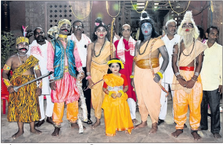
ମାର୍କଣ୍ଡେଶ୍ୱର ସାହିରେ ବନବାସ ନୀତି ପାଇଁ ରାମ, ଲକ୍ଷ୍ମଣ, ସୀତାଙ୍କ ସହ ମନ୍ତ୍ରୀ ଓ ପ୍ରଜାମାନେ ଯାଉଛନ୍ତି।

ଶ୍ରୀମନ୍ଦିରର ରୀତିନୀତି ଓ ପରମ୍ପରା ଅନୁଯାୟୀ ରାମନବମୀ ଠାରୁ ରାମ ଅଭିଷେକ ପର୍ଯ୍ୟନ୍ତ ଶ୍ରୀକ୍ଷେତ୍ରରେ ସାହିଯାତ ଅନୁଷ୍ଠିତ ହେଉଛି।