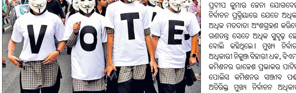
ସଙ୍ଗୀତ ମହାବିଦ୍ୟାଳୟ ଛାତ୍ରୀମାନେ ଭିନ୍ନ ଭେଷରେ ମତଦାନ ପାଇଁ ସଚେତନ କରୁଛନ୍ତି । ମାଷ୍ଟର କ୍ୟାଣ୍ଟିନ ଛକଠାରୁ ବାହାରି ପାଖଦେଇ ସତ୍ୟନଗରସ୍ଥିତ ବିଏମ୍‌ସି ଶ୍ରୀୟା ଛକ, କେନ୍ଦ୍ରୀୟ ବିଦ୍ୟାଳୟ ପହଞ୍ଚିଥିଲା ।