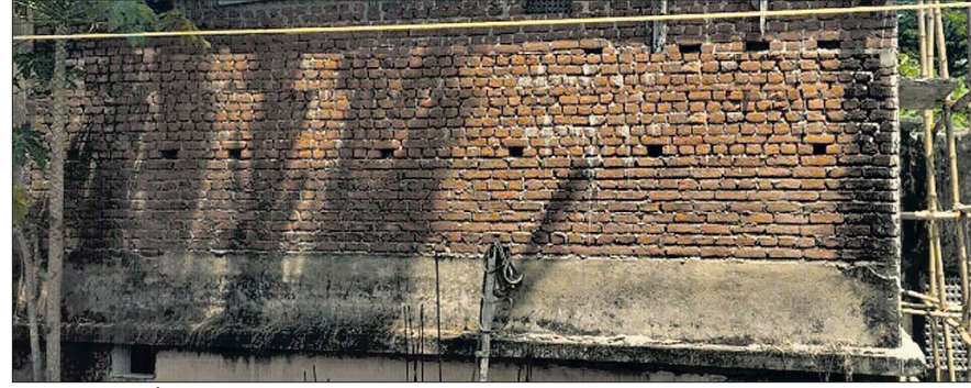
ଦିନା ଖୁଣ୍ଟରେ ନିର୍ମାଣାଧୀନ ଗୃହ।

କ୍ରାନ୍ତମୁଖିନୀ ଲବ୍ଧେଶ୍ୱରୀ ଗ୍ରନ୍ଥ ସଭା ସମ୍ପର୍କରେ ଶ୍ରୀ ପ୍ରକାଶ କରିଛନ୍ତି। ବର୍ତ୍ତମାନ କନିଷ୍ଠ ଯତ୍ନା ସ୍ଥାନୀୟ ରାଜନେତାଙ୍କ କିଆରେ ବନ୍ଦୀ ହୋଇ ଦଳୀୟ ପାଳକ ପାଇଁ ଅଧାରଦ୍ୱା କାର୍ଯ୍ୟକୁ ସମ୍ପୂର୍ଣ୍ଣ କରିବାକୁ ବିରାଡ଼ି ପାଣ୍ଡିର ଅର୍ଥରେ ନିଜ ନାମରେ କାର୍ଯ୍ୟାଳୟ ଗଠନ କରି ପିଲାରେ ପୁନର୍ବାର ସେହି ପ୍ରଧାନ ଶିକ୍ଷକଙ୍କ ଦ୍ୱାରା କାର୍ଯ୍ୟ କରୁଛନ୍ତି।