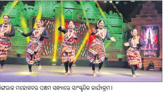
ଲିଙ୍ଗରାଜ ମହୋତ୍ସବର ପଞ୍ଚମ ସନ୍ଧ୍ୟାରେ ସାଂସ୍କୃତିକ କାର୍ଯ୍ୟକ୍ରମ ।

୪୨ ଗ୍ରୀଷ୍ମ ପାଇଁ ୫ ଅଧିକାରୀ ଆବଶ୍ୟକ ସଂଖ୍ୟକ କର୍ମଚାରୀ ନ ଥିବାରୁ ସହରରେ ବିକ୍ରି ହେଉଥିବା ଖାଦ୍ୟ ଓ ପାନୀୟର ମାନ ଠିକ୍ ଭାବେ ଯାଞ୍ଚ ହୋଇପାରୁ ନ ଥିବାରୁ ମୁହାଁମୁହିଁ ମିଳିଥିବା ପୂର୍ବନାମୁଖରେ, ବିଏମ୍‌ସିର ୩ଟି ଜୋନ୍‌ରେ ଏବେ ୨ଜଣ ଖାଦ୍ୟ ନିରୀପତା ଅଧିକାରୀ ରହିଛନ୍ତି । ଜଣେ ଅଧିକାରୀଙ୍କ ଦାୟିତ୍ୱରେ ୨ଟି ଜୋନ୍, ଅର୍ଥାତ୍ ୪୨ଟି ଗ୍ରୀଷ୍ମ ରହିଥିବାବେଳେ ଅନ୍ୟ ଜଣେ ଅଧିକାରୀ ୨୫ଟି ଗ୍ରୀଷ୍ମ ରହିଛି । ସେହିପରି ୪୨ଟି ଗ୍ରୀଷ୍ମରେ ଥିବା ବିଭିନ୍ନ ଖାଦ୍ୟ ଦୋକାନ ବା କୁଚ୍ ସେଖରକୁ ଯାଞ୍ଚ କରିବା ପାଇଁ ମାତ୍ର ୫ଜଣ ଫିଲ୍ଡ ଅଧିକାରୀ ରହିଛନ୍ତି । ଅର୍ଥାତ୍ ଜଣେ ଫିଲ୍ଡ ଅଧିକାରୀକୁ ପଡ଼ୁଛି । ତେଣୁ ଜଣେ ଅଧିକାରୀଙ୍କ ପକ୍ଷେ ଏତେଗୁଡ଼ିଏ ଅଞ୍ଚଳ ବୁଲି ତଦାରଖ କରିବା ଏବଂ ରିପୋର୍ଟ ପ୍ରଦାନ କରିବା ସମ୍ଭବ ନୁହେଁ । ତେଣୁ ଧର୍ମକୁ ଆଖିଠାରେ ଭଳି ଅଭିଯୋଗ ପାଲଟିଲା । କି ଚାହେଁ କେତେଟି ସେଖର ବା ଦୋକାନକୁ ଯାଇ ଗୁଣବତ୍ତା ଯାଞ୍ଚ କରି ବିଏମ୍‌ସି ଟ୍ରୁପ୍ ସଦସ୍ୟ ରହିଛନ୍ତି । ଏହାର ଫଳରେ ଅସାଧୁ ଲାଭଖୋର ବ୍ୟବସାୟୀମାନେ ନେଉଥିବାବେଳେ ସାଧାରଣ ଲୋକେ ହଇଜା ହେଉଛନ୍ତି ।