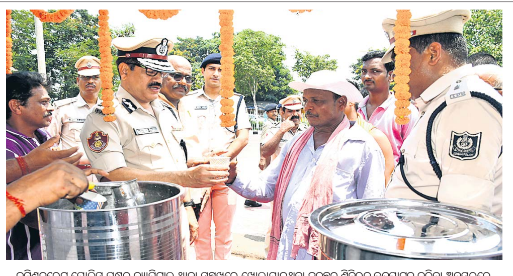
କମିଶନରେଟ ପୋଲିସ୍ ପକ୍ଷରୁ କ୍ୟାମ୍ପେନ ଥାନା ସମ୍ମୁଖରେ ଖୋଲାଯାଇଥିବା ଜଳଛତ୍ର ଶିବିରକୁ ଉଦ୍‌ଘାଟନ କରିବା ଅବସରରେ କମିଶନର ସଞ୍ଚାଳକ ପଣ୍ଡା ଲୋକଙ୍କୁ ବହିସାରି ବନ୍ଦନ କରୁଛନ୍ତି ।

ଭୁବନେଶ୍ୱର, ୨୦୧୪ (ସୁସ୍ୱୀକାର ବେହେରା) – ସାଲଡ଼ମରାକୁ କେନ୍ଦ୍ରକରି ଜଣେ ମହିଳା, ତାଙ୍କ ପୁଅ ଓ ସ୍ୱାମୀଙ୍କ ସହ ଗାଡି ଭ୍ରାଜଇଉକ ଆସାମାଜିକ ଯୁବକମାନେ ଆକ୍ରମଣ କରିଥିବା ନେଇ ଶହାଦନଗର ଥାନାରେ ଅଭିଯୋଗ ହୋଇଛି । ଅଭିଯୋଗ ଅନୁଯାୟୀ, କେନ୍ଦ୍ରାପଡ଼ା ଅଞ୍ଚଳର ଗାଡ଼ିକି ନିଶ୍ଚିତ ବିବାହ କାର୍ଯ୍ୟସାରି ଶୁକ୍ରବାର ଅପରାହ୍ନରେ ଫେରୁଥିବା ସମୟରେ ଶହାଦନଗର ଥାନା ନିକଟରେ ଏହି ଘଟଣା ଘଟିଥିଲା । ଏନେଇ ଗାଡ଼ିକିଙ୍କ ଅଭିଯୋଗ ଆଧାରରେ ପୋଲିସ୍ ଚଢ଼ତ ଚଳାଇଥିଲେ ମଧ୍ୟ କାହାକୁ ଗିରଫ କରିନାହିଁ ।