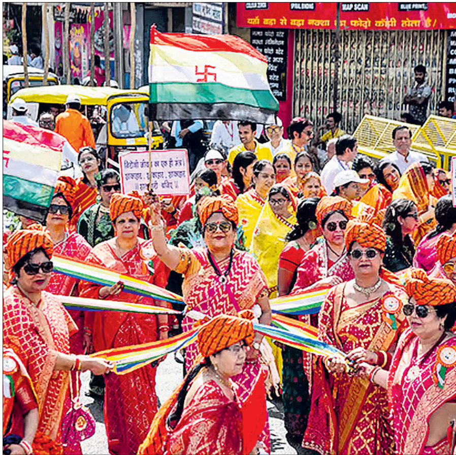
ପାଟନାରେ ମହାବୀର ଜୟନ୍ତୀ ଅବସରରେ ରବିବାର ଜୈନ ସମ୍ପ୍ରଦାୟର ମହିଳାମାନେ ଏକ ଧର୍ମୀୟ ଶୋଭାଯାତ୍ରାରେ ସାମିଲ ହୋଇ ନୃତ୍ୟ ପରିବେଷଣ କରୁଛନ୍ତି।