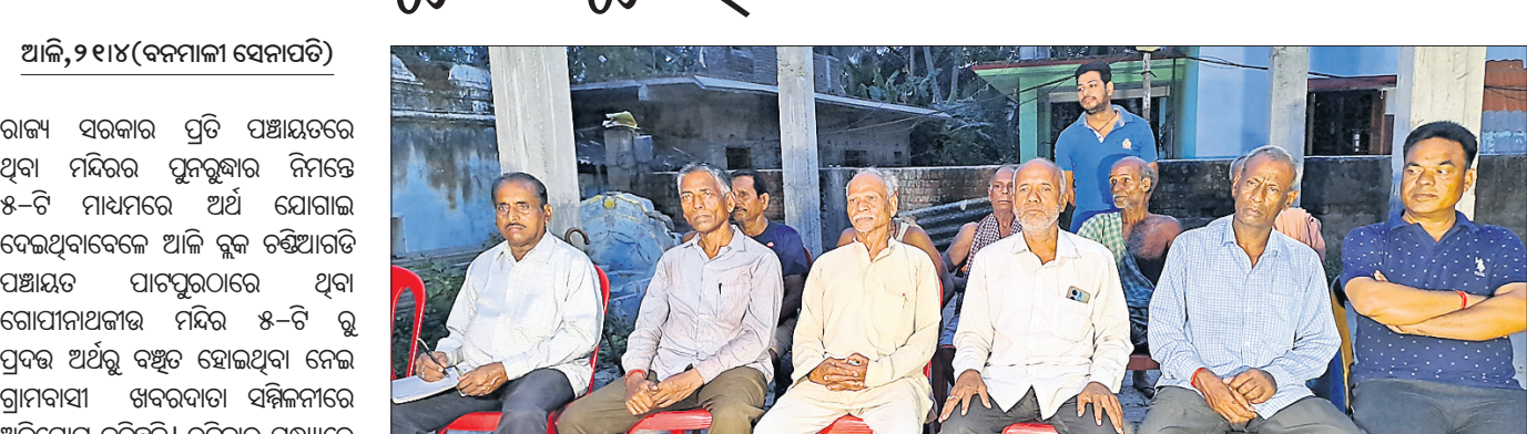
ଖରବଦା ସମ୍ମିଳନୀରେ ଯୋଡ଼ି ପ୍ରକାଶ କଲେ ଗ୍ରାମବାସୀ