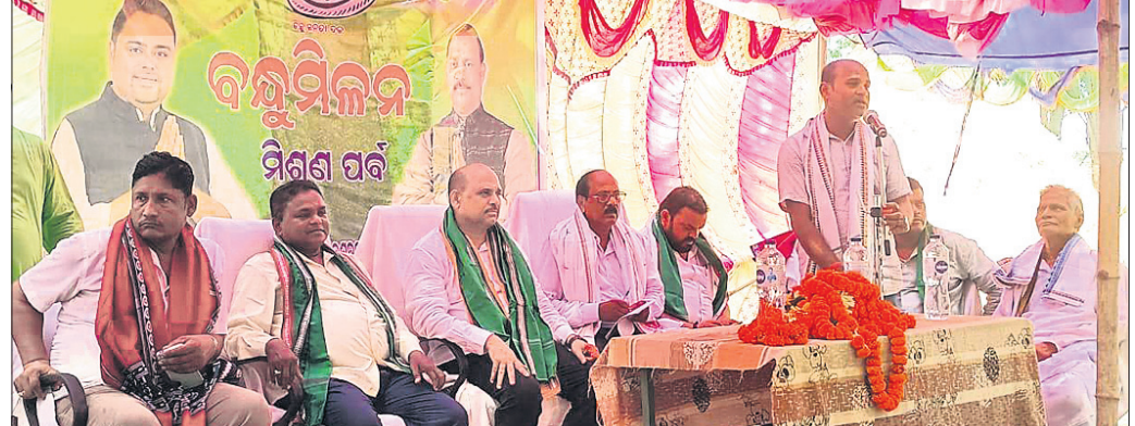
କର୍ମୀ ସମ୍ମିଳନୀରେ ବିଧାୟକ ଧ୍ରୁବ ସାହୁ ଓ ଅନ୍ୟମାନେ।