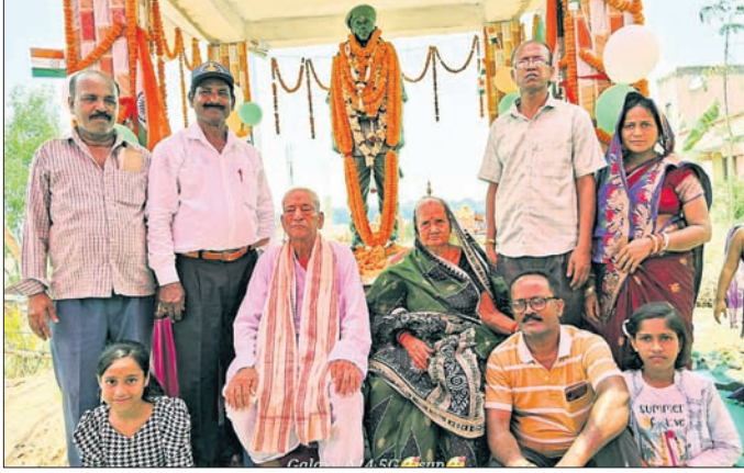
ଶହୀଦ ଜନ୍ମଦିନ ସାହୁଙ୍କ ପ୍ରତିମୂର୍ତ୍ତି ଅନାବରଣରେ ମା', ବାପା ଓ ଅନ୍ୟମାନେ।