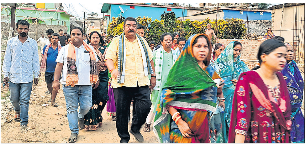
ଘରେ ଘରେ ଶଙ୍ଖ କାର୍ଯ୍ୟକ୍ରମରେ ମନ୍ତ୍ରୀ ପ୍ରତାପ କେଶରୀ ଦେବଙ୍କ ନେତୃତ୍ୱରେ ବାହାରିଥିବା ପଦଯାତ୍ରା।