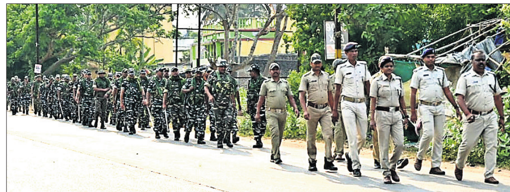
ରଘୁନାଥପୁରରେ ପୋଲିସ ପକ୍ଷରୁ ପୁରାଣିକ କରାଯାଇଛି।