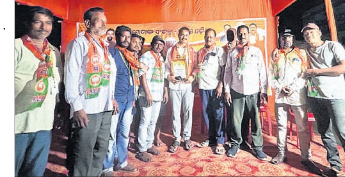
ମିଶ୍ରଙ୍କ ପର୍ବରେ ଯୋଗଦେଇଥିବା ଅନୁଲୀନ ଅଟୋ ଚାଳକ ସଂଘ କର୍ମକର୍ତ୍ତାମାନେ।