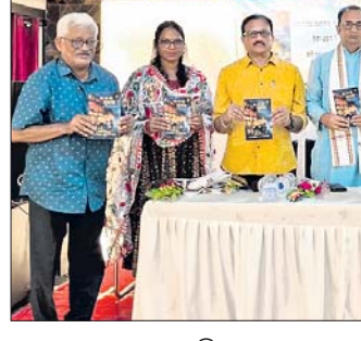
ଅତିଥିଙ୍କ ଦ୍ୱାରା ପୁସ୍ତକ ଲୋକାର୍ପଣ କରାଯାଉଛି।