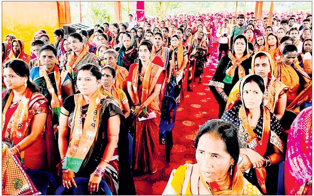
ସମାବେଶରେ ମହିଳା ମୋର୍ଚ୍ଚା କର୍ମୀମାନେ।

ଗୋପାଳପୁର, ୨୧୪ (ନବୀନ ରାଜ ଆଚାର୍ଯ୍ୟ) ଗୋପାଳପୁର ନିର୍ବାଚନ ମଣ୍ଡଳୀ ଖଜୁରିଆ ବାଲପାସ ନିକଟରେ ଭାଜପାର ମୁକ୍ତ ଓ ମହିଳା ମୋର୍ଚ୍ଚା ଜାଗରଣ ସମାବେଶ ଓ ମିଶ୍ରଣ ପର୍ବ ରିଭିଭାର ଅନୁଷ୍ଠିତ ହୋଇଯାଇଛି। ଏଥିରେ ଭାଜପାର ଓ ସ୍ୱୟଂ ସହାୟକ ଗୋଷ୍ଠୀକୁ ଚାଲିଯିବା ପ୍ରସ୍ତାବ ଦିଆଯାଇଛି। ବିଭାଗୀୟ ବିଭାଗୀୟ ଭଳି ପ୍ରସଙ୍ଗକୁ ନେଇ ଦଳ ଭୋଟରଙ୍କ ନିକଟକୁ ଯିବ ବୋଲି କମିଟି କହିଛି।