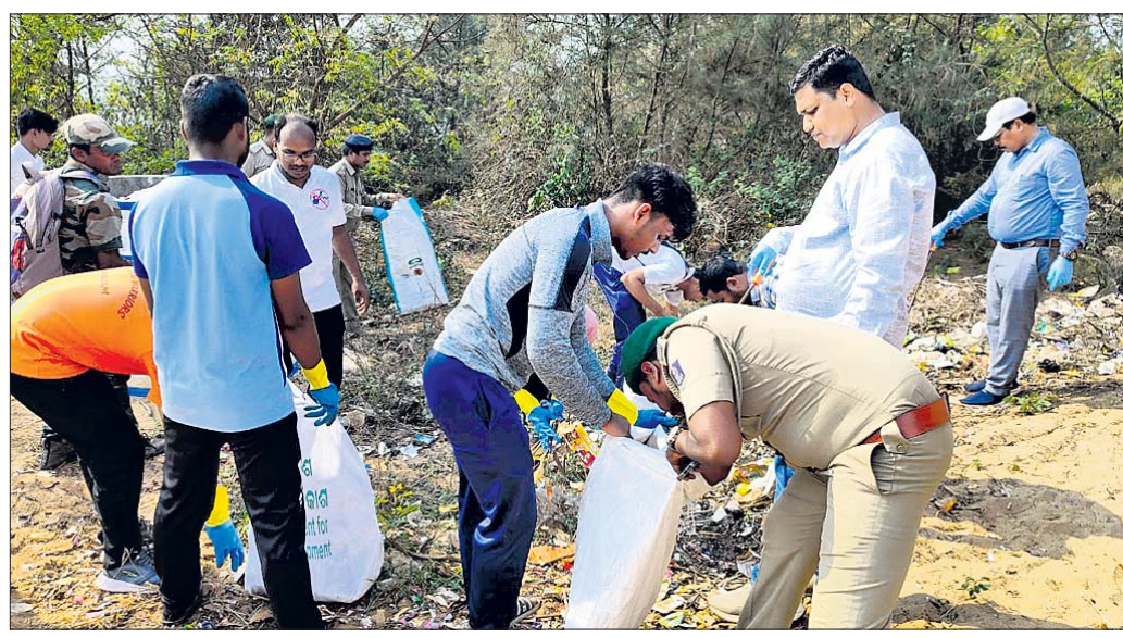
ପ୍ଲାଷ୍ଟିକ ସଂଗ୍ରହ କରାଯାଉଛି।

ପୃଥିବୀର ବିଭିନ୍ନ ପରିବେଶଜନିତ ସମସ୍ୟା ବିଷୟରେ ଜନସାଧାରଣଙ୍କୁ ଅବଗତ କରାଇବା ଓ ସମସ୍ୟା ସମାଧାନ ଦିଗରେ ଚିନ୍ତା କରିବା ସକାଶେ ପ୍ରତିବର୍ଷ ଏପ୍ରିଲ ୨୨ ତାରିଖକୁ 'ଧୂଳିଆ ଦିବସ' ରୂପେ ପାଳନ କରାଯାଉଛି। ଏବେ ପରିବେଶର ମୁଖ୍ୟ ଶତ୍ରୁ ଭାବେ ଉଭା ହୋଇଛି ପ୍ଲାଷ୍ଟିକ। ଚଳିତବର୍ଷ ଧୂଳିଆ ଦିବସର ଶୀର୍ଷକ ରହିଛି 'ଗ୍ରହ ବନାମ ପ୍ଲାଷ୍ଟିକ'।