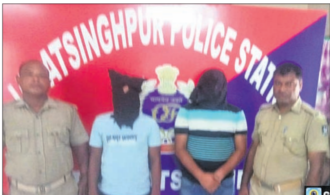
ପୋଲିସ ସହ ଗିରଫ ଅଭିଯୁକ୍ତ।

କରଦିବିହପୁର ଜିଲାର ମହାନଦୀ, ଦେବୀ ନଦୀରୁ ପ୍ରତ୍ୟହ ଶତାଧିକ ଟ୍ରେପ ବାଲି ଚୋରା ଚାଲିଛି ହେଉଛି। ବାଲି ଚୋରା ଚାଲିଶକାରୀଙ୍କ ମଧ୍ୟରୁ କେତେକଙ୍କ ନିର୍ଦ୍ଦେଶ ଦେଇ ବେଆଇନ ଭାବେ ବାଲି ଗଢ଼ିତ ରଖି ମନଇଚ୍ଛା ଦରରେ ବିକ୍ରି କରୁଛନ୍ତି। ଏହାର ଦୁଷ୍ପ୍ରାଣ ଗତ ୧୧ ତାରିଖରେ କରଦିବିହପୁର ଥାନା ଅନ୍ତର୍ଗତ ଆଦିପିଙ୍ଗଳ ନିକଟ କାଠୁଆପାଟଣାସ୍ଥିତ ଏକ ଜଙ୍ଗଲିଆ ଗ୍ରାମରେ ଦେଖିବାକୁ ମିଳିଥିଲା। ବିଶେଷସୂତ୍ରରୁ ଖବରପାଇ କରଦିବିହପୁର ଥାନା ପକ୍ଷରୁ ଅତୀତ ଚଢ଼ାଇ ପରେ ୩ଟି ହାଲୋ ଓ ଗୋଟିଏ ଜେସିବି ଜବତ କରାଯାଇଥିଲା। ଏ ସମ୍ପର୍କରେ ଏସ୍ଆଇ ଚିନ୍ମୟ ପ୍ରକାଶ ପୃଷ୍ଟୁଙ୍କ ଅଭିଯୋଗ ଆଧାରରେ, ୧୨ ତାରିଖରେ ମାମଲା (ନଂ.୩୪୫/୨୪)