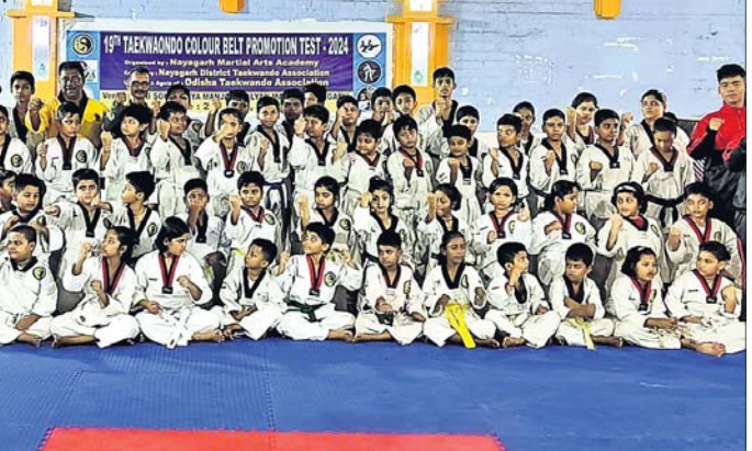
ପ୍ରଶିକ୍ଷକ ଶିବିରରେ ଯୋଗଦେଇଥିବା ଛାତ୍ରଛାତ୍ରୀ ।