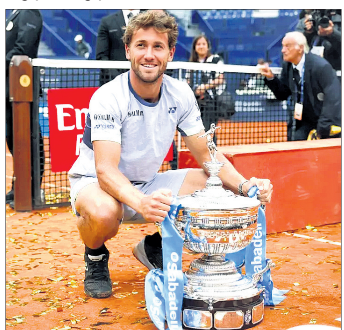
ଟ୍ରଫି ସହ କାନ୍ଧର ରୁଡ଼୍