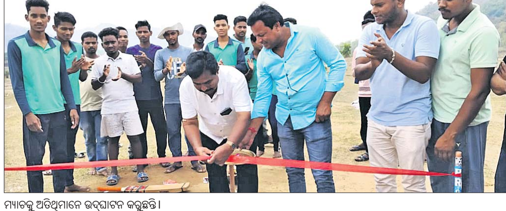
ମ୍ୟାଚକୁ ଅତିଥିମାନେ ଉଦ୍‌ଘାଟନ କରୁଛନ୍ତି।

ଉଞ୍ଜନଗର, ୨୨୧୪ (ବାବୁଲ୍ଲା ପ୍ରଧାନ): ଉଞ୍ଜନଗର ବ୍ଲକ ରାଜଗୋଛାରେ ମା' ଶୁକାବତୀ କ୍ରିକେଟ ଟୁର୍ଣ୍ଣାମେଣ୍ଟ ଉଦ୍‌ଘାଟିତ ହୋଇଯାଇଛି।