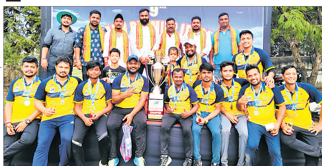
ରଘୁଲଗଡ଼ ପ୍ରିମିୟର ଲିଗ୍ ଚାମ୍ପିୟନ ବ୍ରହ୍ମେଶ୍ୱର ଏକାଦଶ ଦଳର ଖେଳାଳିମାନେ ଟ୍ରଫି ସହ ଅତିଥିଙ୍କ ଗହଣରେ।