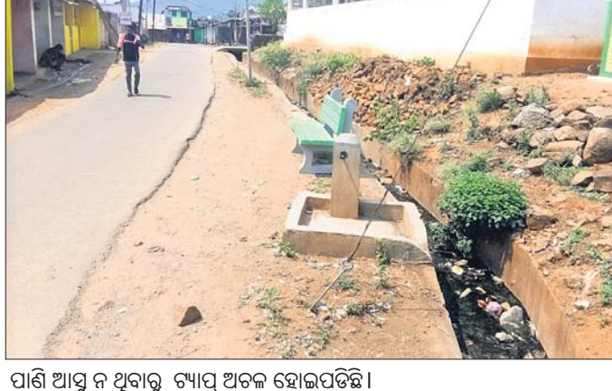
ପାଣି ଆସୁ ନ ଥିବାରୁ ଟ୍ୟାପ୍ ଅଟଳ ହୋଇପଡ଼ିଛି।

ଗଜପତି ଜିଲ୍ଲା ନୂଆଗଡ଼ ବ୍ଲକ ଅନ୍ତର୍ଗତ ଖ ଝାଲରସିଂ ପଞ୍ଚାୟତର ଆଦିବାସୀ ଅଧିକାଂଶ ଖ ଝାଲରସିଂ ଗ୍ରାମବାସୀ ଦୀର୍ଘବର୍ଷ ହେଲା ପାଣି ପାଇଁ ଡହଳବିକଳ ହେଉଛନ୍ତି।