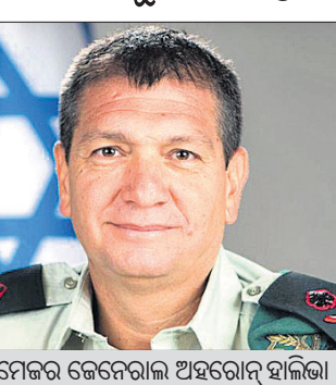
ମେଜର ଜେନେରାଲ ଅହରୋନ୍ ହାଲିଲ

ଜେନେରାଲ, ୨୨୧୪: ଗତବର୍ଷ ଅକ୍ଟୋବର ୭ରେ ହମାସ୍ ଆତଙ୍କବାଦୀମାନେ ଇସ୍ତାଫା ଉପରେ ଅତ୍ୟନ୍ତ ଆକ୍ରମଣ କରିଥିଲେ। ଏନେଇ ପୂର୍ବରୁ ଗୋଇନ୍ଦା ବିଭାଗ ସତର୍କ କରାଯାଇଥିଲା। ଏଥିପାଇଁ ନୈତିକତା ଦୃଷ୍ଟିରୁ ନିଜକୁ ଦାୟୀ କରି ଇସ୍ତାଫା ଦେବାର ଗୋଇନ୍ଦା ମୁଖ୍ୟ ପଦରୁ ମେଜର ଜେନେରାଲ ଅହରୋନ୍ ହାଲିଲ ଯୋଗଦାନ ଇସ୍ତାଫା ଦେଇଛନ୍ତି। ହାଲିଲ ହେଉଛନ୍ତି ଇସ୍ତାଫା ଦେବାର ପ୍ରଥମ ଜେନେରାଲ ଯେ ଗୋଇନ୍ଦା ବିଦଳତା ପାଇଁ ପଦବୀ ଛାଡ଼ିଛନ୍ତି। ହମାସ୍ ଆକ୍ରମଣ ସମ୍ପର୍କରେ ଇସ୍ତାଫା ନିକଟରେ କୌଣସି ପୂର୍ବ ସୂଚନା ନ ଥିଲା। ଫଳରେ ହମାସ୍ ବିଦ୍ରୋହୀମାନେ ଇସ୍ତାଫାରେ ପଶି ୧,୨୦୦ ଲୋକଙ୍କୁ ମାରିବା ସହ ଅନେକଙ୍କୁ ପକ୍ଷାନ୍ତ କରିନେଇଥିଲେ। ଏହାର ପ୍ରତିଶୋଧ ନେବା ଓ ହମାସ୍‌କୁ ମୂଳପୋଛ କରିଦେବା ପାଇଁ ଇସ୍ତାଫା ଗାଳ୍ପ ଉପରେ ଆକ୍ରମଣ କରି ରହିଛି।