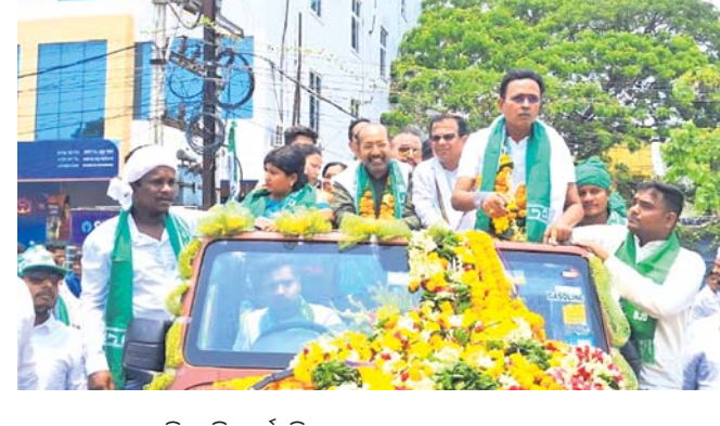
ଶୋଭାଯାତ୍ରାରେ ବିଜେଡି ପ୍ରାର୍ଥୀ ବିପ୍ଳବ ।

ଗଜପତି ଜିଲ୍ଲା ମୋହନା ବ୍ଲକ ଦମାପୁଆ ସରକାରୀ ବାଳିକା ଆଶ୍ରମ ବିଦ୍ୟାଳୟରେ ଗରମ ଡାଲିରେ ପଡ଼ି ଜଣେ ଶିଶୁକନ୍ୟା ଗୁରୁତର ହୋଇଥିଲେ।