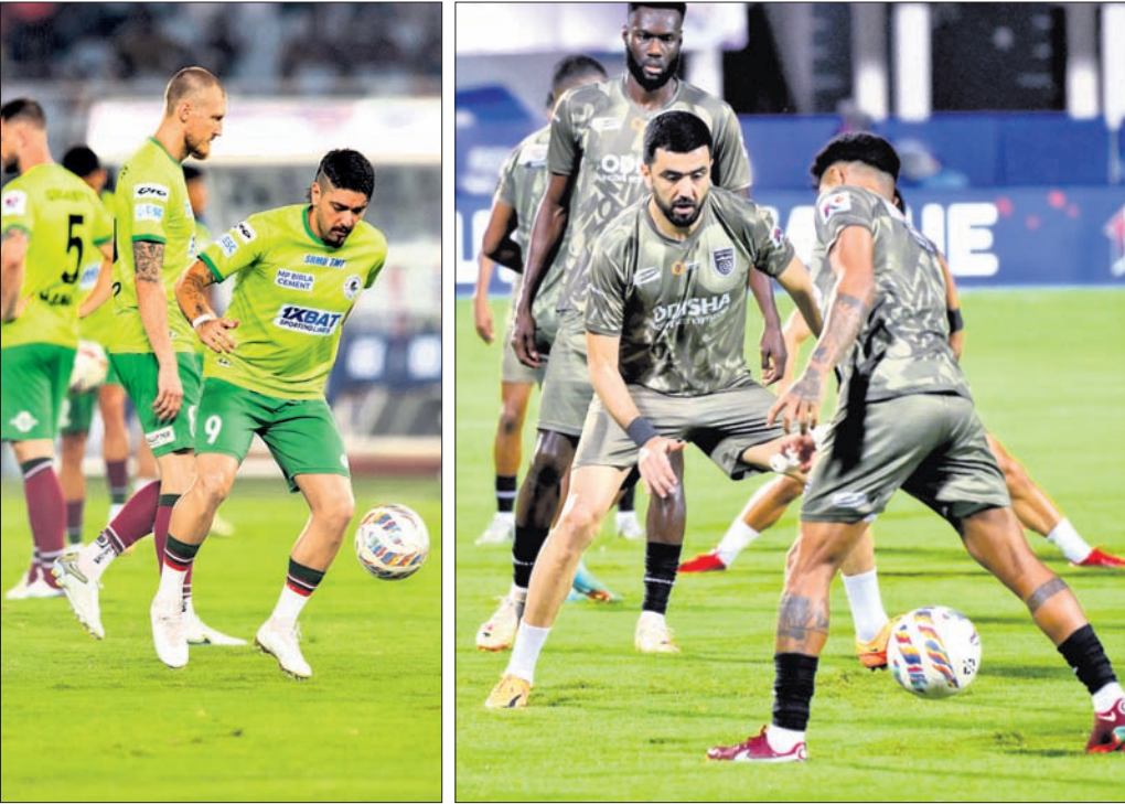
ମୋହନ ବାଗାନ ପୁଅର କାଏବ୍ ଓ ଓଡ଼ିଶା ଏଫ୍ସି ଦଳର ଖେଳାଳିଙ୍କ ଅଭ୍ୟାସ।

ବେଙ୍ଗାଳୁରୁ ଏଫ୍ସି କାରୁୟାରୀ ୨୦୧୮ରୁ ନଭେମ୍ବର ୨୦୧୯ ମଧ୍ୟରେ ସର୍ବାଧିକ ୧୯ଟି ମ୍ୟାଚରେ ଘରୋଇ ପରିବେଶରେ ଅପରାଜେୟ ରହି ଓଡ଼ିଶା ଏଫ୍ସିଠାରୁ ଆଗରେ ରହିଛି। ମୋହନ ବାଗାନ ପୁଅର କାଏବ୍ ୨୨ ଲିଟ୍ ମ୍ୟାଚରେ ୪୭ଟି ଗୋଲ ଖେଳିଛନ୍ତି। ଏହା ଅନ୍ୟ ଦଳଗୁଡ଼ିକ ପାଇଁ ସତର୍କ ଘଣ୍ଟି ସଦୃଶ ହୋଇଛି। ତେଣୁ ଓଡ଼ିଶା ଏଫ୍ସିକୁ ଆଗାମୀ ମ୍ୟାଚ ସତର୍କତା ସହ ଖେଳିବାକୁ ପଡ଼ିବ। କାରଣ ଇତିହାସ ସେଖିଲେ ମୋହନ ବାଗାନ ବିପକ୍ଷରେ ଓଡ଼ିଶା ଏଫ୍ସିର ଉତ୍ତରାଧିକାରୀ ଭାବେ ଉଭୟ ଦଳ ନିଜ ଦମ୍ଭତା ଦେଖାଇଥିଲା। ଘରୋଇ ପରିବେଶରେ ଅନୁଷ୍ଠିତ ବିତାଣୀ ମୁକାବିଲା ମଧ୍ୟ ଗୋଲଶୂନ୍ୟ ହୁଏ ରହିଥିଲା। ତେଣୁ ଆଗାମୀ ମୁକାବିଲା ବେଶ୍ ଶୀର୍ଷକ ହେବା ଆଶା କରାଯାଉଛି। ଚେନ୍ନାଇ ଶୀର୍ଷକ ରହି ମୋହନ ବାଗାନ ଚଳିତବର୍ଷର ଶିଳ୍ପ ବିଜେତା ହୋଇଛି। ଅନ୍ୟପକ୍ଷରେ ଓଡ଼ିଶା ଏଫ୍ସି କେବଳ ବ୍ଲାସ୍‌ସ୍‌ପ୍ଲସ୍ ୨-୧ ଗୋଲରେ ହରାଇ ଆଗାମୀ ବଡ଼ ମୁକାବିଲାରେ