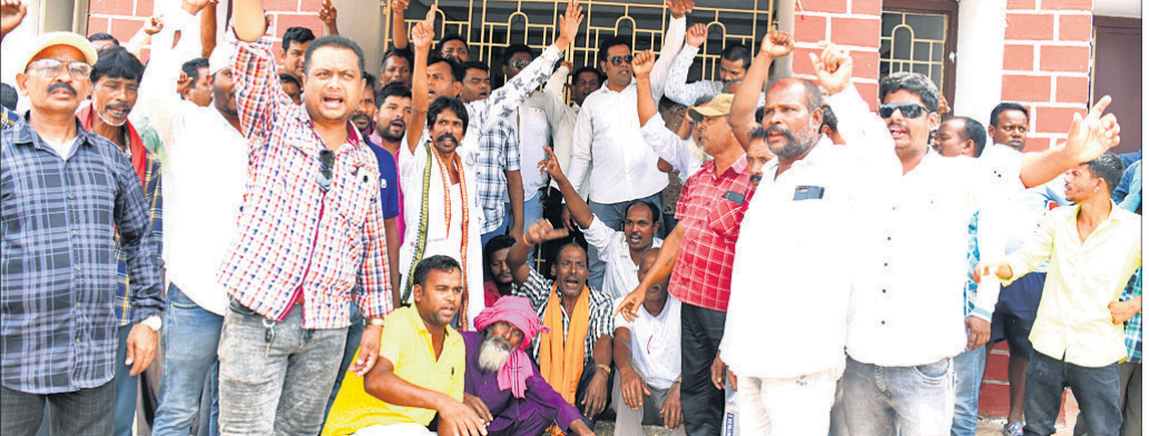
ରାଜ୍ୟ କଂଗ୍ରେସ କାର୍ଯ୍ୟାଳୟଠାରେ ଚିକେଟ ବନ୍ଧନକୁ ନେଇ ଅସନ୍ତୁଷ୍ଟ କର୍ମୀମାନେ ହୋହଲ୍ଲା କରୁଛନ୍ତି ।