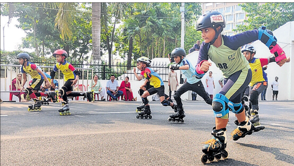
ଓଡ଼ିଶା ରୋଲର ସେକ୍ଟିଓ ଚାମ୍ପିୟନଶିପ୍ ଅବସରରେ ପ୍ରତିଯୋଗୀମାନେ।

କର୍ମଳ, ୨୨୧୪ (ଏସି): ସେପ୍ଟେମ୍ବରରେ ଦଳିକଠାରେ ଲାଭର କପ୍ ଖେଳିବେ ଗୋପାଳ ନାଡ଼ାଲ ଯୋଗବାର ପ୍ରକାଶ କରିଛନ୍ତି। ୨୨୨ର ଗ୍ରାଣ୍ଡସ୍ଲାମ ବିଜେତାଙ୍କର ଏହା ଅନ୍ୟତମ ଶେଷ ଟୁର୍ନାମେଣ୍ଟ ହେବ। ନାଡ଼ାଲ ପୂର୍ବରୁ ପୁରୀର ଦେଇ ସାରିଛନ୍ତି ଯେ, ୨୦୨୪ ରୁଁରେ ତାଙ୍କର ଶେଷ ବର୍ଷ ହେବ। ଗତ ସପ୍ତାହରେ ବାରିଲୋନାରେ ବିତାଣୀ ରାଉଣ୍ଡ ମ୍ୟାଚରେ ସେ ଆଲୋକ୍ଷି ଟି ମିନାଉରକଠାରୁ ହାରିଯାଇଥିଲେ, ଯେଉଁଠାରେ କି ସେ ୧୨୨ର ଗାଇଟଲ ବିଜୟ ହୋଇଥିଲେ। ସେତେବେଳେ ସେ ସେଠାରେ କହିଥିଲେ ସମ୍ଭବତଃ ଏଠାରେ ଏହା ହେଉଛି ତାଙ୍କର ଶେଷ ମ୍ୟାଚ। ୩୭ ବର୍ଷୀୟ ସାରିଶ ସ୍ତ୍ୟା ବହୁନିନ ହେଲା ଆଫାଟକନିତ ସମସ୍ୟା ସହ ସଂଗ୍ରହ କରିଆସୁଛନ୍ତି।