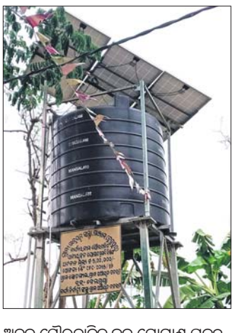
ଅଟଳ ସୌରଚାଳିତ ଜଳ ଯୋଗାଣ ପ୍ରକଳ୍ପ ତରଳତା ପଞ୍ଚାୟତର ସୋଡ଼ାଜାଲ

ବେଲଗୁଣ୍ଡା, ୨୨୧୪ (କୃଷ୍ଣ ଚନ୍ଦ୍ର ପଟ୍ଟନାୟକ): ପ୍ରବଳ ଗ୍ରୀଷ୍ମପ୍ରବାହ ସମୟରେ ଅସହ୍ୟ ଜଳପାତ୍ରରେ ଦହଗଞ୍ଜା ହେଉଛନ୍ତି ବେଲଗୁଣ୍ଡା ବ୍ଲକ ସୋଡ଼ାଜାଲ ଗ୍ରାମର ଚାରିଶହ ବାସିନ୍ଦା।