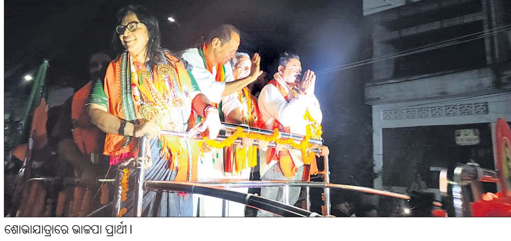
ଶୋଭାଯାତ୍ରାରେ ଭାଜପା ପ୍ରାର୍ଥୀ।

ବେଲଗୁଣ୍ଡା, ୨୨୧୪ (କୃଷ୍ଣ ଚନ୍ଦ୍ର ପଟ୍ଟନାୟକ): ଗତ ତିନି ଦିନ ତଳେ ବିଜେଡି ପ୍ରଚାର ମଇଳାଦାନରେ ନିଜର ଶକ୍ତି ପ୍ରଦର୍ଶନ କରିଥିବା ବେଳେ ରବିବାର ଭାଜପା ମଧ୍ୟ ନିଜ ଶକ୍ତି ପ୍ରଦର୍ଶନ କରି ପରିବର୍ତ୍ତନ ଆହ୍ୱାନ ଦେଇଛି।