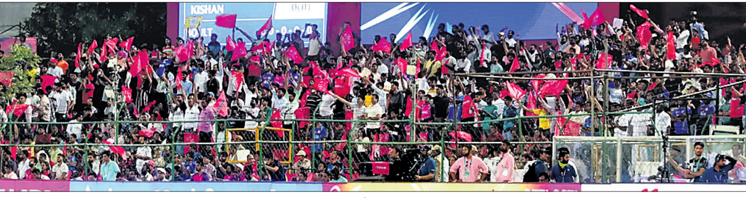
ସୋମବାର ଆଇପିଏଲ୍ ମ୍ୟାଚ୍ ଅବସରରେ ଦର୍ଶକରେ ଭରା କନ୍ୟାପୁରର ସଞ୍ଜୟ ମାନସି ସ୍ମୃତିପତ୍ର।