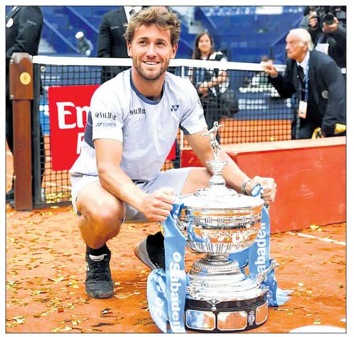
ଟ୍ରଫି ସହ କ୍ୟାମ୍ପର ରୁଡ଼୍