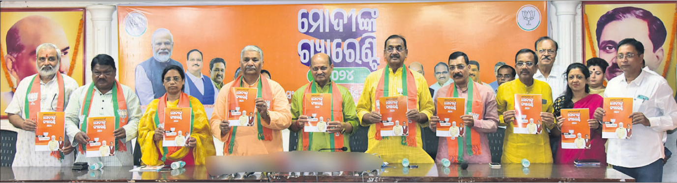
ଭାଜପା ରାଜ୍ୟ କାର୍ଯ୍ୟାଳୟଠାରେ ଯୋଗଦାନ 'ଭାଜପା ସଂକଳ୍ପ ପତ୍ର-୨୦୨୪' ମୋଦିଙ୍କ ଗ୍ୟାରେଣ୍ଟି'ର ଓଡ଼ିଆ ସଂସ୍କରଣକୁ ଦଳୀୟ ବରିଷ୍ଠ ନେତୃତ୍ୱ ଉନ୍ମୋଚନ କରୁଛନ୍ତି ।