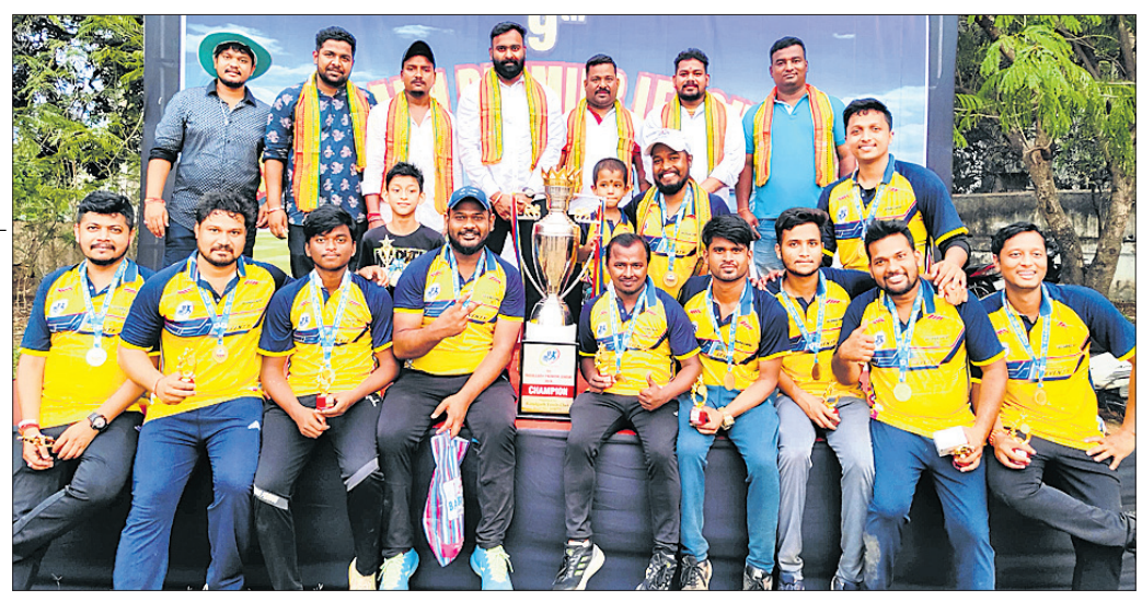
ରଘୁଲଗଡ଼ ପ୍ରିମିୟର ଲିଗ୍ ଚାମ୍ପିୟନ ବ୍ରହ୍ମେଶ୍ୱର ଏକାଦଶ ଦଳର ଖେଳାଳିମାନେ ଟ୍ରଫି ସହ ଅତିଥିଙ୍କ ଗହଣରେ।

ଭୁବନେଶ୍ୱର, ୨୨୧୪ (ତପନ ସାହୁ) ରଘୁଲଗଡ଼ ପ୍ରିମିୟର ଲିଗ୍‌ର ୯ମ ସଂସ୍କରଣ ଉଦ୍‌ଘାଟିତ ହୋଇଛି। ରଘୁଲଗଡ଼ ସ୍ଥଳ କ୍ଲବ ଆନୁକୁଲ୍ୟରେ ଆୟୋଜିତ ଏହି ଟୁର୍ନାମେଣ୍ଟରେ ବ୍ରହ୍ମେଶ୍ୱର ଏକାଦଶ ଚାମ୍ପିୟନ ହୋଇଛି। ଫାଇନାଲରେ ମା' ଚାମ୍ପିୟନ ଟ୍ରଫି ଏକାଦଶକୁ ପରାସ୍ତ କରିଛି। ଟ୍ରେ ହାରି ବ୍ୟାଟି ଆମାନ୍ତ୍ରଣ ପାଇଥିବା କ୍ରମ ମା' ଚାମ୍ପିୟନ ୧୨ ଓଜନରେ ୧୪୧ ରନ କରି ଅଲଆଉଟ ହୋଇଯାଇଥିଲା। ଦଳ ପକ୍ଷରୁ ଉପାକାନ୍ତ ଜଗଦେବ ୨୫ ବଲ୍‌ରୁ ସର୍ବାଧିକ ୫୩ ରନ କରିଥିଲେ। ବିପକ୍ଷ ଦଳର