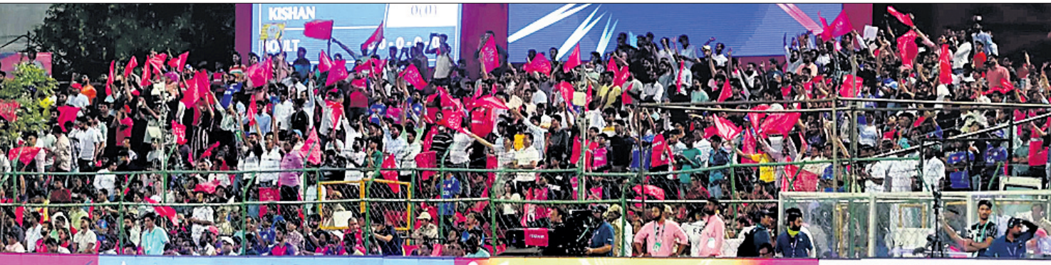
ସୋମବାର ଆଇପିଏଲ୍ ମ୍ୟାଚ୍ ଅବସରରେ ଦର୍ଶକରେ ଭରା ଜୟପୁରର ସଞ୍ଜୁ ମାନସି ସ୍ମୃତିୟମ।

ନ୍ୟୁଦିଲ୍ହା, ୨୨୧୪ (ପି.ଟି.) ଇଣ୍ଡିଆନ ପ୍ରିମିୟର ଲିଗ୍ (ଆଇପିଏଲ୍) ଆଚରଣବିଧି ଉଲ୍ଲଙ୍ଘନ କରିଥିବା ଅଭିଯୋଗରେ ସ୍ୱାର ବ୍ୟାଟର ରୟାଲ ଟ୍ୟାଲେଣ୍ଟସ୍ ବେଙ୍ଗାଲୁରୁ (ଆରସିବି)ର ବିରାଟ କୋହଲି ଓ ଅଧିନାୟକ ଫାୟ୍ ଭୁପ୍ପେସି ଏବଂ ପଞ୍ଜାବ କିଙ୍ଗ୍ସ ଅଧିନାୟକଙ୍କୁ ସୋମବାର ଜରିମାନା କରାଯାଇଛି। ରବିବାର ଲଡେନ ଗାଡ଼େଟ୍‌ରେ କୋଲକାତା ନାଇଟ ରାଇଡର୍ସ (କେକେଆର) ବିପକ୍ଷରେ ପରାଜୟ ମ୍ୟାଚରେ ହର୍ଷିତ ରାଣାଙ୍କର ଅଧିକ ଉପରକୁ ଟ୍ରାକ୍ ଅନୁସାରେ ଉତ୍ତରକୁ ଯାତ୍ରା କରିଥିଲେ। କୋହଲି ଯଦି ଜିଲ୍ଡରେ ଦିଆ ଛିଡ଼ା ହୋଇଥାନ୍ତେ ତେବେ ବଲ୍ ଅଞ୍ଚଳ ୦.୯୨ ମିଟର ଉଚ୍ଚତାରେ ଯାଇଥାନ୍ତା। କୋହଲି ଅନ୍-ଫିଲ୍ଡ ଆମ୍ପାୟରଙ୍କ ସହ ଆଲୋଚନା କରିବା ପରେ ଅସତ୍ୟାକ୍ଷ ପ୍ରକାଶ କରି ପଡ଼ିଆ ଛାଡ଼ିଥିଲେ। ଅନ୍ୟପକ୍ଷରେ ଟ୍ରେ ଓଭର ରେଟ୍ ପାଇଁ ଭୁପ୍ପେସିଙ୍କୁ ମ୍ୟାଚ ଫିର୍ ୧୨ ପ୍ରତିଶତ ଏବଂ ଅମ୍ପାୟରଙ୍କ ନିଷ୍ପତ୍ତିରେ ଅସହମତି ପ୍ରକାଶ କରିଥିବାରୁ କୁରାନଙ୍କୁ ତାଙ୍କ ମ୍ୟାଚ ଫିର୍ ୫୦ ପ୍ରତିଶତ ଜରିମାନା ହୋଇଛି।