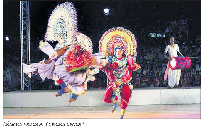
ଓଡ଼ିଶାର ଛଉନୃତ୍ୟ (ଫୋଲ ଫଟୋ)।