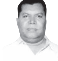
ଧ୍ୟୁତ ଚରଣ ଘିବେଲା

ସତର ପରିଭାଷା ଯଦି ସମାଲୋଚନା, ତେବେ ପିନ୍ଧର ପରିଭାଷା କ'ଣ ହୋଇପାରେ ? ଯାହାକି ଭାଷାରେ ସତ ହୁଏ ସମାଲୋଚନା, ସେଇମାନଙ୍କ ରୂପରେ ପିନ୍ଧ ବୋଧେ ପ୍ରଶଂସାପୂର୍ଣ୍ଣକ ନିଶ୍ଚୟ । ପିନ୍ଧ ସବୁବେଳେ, ସବୁ କାଳେ ମିଠା ବୋଲି ପିନ୍ଧୁଥିବା ରହିଛି ଅନେକାନ୍ତେକ । ପିନ୍ଧ ପୁଷ୍ପିଆ ଥାଏ ଶୁଣିବାରେ । କେବଳ ସାଥି ସାଧନ ପାଇଁ ପିନ୍ଧ ମଜାଳିଆ ଥାଏ କହିବାରେ । ପିନ୍ଧ ପ୍ରଶଂସା କଲେ (ଯିଏ ଯାହା ନୁହେଁ ତାହା ତାଙ୍କ ଆଗେ ଉଦ୍‌ଗୀତକିଲେ ମାନେ କହିଲେ) ତହିଁକୁ ଖୁସି ସାଉଁଟୁଥିବା ଲୋକକୁ ପିନ୍ଧ ପ୍ରଶଂସକ ଗୋଟେ ପାଖେ ପିଠି ଥାଆନ୍ତାଏ, ଅନ୍ୟ ପାଖେ ତୋରକୁ ସାଧୁ କୁହାଗଲେ ସେ ଶୁଣି ପିନ୍ଧ ପୁଷ୍ପି ସାଉଁଟେ । ସାଧୁପିତର ସାଥି ହାତେଇବା ପାଇଁ ପିନ୍ଧ କହନ୍ତି । ପ୍ରଶଂସାକାଳୀନ ପିନ୍ଧ ପ୍ରଶଂସାରେ ଭଲିଯାଇ ଖୁବ୍ ଖୁସି ହୁଏ ପାଆନ୍ତି ପିନ୍ଧ କଥା ଶ୍ରବଣରୁ । ଯେ ପିନ୍ଧ ପ୍ରଶଂସା କରେ ସେ ନିଶ୍ଚୟ । ଆଉ ଯିଏ ପିନ୍ଧ ପ୍ରଶଂସା ଶୁଣି କୁହୁଛନ୍ତୁ ହୁଏ ସିଏ ପିନ୍ଧର ସୌଦାଗର ମାନେ ବଡ଼ ନିଶ୍ଚୟ ।