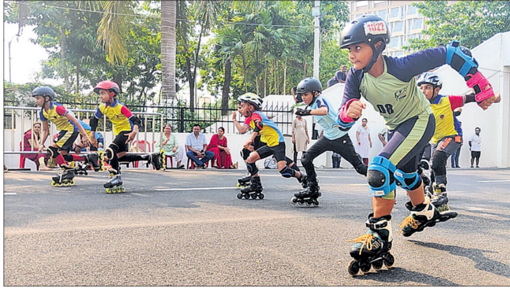
ଓଡ଼ିଶା ରୋଲର ସେକ୍ଟିଓ ଚାମ୍ପିୟନଶିପ୍ ଅବସରରେ ପ୍ରତିଯୋଗୀମାନେ।

ଭୁବନେଶ୍ୱର, ୨୨୧୪ (ଏସି): ସେପ୍ଟେମ୍ବରରେ ଦଳିକଠାରେ ଲାଭର କର୍ମ ଖେଳିବେ ରାଫାଲ ନାଡ଼ାଲ ଯୋଗବାର ପ୍ରକାଶ କରିଛନ୍ତି। ୨୨୨ର ଗ୍ରାଣ୍ଡସ୍ଲାମ ବିଜେତାଙ୍କର ଏହା ଅନ୍ୟତମ ଶେଷ ଟୁର୍ନାମେଣ୍ଟ ହେବ। ନାଡ଼ାଲ ପୂର୍ବରୁ ପୁରୀର ଦେଇ ସାରିଛନ୍ତି ଯେ, ୨୦୨୪ ରୁଁରେ ତାଙ୍କର ଶେଷ ବର୍ଷ ହେବ। ଗତ ସପ୍ତାହରେ ବାର୍ସିଲୋନାରେ ବିତାଣ ରାଉଣ୍ଡ ମ୍ୟାଚରେ ସେ ଆଲୋକ୍ସ ଡି ମିନାଉରଙ୍କଠାରୁ ହାରିଯାଇଥିଲେ, ଯେଉଁଠାରେ କି ସେ ୧୨୧ର ଗାଲଟଲ ବିଜୟ ହୋଇଥିଲେ। ସେତେବେଳେ ସେ ସେଠାରେ କହିଥିଲେ ସମ୍ଭବତଃ ଏଠାରେ ଏହା ହେଉଛି ତାଙ୍କର ଶେଷ ମ୍ୟାଚ। ୩୭ ବର୍ଷୀୟ ହାରିଶ ଷ୍ଟାର ବହୁଦିନ ହେଲା ଆଫାଟକନିଟ ସମସ୍ୟା ସହ ସଂଘର୍ଷ କରିଆସୁଛନ୍ତି।