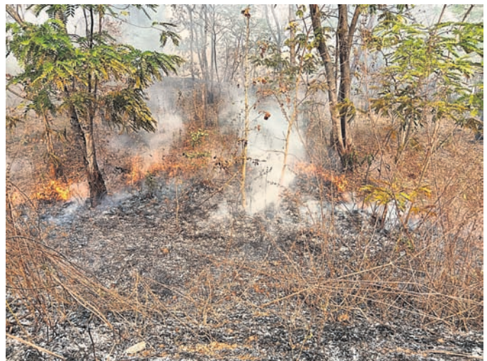
ଜଙ୍ଗଲରେ ଲାଗିଥିବା ନିଆଁ

ବଜରା, ୨୨/୪ (ପରିଷ୍ଠିତ ସାହୁ) ଅନୁଗୋଳ ଜିଲ୍ଲା ଆଠମଲିକା ବ୍ଲକ୍ ଧରାପୋପା ରେଞ୍ଜର ଭଗାମୁଣ୍ଡା ଓ ପୋକଣ୍ଡା ଜଙ୍ଗଲ ଦୁଇଦିନ ହେବ ଜଳୁଛି। ଫଳରେ ସ୍ଥାନୀୟ ଅଞ୍ଚଳର ନିକଟବର୍ତ୍ତୀ ଗ୍ରାମର ବାସିନ୍ଦା ଛାନିଆ ହୋଇପଡ଼ିଛନ୍ତି। ନିଆଁକୁ ଆୟତ୍ତ କରିବାରେ ବନବିଭାଗ ସମ୍ପୂର୍ଣ୍ଣ ବିଫଳ ହୋଇଛି। ଫଳରେ ଜଙ୍ଗଲ ଧ୍ୟୁସ ପାଇଯିବା ଆଶଙ୍କା ଦେଖାଯାଇଛି। ଏ ନେଇ ବାରମ୍ବାର ସ୍ଥାନୀୟ ଗ୍ରାମବାସୀ ଧରାପୋପା ବନବିଭାଗକୁ ସୂଚନା ଦେଇଥିଲେ ମଧ୍ୟ ନିଆଁକୁ ଲିଭାଇବାରେ ବନବିଭାଗ କୌଣସି ପଦକ୍ଷେପ ନେଇ ନ ଥିବା ଯୋଗୁଁ ସୋମବାର ପୋକଣ୍ଡା ଗ୍ରାମବାସୀ ଅନୁଗୋଳ ଜିଲ୍ଲାପାଳଙ୍କଠାରେ ଅଭିଯୋଗପତ୍ର ମାଧ୍ୟମରେ ଅବଗତ କରାଇଛନ୍ତି।