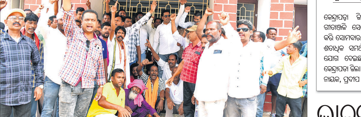
ରାଜ୍ୟ କଂଗ୍ରେସ କାର୍ଯ୍ୟାଳୟଠାରେ ଚିକେଟ ବନ୍ଧନକୁ ନେଇ ଅସନ୍ତୋଷ କର୍ମୀମାନେ ହୋଇଛନ୍ତି କରୁଛନ୍ତି ।