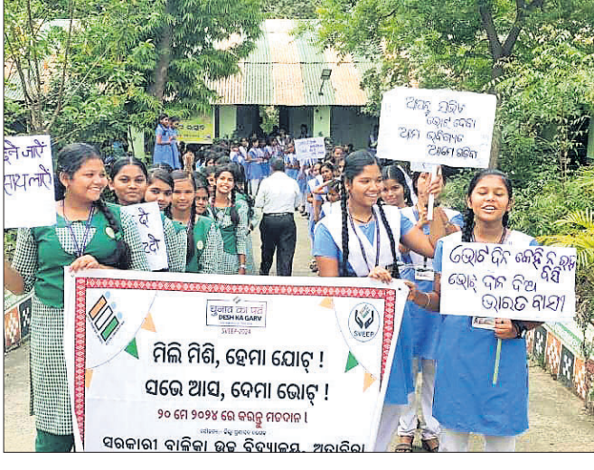
ଅତୀତରା ବାଲିକା ହାଇସ୍କୁଲ ଛାତ୍ରାଛାତ୍ରୀଙ୍କ ସହଯୋଗରେ ଶିକ୍ଷାମାତ୍ରା ।