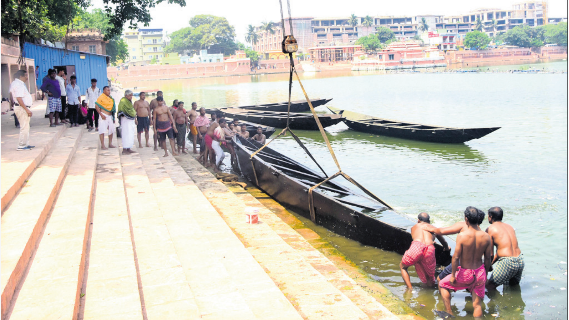
ଚୈତ୍ର ପୂର୍ଣ୍ଣିମାରେ ଆସନ୍ତା ଚନ୍ଦନ ଯାତ୍ରା ପାଇଁ ପୁରୀ ନରେନ୍ଦ୍ର ପୁଞ୍ଜିରେ ବୁଢ଼ାଲ ରଖାଯାଇଥିବା ଡଙ୍ଗାଗୁଡ଼ିକୁ ଭୋଇ ସେବକମାନେ ବାହାର କରୁଛନ୍ତି।

ବିମାନରେ ୧୩ ବର୍ଷରୁ କମ୍ ବୟସର ପିଲାମାନେ ଯେପରି ସେମାନଙ୍କ ମାଆବାପା କିମ୍ବା ଅଭିଭାବକଙ୍କ ପାଖରେ ବସନ୍ତି, ତାହା ସୁନିଶ୍ଚିତ କରିବାକୁ ବେସାମରିକ ବିମାନ ଚଳାଚଳ ମହାନିର୍ଦ୍ଦେଶାଳୟ (ଡିକିଏଏ) ଏୟାରଲାଇନ୍‌ଗୁଡ଼ିକୁ ନିର୍ଦ୍ଦେଶ ଦେଇଛି। ଅନେକ ସମୟରେ ଛୋଟ ପିଲା ସେମାନଙ୍କ ଅଭିଭାବକଙ୍କ ପାଖରେ ବସି ନ ଥିବା ନିଶ୍ଚୟ ଆସିବା ପରେ ଡିକିଏଏ ପକ୍ଷରୁ ଉପରୋକ୍ତ ନିର୍ଦ୍ଦେଶନାମା ଜାରି ହୋଇଛି। ଉକ୍ତ ନିର୍ଦ୍ଦେଶନାମା ଅନୁଯାୟୀ ୧୨ ବର୍ଷ ବୟସ ପର୍ଯ୍ୟନ୍ତ ଯେଉଁ ପିଲା ସେମାନଙ୍କ ମାଆବାପା କିମ୍ବା ଅଭିଭାବକଙ୍କ ମଧ୍ୟରୁ ଜଣକ ସହ ସମାନ ପିଏନଆର୍ (ପାସେଞ୍ଜର ନେମ୍ ରେକର୍ଡ)ରେ ଯାତ୍ରା କରୁଥିଲେ, ସେମାନଙ୍କୁ ସିଏ ମଞ୍ଜୁର କରାଯିବ ଏବଂ ଏହାର ରେକର୍ଡ ରଖାଯିବ ବୋଲି ଡିକିଏଏ ପ୍ରେସ୍ ନୋଟ୍‌ରେ କୁହାଯାଇଛି। ସଂଗଠିତ ଏୟାର ଟ୍ରାନ୍ସପୋର୍ଟ ସର୍କ୍ଯୁଲାର ଅନୁଯାୟୀ ବିମା ବ୍ୟାଗେଜ୍, ପସନ୍ଦ ଅନୁଯାୟୀ ସିଏ ବ୍ୟବସ୍ଥା, ଖାଦ୍ୟ/ସ୍ନାକ୍ସ/ପାନାୟ ଦେଇ, ଓ ଯୁକ୍ତିକାଳ ଉପକରଣ ପରିବହନ ଆଦି ସେବା ଦେଇଥିବା ଅନୁମତି ଦିଆଯାଇଛି।