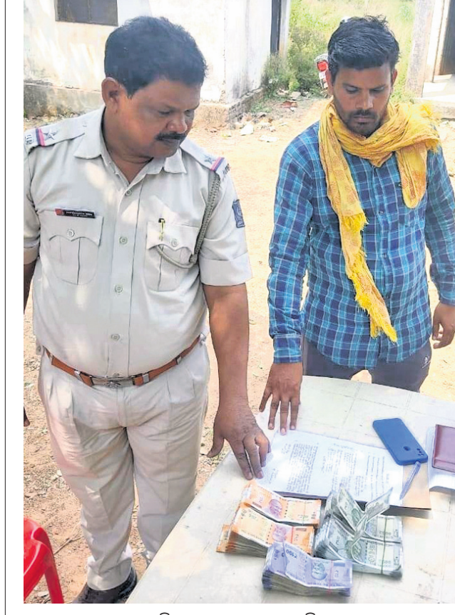
ପୋଲିସ୍ ଜବତ ଟଙ୍କା ଦେଖାଉଛି।

ବରଗଡ଼, ୨୩୪(ପ୍ରମାଣ୍ୟ ଖମାରୀ) ଦିଗରେ ପୋଲିସ୍ ଅଧିକ ତଦନ୍ତ ବରଗଡ଼ ଜିଲ୍ଲା ଅଧ୍ୟାୟୋଗୀ ଥାନା ପୋଲିସ୍ ମଙ୍ଗଳବାର ଛତିଶଗଡ଼ ସୀମାନ୍ତ ରୁଡିବା ନାକାପୋଷ୍ଟରେ ଯାତ୍ରାବେଳେ ୧ ଲକ୍ଷ ୫୦ହଜାର ଟଙ୍କା ଜବତ କରିଛି।