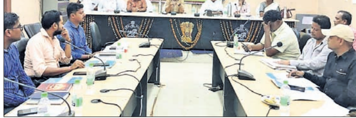
ସାଧୁ ଭୋଟ ଗ୍ରହଣ ପୂର୍ବ ଦିନର କାର୍ଯ୍ୟ କ'ଣ ରହିବ ଏବଂ ମତଦାନ ଦିନରେ ସେକ୍ଟର କ'ଣ କାର୍ଯ୍ୟ ରହିବ ସେ ସମ୍ପର୍କରେ ତାଲିମ ପ୍ରଦାନ କରିଥିଲେ।