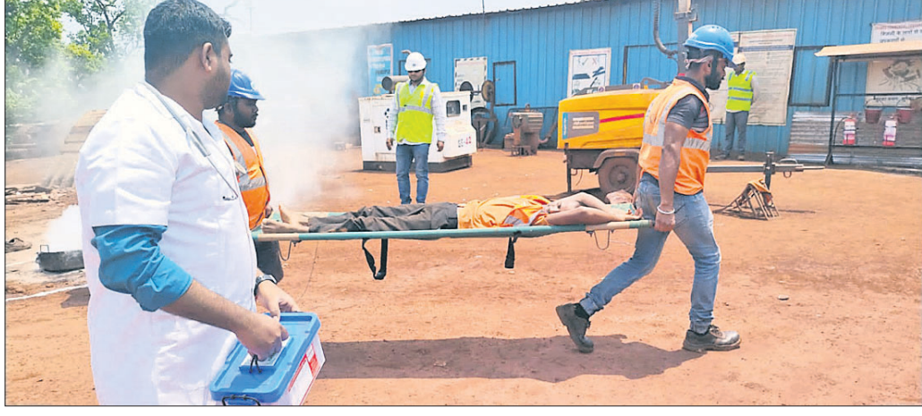
ଅଗ୍ନିସେବା ସପ୍ତାହ ପାଇଁ ମକଡୁଲ ପ୍ରଦର୍ଶନ।

ରାଉରକେଲା, ୨୩୪(ବିପ୍ଳବ ରଞ୍ଜନ ଦାଶ) ପ୍ରଥମ ଥର ପାଇଁ ଆର୍ୟସପି ଅଧିନୀୟ ଓଡ଼ିଶା ଗୁପ୍ତ ଅଫ୍ ମାଇନ୍ସ ଦ୍ୱାରା ଚେକ୍‌ପା ବୁକ୍‌ରେ ଅଗ୍ନିସେବା ସପ୍ତାହ ପାଳିତ ହୋଇଯାଇଛି। କାର୍ଯ୍ୟକ୍ରମ ଉପଯୋଗୀ ସମାବେଶରେ (ବିଆଇଏମ୍-ଟିଆଇଏମ୍ ଓ କେଆଇଏମ୍)ର ଜିଏମ୍ ଜନସାଧାରଣ ଚଳକ ପଠକମାନଙ୍କ ଅଧିକାରୀ କରିଥିଲେ। ଆର୍ୟସପି ଭାରପ୍ରାପ୍ତ ନିର୍ଦ୍ଦେଶକ ଅଟନ୍ତୁ