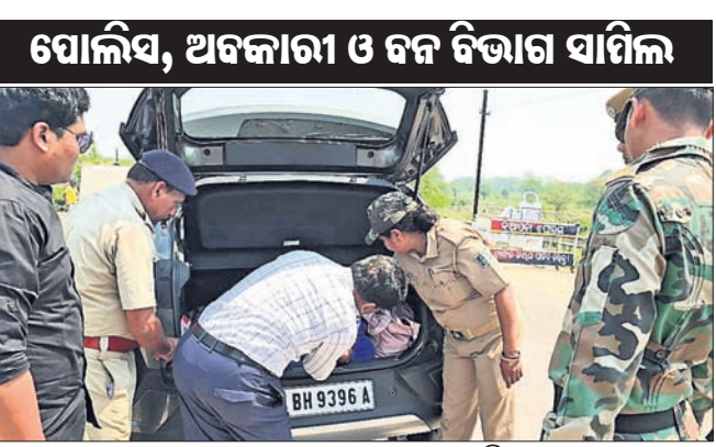
ତନଖୁ ଫାଟକରେ ଯାତ୍ରା କରାଯାଉଛି।

ସାଜିମାନ ପ୍ରତି କୁଠାରାଯାତ। ରାଜ୍ୟର ବିତୀୟ ରାଜଧାନୀ ତଥା ପଶ୍ଚିମ ଓଡ଼ିଶା ପ୍ରାଣକେନ୍ଦ୍ର କୁହାଯାଉଥିବା ସମ୍ବଲପୁରର ସାଜିମାନକୁ ବିଜେଡି ପକ୍ଷରୁ ଅଣଦେଖା କରାଯାଇଛି।