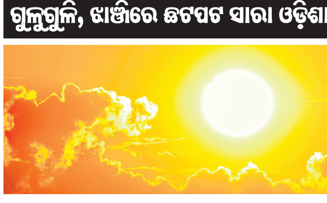
ଗୁଲୁଗୁଲି, ଝାଞ୍ଜିରେ ଛଟପଟ ସାରା ଓଡ଼ିଶା

ଭୁବନେଶ୍ୱର, ୨୩୪ (ଅସମାପିତା ସାହୁ) ରାଜ୍ୟରେ ଅସହ୍ୟ ଗ୍ରୀଷ୍ମ ପ୍ରବାହ ଚାଲି ରହିଛି। ଗରମରେ ସାରା ରାଜ୍ୟ ଛଟପଟ ହେଉଛି।