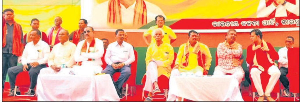
ମିଶ୍ରଣ ପର୍ବରେ କେନ୍ଦ୍ର ମନ୍ତ୍ରୀ ଧର୍ମେନ୍ଦ୍ର ପ୍ରଧାନଙ୍କ ସହ ଅନ୍ୟମାନେ।