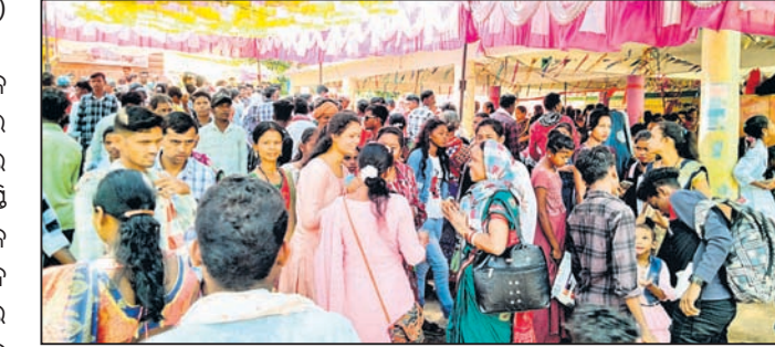
ମହୋତ୍ସବରେ ଶ୍ରଦ୍ଧାଳୁଙ୍କ ସମାଗମ ।

କୋକସରା,୨୩୪ (ପୁଷ୍ପକ କୁମାର ପାଟଣୋଶୀ) କଳାହାଣ୍ଡି ଜିଲା କୋକସରା ବ୍ଲକ ତୁରୁକାଠେଣା ପଞ୍ଚାୟତ ସାହାକଖୋଲ ଜଙ୍ଗଲର ପ୍ରାକୃତିକ ପରିବେଶ ମଧ୍ୟରେ ରହିଛି ପର୍ଯ୍ୟଟନସ୍ଥଳୀ ଗୁଡ଼ହାଣ୍ଡି ଡୋକରାହାଲ । ପୌରାଣିକ କଥା ବହନ କରୁଥିବା ଏହି ସ୍ଥାନ ମଧୁମାଧବ ଚାର୍ଯ୍ୟକ୍ଷେତ୍ର ନାମରେ ପରିଚିତ । ଏଠାରେ ଗତ ୧୬ ତାରିଖରୁ ଚାଲିଥିବା ଶ୍ରୀରାମ ନବମୀ ମହୋତ୍ସବ ମଙ୍ଗଳବାର ଉଦ୍‌ଘାଟିତ ହୋଇଯାଇଛି । ସପ୍ତାହବ୍ୟାପୀ ଶ୍ରୀରାମ ନାମରେ ଭକ୍ତ ଓ ଗ୍ରାମବାସୀ ସାମିଲ ହୋଇଥିଲେ ।