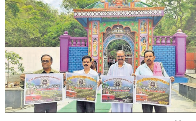
ପାଇକମାଳ, ୨୩।୪ (ବଡ଼ ଶତପଥୀ)

ପଞ୍ଚା, ବୈଶାଖ ମେଳା କମିଟି ସଦସ୍ୟ ବରଗଡ଼ ଜିଲ୍ଲା ପାଇକମାଳ ନୃସିଂହନାଥରେ ଆସନ୍ତା ମେ ୧୯ରୁ ୨୩ ତାରିଖ ପର୍ଯ୍ୟନ୍ତ ୫ ଦିନ ଧରି ଶ୍ରୀ ନୃସିଂହନାଥ ମହାପ୍ରଭୁଙ୍କ ଜନ୍ମୋତ୍ସବ ପ୍ରସ୍ତୁତ ହେବାକୁ ଯାଉଛି । ଏଥି ପାଇଁ ମଙ୍ଗଳବାର ତଥା ପ୍ରସିଦ୍ଧ ବୈଶାଖ ମେଳା ଅନୁଷ୍ଠିତ ହେବାକୁ ଯାଉଛି । ଏଥି ପାଇଁ ମଙ୍ଗଳବାର ତଥା ପ୍ରସିଦ୍ଧ ବୈଶାଖ ମେଳା ଅନୁଷ୍ଠିତ ହେବାକୁ ଯାଉଛି । ଏଥି ପାଇଁ ମଙ୍ଗଳବାର ତଥା ପ୍ରସିଦ୍ଧ ବୈଶାଖ ମେଳା ଅନୁଷ୍ଠିତ ହେବାକୁ ଯାଉଛି । ଏଥି ପାଇଁ ମଙ୍ଗଳବାର ତଥା ପ୍ରସିଦ୍ଧ ବୈଶାଖ ମେଳା ଅନୁଷ୍ଠିତ ହେବାକୁ ଯାଉଛି ।