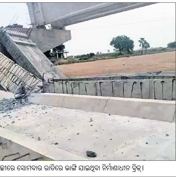
ତେଲଙ୍ଗାନାର ସେବାପଲ୍ଲୀରେ ସୋମବାର ରାତିରେ ଭାଙ୍ଗି ଯାଇଥିବା ନିର୍ମାଣାଧୀନ ବ୍ରିଜ୍