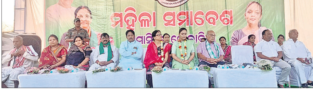
କୋଲାବିରା, ୨୩।୪