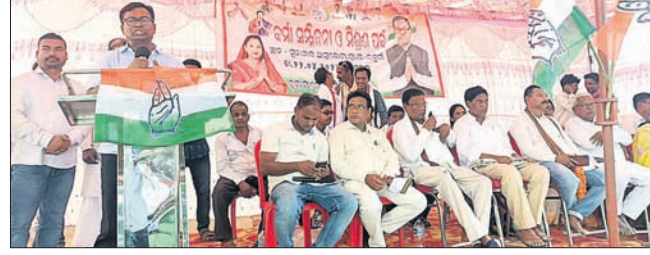
ସମାବେଶରେ ଯୋଗଦେଇଥିବା ଦଳୀୟ ନେତୃବୃନ୍ଦ।