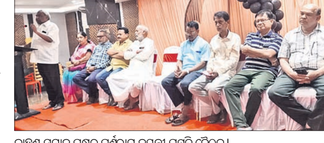
ବ୍ରାହ୍ମଣ ସମାଜ ପକ୍ଷରୁ ପଶ୍ଚିମ ଓଡ଼ିଶା ପ୍ରସ୍ତୁତ ବୈଠକ ।

ଭବାନୀପାଟଣା,୨୩୪ (ଉତ୍ତମ କୁମାର ଦାଶ) ଆସନ୍ତା ମେ ୧୦ ତାରିଖ ଅକ୍ଷୟ ତୃତୀୟା ତିଥିରେ ବ୍ରାହ୍ମଣ ସମାଜ କଳାହାଣ୍ଡି ପକ୍ଷରୁ ଭବାନୀପାଟଣା ଅଗ୍ରେସନ ଭବନଠାରେ ପଶ୍ଚିମ ଓଡ଼ିଶା କରୁଣା ଓ ସାମୁହିକ ବ୍ରତୋପନୟନ କାର୍ଯ୍ୟକ୍ରମ ଅନୁଷ୍ଠିତ ହେବ । ଏହି ଅବସରରେ ସ୍ଥାନୀୟ ଏକ ହୋଟେଲରେ ବ୍ରାହ୍ମଣ ସମାଜ ପକ୍ଷରୁ ପ୍ରସ୍ତୁତ ବୈଠକ ଅନୁଷ୍ଠିତ ହୋଇଯାଇଛି ।