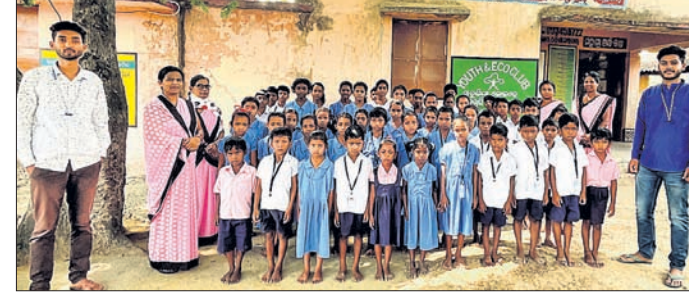
ବିଶ୍ୱ ଧରିତ୍ରୀ ଦିବସ ପାଳନ ଅବସରରେ ଛାତ୍ରାଛାତ୍ରୀଙ୍କ ସହ ଅତିଥି ।