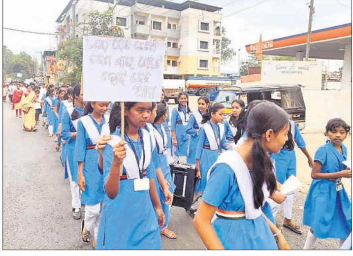
ବରଗଡ଼ ରାଣାପ୍ରତାପ ହାଇସ୍କୁଲ ଛାତ୍ରାଛାତ୍ରୀଙ୍କ ସହଯୋଗରେ ଶିକ୍ଷାମାତ୍ରା ।

ବରଗଡ଼, ୨୩।୪ (ପ୍ରେମାନନ୍ଦ ଖମ୍ବାରୀ): ବରଗଡ଼ ଜିଲ୍ଲାରେ ଗୁଣାମୂଳ ଶିକ୍ଷାର ବିକାଶ ପାଇଁ ଜିଲ୍ଲା ବିଜ୍ଞାନ କେନ୍ଦ୍ରରେ ମଙ୍ଗଳବାର ଏକ ମାନସ ମନ୍ଦନ କାର୍ଯ୍ୟକ୍ରମ ଅନୁଷ୍ଠିତ ହୋଇଯାଇଛି।