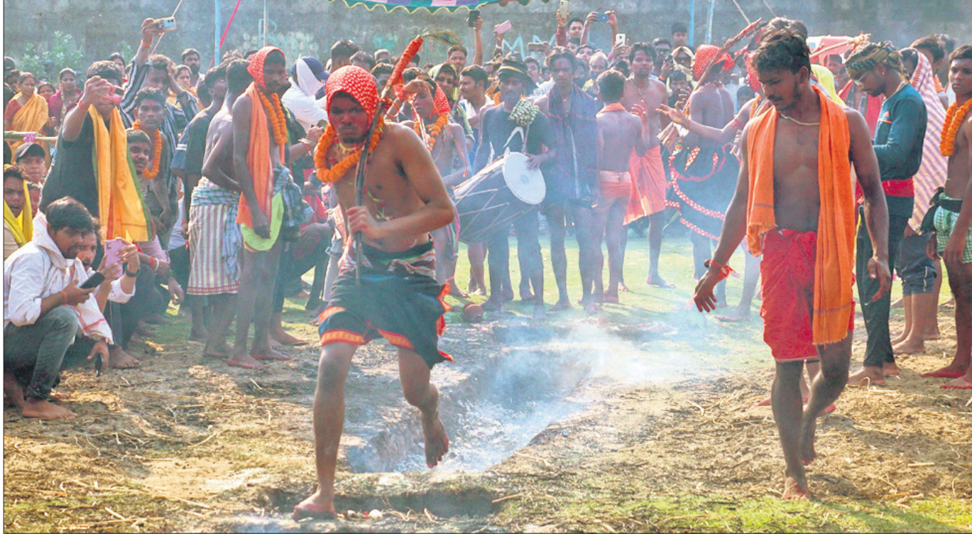
ଚୈତ୍ରପୂର୍ଣ୍ଣିମା ଅବସରରେ ମଙ୍ଗଳବାର କଟକ ଚୌଧୁରୀ ବଜାର ଗୋପାଳଜୀଉ ଲେନ୍ ମଠାଘାଟରେ ମାନସିକଧାରୀ ଝାମୁନିଆଁରେ ଚାଲୁଛନ୍ତି।

ଭୁବନେଶ୍ୱର, ୨୩୪(ଅସମାପିତା ସାହୁ) ଓଡ଼ିଶା ସ୍ତୁତ୍ୱ ପ୍ରବେଶିକା ପରାକ୍ଷା (ଓଜେଇଲ) ୨୦୨୪ ମେ' ୨ରୁ ଆରମ୍ଭ ହେବ।