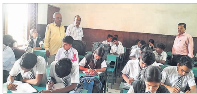
କୁଳଜ ପ୍ରତିଯୋଗିତାରେ ସାମିଲ ହୋଇଥିବା ଛାତ୍ରାଛାତ୍ରୀ।