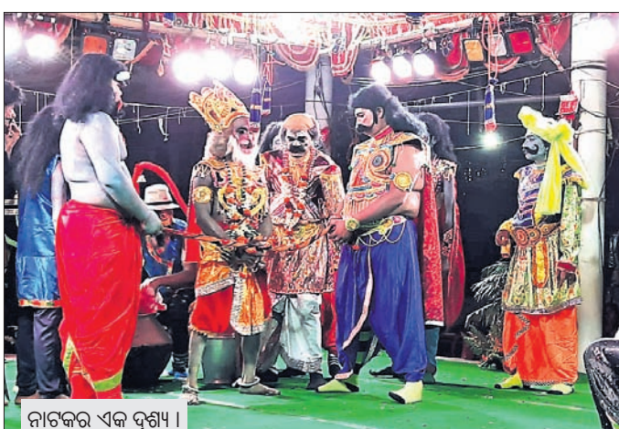
ନାଟକର ଏକ ଦୃଶ୍ୟ ।

ବୌଦ୍ଧର ପ୍ରସିଦ୍ଧ ଗଣପତି ରାମଲୀଳା ଉତ୍ସବ ମଙ୍ଗଳକାରୀ ଦିନ ସପ୍ତମ ଦିବସରେ ପହଞ୍ଚିଛି । ସପ୍ତମ ଦିବସରେ ଅନୁଷ୍ଠାନର କଳାକାରମାନଙ୍କ ଦ୍ୱାରା ନାଟକ ଲଙ୍କାଦହନ ମଞ୍ଚସ୍ଥ ହୋଇଛି । ବାଳା ବଧ ପରେ ସୁଗ୍ରୀବଙ୍କୁ କିନ୍ଧ୍ୟାସର ରାଜା ଭାବରେ ଅଭିଷିକ୍ତ କରାଯାଇଛି । ବର୍ଷାଦିନ ପରେ ସାତାଳ ଅନୁସନ୍ଧାନ କାର୍ଯ୍ୟ ଆରମ୍ଭ କରାଯିବାରୁ କହି ଶ୍ରୀରାମ ଓ ଲକ୍ଷ୍ମଣ ଚୁଷ୍ପାମୁକ ପାହାଚକୁ ଠେଲି ଆସିଛନ୍ତି । ବର୍ଷା ପରେ ଶ୍ରୀରାମଙ୍କ ଠାରୁ ସୂଚନା ପାଇ ସାତାଳ ଅନୁସନ୍ଧାନରେ ସୁଗ୍ରୀବ ନିଜର ବାନରସେନାକୁ ଚାରିଭାଗରେ ବିଭକ୍ତ କରି ଚାରିଦିଗକୁ ପ୍ରେରଣ କରିଛନ୍ତି । ତିନୋଟି ଦିଗକୁ ବାନରସେନା ସାତାଳ କୌଣସି ସନ୍ଧାନ ନ ପାଇ ନିରାଶ ହୋଇ ଫେରିଆସିଛନ୍ତି । କିନ୍ତୁ ମୁବରାଜ ଅଙ୍ଗଦ, ହନୁମାନ ଓ ଜାୟବାନଙ୍କ ନେତୃତ୍ୱରେ ଯାଇଥିବା ସେନା ସୁଗ୍ରୀବ କୁଳରେ ପହଞ୍ଚିବା ପରେ ସେଠାରୁ ହନୁମାନ ପଦନ ମାର୍ଗରେ ସାତ ସପ୍ତମ ପାର ହୋଇ ସାତାଳ ସନ୍ଧାନରେ ଲଙ୍କାରେ ପହଞ୍ଚିଛନ୍ତି । ସପ୍ତମ ରାସ୍ତାରେ ସିଂହଳା ରାକ୍ଷସୀଙ୍କୁ ହନୁମାନ ବଧ