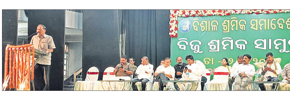
ଭଞ୍ଜଭବନରେ ବିଜୁ ଶ୍ରମିକ ସାମ୍ମୁଖ୍ୟ ପକ୍ଷରୁ ଆୟୋଜିତ ସମାବେଶରେ ଅତିଥି।

ଶ୍ରମିକ କଲ୍ୟାଣ ବୋର୍ଡରେ କେନ୍ଦ୍ରପତ୍ର ଚୋକାଳି ଓ ବୁଣାକାର, ପଶ୍ଚିମ ଓଡ଼ିଶା ଅନ୍ତର୍ଗତ ସମ୍ବଲପୁର ସହରରେ କାର୍ଯ୍ୟକ୍ରମ ପୂରିସିପାଳିତ କର୍ମଚାରୀ, ହୋଟେଲ ବ୍ୟବସାୟ, ବୋକାଳବନ୍ଦୀରେ କାର୍ଯ୍ୟକ୍ରମ କର୍ମଚାରୀ, ଅଗୋ ଚାଳକ, ଫଟୋଗ୍ରାଫର ଓ ଅନ୍ୟମାନେ ସାମିଲ ହୋଇ ସୁବିଧା ପାଇ ପାରିବେ। ସୁତରାଂ ଶ୍ରମିକ ସମ୍ମୁଖ୍ୟାଙ୍କ ପାଇଁ ରାଜ୍ୟ ବିଜୁ ଶ୍ରମିକ ସାମ୍ମୁଖ୍ୟ ପକ୍ଷରୁ ବିଶାଳ ଶ୍ରମିକ ସମାବେଶ ଓ ଆଲୋଚନାଚକ୍ର ଅନୁଷ୍ଠିତ ହୋଇଯାଇଛି। ଏଥିରେ ଅଧ୍ୟକ୍ଷତା କରି ମହାସଚିବ ସିଂ କହିଲେ,