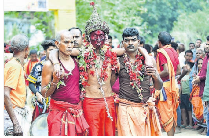
ମା' ଦକ୍ଷିଣକାଳୀଙ୍କ ପାରମ୍ପରିକ ଚଉତି ପୁନି ବ୍ୟଲ ଯାତ୍ରା। ଚଳିତବର୍ଷ ଚୈତ୍ର ପୂର୍ଣ୍ଣିମା ଅବସରରେ ଆରମ୍ଭ ହୋଇଛି ଚଉତି ପୁନି ବ୍ୟଲ ଯାତ୍ରା। ଖାରପୁରୁଡ଼ା ଜିଲା ଅନ୍ତର୍ଗତ କୋଲାବିରା ଠାରେ ଅନୁଷ୍ଠିତ ଏକଲକ୍ଷ୍ମୀପାଠର ଐତିହାସିକ ମହତ୍ତ୍ୱ ରହିଛି।

ନୈବେଦ୍ୟ ଶୁଖିଳାର ସହ ଅର୍ପଣ କରିବାରେ ଲାଗିଥିଲେ। ଅବିଭକ୍ତ ସମ୍ବଳପୁର ଜିଲ୍ଲାରେ ଶାଳୁ ପରମ୍ପରା ବହୁ ପୁରାତନ। ଶାଳୁ ପରମ୍ପରାରେ ଜୟପୁର ଲକ୍ଷ୍ମେଷ (କୋଲାବିରା) ଅଧିଷ୍ଠାତ୍ରୀ ଦେବୀ ଦକ୍ଷିଣକାଳୀଙ୍କ ପ୍ରତି ଜନସାଧାରଣଙ୍କ ରହିଛି ଅଗାଧ ବିଶ୍ୱାସ, ଭକ୍ତି ଓ ଭୟ। କଳା ଓ ସଂସ୍କୃତିର ପରିଚୟ ତଥା ନିଷ୍ଠା ଓ ଭକ୍ତିର ଅନନ୍ତ ପରମ୍ପରା ଏଠାକାର ବ୍ୟଲ ଯାତ୍ରା। ଦେବୀଶକ୍ତି ବା ଚନ୍ଦ୍ରମନ୍ତ ଶକ୍ତିର ଆଧାର କରିହେଉ କିମ୍ବା ପ୍ରାଚୀନ ସଂସ୍କୃତିର ପ୍ରଚଳିତ ପରମ୍ପରା ଦୃଷ୍ଟି କୋଣାର୍କ ହେଉ ଦେବୀଶକ୍ତି ବା ମାତୃଶକ୍ତିର ମହତ୍ତ୍ୱ ସାର୍ବଜନୀନ କରିବା ପାଇଁ କୋଲାବିରାରେ ବହୁ ଆବହନ ପ୍ରତି ଥିବା ଅହେତୁକ ଭକ୍ତି ଓ ଶ୍ରଦ୍ଧାରେ