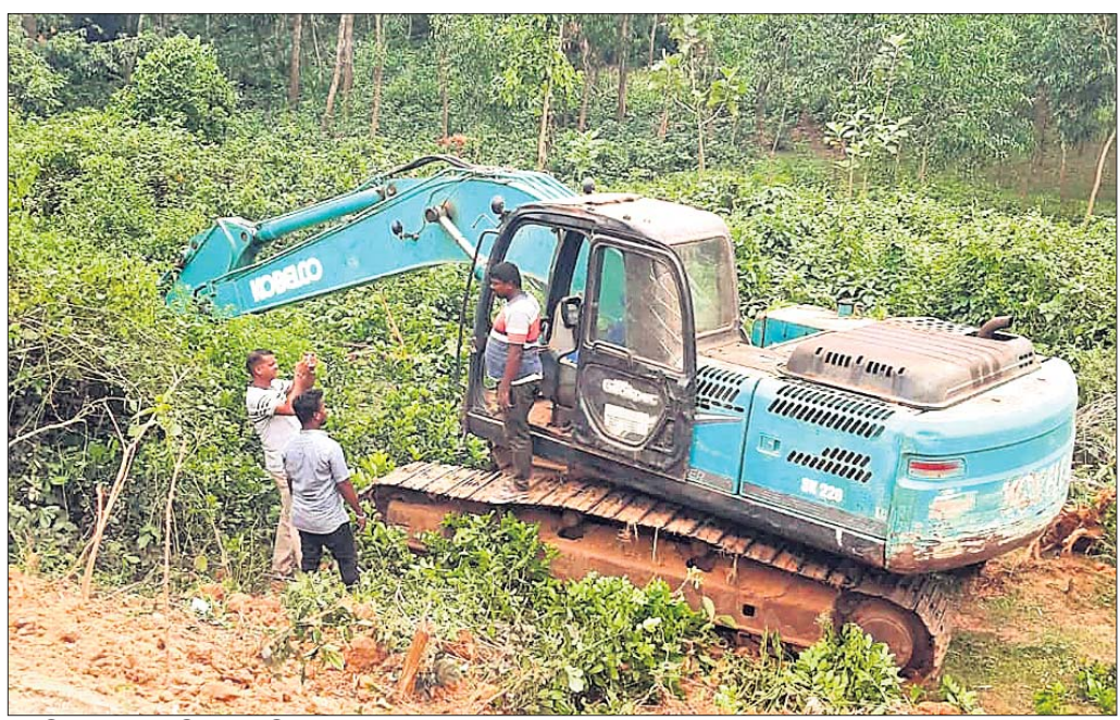
ବନ ବିଭାଗ ଜବତ କରିଥିବା ମେଣିନ ।

ରଘୁଲପୁର/ବ୍ରହ୍ମବରଦା, ୨୩୪ (ରଞ୍ଜିତ ରାଉତ/ଯଯାତି କେଶରୀ ବେହେରା):