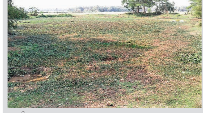
ଜଗତ୍ସିଂହପୁର ସହରରେ ଶୁଖି ଯାଇଥିବା ଏକ ଜଳାଶୟ।

ଥରେ ଖୁଣ୍ଟା ଜଗତ୍ସିଂହପୁର ପୌର ପରିଷଦ ପକ୍ଷରୁ ପୂର୍ବରୁ ଉନ୍ନତୀକରଣ ପାଇଁ ୧୩ ଲକ୍ଷ ଟଙ୍କା ଟଙ୍କା ଖର୍ଚ୍ଚ କରାଯାଇଥିବା ବେଳେ ଏବେ ପାଖାପାଖି ୩୦ ଲକ୍ଷ ଟଙ୍କା ବ୍ୟୟ ବରାଦ କରାଯାଇଛି।