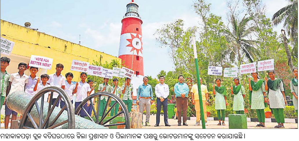
ମହାକାଳପଡ଼ା ବ୍ଲକ ବଚିତ୍ୱରେ ଜିଲା ପ୍ରଶାସନ ଓ ପିଲାମାନଙ୍କ ପକ୍ଷରୁ ଭୋଟଦାନକୁ ସଚେତନ କରାଯାଇଛି ।