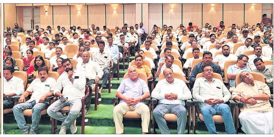
ଶଙ୍ଖ ଭବନକୁ ଆସିଥିବା ବଡ଼ଚଣାର ନେତା ଓ କର୍ମୀମାନେ ।