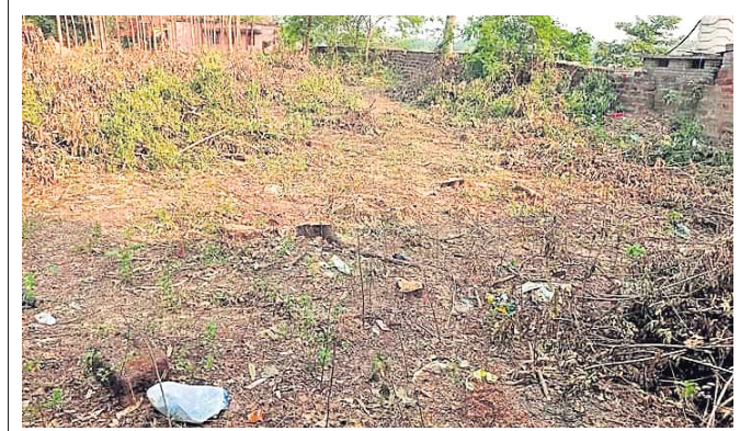
ବାଲେଶ୍ୱର, ୨୩୪ (ମାନସ ବିଶ୍ୱାଳ)

ବଡ଼ଚଣା ରୁକ୍ଷ ଅଧୀନ ମହାପୁରୁଷ ହାତୀଦାସ ମହାବିଦ୍ୟାଳୟ ପରିସରରେ ଥିବା ମୂଲ୍ୟବାନ ଶାଗୁଆନ ଗଛ କଟାଯାଇଛି। ବୁଧ ଦିନ ପୂର୍ବେ ଏଠାରୁ ରାତିଅଧିଆ ଗଛ କାଟି ବିକ୍ରି କରାଯାଇଛି। ଏହି ଘଟଣା ପ୍ରଘଟ ପରେ ଘାଣ୍ଟିର ବାସିନ୍ଦା ବୈଦା ସ୍ଥିତ ବନ ବିଭାଗ କାର୍ଯ୍ୟାଳୟରେ ଅଭିଯୋଗ କରିଛନ୍ତି। ବିଭାଗ ପକ୍ଷରୁ କୌଣସି ଅନୁମତି ଦିଆ ଯାଇ ନ ଥିବା କୁହାଯାଇଛି। ତେବେ ଅନୁମତି ନ ଥାଇ କାହା ସାହାଯ୍ୟରେ କଲେଜ ପରିସରର ଗଛକଟା କାଟି ବିକ୍ରି କରିଛନ୍ତି ତାହାକୁ ନେଇ ପ୍ରଶ୍ନବାଚୀ ସୃଷ୍ଟି ହୋଇଛି। କଲେଜ ଅଧ୍ୟାପକ ଏକାମ୍ର କାମରେ ଲିପ୍ତ ଥିବା ସାଧାରଣରେ ଆଲୋଚନା ହେଉଛି। ଅନୁପକ୍ଷରେ କଲେଜ ଉନ୍ନତୀକରଣ ନାମରେ ଗଛ କାଟି ବିକ୍ରି କରିବା କେତେ ଦୂର ଯାଏଁ ବୋଲି ପ୍ରଶ୍ନ କରିଛନ୍ତି ଘାଣ୍ଟିର ବାସିନ୍ଦା। ଗଛ ବିକ୍ରି କରି ଏହାକୁ ଲୁଚେଇବାକୁ କଟା ଯାଇଥିବା ଗଛର ଡାଳ ପତ୍ର ଏକତ୍ର କରି ନିଆଁ ଲଗାଇ ଦିଆଯାଇଛି। ଏ ସମ୍ପର୍କରେ କଲେଜ ଅଧ୍ୟକ୍ଷ ବଳରାମ ସାହୁଙ୍କୁ ପଚାରିବାରୁ ସେ କହିଛନ୍ତି, କଲେଜର ନୂତନ ଗୃହ ନିର୍ମାଣ ପାଇଁ କିଛି ଜାଗା ଆବଶ୍ୟକ ଥିଲା। ସେଥିପାଇଁ ଉଚ୍ଚଶିକ୍ଷା ଗଛ କାଟିବାକୁ ଜଙ୍ଗଲ ବିଭାଗଠାରୁ ଅନୁମତି ପାଇଁ ଆବେଦନ କରିଥିଲୁ। କିନ୍ତୁ ଅନୁମତି ମିଳିବାରେ ବିଳମ୍ବ ହୋଇଥିଲା। ତୁରନ୍ତ ଗୃହ ନିର୍ମାଣ କାର୍ଯ୍ୟ ଆରମ୍ଭ ନ କଲେ ଅନୁଦାନ ଟଙ୍କା ଫେରିଯିବ। ସେଥିପାଇଁ ଗଛ କଟାଯାଇଛି।