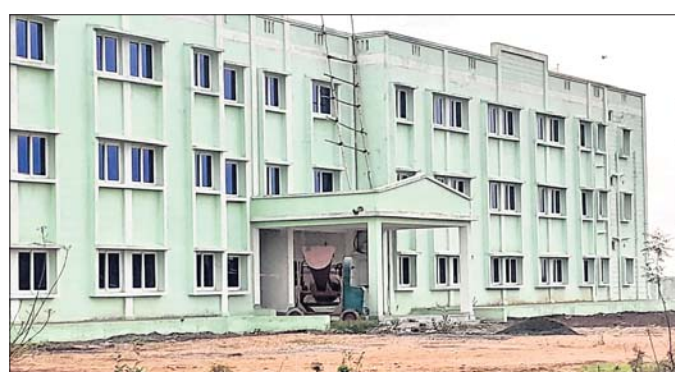
ଦାନଗଦି ଆଦର୍ଶ ବିଦ୍ୟାଳୟ ହଷ୍ଟେଲ ନିର୍ମାଣ କାର୍ଯ୍ୟ ବାଲିଛି ।

ରାଜ୍ୟ ସରକାର ୨୦୧୭ରୁ ଗ୍ରାମାଞ୍ଚଳ ଗରିବ ମେଧାବା ଛାତ୍ରାଛାତ୍ରୀମାନଙ୍କୁ ଉନ୍ନତ ମାନର ଇଂଲିଶ ମିଡିୟମ ଶିକ୍ଷା ପ୍ରଦାନ ନିମନ୍ତେ ଓଡ଼ିଶାର ପ୍ରତ୍ୟେକ ବ୍ଲକ୍‌ସ୍ତରରେ ଆଦର୍ଶ ବିଦ୍ୟାଳୟ ପ୍ରତିଷ୍ଠା କରିଛନ୍ତି। ଏହାସହ ଦୂରଦୂରାନ୍ତ ଛାତ୍ରାଛାତ୍ରୀମାନଙ୍କ ରହଣୀ ପାଇଁ ହଷ୍ଟେଲ ନିର୍ମାଣ କରାଯାଇଛି। ଏହି ଆଦର୍ଶ ବିଦ୍ୟାଳୟକୁ ସୁପରିଚାଳନା କରିବା ନିମନ୍ତେ ସ୍ୱତନ୍ତ୍ର ଭାବେ ଓଡ଼ିଶା ଆଦର୍ଶ ବିଦ୍ୟାଳୟ ସଙ୍ଗଠନ ମଧ୍ୟ କାର୍ଯ୍ୟ କରୁଛି। ଏହି କ୍ରମରେ ଯାଜପୁର ଜିଲାର ଦାନଗଦି ବ୍ଲକ୍ ରହିବାରୁ ଜିଲାର ନିର୍ମାଣ ଆଦର୍ଶ ବିଦ୍ୟାଳୟ ହଷ୍ଟେଲ ଗୃହ ଅଧିକାରୀଙ୍କୁ ଅବସ୍ଥାରେ ପଡ଼ି ରହିଥିବାରୁ ଦୂରଦୂରାନ୍ତ ହେବା ସହ ବିଭିନ୍ନ ସମସ୍ୟାର ସମ୍ମୁଖୀନ ହେଉଥିବା ଅଭିଯୋଗ ହେଉଛି। ଆଦର୍ଶ ବିଦ୍ୟାଳୟ ପରିଚାଳନା ଓ ତଦାରଖ କରିବା ନିମନ୍ତେ ଜିଲାପାଳ ଅଧ୍ୟକ୍ଷ ଏବଂ ବ୍ଲକ୍‌ସ୍ତରରେ ରୁକ୍ଷ ଶିକ୍ଷା ପଣ୍ଡା ଅଧିକାରୀ ଉତ୍ତରଦାୟିତ୍ୱ ସମ୍ଭରୁ ସହାୟତା ପ୍ରଦାନ କରାଯାଇଛି। ଏହି ଆଦର୍ଶ ବିଦ୍ୟାଳୟ