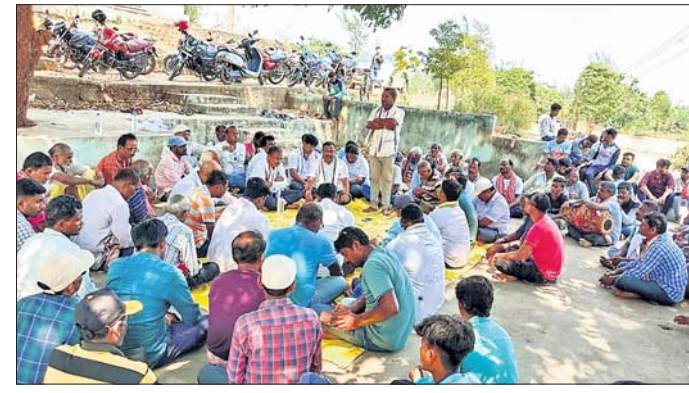
ବିଜେଡ଼ିର ସାଙ୍ଗଠନିକ ବୈଠକ ।