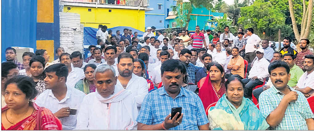
ଖବରଦାତା ସମ୍ମିଳନୀରେ ଉପସ୍ଥିତ ବିଜେଡି ସମର୍ଥକ