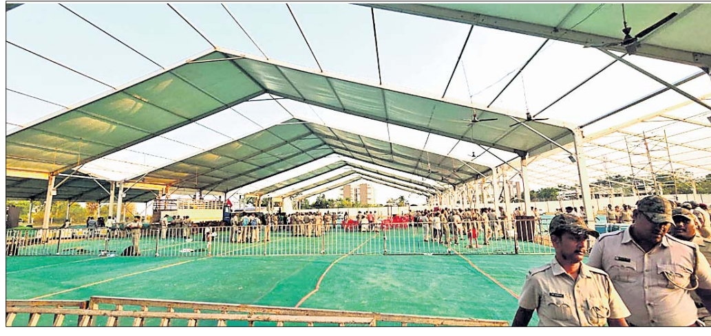
ମୁଖ୍ୟମନ୍ତ୍ରୀଙ୍କ ନିର୍ବାଚନ ପ୍ରଚାର ପାଇଁ ପ୍ରସ୍ତୁତି ।

ହିଞ୍ଜିଳିକାନ୍ତ/ଶେରଗଡ଼ ୨୩୧୪ (ଦ୍ୱିତୀୟ ପଞ୍ଚା/ପୂର୍ଣ୍ଣମାସର ଦଶମୀ) :