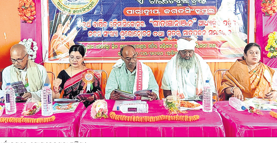
କାର୍ଯ୍ୟକ୍ରମରେ ଯୋଗଦେଇଥିବା ଅତିଥି।

ଏରସମା, ୨୩/୪ (ବାପ୍ତି ଖଣ୍ଡୁଆଳ) : ଏରସମା ବ୍ଲକ ଅନ୍ତର୍ଗତ ନାରଦିଆ ପଞ୍ଚାୟତଗୁଡ଼ି ଗ୍ରାମପଞ୍ଚାୟତ ମନ୍ଦିର ପ୍ରାଙ୍ଗଣରେ ବ୍ୟାସ ଫାଉଣ୍ଡେସନ ପକ୍ଷରୁ ବ୍ରହ୍ମମାସିକ ଉତ୍ସବ ଅନୁଷ୍ଠିତ ହୋଇଯାଇଛି।