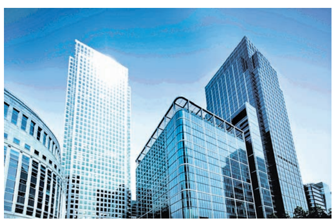
ପ୍ରକାଶ ପାଇଛି ଯେ, ୨୦୨୩-୨୪ ହଜାର କର୍ମଚାରୀଙ୍କୁ ଛଡ଼େଇ କରିଛନ୍ତି। ଆର୍ଥିକ ବର୍ଷରେ ସେମାନେ ପ୍ରାୟ ୬୪ ପ୍ରତିଶତ ବୃଦ୍ଧି ଆଣି

କମ୍ପାନୀଗୁଡ଼ିକ ଗୋଟିଏ ଆର୍ଥିକ ବର୍ଷରେ ଏତେ ପରିମାଣରେ ସେମାନଙ୍କର କର୍ମଚାରୀ ହ୍ରାସ କରିଛନ୍ତି। ସର୍ବବୃହତ ଆଇଟି ସଂସ୍ଥା ତଥା ଦେଶର ଦ୍ୱିତୀୟ ବୃହତ୍ତମ ଚାଲିକାରୁ କମ୍ପାନୀ ବିସ୍ତାପନାର ଡିମାଣ୍ଡରେ ୧,୨୫୯ କର୍ମଚାରୀଙ୍କୁ ହ୍ରାସ କରିଥିବାବେଳେ ସମଗ୍ର ଆର୍ଥିକ ବର୍ଷରେ ବିସ୍ତାପନା କର୍ମଚାରୀଙ୍କ ସଂଖ୍ୟା ୧୩,୨୪୯ ହ୍ରାସ ପାଇଛି। ସେହିଭଳି ଲନସୋସିଏଟିଭ୍ ଏସ୍ ଆର୍ଥିକ ବର୍ଷରେ ୨୫,୯୯୪ କର୍ମଚାରୀଙ୍କୁ ଛଡ଼େଇ କରିଛି। ଡିପ୍ଲୋମା ଡିଗ୍ରୀହୀନରେ ୬,୧୮୦ ଏବଂ ସମଗ୍ର ଆର୍ଥିକ ବର୍ଷରେ ୨୪,୫୧୬ କର୍ମଚାରୀ ଛଡ଼େଇ କରିଛି। ବିଶେଷତଃ ଆକଳନ ପ୍ରକାରୀଙ୍କୁ ୨୦୨୩-୨୪ ଆର୍ଥିକ ବର୍ଷରେ