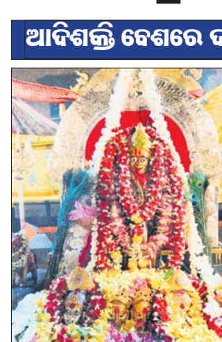
ଆଦିଶକ୍ତି ବେଶରେ ଦର୍ଶନ ଦେଲେ ଦୁଇ ଭଉଣୀ ।

ପୁରୁଷୋତ୍ତମପୁର, ୨୩୧୪(ସାମାଞ୍ଜଳ ମିଶ୍ର) : ଗଞ୍ଜାମ ଜିଲ୍ଲାର ପ୍ରସିଦ୍ଧ ଆରାଧ୍ୟ ଇଷ୍ଟଦେବୀ ମା' ତାରାତାରିଣୀଙ୍କ ଚୈତ୍ରଯାତ୍ରାର ଉଦ୍‌ଘାଟନ ଘଟିଛି । ଶେଷ ମଙ୍ଗଳବାର ପାଳିରେ ମା' ତାରାତାରିଣୀ ପୁରୁଷୋତ୍ତମ ଆଦିଶକ୍ତି ବେଶରେ ସଜିତ ହୋଇ ଭକ୍ତଙ୍କୁ ଦର୍ଶନ ଦେଇଥିଲେ । ମା'ଙ୍କୁ ଏହି ଚୈତ୍ରଯାତ୍ରାରେ ଶେଷ ଦର୍ଶନ କରି ଭକ୍ତମାନେ ନିଜ ନିଜର ଶୁଭ ମନାସା ପୁଣି ଆରବର୍ଷକୁ ଅପେକ୍ଷା କରିଛନ୍ତି । ଶେଷ ମଙ୍ଗଳବାର ସହ ଚୈତ୍ର ପୂର୍ଣ୍ଣିମା ହେତୁ ଭକ୍ତଙ୍କ ପ୍ରବଳ ସମାଗମ ରହିଥିଲା । ବହୁ ଦୂରଦୂରାନ୍ତରୁ ଭକ୍ତମାନେ ମା'ଙ୍କୁ ଦର୍ଶନ କରିବା ନିମନ୍ତେ ମନ୍ଦିରକୁ ଛୁଟି ଆସିଥିଲେ । ମନଃସାମନା ପୁରଣ ହେବା ଲାଗି ମାନସିକାଧାରୀ ନିଜ ନିଜ ଶିଶୁଙ୍କର ମୁଣ୍ଡନ କରିଥିଲେ । ଏହି ପାଳିରେ ଭୋଗ ୪.୩୦.୦୦ ମିନିଟ ପର୍ଯ୍ୟନ୍ତ ଚିତ୍ରାଯାତ୍ରା ପରମ୍ପରା ଅନୁସାରେ ମଙ୍ଗଳ ଆଳତି, ଅବକାଶ, ମାଜଣା, ସିଙ୍ଗାର, ଅଭିଷେକ ଆଦି ନାଟକାନ୍ତରେ ବିଭିନ୍ନ ପୂର୍ବକର୍ମ କରାଯାଇ ମା' ତାରାତାରିଣୀ ପୁରୁଷୋତ୍ତମ ଆଦିଶକ୍ତି ବେଶରେ ସଜିତ