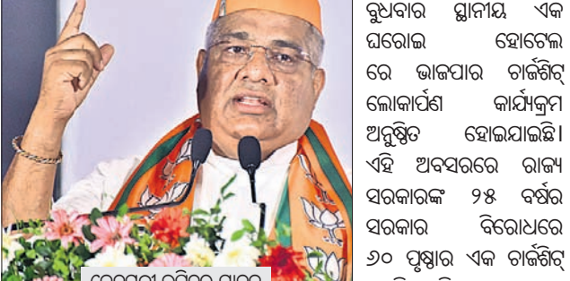
କେନ୍ଦ୍ରମନ୍ତ୍ରୀ ଭୂପିନ୍ଦର ଯାଦବ