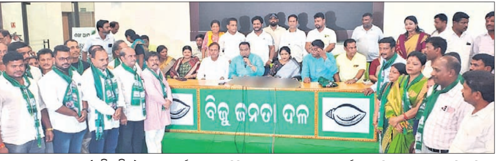
ଭୁବନେଶ୍ୱର, ୨୫୪ (ସୁଭାଷ ଚନ୍ଦ୍ର ପ୍ରଧାନ)