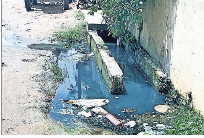
ଭୁବନେଶ୍ୱର, ୨୫୪ (ଅନୁରାଧା ମହାରଣା)

ଭୁବନେଶ୍ୱର, ୨୫୪ (ଅନୁରାଧା ମହାରଣା) ଭୁବନେଶ୍ୱର ବିଏମ୍‌ସି କର୍ମୀମାନେ ମେ ୨୪ ସୁଦ୍ଧା ଭୁବନେଶ୍ୱର ସହରରେ ଉପର ଭାଗରେ ୧୯ଟି ଡ୍ରେନ୍ ସଫେଇ କରିବା ପାଇଁ ଯତ୍ନ ନେଇଛନ୍ତି।