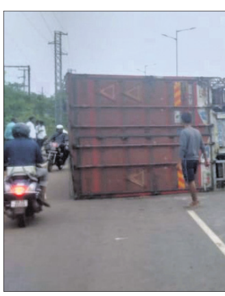
୧୬ନଂ. ଜାତୀୟ ରାଜପଥର ଯାଁଳା ଓଲଟକ୍ରିକ ଠାରେ ଓଲଟି ପଡ଼ିଥିବା କଣ୍ଠେନର।

୧୬ନଂ. ଜାତୀୟ ରାଜପଥର ଇନ୍ଦ୍ରପୋଖାଲି ଥାନା ଅନ୍ତର୍ଗତ ଯାଁଳା ଓଲଟକ୍ରିକ ଠାରେ ରୁଧିରାଜ ମର୍ମିକ୍ସ୍ ସଡ଼କ ଦୁର୍ଘଟଣା ଘଟିଛି। ଏକ ପିକଅପ୍ ଭ୍ୟାନ ଓ ବାଇକ୍କୁ ଧକ୍କାଦେଇ କଣ୍ଠେନର ଡାକ୍ତରଖାନାକୁ ଓଲଟିପଡ଼ିଥିଲା। ଫଳରେ କଣ୍ଠେନର ଖଲାସି ଓ ବାଇକ୍ ଡାକ୍ତରଖାନାକୁ ଚଳାଇ ଆହତ ହୋଇଛନ୍ତି। ଏମାନଙ୍କର ପରିଚୟ ମିଳିପାରି ନ ଥିବାରୁ ଚିକିତ୍ସା ପାଇଁ ଭୁବନେଶ୍ୱର ଏସ୍. ଟି. ସି. ହସ୍ପିଟାଲ୍‌ରେ ଭର୍ତ୍ତି ହୋଇଛନ୍ତି। ଏହାପରେ ପୁଲିସ୍ ଥାନାରେ ଏକ ପିକଅପ୍ ଭ୍ୟାନ ଓ ବାଇକ୍ ଉଦ୍ଧାର କରାଯାଇଛି। ଏହାପରେ ଏକ ପିକଅପ୍ ଭ୍ୟାନ ଓ ବାଇକ୍ ଭୁବନେଶ୍ୱରକୁ ଖୋର୍ଦ୍ଧା ଅଭିଯୁକ୍ତଙ୍କୁ ଯାଉଥିଲା। ପବନ କଣ୍ଠେନର ଡାକ୍ତରଖାନାକୁ ଓଲଟିପଡ଼ିଥିଲା। ଏହାପରେ ପିକଅପ୍ ଭ୍ୟାନ ଡ୍ରାଇଭର କଣ୍ଠେନର ଡାକ୍ତରଖାନାକୁ ଚଳାଇ ଆସିଥିଲେ। ପିକଅପ୍ ଭ୍ୟାନ ଡ୍ରାଇଭର କଣ୍ଠେନର ଡାକ୍ତରଖାନାକୁ ଚଳାଇ ଆସିଥିଲେ।