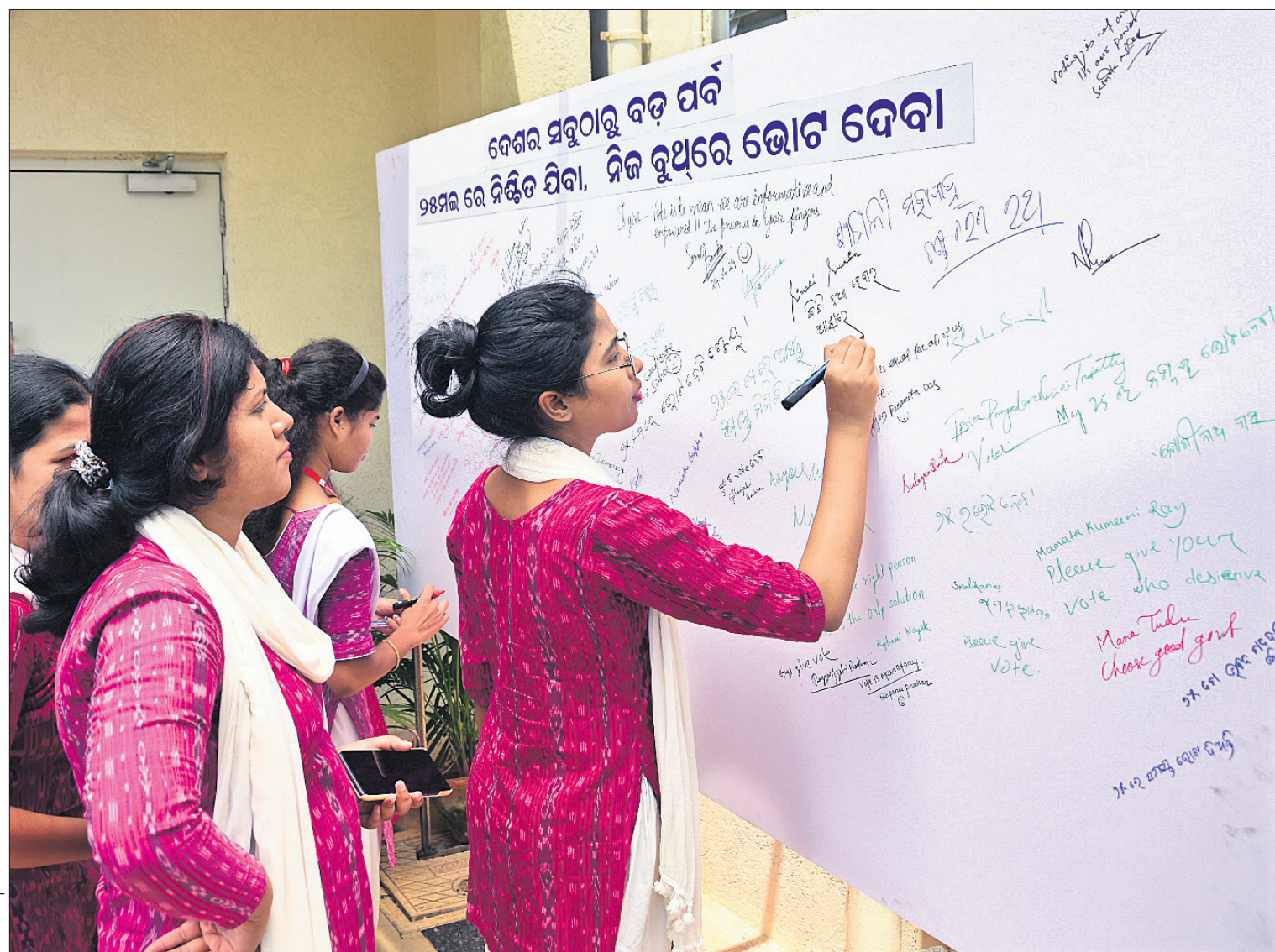
ଭୁବନେଶ୍ୱର ରାମାଦେବୀ ମହିଳା ବିଶ୍ୱବିଦ୍ୟାଳୟରେ ରୁଧିରୀ ସମ୍ପତ୍ତି ପ୍ରଶ୍ନ ଆଲୋଚିତ ଭାବେ ସଚେତନତା କାର୍ଯ୍ୟକ୍ରମରେ ଛାତ୍ରୀମାନେ ପ୍ରଚାର ପ୍ରାଚାରରେ ସଚେତନତା ବାର୍ତ୍ତା ଲେଖୁଛନ୍ତି।

'ନିର୍ବାଚନ ଉପରେ ଆମ ନିୟନ୍ତ୍ରଣ ନାହିଁ' ନୂଆଦିଲ୍ଲୀ, ୨୪/୪ ସୁପ୍ରିମକୋର୍ଟ ନିର୍ବାଚନ ନିୟନ୍ତ୍ରଣ କର୍ତ୍ତୃପକ୍ଷ ନୁହେଁ। ନିର୍ବାଚନ କମିଶନ (ଜସି) ଏକ ସାମିତିଗତ ସଂସ୍ଥା ହୋଇଥିବାରୁ ଏହା କିପରି କାର୍ଯ୍ୟ କରିବ, ତା' ଉପରେ ମଧ୍ୟ ନିର୍ଦ୍ଦେଶ ଦେଇପାରିବେ ନାହିଁ ବୋଲି ରୁଧିରୀ ସର୍ବୋଚ୍ଚ ଅଦାଲତ ସ୍ପଷ୍ଟ କରିଛନ୍ତି।