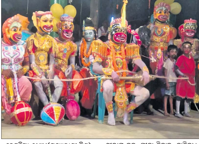
ବେଗୁନିଆ, ୨୪୪ (ସନ୍ଧ୍ୟାବାଣୀ ମିଶ୍ର)

ବେଗୁନିଆ ବୃକ୍ଷ ଅନ୍ତର୍ଗତ ବାଘମାରୀ ଗ୍ରାମର ତଳସାହିସ୍ଥିତ ରଘୁନାଥ ଦେବ ନାଟ୍ୟ ସଂସଦ ଦ୍ୱାରା କଳାକାରମାନଙ୍କ ରୂପାନ୍ତର ହୋଇଥାଏ। କମିଟି ସଭାପତି ସହଯୋଗରେ ରାମନାଟକ ଅନୁଷ୍ଠିତ ହେଉଛି। ରାମ ନବମୀଠାରୁ ୯ଦିନ ବ୍ୟାପୀ ବୈଦିକ ରୀତି ଅନୁସାରେ ହରିଷ୍ୟାଦ ଖାଲ ନିଷ୍କାର ସହ ରହି କଳାକାରମାନେ ଅଭିନୟ କରୁଛନ୍ତି। ୩୫ରୁ ଊର୍ଦ୍ଧ୍ୱ କଳାକାର ହନୁମାନ, ବାଳି, ଅଜୀତ, ଇନ୍ଦ୍ରଜିତ କୁମ୍ଭକର୍ଣ୍ଣ, ରାବଣ ଆଦି ଭୂମିକାରେ ନିଖୁଣ ଅଭିନୟ କରୁଛନ୍ତି।