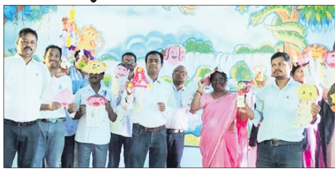
କର୍ମଶାଳାରେ ଯୋଗଦେଇଥିବା ଶିକ୍ଷୟିତ୍ରୀ ଶିକ୍ଷକ।