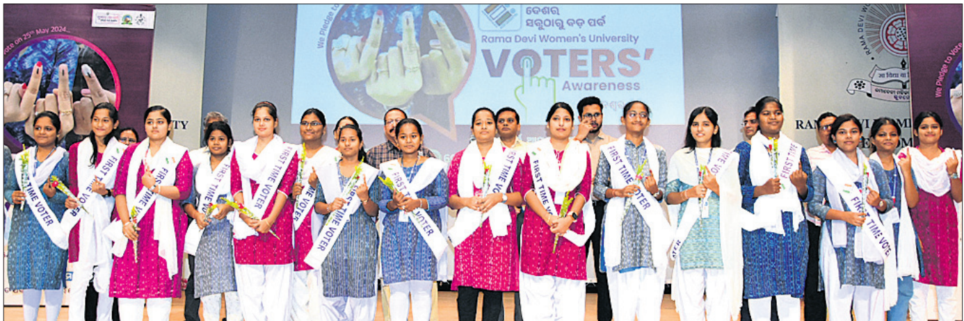
ଖୋର୍ଦ୍ଧା ଜିଲ୍ଲା ପ୍ରଶାସନ ଏବଂ ବିଏମ୍ସି ପକ୍ଷରୁ ରମାଦେବୀ ମହିଳା ବିଶ୍ୱବିଦ୍ୟାଳୟରେ ବୁଧବାର ଅନୁଷ୍ଠିତ ଭୋଟର ସଚେତନତା କାର୍ଯ୍ୟକ୍ରମରେ ଅତିଥିଙ୍କ ସମ୍ମାନ ସମ୍ପନ୍ନତା ଦିଆଯାଇଛି।