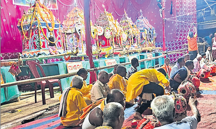
ଭୁବନେଶ୍ୱର, ୨୫୪ (ଶର୍ମିଷ୍ଠା ପାଣିଗ୍ରାହୀ)

ବମିଶାଳ ମେଳଣ ଉତ୍ସବ ଉଦ୍‌ଯାପିତ ହେବ। ବମିଶାଳ ମେଳଣ ଉତ୍ସବ ଉଦ୍‌ଯାପିତ ହେବ। ବମିଶାଳ ମେଳଣ ଉତ୍ସବ ଉଦ୍‌ଯାପିତ ହେବ।