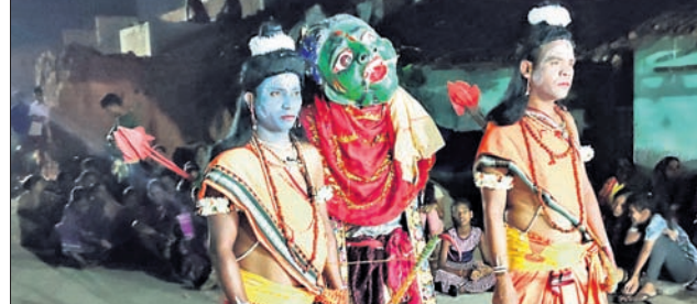
ବିରାୟୁଧ ବଧ ନାଟକର ଏକ ଦୃଶ୍ୟ।