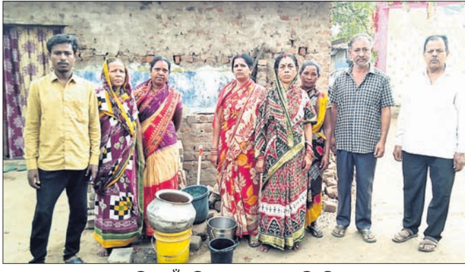
ପାନୀ ପାଇଁ ବସ୍ତିବାସୀ ଅପେକ୍ଷା କରିଛନ୍ତି।

ଗ୍ରାମ୍ଭୀ ପ୍ରବାହ ଯୋଗୁଁ ସହରରେ ଥିବା ବିଭିନ୍ନ ନଦୀ, ନାଳ ଶୁଖି ଯାଇଥିବାବେଳେ ବିଭିନ୍ନ ବସ୍ତି ଅଞ୍ଚଳରେ ପାନୀୟ ଜଳକୁ ନେଇ ସମ୍ପର୍କ ଦେଖାଦେଇଛି। ସହରରେ ଏଭଳି କିଛି ବସ୍ତି ଅଛି ଯେଉଁଠି ପାନୀୟ ଜଳ ପାଇଁ ଲୋକେ ନଳକୂପ ନଚେତ୍ ପାଖରେ ଥିବା ଖାଦାନ ପାଣି ଉପରେ ନିର୍ଭର କରୁଛନ୍ତି। ଏଭଳି ଦୁଶ୍ୱାଣ ଶାତଳପଡ଼ାସ୍ଥିତ ମଙ୍ଗଳା ମନ୍ଦିର ବସ୍ତିରେ ଦେଖିବାକୁ ମିଳିଛି। ଏହି ବସ୍ତିରେ ପ୍ରାୟ ୪୫୫ରୁ ଊର୍ଦ୍ଧ୍ୱ ଲୋକ ବାସ କରନ୍ତି। ଏଠାରେ ବିଭିନ୍ନ ସମୟରେ ପାନୀୟ ଜଳ ସମସ୍ୟା ଦେଖାଦେଉଥିବାକୁ ଖରାଦିନ ପୂର୍ବରୁ ଅନୁରୋଧ ପାଣିପାଲପ୍ ସଂଯୋଗୀକରଣ ସହ ବସ୍ତିର ବିଭିନ୍ନ ଲୋକଙ୍କ ଘର ଦୁଆର ମୁହଁରେ ପାଣିଗୋପ୍ ସଂଯୋଗୀକରଣ ଖାତେକା ବିଭାଗ ପକ୍ଷରୁ କରାଯାଇଥିଲା। ବସ୍ତି ଭିତରେ ବିଭିନ୍ନ ଘରକୁ ଏହି ଯୋଜନାରେ ପାଣି ପାଇପ୍ ସଂଯୋଗୀକରଣ ହୋଇସାରିଥିବା ବେଳେ ଆଜିଯାଏ ବସ୍ତିବାସୀ ପାନୀୟ ଜଳ ପାଇ