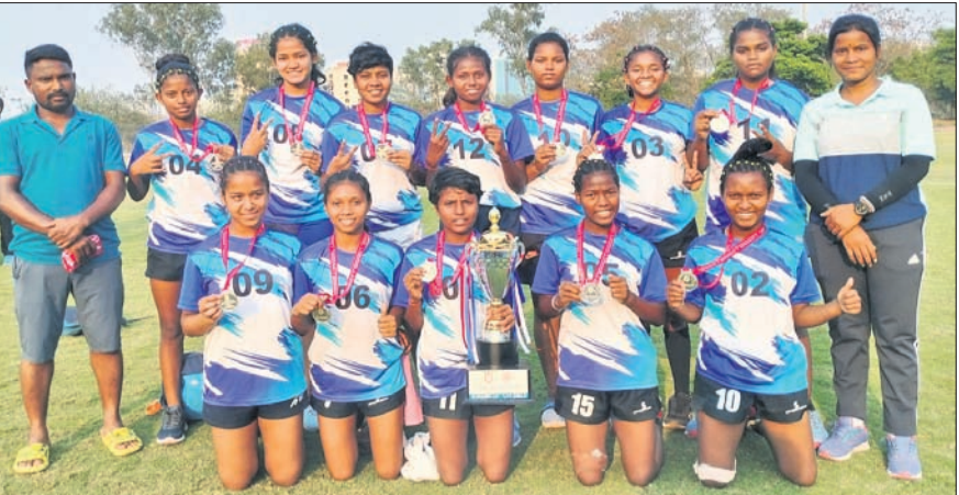
ରୌପ୍ୟ ପଦକ ସହ ଓଡ଼ିଶା ସିଏର୍ଏସ୍‌ଇ ବାଲିକା ଦଳ।

ଭୁବନେଶ୍ୱର, ୨୫.୪ (ତପନ ସାଲ୍) ପୁଣେର ଶିବ ଛତ୍ରପତି ସ୍ପୋର୍ଟ୍ସ କମ୍ପ୍ଲେକ୍ସରେ ଅନୁଷ୍ଠିତ ୬୭ତମ ନ୍ୟାଶନାଲ୍ ସ୍କୁଲ ଗେମ୍ସର ଉତ୍ତରା