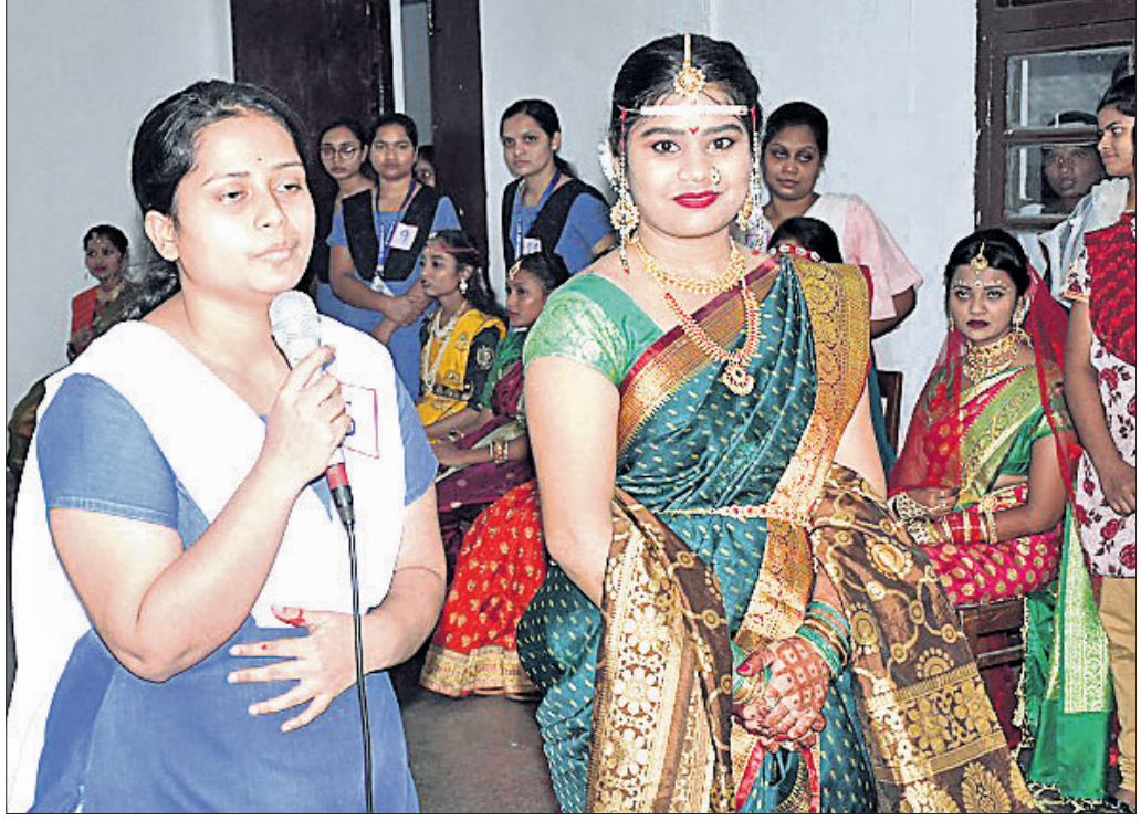
ପ୍ରତିଯୋଗିତାରେ ବଧୂ ବେଶରେ ଜଣେ ଛାତ୍ରୀ ପ୍ରଦର୍ଶନ କରୁଛନ୍ତି।

ରାଉରକେଲା, ୨୫୪୪ (ସଙ୍ଗୀତା ଜେନା) କିଲ୍ଲାପାଳ କାର୍ଯ୍ୟାଳୟ, ବିରମିତ୍ରପୁର ନିର୍ବାଚନ ମଣ୍ଡଳୀ ପାଇଁ ଆଇଟି-ଏରେ ଏହି ପ୍ରକ୍ରିୟା କରାଯିବ। ଅଧିକ ଗହଳିକୁ ଦୃଷ୍ଟିରେ ରଖି ପୋଲିସ୍ ପ୍ରଶାସନ ପକ୍ଷରୁ ଉଚ୍ଚ କାର୍ଯ୍ୟାଳୟ ଚାକିରି ନିକଟରେ ବ୍ୟାରିକେଡ୍ କରାଯାଇଛି। ସିପିଡି, ଗ୍ରାମିକ ବ୍ୟବସ୍ଥା କରାଯାଇଛି। ଡିଏସ୍‌ପି ନିର୍ମଳ ମହାପାତ୍ରଙ୍କ ନେତୃତ୍ୱରେ ୧୦ ଜଣ ବରିଷ୍ଠ ପୋଲିସ୍ ଅଧିକାରୀ ତଥା ୨ ପ୍ଲୁଟ୍ସ ପୋଲିସ୍ ଫୋର୍ସ୍ ପୁରସ୍କର କରାଯିବ ବୋଲି ପୋଲିସ୍ ପକ୍ଷରୁ ସୂଚନା ପ୍ରଦାନ କରାଯାଇଛି। ସେହିପରି ଅତ୍ୟଧିକ ଗ୍ରାମ୍ଭୀ ପ୍ରବାହ ଅନୁଭୂତ ହେଉଥିବା ଯୋଗୁଁ ପ୍ରଶାସନ ପକ୍ଷରୁ ପାନୀୟ ଜଳ ଓ ଆୟୁଷ୍ଟିକ ବ୍ୟବସ୍ଥା ମଧ୍ୟ କରାଯାଇଛି। ତେବେ ରାଜନୈତିକ ଦଳ ପକ୍ଷରୁ ଶାନ୍ତି ଶୁଖିଲା ବଜାୟ ରଖିବାକୁ ଆହ୍ୱାନ ଦିଆଯାଇଛି।