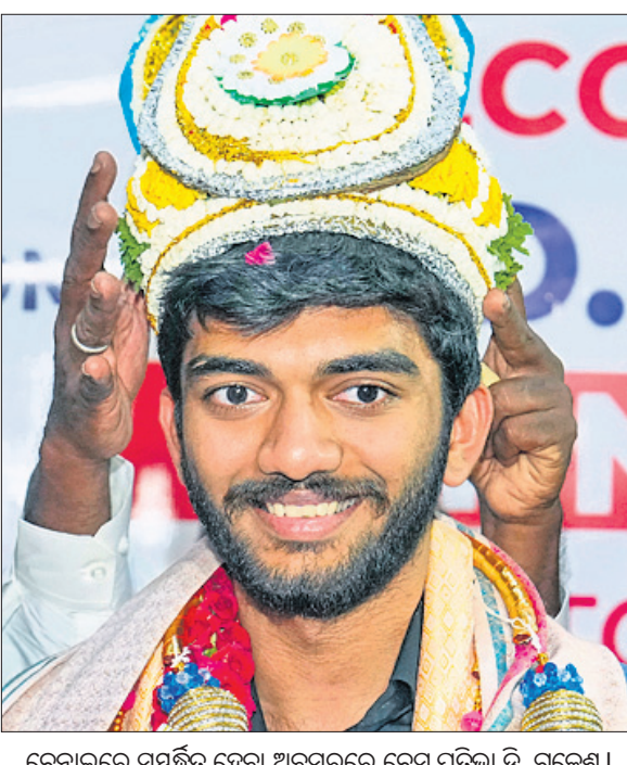
ଚେନାଇରେ ସମର୍ଥନ ହେବା ଅବସରରେ ଚେମ୍ପିୟନ ଟି. ଗୁଜେଶ୍।

କ୍ୟାଣ୍ଡିଡେଟ୍ ଚେମ୍ପିୟନ ଗୁଜେଶ୍ ଚିତ୍ତା ପରେ ଗୁରୁବାର ସ୍ୱେଶ୍ ଫେରିଛନ୍ତି ଭାରତୀୟ ଚେମ୍ପିୟନ ଟି. ଗୁଜେଶ୍। ଚେନାଇରେ ତାଙ୍କୁ ଉଲ୍ଲସିତ ସ୍ୱାଗତ ସମର୍ଥନା ଜ୍ଞାପନ କରାଯାଇଛି। ଏହି ଅବସରରେ ସେ ଏକ ସାକ୍ଷାତକାରରେ ତାଙ୍କ ସଫଳତା ପାଇଁ ବିଶ୍ୱାସୀ ଅନନ୍ଦକୁ ଶ୍ରେୟ ଦେଇଛନ୍ତି। ତାଙ୍କ କ୍ୟାରିୟର ଗଠନରେ ଏହି ଚେମ୍ପିୟନ ଶ୍ରଦ୍ଧା ଦେବାକୁ ସମର୍ଥନା ରହିଛି। ତାହା ହୋଇ ନ ଥିଲେ ସେ ବର୍ତ୍ତମାନ ଯେଉଁ ସ୍ଥାନରେ ରହିଛନ୍ତି, ସେଠାରେ ପହଞ୍ଚି ପାରି ନ ଥାନ୍ତେ ବୋଲି କହିଛନ୍ତି। ୧୭ ବର୍ଷୀୟ ଗ୍ରାଣ୍ଡମାଷ୍ଟର ସୋମବାର ଚେନାଇରେ କ୍ୟାଣ୍ଡିଡେଟ୍ ଚେମ୍ପିୟନ ଗୁଜେଶ୍ ଚିତ୍ତା ପରେ ବିଶ୍ୱ ଚାଲିଥିବା ପାଇଁ ସର୍ବକଳ୍ପ ଚ୍ୟାଲେଞ୍ଜର ଭାବେ ଉଭା ହୋଇଛନ୍ତି। ଏହା ଦ୍ୱାରା ସେ ୪୦ ବର୍ଷ ପୂର୍ବ କିମ୍ବଦନ୍ତୀ ଗ୍ୟାରି କାକାଭୋଲ୍ଙ୍କ ରେକର୍ଡକୁ ଛାଡ଼ି କରିଦେଇଛନ୍ତି। ଏହି ସଫଳତା ପରେ ସେ ଚଳିତବର୍ଷ ପରବର୍ତ୍ତୀ ଭାଗରେ ବିଶ୍ୱ ଚାମ୍ପିୟନ ଚାଲିଥିବା ଡିଲ୍ ଲିଗରେ ସହ ଯୋଗଦାନ କରିଛନ୍ତି। ଗୁଜେଶ୍ ୨୦୨୦ରେ ପ୍ରତିଷ୍ଠିତ ଫ୍ରେଡ୍ରିକ୍-ଆନନ୍ଦ ଚେମ୍ପିୟନ ଶ୍ରଦ୍ଧାରେ ଚେନାଇରେ କୋହଲିଙ୍କର କଥା ୨୦୧୪ରେ ଆନନ୍ଦଙ୍କ ପରେ ଗୁଜେଶ୍ ଦ୍ୱିତୀୟ ଭାଗରେ ଭାବେ କ୍ୟାଣ୍ଡିଡେଟ୍ ଚେମ୍ପିୟନ ଗୁଜେଶ୍ ଚିତ୍ତା ହେବେ।