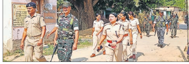
ସମ୍ବେଦନଶୀଳ ଅଞ୍ଚଳରେ ପୋଲିସର ଘାଟୁମାର୍ଚ୍ଚ।