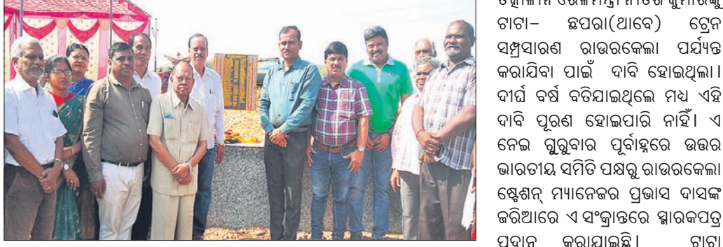
କାର୍ଯ୍ୟକ୍ରମରେ ଯୋଗଦେଇଥିବା ଅତିଥିମାନେ।

ପ୍ରତିଯୋଗିତାରେ ବଧୂ ବେଶରେ ଜଣେ ଛାତ୍ରୀ ପ୍ରଦର୍ଶନ କରୁଛନ୍ତି।