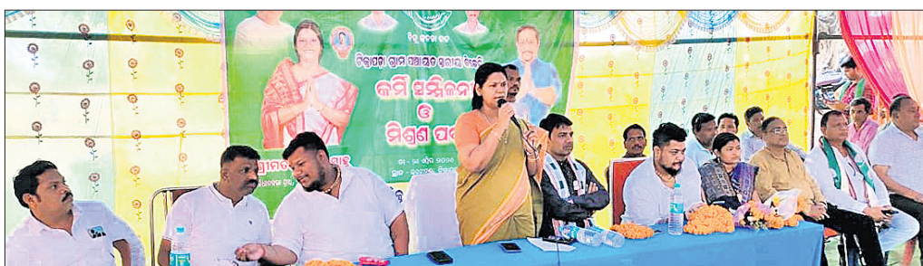
ବିଜେଡି ପକ୍ଷରୁ ଆୟୋଜିତ ସଭାରେ ମଞ୍ଚାସୀନ ଅତିଥିଗଣ।