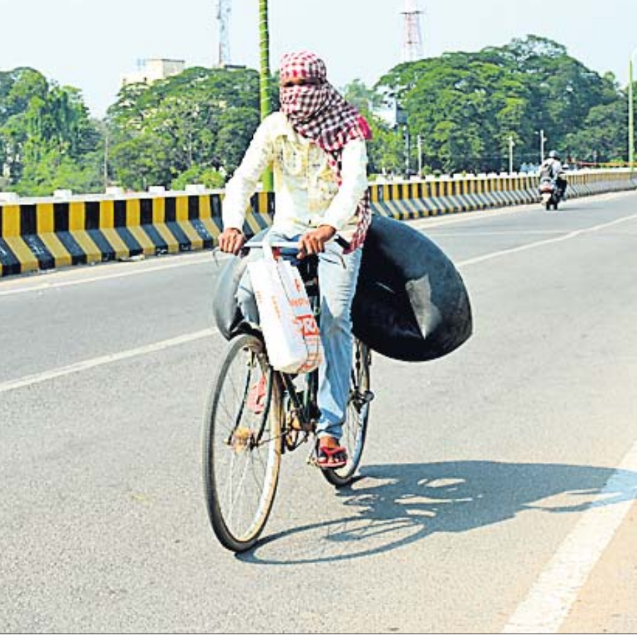
ପ୍ରଚଣ୍ଡ ଭୌତପାପ ଯୋଗୁ ରାସ୍ତା ଶୁଦ୍ଧୀନ : ପ୍ରଚଣ୍ଡ ଚାପମାଡ଼ା ସତ୍ତ୍ୱେ ଜଣେ ବ୍ୟକ୍ତି ସମ୍ବଲପୁର ଚଉର୍ଦ୍ଧାପୁର ବ୍ରିଜ ଉପରେ ଗୁରୁବାର ଜଣେ ବ୍ୟକ୍ତି ମାଛ ଧରିବାକୁ ଯାଉଛନ୍ତି ।