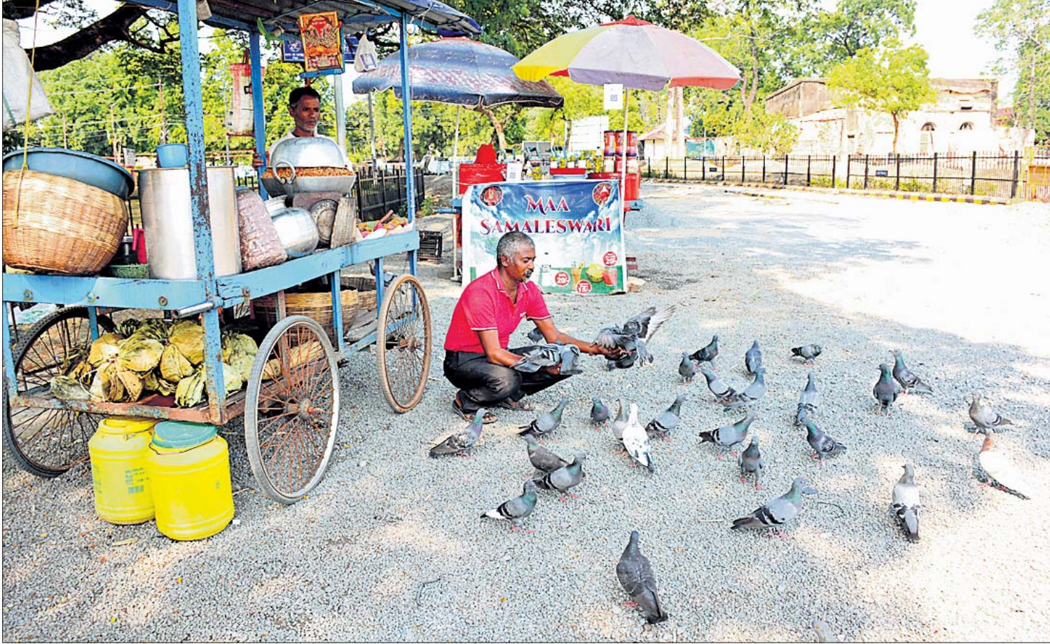
ପ୍ରଚଣ୍ଡ ଭୌତପାପରେ ବ୍ୟବସାୟ ମାୟା : ଗୁରୁବାର ସମ୍ବଲପୁର କଟେରି ଛକ ନିକଟ ରାସ୍ତାରେ ଆଜୁ ପୁଡ଼ି ଦୋକାନରେ ଗ୍ରାହକ ନ ଥିବାରୁ ବ୍ୟବସାୟୀ ଜଣକ ଗଛ ଛାଇରେ ପାରାମାନଙ୍କୁ ଖାଦ୍ୟ ଦେଉଛନ୍ତି ।