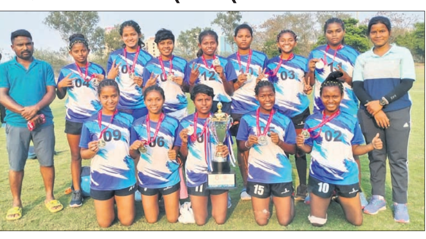
ରୌପ୍ୟ ପଦକ ସହ ଓଡ଼ିଶା ସିଏର୍ଏସ୍‌ଇ ବାଲିକା ଦଳ।

ହାଇଦ୍ରାବାଦରେ ବିଦ୍ୟାରାଉ ୦-୧୯ ପଏଣ୍ଟରେ ପରାଜିତ ହୋଇଥିଲା। କ୍ୱାର୍ଟର ଫାଇନାଲ୍ ରେ ଦଳ ୨୭-୦ରେ ରାଜସ୍ଥାନକୁ ଏବଂ ସେମିଫାଇନାଲ୍ ରେ ୩୭-୦ରେ ଛତିଶଗଡ଼କୁ ହରାଇ ଫାଇନାଲ୍ ରେ ପ୍ରବେଶ କରିଥିଲା।