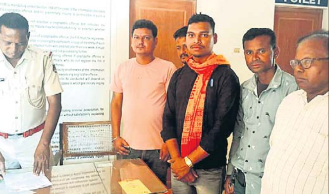
ବିଶ୍ୱାସ ପରିଷଦ ଓ ବଜରଞ୍ଜ ଦଳ ପକ୍ଷରୁ ଦାବିପତ୍ର ପ୍ରଦାନ କରାଯାଇଛି।

ଲଗାଇବା ସହ ଚାଲାଣକାରୀଙ୍କ ବିରୋଧରେ ଦୃଢ଼ କାର୍ଯ୍ୟାନୁଷ୍ଠାନ ଗ୍ରହଣ କରିବାକୁ ବାଞ୍ଚିବିପୋଷି ଥାନାରେ ଦାବି ପତ୍ର ପ୍ରଦାନ କରିଛନ୍ତି।