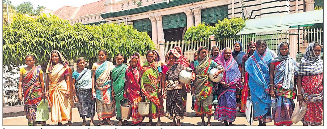
ଜିଲ୍ଲାପାଳଙ୍କ କାର୍ଯ୍ୟାଳୟ ଆଗରେ ଅଭିଯୋଗ କରିବାକୁ ଆସିଥିବା ମହିଳାମାନେ।