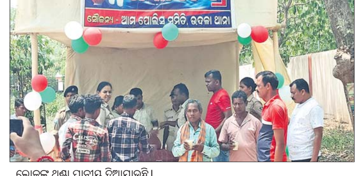
ଲୋକଙ୍କୁ ଅଣ୍ଟା ପାନୀୟ ବିଆଯାଇଛି।

ଉଦଳା, ୨୫୪ (ସନ୍ତୋଷ କୁମାର ବାହ୍ନିନୀ) - ଉଦଳା ଆମା ପରିସରରେ ଗୁରୁବାର ଜଳଛତ୍ର ଆରମ୍ଭ ହୋଇଛି।