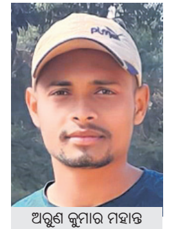
ଅଭିଯୋଗ କାର୍ଯ୍ୟକ୍ରମର ନେତା

ପଡ଼ୋଶୀ ହଜରାଣ କଲେ। ପୋଲିସ୍ ଅଭିଯୋଗ କଲା ପରେ ବି ଅପରାଧୀଙ୍କୁ ବିଚାରପତି କୋର୍ଟରେ ଉପସ୍ଥାପନ କରାଯାଇଛି।