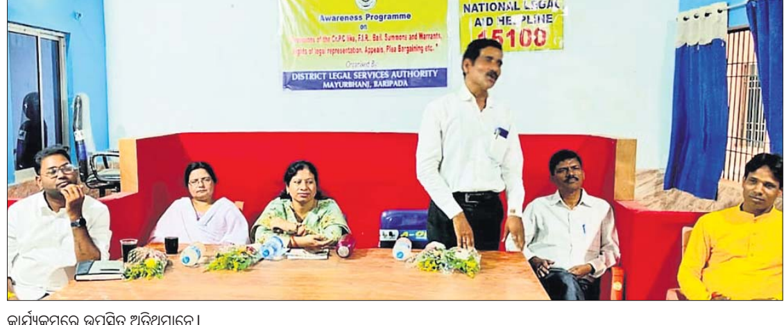
କାର୍ଯ୍ୟକ୍ରମରେ ଉପସ୍ଥିତ ଅତିଥିମାନେ।

ବାରିପଦା ମହାରାଜପୁରସ୍ଥିତ ମୟୂରଭଞ୍ଜ କଲେଜ ଅଫ୍ ଆକାଉଣ୍ଟସ୍ ଆଞ୍ଚଳିକ ସ୍ତରୀୟ ଆଇନ ସଚେତନତା କାର୍ଯ୍ୟକ୍ରମ ଆରମ୍ଭ ହୋଇଯାଇଛି।