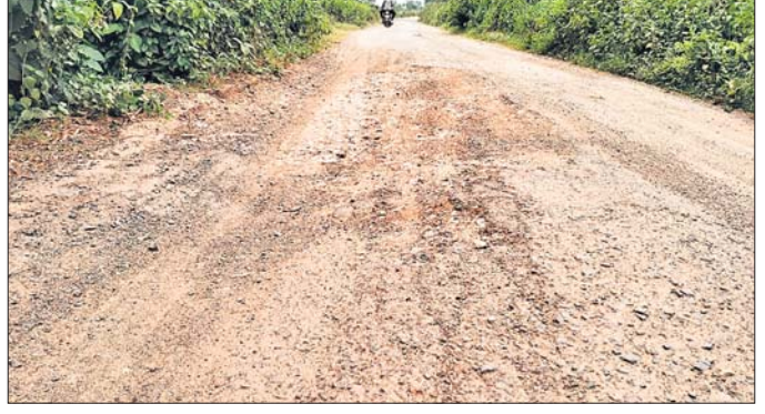
ରାମଚନ୍ଦ୍ରପୁର, ୨୫୫୪(ଗଣେଶ୍ୱର ସା)

କେନ୍ଦୁଝର ଜିଲ୍ଲା ଆନନ୍ଦପୁର ବ୍ଲକ୍ ଏନ୍ଏସ୍ ୨୦ ବେଲବାହାଳି ପଞ୍ଚାୟତର ସାଥୀପଡ଼ା ଛକପୁଆଁ, ନୟାଗଡ଼, ପରମାନନ୍ଦପୁର, ନଦୀ ବନ୍ଧ ରାସ୍ତା ବିପର୍ଯ୍ୟୟ ହୋଇପଡ଼ିଛି।