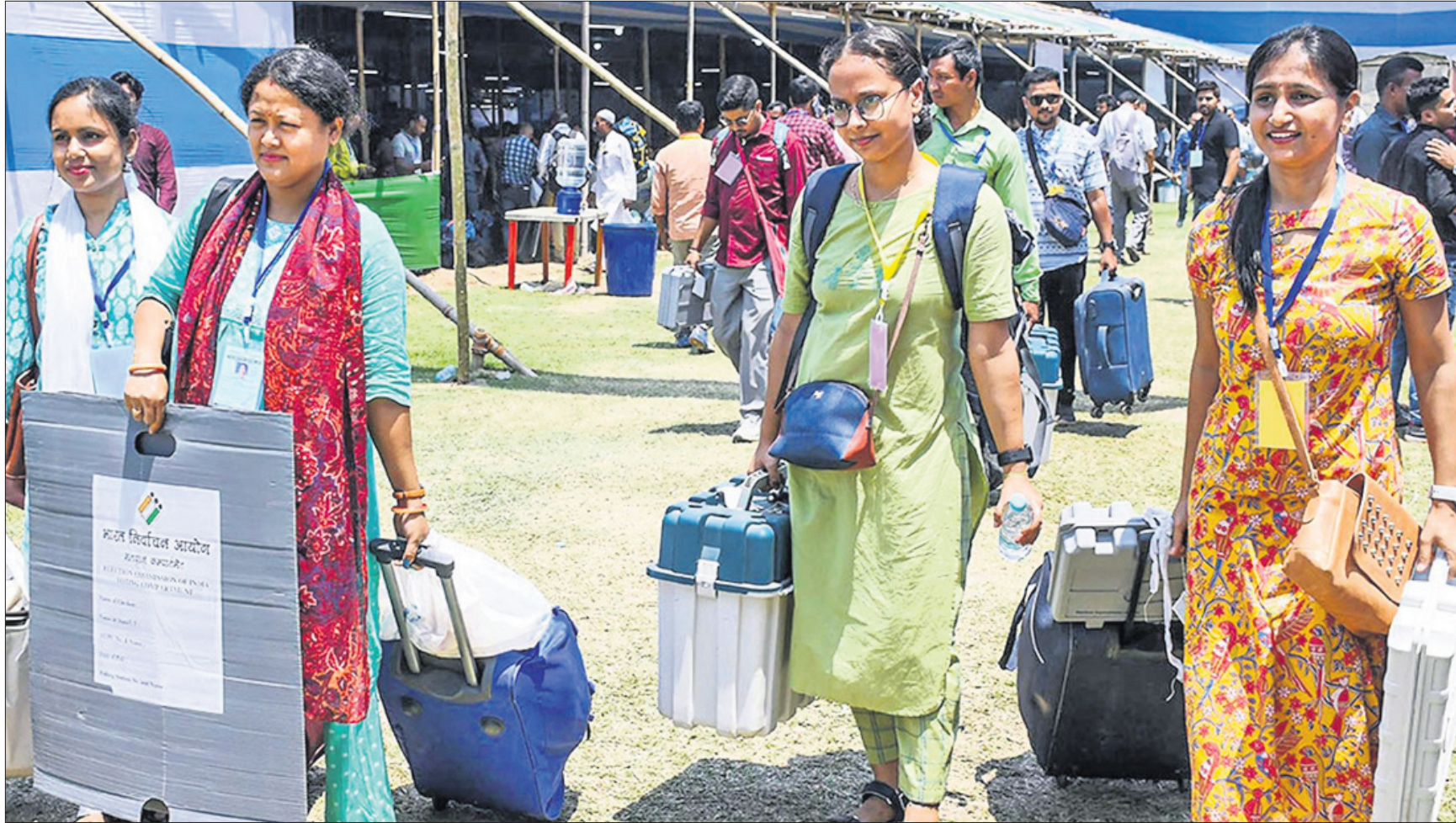
ଦିଲ୍ଲୀରୁ ପୁରୀ ଆସିବା ପାଇଁ ଆସାମୀୟ ଯାତ୍ରୀମାନେ ନୂଆଦିଲ୍ଲାରେ ପୋଲିସ୍ ଅଫିସରମାନଙ୍କ ସହିତ ସମାପନକ ଭାବରେ ପାଇଁ ଲାଗିଥିବା ଅନାମୟ ଉପକରଣ ନେଇ ଯାଉଛନ୍ତି।

ନୂଆଦିଲ୍ଲା ଗୋପନୀୟତା ଆକ୍ଟ ଅନୁଯାୟୀ ଏକ ନୂଆ ପିଏସ୍ ଆଇ ପ୍ରଦାନ ପାଇଁ ସମାପ୍ତ ହୋଇଛି। ଏହି ଆଇନରେ ସୁପ୍ରିମକୋର୍ଟର ଉଚ୍ଚତମ ମାମଲାରେ ଗୋପନୀୟତା ଆକ୍ଟର ଉପରେ ପ୍ରଭାବ ପଡ଼ିବ ବୋଲି କୁହାଯାଇଛି।