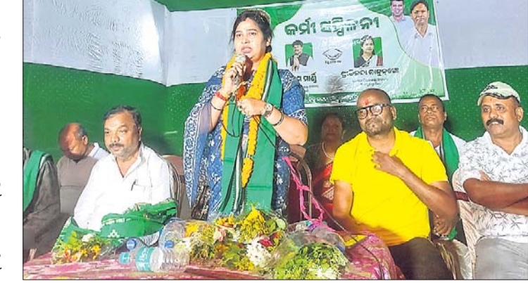
ମଞ୍ଚରେ ଉପସ୍ଥିତ ବିଧାୟକ ପ୍ରାର୍ଥୀ ଓ ଅନ୍ୟମାନେ।