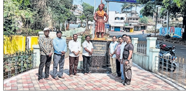
ଅଭିଯାନରେ ବରପୁତ୍ରଙ୍କ ପ୍ରତିମୂର୍ତ୍ତିର ଶ୍ରଦ୍ଧାଧାନ ଅର୍ପଣ କରୁଛନ୍ତି ।

କୃଷ୍ଣଚନ୍ଦ୍ର ଗଜପତିଙ୍କ ଜୟନ୍ତୀ ପାଳିତ ହୋଇଛି । କୟପୁର ଉପଖଣ୍ଡ ପ୍ରଶାସନ ତରଫରୁ ପ୍ରତିମୂର୍ତ୍ତି ନିକଟରେ ପୁଷ୍ପମାଳ୍ୟ ଅର୍ପଣ କରି କୟନ୍ତୀ ପାଳନ କରାଯାଇଥିଲା ।