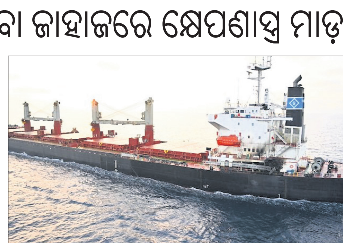
ଭାରତ ଆସୁଥିବା ଜାହାଜରେ କ୍ଷେପଣାସ୍ତ୍ର ମାଡ଼

ଚେରାପୁର, ୨୭/୪ ଉତ୍ତରାଖଣ୍ଡର ନୈନିତାଲ ଜିଲ୍ଲାରେ ଜଙ୍ଗଲ ନିଆଁ ବ୍ୟାପିବାରେ ଲାଗିଥିବାବେଳେ ଏହାକୁ ନିୟନ୍ତ୍ରଣ କରିବା ପାଇଁ ବାୟୁସେନା ହେଲିକପ୍ଟରକୁ ନିୟୋଜିତ କରାଯାଇଛି। ଶୁକ୍ରବାର ଜଙ୍ଗଲ ନିଆଁ ପାଇଁ ଅଧିକାଂଶ ହାତକୋର୍ଟ କଲୋନି ନିକଟରେ ପହଞ୍ଚିଥିବାବେଳେ ସରକାରଙ୍କ ତିନି ବଡ଼ାଲି ଦେଇଛି। ଏମ୍ଆଇ-୧୭ ହେଲିକପ୍ଟର ନିକଟସ୍ଥ ହୁଏତ ଜଳ ସଂଗ୍ରହ କରି ଏହାକୁ ଜଳପୁରା ଜଙ୍ଗଲରେ ପକାଉଛି। ନିଆଁ ଲିଭାଇବା ପାଇଁ ସବୁ ପ୍ରକାର ଉଦ୍ୟମ ଜାରି ରହିଥିବା ମୁଖ୍ୟମନ୍ତ୍ରୀ ପୁଷ୍ପର ସିଂ ଧାନି କହିଛନ୍ତି। ସେ ହାଲଦ୍ୱାନିଠାରେ ଜଙ୍ଗଲ ବିଭାଗ ଅଧିକାରୀମାନଙ୍କ ସହ ବୈଠକରେ ଛୁଟି ସମାକ୍ଷା କରିଛନ୍ତି। ନୈନିତାଲର ୩୯ଟି ସ୍ଥାନରେ ନିଆଁ ଲାଗିଥିବାବେଳେ ୩୩.୩୪ ହେକ୍ଟର ଜଙ୍ଗଲ ନଷ୍ଟ ହୋଇଗଲାଣି।