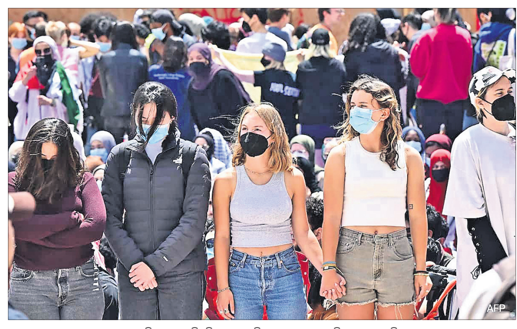
ଆମେରିକାର ଏକ ବିଶ୍ୱବିଦ୍ୟାଳୟ ପରିସରରେ ଛାତ୍ରାଛାତ୍ରୀ ବିକ୍ଷୋଭ କରୁଛନ୍ତି।

ନୂୟାର୍କ, ୨୭/୪ ଗାଜାରେ ଇସ୍ରାଏଲ ଆକ୍ରମଣକୁ ବିରୋଧ କରି ଆମେରିକାରେ ଛାତ୍ର ଆନ୍ଦୋଳନ ଜାରି ରହିଛି। ଶୀର୍ଷ ବିଶ୍ୱବିଦ୍ୟାଳୟଗୁଡ଼ିକର ଛାତ୍ରାଛାତ୍ରୀ ଏହି ଆନ୍ଦୋଳନରେ ସାମିଲ ହୋଇ ଇସ୍ରାଏଲରେ ପୁଞ୍ଜିନିବେଶ ଓ ଅତ୍ୟାଚାରଗଣା ବନ୍ଦ କରିବାକୁ ଦାବି କରିଛନ୍ତି। ସେମାନଙ୍କ ଦାବି ପୂରଣ ନ ହେବା ପର୍ଯ୍ୟନ୍ତ ଆନ୍ଦୋଳନକୁ ଓହରିବେ ନାହିଁ ବୋଲି ଛାତ୍ରାଛାତ୍ରୀ ଜିଦ୍ରେ ଅଟକ ରହିଛନ୍ତି। ବର୍ତ୍ତମାନ ସୁଦ୍ଧା ୫୫୦ରୁ ଊର୍ଦ୍ଧ୍ୱ ଆନ୍ଦୋଳନରେ ଛାତ୍ରାଛାତ୍ରୀ ଗିରଫ ହେଲେଣି। ହାର୍ଭର୍ଡ, କଲିଫୋର୍ନିଆ, ଯାଲୋ, ୟୁସି ବେର୍କେଲି ଓ ଅନ୍ୟ ୟୁନିଭର୍ସିଟି କ୍ୟାମ୍ପସ୍ରେ ଇସ୍ରାଏଲ ବିରୋଧରେ ବ୍ୟାପକ ଆନ୍ଦୋଳନ ଜାରି ରହିଛି। ଅନ୍ୟପକ୍ଷରେ ଅନଧିକୃତ ଭାବେ ଛାତ୍ରାଛାତ୍ରୀ ଆନ୍ଦୋଳନ ଚଳାଇଥିବା ଅଭିଯୋଗ କରି ବିଶ୍ୱବିଦ୍ୟାଳୟ କର୍ତ୍ତୃପକ୍ଷ ସେମାନଙ୍କୁ ହଟାଇଦେବା ପାଇଁ ପୋଲିସର ସହାୟତା ନେଉଛନ୍ତି। ଗତ ୨ ଦିନ ହେଲା