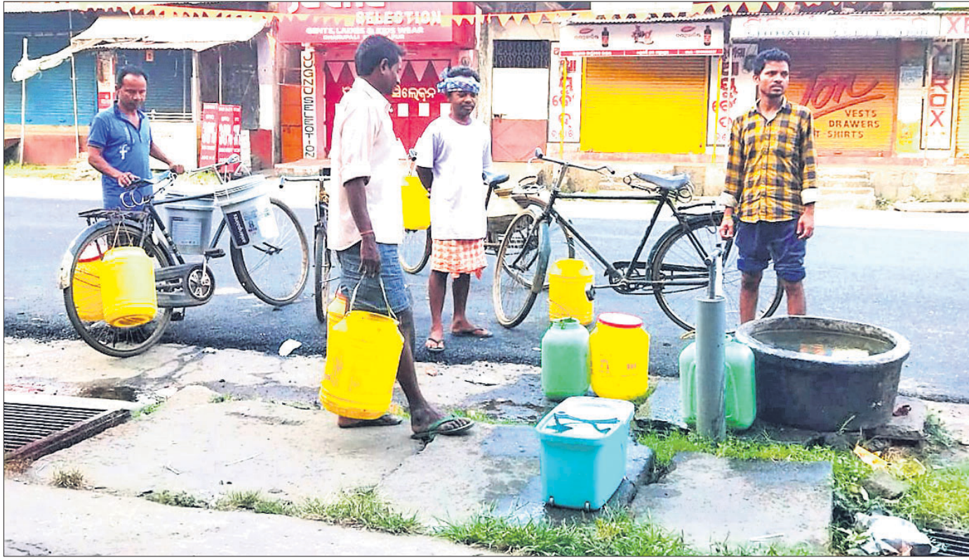
ସମଲପୁର ମହାନଗର ନିଗମ ଅନ୍ତର୍ଗତ ଧନୁପାଲି ଛକସ୍ଥିତ ସ୍ୱାଘୋଷ୍ଟରେ ପାଣି ନେବାକୁ ଭିଡ଼ ।