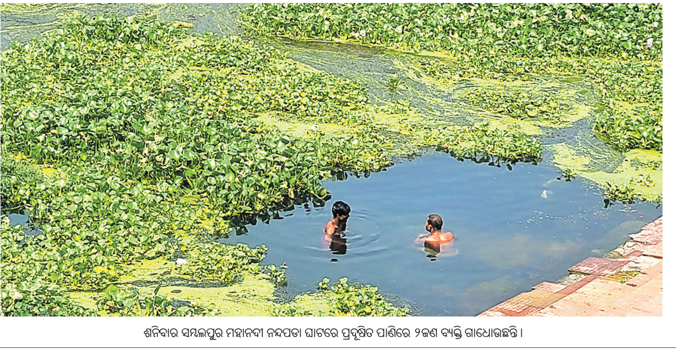
ଶନିବାର ସମ୍ଭବପୁର ମହାନଦୀ ନନ୍ଦପଡ଼ା ଘାଟରେ ପ୍ରଦୂଷିତ ପାଣିରେ ୨ଜଣ ବ୍ୟକ୍ତି ଗାଧୋଇଛନ୍ତି।