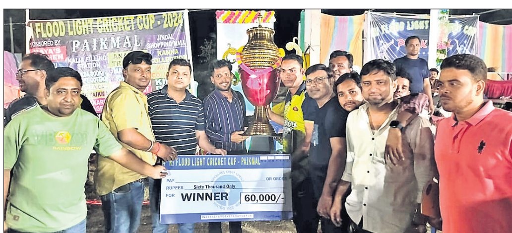
ଆର.ଆଇ.ପ୍ରଫେସନାଲଟ କ୍ରିକେଟ ଚୁର୍ଣ୍ଣମେଷ୍ଟରେ ଅତିଥିକ ସହ ଖେଳାଳି।

ବରଗଡ଼ ଜିଲ୍ଲା ପାଇକମାଳ ହାଇସ୍କୁଲ ଖେଳପଡ଼ିଆଠାରେ ଚାରି ଦିନ ଧରି ଚାଲିଥିବା ୪ତମ ଆର.ଆଇ.ପ୍ରଫେସନାଲଟ କ୍ରିକେଟ ଚୁର୍ଣ୍ଣମେଷ୍ଟ ଉନ୍ନୟନିତ ହୋଇଯାଇଛି। ଏହି ଚୁର୍ଣ୍ଣମେଷ୍ଟରେ ଓଡ଼ିଶାର ବନ୍ଧାବନ୍ଧା ୧୬ ଗୋଟି ଦଳ ଅଂଶଗ୍ରହଣ କରିଥିବାବେଳେ ସମସ୍ତଙ୍କୁ ପଛରେ ପକାଇ ଏମ.ୟୁ.ସି.ଭି.ଭୁବନେଶ୍ୱର ଓ ଅନୁବା ଇଲେଭେନ୍ ପଦ୍ମପୁର ଫାଇନାଲକୁ ପ୍ରବେଶ କରିଥିଲେ। ଫାଇନାଲ ମ୍ୟାଚ ତିନି ଗୋଟି ଫର୍ମାଟ ଯଥା ୮, ୬, ୫ ଓଭରରେ କରାଯାଇଥିଲା। ପ୍ରଥମ ଫାଇନାଲ ମ୍ୟାଚରେ ଏମ.ୟୁ.ସି.ଭି.ଭୁବନେଶ୍ୱର ୨୮ ରନରେ ବିଜୟ ହୋଇଥିଲା। ଦ୍ୱିତୀୟ ମ୍ୟାଚରେ ଅନୁବା ଇଲେଭେନ୍ ପଦ୍ମପୁର ୧୦ ଉଇକେଟରେ ବିଜୟ ଲାଭ କରିଥିଲା। ଉଭୟ ଦଳ ଗୋଟିଏ ଗୋଟିଏ ମ୍ୟାଚ ଜିତି ସମାନ ସ୍ଥିତି ୧-୧ ରେ ରହିଥିଲେ। ତୃତୀୟ ତଥା ଅନ୍ତିମ ମ୍ୟାଚରେ ଏମ.ୟୁ.ସି.ଭି.ଭୁବନେଶ୍ୱର ପ୍ରଥମେ ବ୍ୟାଟି କରି ନିର୍ଦ୍ଧାରିତ ୫ ଓଭରରେ ୭୭ ଉଇକେଟ ହରାଇ ୪୯ ରନ ସଂଗ୍ରହ କରିଥିଲା। ୫୦ ରନର ଲକ୍ଷ୍ୟ ପିଛା କରୁଥିବା ଅନୁବା ଇଲେଭେନ୍ ପଦ୍ମପୁର ଦଳ