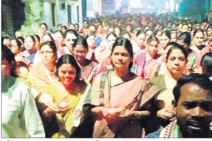
ମହିଳାମାନେ ଶୋଭାଯାତ୍ରାରେ ଯାଉଛନ୍ତି।