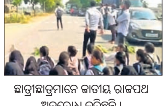
ଛାତ୍ରଛାତ୍ରୀମାନେ ଜାତୀୟ ରାଜପଥ ଅବରୋଧ କରିଛନ୍ତି ।

ବୌଦ୍ଧ, ୨୭୪୪(ଅଜିତ କୁମାର ବାରିକ): ବୌଦ୍ଧ ଜିଲ୍ଲାରେ ଏକମାତ୍ର ସରକାରୀ ଆଦର୍ଶ ସ୍ନାତକ ମହାବିଦ୍ୟାଳୟ ଥିବା ବେଳେ ମହାବିଦ୍ୟାଳୟରେ ବିଭିନ୍ନ ସମସ୍ୟା ଲାଗି ରହିଛି । ବୌଦ୍ଧ ସହରଠାରୁ ମାତ୍ର ୬ କିମି ଦୂର ବାମଖଣ୍ଡାରେ ଆଦର୍ଶ ମହାବିଦ୍ୟାଳୟ ରହିଛି । କିନ୍ତୁ ମହାବିଦ୍ୟାଳୟରେ ପାନୀୟ ଜଳ ସମସ୍ୟା, ବିଦ୍ୟୁତ କାଟ, ଅଣଛାତ୍ରଙ୍କ ଅଧ୍ୟାୟ ପ୍ରବେଶ ଯୋଗୁଁ ଛାତ୍ର ଅଶାନ୍ତି ଲାଗି ରହିଛି । ଏ ନେଇ ଅଭିଯୋଗ କରି ଆସୁଥିଲେ ମଧ୍ୟ ମହାବିଦ୍ୟାଳୟ କର୍ତ୍ତୃପକ୍ଷ ଆଦର୍ଶ ପଦକ୍ଷେପ ନେଇ ନ ଥିବା ଛାତ୍ରଛାତ୍ରୀ ଅଭିଯୋଗ କରିଛନ୍ତି । ଏହାର ପ୍ରତିବାଦରେ ଶନିବାର ଦିନ ଛାତ୍ରଛାତ୍ରୀମାନେ ଜାତୀୟ ରାଜପଥ ଅବରୋଧ କରିଥିଲେ । ଫଳରେ ଉଭୟ ପାର୍ଶ୍ୱରେ ଯାନବାହନ ଅଟକି ରଖିଥିଲା । ଖବର ପାଇ ବୌଦ୍ଧ ପୋଲିସ ଘରଗାନ୍ଧୁକରେ ପହଞ୍ଚିବା ସହ ଛାତ୍ରଛାତ୍ରୀଙ୍କ ସହ ଆଲୋଚନା କରିଥିଲେ । ଅଗାଧୀ ଦିନର ସମାଧାନ ପାଇଁ ପ୍ରତିଶ୍ରୁତି ମିଳିବା ପରେ ରାସ୍ତାସରୋଧ ହଟିଥିଲା ।