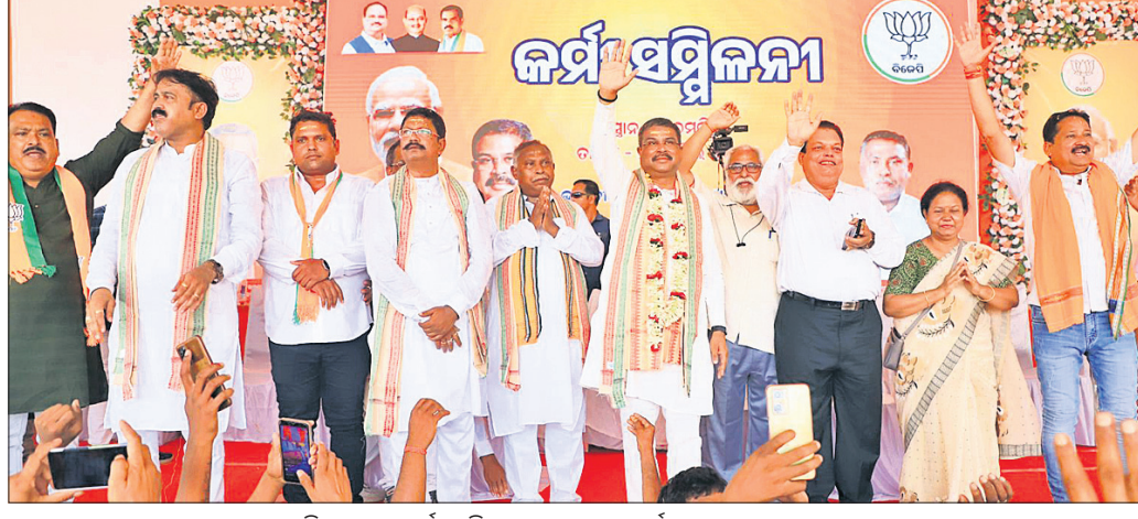
ଅଭିଳାଷାରେ କର୍ମୀ ସମ୍ମିଳନୀରେ ବଳୀୟ ପ୍ରାର୍ଥୀମାନଙ୍କ ସହ କେନ୍ଦ୍ରମନ୍ତ୍ରୀ।

ରାଜ୍ୟରେ ୬୦ ପ୍ରତିଶତ ମହିଳା ରତ୍ନହୀନତା ଏବଂ ଶିଶୁମାନେ ଅପସ୍ତମ୍ଭିତ ଶିକାର ହେଉଛନ୍ତି। ଏହାକୁ ମୁଖ୍ୟମନ୍ତ୍ରୀ ବିକାଶ କଳ୍ପନା କି। ଓଡ଼ିଶା କାହାର ବ୍ୟକ୍ତିଗତ ସମ୍ପତ୍ତି ଲୁଚାଇ ଏକକ୍ରମକୁ ବଦଳାଇବା ପାଇଁ ନିର୍ବାଚନ ପ୍ରଚାର ଲୋକମାନେ ଯାହାକୁ ଚାହୁଁଛନ୍ତି ତାକୁ ଜିତାଇବେ। ପ୍ରଧାନମନ୍ତ୍ରୀ ନନ୍ଦେନ୍ଦ୍ର ମୋଦିଙ୍କ ପ୍ରତି ଲୋକପ୍ରିୟତା କ୍ରମାଗତ