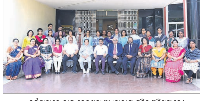
କର୍ମଶାଳାରେ ଭାଗ ନେଇଥିବା ଅଧିକାରୀଙ୍କ ସହିତ ଅତିଥିମାନେ।