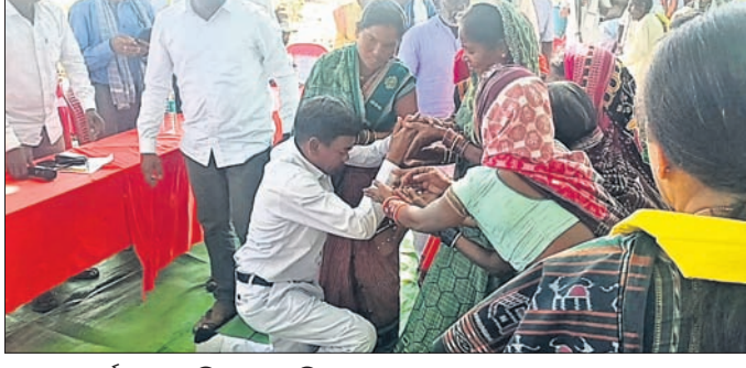
ସ୍ୱାଧୀନ ପ୍ରାର୍ଥୀ ଭୋଟ ଭିକ୍ଷା କରୁଛନ୍ତି।