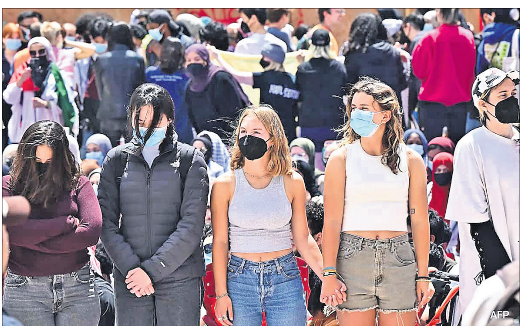
ଆମେରିକାର ଏକ ବିଶ୍ୱବିଦ୍ୟାଳୟ ପରିସରରେ ଛାତ୍ରଛାତ୍ରୀ ବିକ୍ଷୋଭ କରୁଛନ୍ତି।

ଲୁୟସିଆନା, ୨୭/୪ ଗାଜାରେ ଇସ୍ତାଏଲ୍ ଆକ୍ରମଣକୁ ବିରୋଧ କରି ଆମେରିକାରେ ଛାତ୍ର ଆନ୍ଦୋଳନ ଜାରି ରହିଛି। ଶୀର୍ଷ ବିଶ୍ୱବିଦ୍ୟାଳୟକୁ ନିକଟ ଛାତ୍ରଛାତ୍ରୀ ଏହି ଆନ୍ଦୋଳନରେ ସାମିଲ ହୋଇ ଇସ୍ତାଏଲ୍‌ରେ ପୁଞ୍ଜିନିବେଶ ଓ ଅସ୍ତ୍ରୋପଯୋଗୀ ବନ୍ଦ କରିବାକୁ ଦାବି କରିଛନ୍ତି। ସେମାନଙ୍କ ଦାବି ପୂରଣ ନ ହେବା ପର୍ଯ୍ୟନ୍ତ ଆନ୍ଦୋଳନକୁ ଓହରିବେ ନାହିଁ ବୋଲି ଛାତ୍ରଛାତ୍ରୀ ଜିଦ୍ରେ ଅଟକ ରହିଛନ୍ତି। ବର୍ତ୍ତମାନ ସୁଦ୍ଧା ୫୫୦ରୁ ଊର୍ଦ୍ଧ୍ୱ ଆନ୍ଦୋଳନରେ ଛାତ୍ରଛାତ୍ରୀ ଗିରଫ ହେଲେଣି। ହାର୍ଭର୍ଡ୍, କଲିଫର୍ଣ୍ଣିଆ, ଯାଲେ, ୟୁସି ବେର୍କେଲେ ଓ ଅନ୍ୟ ୟୁନିଭର୍ସିଟି କ୍ୟାମ୍ପସ୍‌ରେ ଇସ୍ତାଏଲ୍ ବିରୋଧରେ ବ୍ୟାପକ ଆନ୍ଦୋଳନ ଜାରି ରହିଛି। ଅନ୍ୟପକ୍ଷରେ ଅନଧିକୃତ ଭାବେ ଛାତ୍ରଛାତ୍ରୀ ଆନ୍ଦୋଳନ ଚଳାଇଥିବା ଅଭିଯୋଗ କରି ବିଶ୍ୱବିଦ୍ୟାଳୟ କର୍ତ୍ତୃପକ୍ଷ ସେମାନଙ୍କୁ ହଟାଇଦେବା ପାଇଁ ପୋଲିସ୍‌ରେ ସହାୟତା ନେଉଛନ୍ତି। ଗତ ୨ ଦିନ ହେଲା