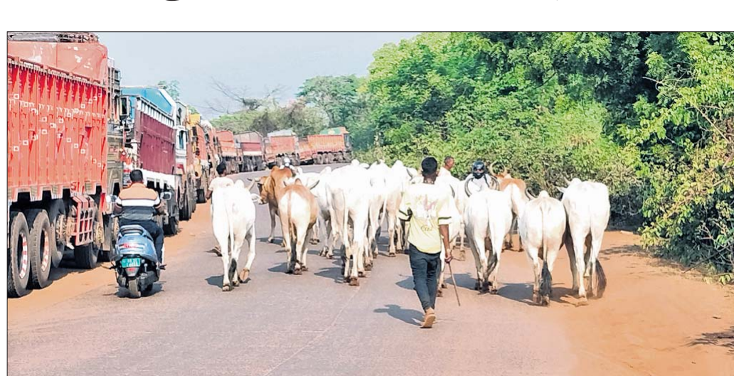
ଟମକା-ମଙ୍ଗଳପୁର ରାସ୍ତାରେ ଗୋଟାଲାଣ କରାଯାଉଛି ।

କାଳିଆପାଣି, ୨୭୪ (ଅସିତ ମହାନ୍ତି): କାଳିଆପାଣି ଖଣି ଅଞ୍ଚଳରେ ଗୋଟାଲାଣ ବନ୍ଦ ହେଉନାହିଁ । ବେପାରୀମାନେ ପ୍ରତି ଶୁକ୍ରବାର ଓ ଶନିବାର ଶହଶହ ଗୋରୁଙ୍କୁ ବେଧତକ ଭାବେ ଚାଲାଣ କରୁଛନ୍ତି । ହେଲେ ସେମାନଙ୍କୁ ଲଗାମ ଦେବାକୁ କେହି ନ ଥିବା ଦେଖିବାକୁ ମିଳୁଛି । ଗୋଟାଲାଣ ନେଇ ଖବର ପ୍ରକାଶ ପରେ କିଛି ଦିନ ସହା ବନ୍ଦ ରହିଥିଲା । ହେଲେ ୨୭ ତାରିଖ ଶନିବାର ୧୦୦ରୁ ଊର୍ଦ୍ଧ୍ୱ ଗୋରୁଙ୍କୁ କଲରଙ୍ଗି ଡାବା ଛକ ଦେଇ ଟମକା-ମଙ୍ଗଳପୁର ରାସ୍ତାରେ ୫ଜଣ ଲୋକ ଘଉଡ଼ାଇ ନେଉଥିବା ଦେଖା ଯାଇଛି । ଶହଶହ ଗୋରୁଙ୍କୁ ହାଟକୁ ନିଶି ନିକଟ ଗାଁରେ ରଖି ତା ପର ଦିନ ଯାଜପୁର, ଡେକାନାଲ ଓ କେନ୍ଦୁଝର ଜିଲାର ସାମାନ୍ତ ରାସ୍ତାରେ ଚଳାଇ ଚଳାଇ ନେଉଛନ୍ତି । ବେପାରୀମାନେ ଶୁକ୍ରବାର ଡେକାନାଲ ଜିଲାର ଜିରାକ ଓ ଯାଜପୁର ଜିଲାର ସୁକିୟା ହରିପୁର ହାଟରୁ ଗୋରୁ ନିଶି ଚିଲୁଡ଼ିପାକ ନଗଡ଼ା ପାହାଡ଼ ଦେଇ କେନ୍ଦୁଝର ଜିଲାର ପଲ୍ଲୀସପାଳ ଅଞ୍ଚଳକୁ ନେଇଥାନ୍ତି । ସେଠାରୁ କଲିକତା ଚାଲାଣ କରିଥାନ୍ତି । ଅମାତ୍ୟଙ୍କ ଭାବେ ଗୋରୁଙ୍କୁ ହକଦାହିଁ ଗୋଡ଼କୁ ଛଦି ନେଉଛନ୍ତି । ଏହାକୁ କେତେଜଣ ବଜରଙ୍ଗ ଦଳ କର୍ମୀ ବିରୋଧ କରୁଛନ୍ତି । ଆଗାମୀ ଦିନରେ ସେମାନେ ଗୋରୁପଲଙ୍କୁ ଅଟକ ରଖିବେ ବୋଲି ଚେତାବନୀ ଦେଇଛନ୍ତି । ତେବେ ସମ୍ପୂର୍ଣ୍ଣ ରାସ୍ତା ଦେଇ ବେଆଇନ ଭାବେ ବେପାରୀ ଗୋଟାଲାଣ କରୁଥିବାବେଳେ କାହିଁକି ପୋଲିସ୍ ସେମାନଙ୍କ ବିରୋଧରେ କାର୍ଯ୍ୟାନୁଷ୍ଠାନ ଗ୍ରହଣ କରୁନାହିଁ ତାହା ଲୋକଙ୍କ ମନରେ ସହେଦ ହୋଇଛି । ଏନେଇ କାଳିଆପାଣି ପୋଲିସର ପ୍ରତିକ୍ରିୟା ମିଳି ପାରିନାହିଁ ।