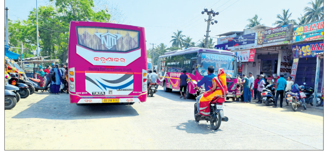
ରାସ୍ତାକଡ଼ରେ ଅଟକି ଯାତ୍ରୀ ନେଉଥିବା ବସ ।

ଦୀର୍ଘ ଦଶନ୍ଧି ଧରି କଟକ-ତାନ୍ଦବାଲି ରାଜ୍ୟ ରାଜପଥ ଦେଇ ଆଳିକୁ ଦୈନିକ ୫୦ରୁ ଉର୍ଦ୍ଧ୍ୱ ଘରୋଇ ବସ୍ କଟକ ଭୁବନେଶ୍ୱର ଯାତାୟାତ କରୁଛି । ବସ୍ରେ ଯିବା ନିମନ୍ତେ ଯାତ୍ରୀମାନେ ଆଳି ଅନୁପୂର୍ଣ୍ଣ ପଡ଼ିଆ ସମେତ ବିଭିନ୍ନ ଛକରେ ବସ୍କୁ ଅପେକ୍ଷା କରିଥାନ୍ତି । ବସ୍ତୁତ୍ରିକ ରାଜ୍ୟ ରାଜପଥ ଉପରେ ଠିଆ ହୋଇ ଯାତ୍ରୀମାନଙ୍କୁ ଗଡ଼ବ୍ୟସ୍ତକକୁ ନେବା ଆଣିବା କରିଥାନ୍ତି । ଯାତ୍ରୀମାନେ ଯେଉଁଠି ବସ୍ ଚାଲିଥାନ୍ତି ସେଠାରେ ଆଶ୍ରୟସ୍ଥଳୀର ବ୍ୟବସ୍ଥା ନ ଥିବାରୁ ଯାତ୍ରୀମାନେ ଖରା, ବର୍ଷା ଓ ଶୀତରେ ବସ୍ତୁ କଷ୍ଟରେ ଯାତାୟାତ କରିଥାନ୍ତି । ଏହାକୁ ଲକ୍ଷ୍ୟ କରି ଆଳିର କେତେଜଣ ବୁଦ୍ଧିଜୀବୀ ସ୍ଥାନୀୟ ଅଞ୍ଚଳରେ ବସ୍ତୁଷ୍ଟାଣ୍ଡ, ଯାତ୍ରୀ ଆଶ୍ରୟସ୍ଥଳୀ ନିର୍ମାଣ ନିମନ୍ତେ ଦାବି କରୁଥିଲେ । ଏହାକୁ ଲକ୍ଷ୍ୟ କରି ରାଜ୍ୟ ସରକାର କଟକ-ତାନ୍ଦବାଲି ମୁଖ୍ୟ ସିଡିପିଓଙ୍କ ପ୍ରଶ୍ନର ଉତ୍ତର ଦେଇ ପାରି ନ ଥିଲେ । ସେଠାରେ ଉପସ୍ଥିତ ଥିବା ଅଭିଭାବକ ଓ ଗ୍ରାମବାସୀ ସମସ୍ତ ଘଟଣା ସମ୍ପର୍କରେ ସିଡିପିଓଙ୍କୁ ଅବଗତ କରିଥିଲେ । ଖୁବ୍‌ଶୀଘ୍ର ଏହି ସମସ୍ୟାର ସମାଧାନ ହେବ ବୋଲି ସିଡିପିଓ ଗ୍ରାମବାସୀଙ୍କୁ ପ୍ରତିଶ୍ରୁତି ଦେଇ ଫେରିଥିଲେ ।