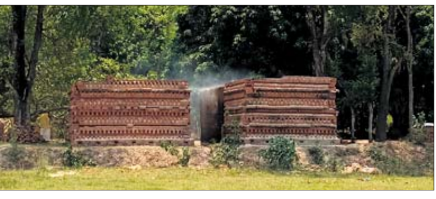
ଧର୍ଯ୍ୟଶାଳା ତହସିଲ ଅଞ୍ଚଳରେ ଇଟାପୋଡ଼ା ଚାଲିଛି ।