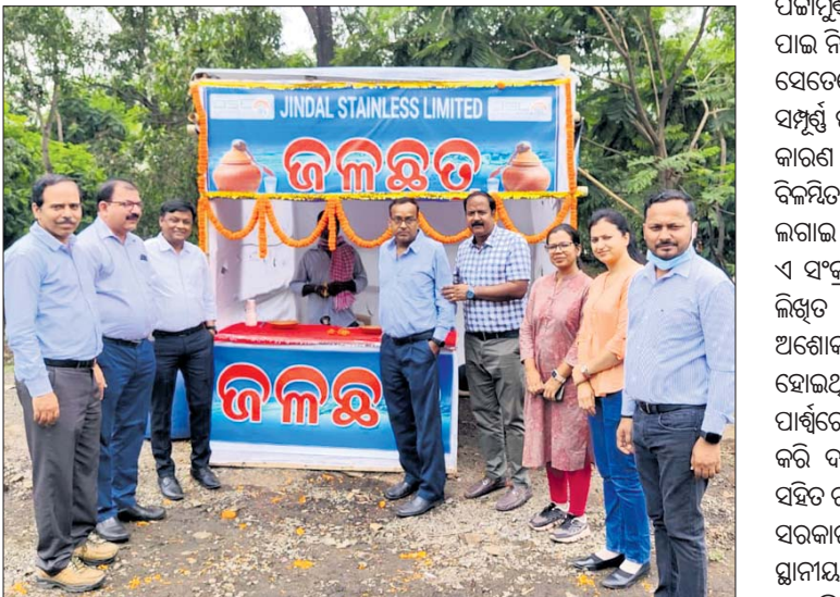
ଜିନ୍ଦଲ ଷ୍ଟେନ୍‌ଲେସ୍‌ର ଅଧିକାରୀ ଜଳଛତ୍ରକୁ ଉଦ୍‌ଘାଟନ କରୁଛନ୍ତି ।