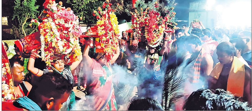
ଠାକୁରାଣୀ ଯାତ୍ରାରେ ଘଟ ପରିକ୍ରମା କରାଯାଇଛି

ଶ୍ରୀରାମ ବାଣ ନିଷେପ କରିବା ପରେ ତାହା ଧରାଣୀୟା ହୋଇଥିଲା। ଏହି ଉତ୍ସବ ଦେଖିବାକୁ ଲୋକଙ୍କ ମଧ୍ୟରେ ପ୍ରବଳ ଆଗ୍ରହ ପ୍ରକାଶ ପାଇଥିଲା। ଏଥି ନିମନ୍ତେ ପୋଲିସ୍ ବନ୍ଦୋବସ୍ତ କରାଯାଇଥିବା ବେଳେ ଶାନ୍ତି ଶୁଖିଳା ରକ୍ଷା କରିବାକୁ ଉଦ୍ୟମ କରାଯାଇଥିଲା।