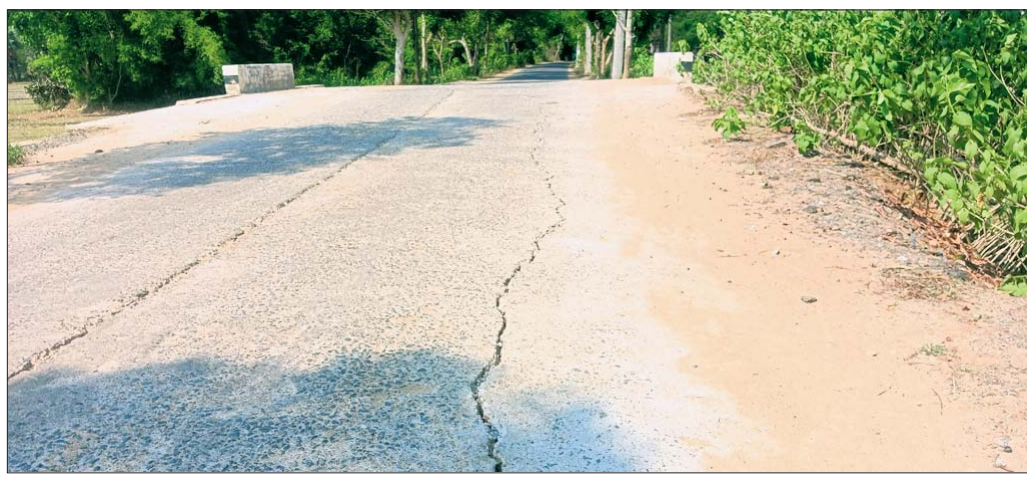
ବିଞ୍ଚାରପୁର-ମଧୁପୁର ରାସ୍ତାରେ ସୃଷ୍ଟି ହୋଇଥିବା ଫାଟ ।

ଓଡ଼ାର ଲୋଡିଂ ଚାଲି ପରିବହନ ଲିଫ୍ ପରିମାଣଠାରୁ ଅଧିକ ଉତ୍ପାଦନ ରାସ୍ତା ମରାମତି ନାମରେ ହରିଲୁଟ