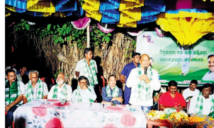
ବିଜେଡି ମିଶ୍ରଣ ପର୍ବରେ ସାମିଲ ହୋଇଥିବା ନେତା ଓ କର୍ମୀ ।