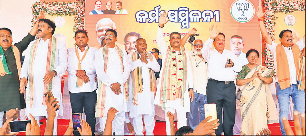
ଅନୁଲିଆଠରେ କର୍ମୀ ସମ୍ମିଳନୀରେ ଦଳୀୟ ପ୍ରାର୍ଥୀମାନଙ୍କ ସହ କେନ୍ଦ୍ରମନ୍ତ୍ରୀ।

ରାଜ୍ୟରେ ୬୦ ପ୍ରତିଶତ ମହିଳା ରତ୍ନହୀନତା ଏବଂ ଶିଶୁମାନେ ଅପସ୍ତୁଷିତ ହୋଇଛନ୍ତି। ଏହାକୁ ମୁଖ୍ୟମନ୍ତ୍ରୀ ବିକାଶ କଳ୍ପନା କି। ଓଡ଼ିଶା କାହାର ବ୍ୟକ୍ତିଗତ ସମ୍ପତ୍ତି ନୁହେଁ। ଏକକଳ୍ପବାଦ କିମ୍ବା ରାଜତନ୍ତ୍ର ନୁହେଁ। ଏହା ଗଣତନ୍ତ୍ର। ଲୋକମାନେ ଯାହାକୁ ଚାହଁବେ ତାକୁ ଜିତାଇବେ। ପ୍ରଧାନମନ୍ତ୍ରୀ ନରେନ୍ଦ୍ର ମୋଦିଙ୍କ ପ୍ରତି ଲୋକପ୍ରିୟତା କ୍ରମାଗତ