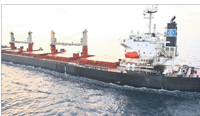
ଚେଲ ବ୍ୟବସାୟରେ ସାମିଲ ଥିଲା। ଏହା ଆତେନ୍‌ରେ ବିଭିନ୍ନ ଦେଶର ବାଣିଜ୍ୟିକ ଜାହାଜ ଉପରେ କ୍ଷେପଣାସ୍ତ୍ର ଓ ଡ୍ରୋନ୍ ଆକ୍ରମଣ କରି ରଖିଛନ୍ତି। ଯେମେନ୍‌ର ସାଦା ଆଣ୍ଡ୍ରୋମେଡା ହୁତି ବିଦ୍ରୋହୀମାନେ ଆମେରିକା ଓ ବ୍ରିଟେନ୍ ଜାହାଜକୁ ଗାନ୍ଧେଇ କରିଆସୁଛନ୍ତି। କିଛିଦିନ ହେଲା ଆକ୍ରମଣ ବନ୍ଦ ଥିଲାବେଳେ ପୁଣିଥରେ ଏକ ଚେଲବାହୀ ଜାହାଜ ଉପରେ ଆକ୍ରମଣ ହୋଇଛି। କ୍ଷେପଣାସ୍ତ୍ର ମାଡ଼ରେ ଜାହାଜ କ୍ଷତିଗ୍ରସ୍ତ ହୋଇଥିବା ଏହାର ମାଲିକ ଦାବି କରିଛନ୍ତି। ଉକ୍ତ ଜାହାଜ ରୁଷିଆରୁ

ଲୋହିତ ସାଗର ଦେଇ ରୁଷିଆରୁ ଚେଲ ଆଣି ଭାରତ ଆସୁଥିବା ଏକ ଜାହାଜ ଉପରେ କ୍ଷେପଣାସ୍ତ୍ର ଆକ୍ରମଣ ହୋଇଛି। ଯେମେନ୍‌ର ହୁତି ଆତଙ୍କବାଦୀ ଏହି ଆକ୍ରମଣ କରିଥିବା କହିଛନ୍ତି। ଆଣ୍ଡ୍ରୋମେଡା ଷ୍ଟାର ନାମକ ଏହି ଚେଲବାହୀ ଜାହାଜ ପୂର୍ବରୁ ବ୍ରିଟିଶ ମାଲିକାନାରେ ଥିବାବେଳେ ବର୍ତ୍ତମାନ ସିଡେଲ୍ ନାଗରିକ ଏହାର ମାଲିକ ବୋଲି ଜଣାପଡ଼ିଛି। ଇସ୍ତାଏଲ୍-ହମାସ୍ ଯୁଦ୍ଧ ଆରମ୍ଭରୁ ପାଲେଷ୍ଟିନୀୟ ସମର୍ଥନ କରୁଥିବା ହୁତି ବିଦ୍ରୋହୀମାନେ ଆମେରିକା ଓ ବ୍ରିଟେନ୍ ଜାହାଜକୁ ଗାନ୍ଧେଇ କରିଆସୁଛନ୍ତି। କିଛିଦିନ ହେଲା ଆକ୍ରମଣ ବନ୍ଦ ଥିଲାବେଳେ ପୁଣିଥରେ ଏକ ଚେଲବାହୀ ଜାହାଜ ଉପରେ ଆକ୍ରମଣ ହୋଇଛି। କ୍ଷେପଣାସ୍ତ୍ର ମାଡ଼ରେ ଜାହାଜ କ୍ଷତିଗ୍ରସ୍ତ ହୋଇଥିବା ଏହାର ମାଲିକ ଦାବି କରିଛନ୍ତି। ଉକ୍ତ ଜାହାଜ ରୁଷିଆରୁ