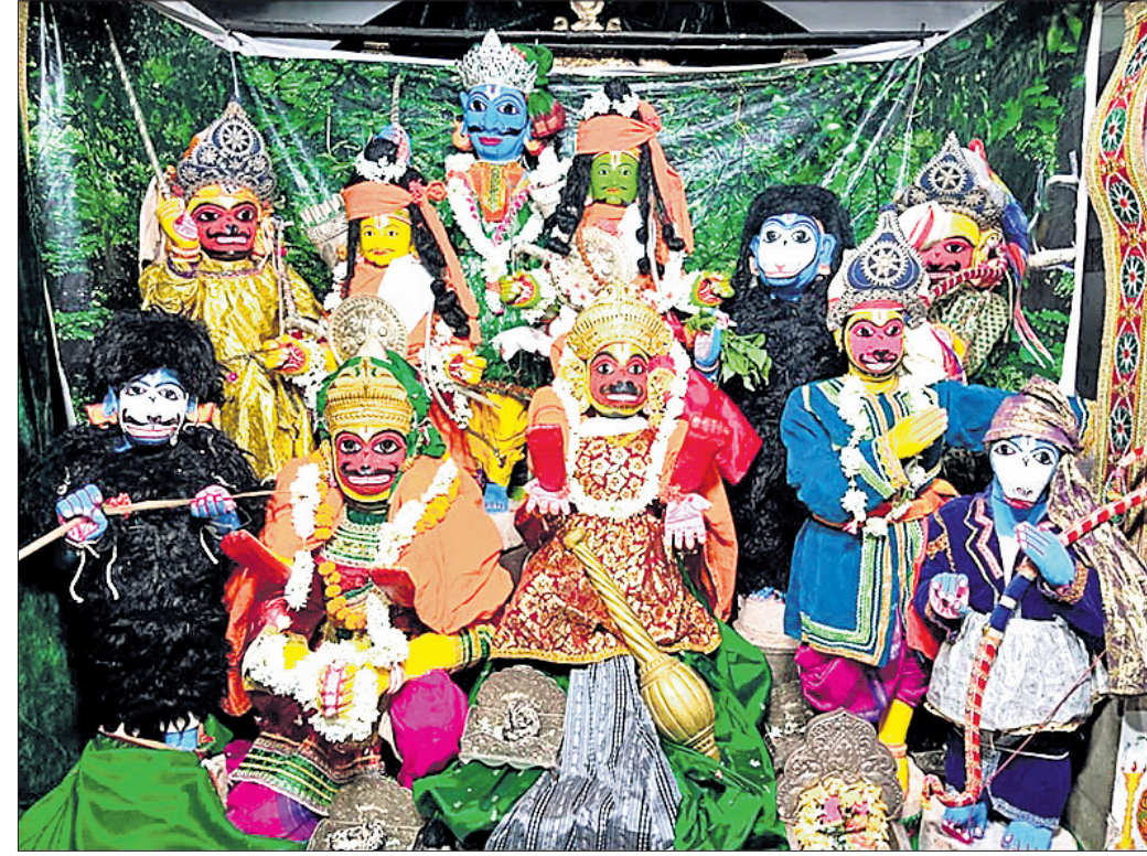
ଓଡ଼ଗାଁ ଶ୍ରୀରାମନାଥ ଲୀଳାଙ୍କୁ ବସୁ ଯାତ୍ରା ବେଶ।