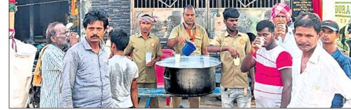
ରଘୁଲପୁର, ୨୭୪ (ରଂଜିତ ରାଉତ):

ଓଡ଼ିଶା ବ୍ରାଉନସ୍ତ୍ରୀ ମହାସଂଘର ନିର୍ଦ୍ଦେଶକ୍ରମେ ପ୍ରତ୍ୟେକ ଜିଲା ଏବଂ ବୁକ୍ ଯୁକ୍ତ ତରଫରୁ ବିଭିନ୍ନ ସ୍ଥାନରେ ଜଳଛତ୍ର ଖୋଲାଯାଇଛି । ପ୍ରତ୍ୟେକ ରୌଡ଼ପାଠ ଓ ରୁକ୍ମିଣି ପୂର୍ଣ୍ଣିକାରେ ରଖି ସଂଘ ତରଫରୁ ଯାଜପୁର ଜିଲାର ଏକାଧିକ ସ୍ଥାନରେ ଜଳଛତ୍ର ଖୋଲାଯାଇଥିବା ସୂଚନା ମିଳିଛି । ଏହିକ୍ରମରେ ଚଳିତ ବର୍ଷ ରଘୁଲପୁର ବୁକ୍ ଯୁକ୍ତ ତରଫରୁ ବ୍ରାଉନସ୍ତ୍ରୀ ମହାସଂଘରୁ ପରିଚାଳନା କରୁଛନ୍ତି ।