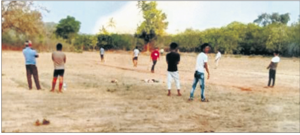
ସିନିକିସାହି ଖେଳ ପଡ଼ିଆ ନିର୍ମାଣର ଅପ୍ଲୋଡ଼ ହୋଇଥିବା ପଟେ।

ନୟାଗଡ଼ ଜିଲ୍ଲା ନୂଆଗାଁ ବ୍ଲକରେ ମହାତ୍ମା ଗାନ୍ଧୀ ଜାତୀୟ ଗ୍ରାମୀଣ ନିରୀକ୍ଷିତ କର୍ମ ନିଯୁକ୍ତି ଯୋଜନା (ଏମ୍.ଜି.ଏନ୍.ଆର୍.ଇ.ଜି.ଏସ୍.) କାର୍ଯ୍ୟରେ ସମ୍ପୂର୍ଣ୍ଣା ରହୁ ନ ଥିବା ଅଭିଯୋଗ ହେଉଛି। ମେଣ୍ଡିନରେ କାମ କରିବା, ପୁରୁଣା କାମକୁ ଦେଖାଇ ଅନୁଦାନ ଲୁଚିବା, ସୂଚନା ଫଳକ ନିର୍ମାଣ ନ କରିବା, ଯୋଜନାର ସମସ୍ତ ନିୟମ କାନୁନକୁ ଉଲ୍ଲଙ୍ଘନ କରି ଅନୁଦାନ ଲୁଚିବା ଭଳି ଅନେକ ଅନିୟମିତତା ହେଉଥିବା ଅଭିଯୋଗ ହେଉଛି।