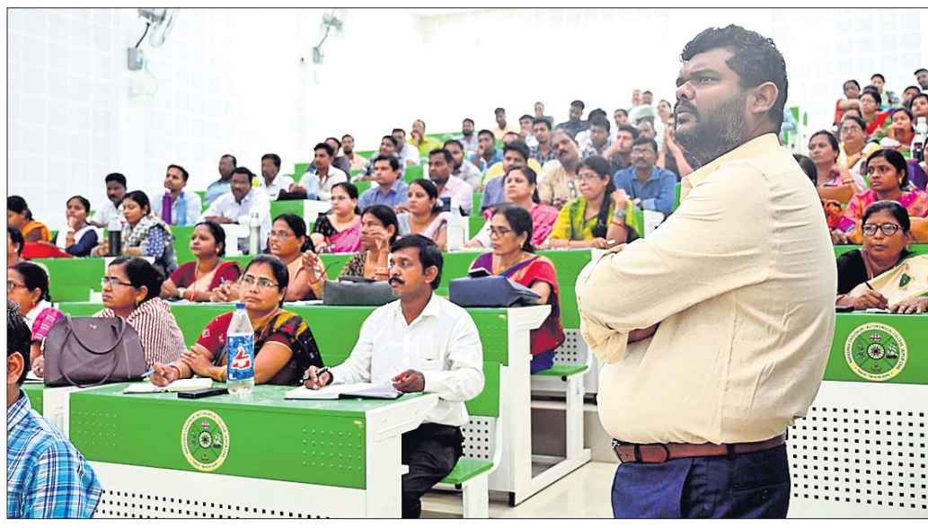
ତାଲିମ ଶିବିରରେ ଯୋଗଦେଇଥିବା ଅଧିକାରୀମାନେ ।