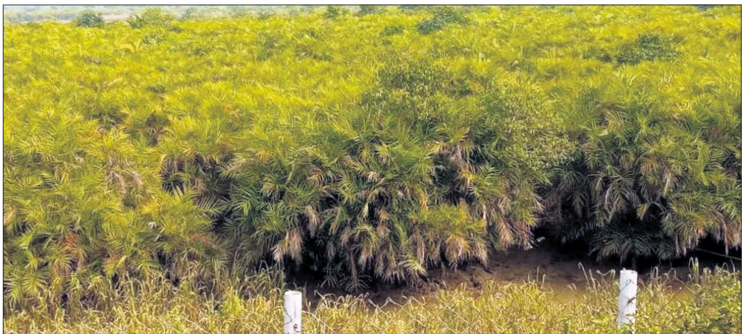
କେନ୍ଦ୍ରାପଡ଼ା ପେଷ ନିକଟରେ ଥିବା ହେଡାଳବଣ।