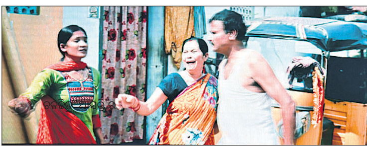
ଚଳଚ୍ଚିତ୍ର 'ଆସକ୍ତି'ର ଏକ ଦୃଶ୍ୟ।