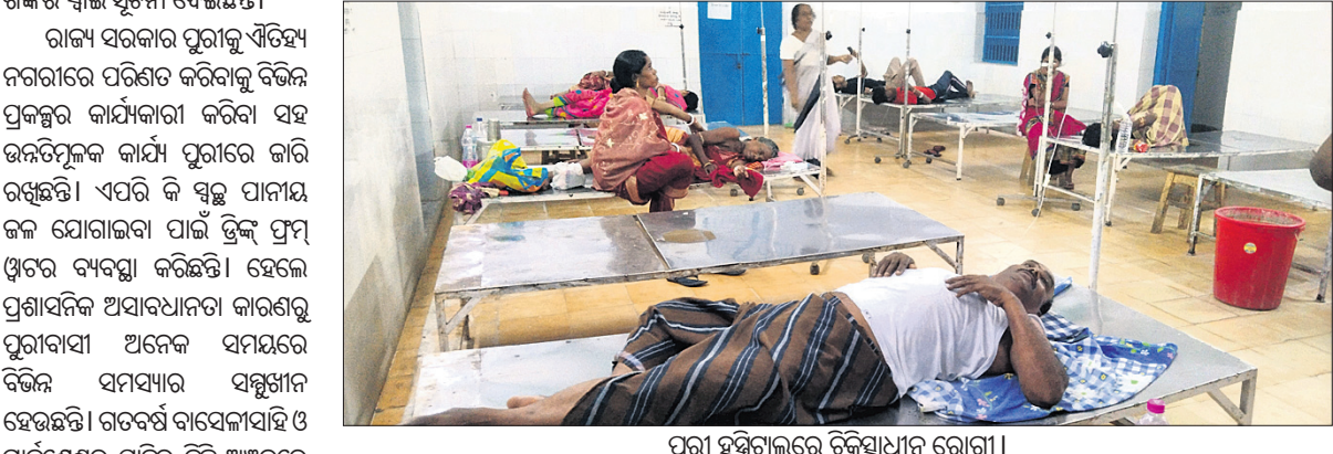
ପୁରୀ ହସ୍ପିଟାଲରେ ଚିକିତ୍ସାଧୀନ ରୋଗୀ ।