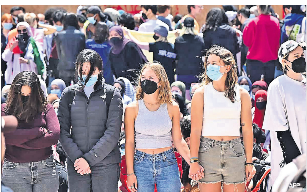
ଆମେରିକାରେ ଏକ ବିଶ୍ୱବିଦ୍ୟାଳୟ ପରିସରରେ ଛାତ୍ରାଛାତ୍ରୀ ବିକ୍ଷୋଭ କରୁଛନ୍ତି।

ନ୍ୟୁୟାର୍କ, ୨୭/୪ ଗାଜାରେ ଇସ୍ରାଏଲ ଆକ୍ରମଣକୁ ବିରୋଧ କରି ଆମେରିକାରେ ଛାତ୍ର ଆନ୍ଦୋଳନ ଜାରି ରହିଛି। ଶୀର୍ଷ ବିଶ୍ୱବିଦ୍ୟାଳୟଗୁଡ଼ିକର ଛାତ୍ରାଛାତ୍ରୀ ଏହି ଆନ୍ଦୋଳନରେ ସାମିଲ ହୋଇ ଇସ୍ରାଏଲରେ ପୁଞ୍ଜିନିବେଶ ଓ ଅସ୍ତ୍ର ଯୋଗାଣ ବନ୍ଦ କରିବାକୁ ଦାବି କରିଛନ୍ତି। ସେମାନଙ୍କ ଦାବି ପୂରଣ ନ ହେବା ପର୍ଯ୍ୟନ୍ତ ଆନ୍ଦୋଳନକୁ ଓହରିବେ ନାହିଁ ବୋଲି ଛାତ୍ରାଛାତ୍ରୀ ଜିଦ୍ରେ ଅଟକ ରହିଛନ୍ତି। ବର୍ତ୍ତମାନ ସୁଦ୍ଧା ୫୫୦ରୁ ଊର୍ଦ୍ଧ୍ୱ ଆନ୍ଦୋଳନରେ ଛାତ୍ରାଛାତ୍ରୀ ଗିରଫ ହେଲେଣି। ହାର୍ଭାର୍ଡ, କଲିଫର୍ଣ୍ଣିଆ, ଯାଲେ, ୟୁସି ବେର୍କେଲେ ଓ ଅନ୍ୟ ୟୁନିଭର୍ସିଟି କ୍ୟାମ୍ପସ୍ରେ ଇସ୍ରାଏଲ ବିରୋଧରେ ବ୍ୟାପକ ଆନ୍ଦୋଳନ ଜାରି ରହିଛି। ଅନ୍ୟପକ୍ଷରେ ଅନଧିକୃତ ଭାବେ ଛାତ୍ରାଛାତ୍ରୀ ଆନ୍ଦୋଳନ ଚଳାଇଥିବା ଅଭିଯୋଗ କରି ବିଶ୍ୱବିଦ୍ୟାଳୟ କର୍ତ୍ତୃପକ୍ଷ ସେମାନଙ୍କୁ ହଟାଇଦେବା ପାଇଁ ପୋଲିସ୍ ଦାବି କରିଛନ୍ତି। ଗତ ୨ ଦିନ ହେଲା