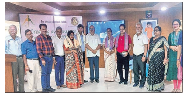
ମାଲକୋ-କଟକପୁର, ୨୭/୪(ମାନସ ସାମଲ)

କର୍ମଚାରୀଙ୍କୁ ନେଇ ଆବାହକଙ୍କୁ ଆୟୋଜିତ ଏହି କାର୍ଯ୍ୟକ୍ରମରେ ସମସ୍ତ ସଦସ୍ୟ ଉପସ୍ଥିତ ରହି ନିର୍ବାଚନରେ ଭାଗ ନେଇଥିଲେ। ସଫେଇ କର୍ମଚାରୀଙ୍କୁ ନେଇ ଆବାହକଙ୍କୁ ଆୟୋଜିତ ଏହି କାର୍ଯ୍ୟକ୍ରମରେ ସମସ୍ତ ସଦସ୍ୟ ଉପସ୍ଥିତ ରହି ନିର୍ବାଚନରେ ଭାଗ ନେଇଥିଲେ।