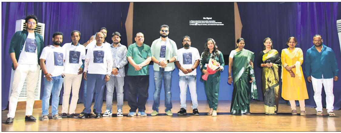
ସୂଚନା ଭବନଠାରେ ଶନିବାର ଏଫ.ଏ.ଏ.ସି. ପିଲାଙ୍କୁ ପକ୍ଷରୁ ଚଳଚ୍ଚିତ୍ର 'ଆସକ୍ତି'ର ସ୍ତ୍ରୀ ଅବସରରେ ଉପସ୍ଥିତ ଅଭିଯୁକ୍ତ ଏବଂ ଅନ୍ୟମାନେ।

ଭୁବନେଶ୍ୱର, ୨୭/୪(ସଫଳିତ ରାଉତ): ଅଶୋକ ନଗରରେ ଜଣେ ବ୍ୟକ୍ତିଙ୍କ କାର୍ କାତ ଭାଙ୍ଗି ଚୋରି କରିଥିବା ଅଭିଯୁକ୍ତଙ୍କୁ କ୍ୟାମ୍ପାଗ୍ନ ଆନା ପୋଲିସ୍ ଗିରଫ କରି ଶନିବାର କୋର୍ଟ ଚାଲାଣ କରିଛି।