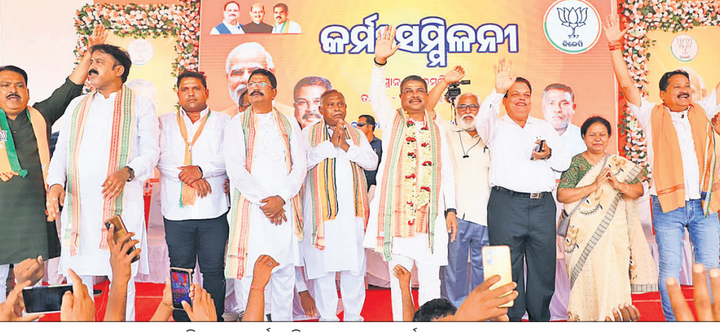
ଅନୁଗୋଳରେ କର୍ମୀ ସମ୍ମିଳନୀରେ ଦଳୀୟ ପ୍ରାର୍ଥୀମାନଙ୍କ ସହ କେନ୍ଦ୍ରମନ୍ତ୍ରୀ।

ରାଜ୍ୟରେ ୬୦ ପ୍ରତିଶତ ମହିଳା ରତ୍ନହୀନତା ଏବଂ ଶିଶୁମାନେ ଅପସ୍ତୁଷିତ ହୋଇଛନ୍ତି। ଏହାକୁ ମୁଖ୍ୟମନ୍ତ୍ରୀ ବିକାଶ କଳ୍ପନା କି। ଓଡ଼ିଶା କାହାର ବ୍ୟକ୍ତିଗତ ସମ୍ପତ୍ତି ରୁହେଁ ଏକକ୍ରମେ ବିକାଶ ନାହାନ୍ତି। ପିଲାମାନେ ଅଧାରୁ ପାଠପଢ଼ା ଛାଡ଼ିଛନ୍ତି। ବିଧାନସଭା ଆସନ ପାଇଁ ଶନିବାର ସୁଖା ୨୬ ଜଣ ପ୍ରାର୍ଥୀପତ୍ର ଦାଖଲ କରିଛନ୍ତି।