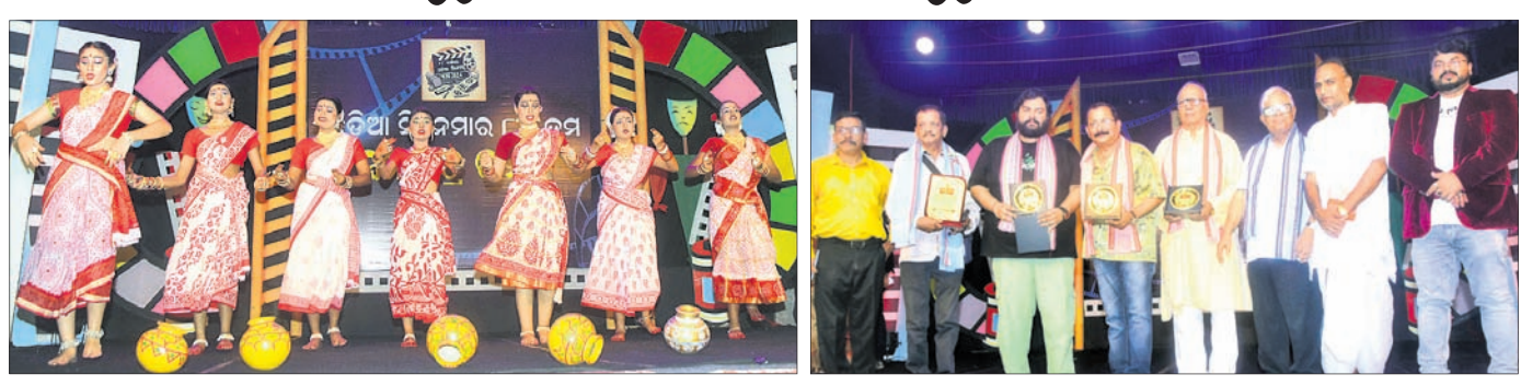
ଉତ୍ତରରେ କଳାକାରମାନେ ସାଂସ୍କୃତିକ କାର୍ଯ୍ୟକ୍ରମ ପରିବେଷଣ କରୁଛନ୍ତି। ଅତିଥିକ ଗହଣରେ ସମ୍ବର୍ଦ୍ଧିତ ବ୍ୟକ୍ତି।

ପୁରୀ ୨୭୮୪ (ଅଧିକ ମହାତି) ଓଡ଼ିଆ ଭାଷାଭିତ୍ତିକ ପ୍ରଦେଶ ଗଠନ ପରେ ପୁରୀ ଲକ୍ଷ୍ମୀ ଚଳଚ୍ଚିତ୍ର ପ୍ରଥମ ଓଡ଼ିଆ ଚଳଚ୍ଚିତ୍ର ସାତାଦିବାହ ୧୯୩୬ ଏପ୍ରିଲ ୨୮ତାରିଖରେ ମୁକ୍ତିଲାଭ କରିଥିଲା। ଓଡ଼ିଆ ଚଳଚ୍ଚିତ୍ର ମୁକ୍ତିଲାଭ ୮୮ତମ ବର୍ଷ ପୂର୍ତ୍ତି ଉପଲକ୍ଷେ ଶନିବାର ଅନୁଷ୍ଠିତ ରଙ୍ଗମଞ୍ଚରେ ସିନେମା ମହୋତ୍ସବ ଅନୁଷ୍ଠିତ ହୋଇଯାଇଛି। ଏହି ଉତ୍ସବରେ ଉତ୍କଳୀୟ ସଂସ୍କୃତି, ପରମ୍ପରା ଓ ଓଡ଼ିଶାର ମୌଳିକ କଥାବସ୍ତୁକୁ ନେଇ ଚଳଚ୍ଚିତ୍ର ନିର୍ମାଣ, ଶ୍ରୀଜଗନ୍ନାଥଙ୍କ ଶ୍ରୀକ୍ଷେତ୍ର ସମେତ ଓଡ଼ିଶାର ବିଭିନ୍ନ ସ୍ଥାନରେ ନୂତନ ଫିଲ୍ମ ହଲ୍ ନିର୍ମାଣ ଓ ଭଗ୍ନ ସିନେମା ହଲ୍‌ର ପୁନରୁଦ୍ଧାର