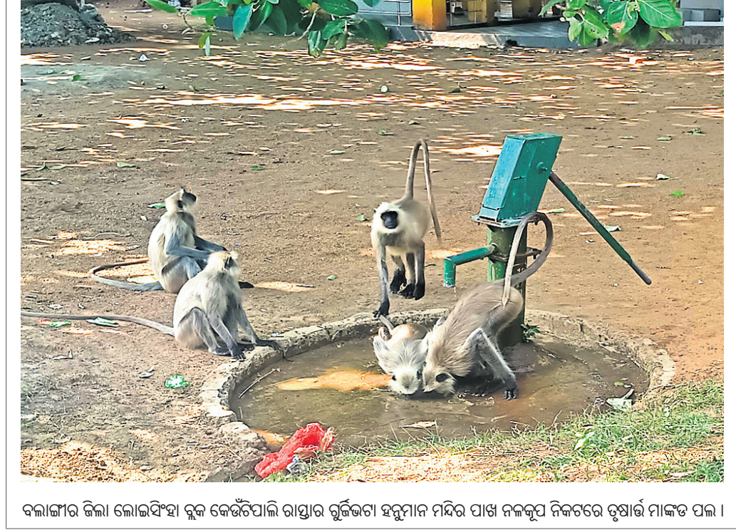
ବଲାଙ୍ଗୀର ଜିଲ୍ଲା ଲୋଇସିଂହା ବ୍ଲକ କେଉଁଟିପାଲି ଗାଁର ଚୁର୍ଚ୍ଚଭଙ୍ଗା ହନୁମାନ ମନ୍ଦିର ପାଖ ନଳକୂପ ନିକଟରେ ବୃଷାଭି ମାଙ୍କଡ଼ ପଲ ।