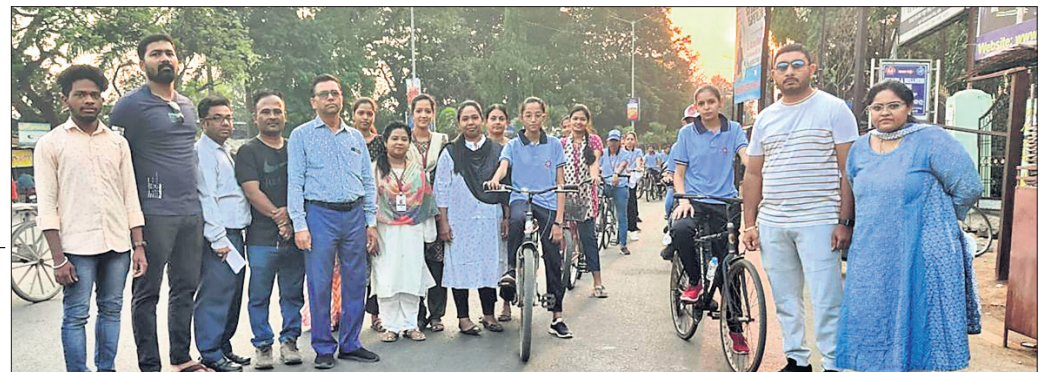
ସଚେତନତା ଶୋଭାଯାତ୍ରାରେ ଛାତ୍ରାଛାତ୍ରୀ ଓ ଅତିଥି।