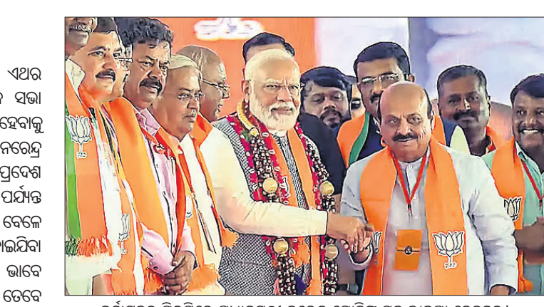
କର୍ମଚକର ବିରସିରେ ପ୍ରଧାନମନ୍ତ୍ରୀ ନରେନ୍ଦ୍ର ମୋଦିଙ୍କ ସହ ଭାଜପା ନେତୃବୃନ୍ଦ।

କେନ୍ଦ୍ରରେ କ୍ଷମତାସୀନ ଭାଜପା ଏଥର ମଧ୍ୟ 'ରାମ ନାମ' ଧରି ଲୋକ ସଭା ନିର୍ବାଚନ ବିଚାରଣା ପାଇଁ ହେବାକୁ ଉଦ୍ୟମ ଚଳାଇଛି। ପ୍ରଧାନମନ୍ତ୍ରୀ ନରେନ୍ଦ୍ର ମୋଦିଙ୍କଠାରୁ ନେଇ ଉତ୍ତର ପ୍ରଦେଶ ମୁଖ୍ୟମନ୍ତ୍ରୀ ଯୋଗୀ ଆଦିତ୍ୟନାଥଙ୍କ ପର୍ଯ୍ୟନ୍ତ ଚଳିଥିବା ଦଳର ନେତାମାନେ ପ୍ରଚାର ବେଳେ ଅନେକ ଚୁରୁଚୁରୁ ପ୍ରସଙ୍ଗକୁ ଏଡ଼ାଇଦିବା ସହ ଧୂଳିକରଣର ସହଜ ଅସ୍ତ୍ର ଭାବେ 'ରାମ ନାମ' ଉଦ୍ଧାରଣ କରୁଛନ୍ତି। ତେବେ ବେରୋଜଗାରି, ଦରଦାନ ବୁଦ୍ଧି, କୃଷକ ସମସ୍ୟା ଭଳି ବିଫଳତାର ଦେଶବାସୀଙ୍କ ଧ୍ୟାନ ହଟାଇବା ପାଇଁ ଶାସକ ଦଳ ଏଭଳି ପଛ ଆପଣାଇଛି, ଯାହାକି ଏହାକୁ ନୁହେଁ ହେବ ବୋଲି କଂଗ୍ରେସ ସମେତ ବିରୋଧୀ ଦଳକୁଟିକ ସମାଲୋଚନା କରିଛନ୍ତି। କର୍ମଚକର ଉତ୍ତର କନଡ଼ ଜିଲ୍ଲା ସିନ୍ଦ୍ରିରେ ରବିବାର ଏକ ଦଳୀୟ ସଭାକୁ ସମ୍ବୋଧିତ କରି ପ୍ରଧାନମନ୍ତ୍ରୀ କହିଛନ୍ତି, ଯେଉଁମାନେ ରାମନାମ ପ୍ରାର୍ଥନା ପ୍ରତିଷ୍ଠା ଉତ୍ସବ ନିମନ୍ତେ ପ୍ରତ୍ୟାଖ୍ୟାନ କରିଥିଲେ, ସେମାନଙ୍କୁ ଏଥର ଲୋକ ସଭା ନିର୍ବାଚନରେ ଦେଖାଯାଏ ପ୍ରତ୍ୟାଖ୍ୟାନ କରିବେ। ଦେଶ ସ୍ୱାଧୀନ ହେବାର ପରଦିନ ହିଁ ରାମନାମ ନିର୍ବାଣ ଉପରେ