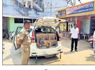
ଭବାନୀପାଟଣା ହିଲ ଟାଉନ ପାଖରେ ଗାଡ଼ିମୋଟର ଯାଞ୍ଚ କରାଯାଉଥିବା

ସମୟରେ ଏକ କାର ନଂ. ଓଡ଼ି ୦୮ ଟି -୧୬୧୭ ରୁ ୩୮୮.୮୦୦ ଲିଟର ବିଭିନ୍ନ ପ୍ରକାର ବିଦେଶୀ ମଦ, ନଗଦ ୩୦ ହଜାର ୫୫୦ ଟଙ୍କା ଜବତ କରାଯାଇଛି। ଏଥିରେ ସମ୍ପୃକ୍ତ ଥିବା ୨ ଜଣଙ୍କୁ ଗିରଫ କରାଯାଇଥିବା ଜଣାପଡିଛି। ଏ ନେଇ ଭବାନୀପାଟଣା ଟାଉନ ଥାନାରେ ଏକ ମାମଲା (ନଂ.୧୯୦/୨୪) ରୁଜୁ ହୋଇଛି।