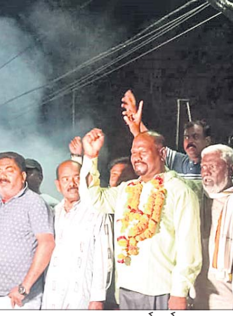
ନାହାରଙ୍କ ସହ କର୍ମକର୍ତ୍ତା।

କଂଗ୍ରେସ, ଜ୍ୟେମ୍‌ଏମ୍‌ ସମେତ ଅନ୍ୟ ସହଯୋଗୀ ଓ ଦଳର ବରିଷ୍ଠ କର୍ମୀମାନେ ତାଙ୍କୁ ସହର ପରିକ୍ରମା କରାଇଥିଲେ। ଏହି ଅବସରରେ ପ୍ରାର୍ଥା ନିହାର କର୍ମୀମାନଙ୍କ ସହ ତଳ ବସ ଷ୍ଟାଣ୍ଡରେ ଥିବା ବାର ବିର୍ଧା ସୁରିନଙ୍କୁ ମେଢ଼ ପକ୍ଷରୁ ପ୍ରାର୍ଥା ଘୋଷଣା ରାଞ୍ଚିଠାରେ କରାଯାଇଛି। ନିହାର ସନ୍ଧ୍ୟାରେ ବାରମିତ୍ରପୁରରେ ପହଞ୍ଚିବା ପରେ ତାଙ୍କୁ ଉତ୍ତମ ମେଢ଼ ପକ୍ଷରୁ