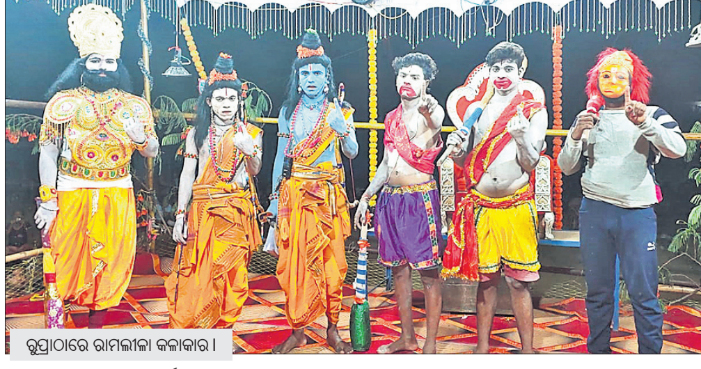
ରୁପାରେ ରାମଲୀଳା କଳାକାର।

ଭବାନୀପାଟଣା/ରୁପା, ୨୮୪ (ଉତ୍ତମ କୁମାର ଦାଶ/ସଞ୍ଜୀବ ଦାସ)