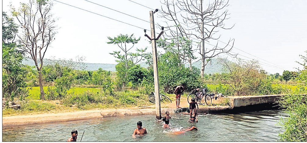
କେନାଲ ଭିତରେ ବିଦ୍ୟୁତ୍ ଖୁଣ୍ଟ ରହିଛି।