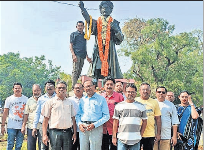
କୋର୍ଟ ଛକ ପରିସରରେ ଥିବା ମଧୁବାବୁଙ୍କ ପ୍ରତିମୂର୍ତ୍ତି ନିକଟରେ ଜିଲ୍ଲା ଓକିଲ ସଂଘ ସଦସ୍ୟବୃନ୍ଦ।