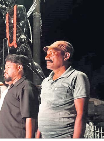
ଝରେନ ଗ୍ରାମବାସୀ ସମୂହ।

କୁତ୍ରା ବ୍ଲକ୍ ନୂଆଗାଁ ପଞ୍ଚାୟତ ଝରେନ ଗ୍ରାମବାସୀ ବିଦ୍ୟାଳୟର ପୁନଃ ନିର୍ମାଣ ଦାବିରେ ଗ୍ରାମବାସୀ ଓ ବିଦ୍ୟାଳୟ ପରିଚାଳନା କମିଟି ପକ୍ଷରୁ ଶନିବାର ବିଡ଼ିଓଙ୍କୁ ଏକ ଦାବି ପତ୍ର ପ୍ରଦାନ କରାଯାଇଛି। ଦାବିପତ୍ରରେ ଉଲ୍ଲେଖ କରାଯାଇଛି, ବିଦ୍ୟାଳୟର ଶ୍ରେଣୀଗୃହ ଛାତ ଚୁର୍ଚ୍ଚିତ ହୋଇ ସିନେଟ୍ ପ୍ଲାଷ୍ଟର ଖସିବା ସହ ଉଚ୍ଚ ବେଖାଯାଇଛି। ଯଦି ପାଠପଢ଼ା ସମୟରେ ସିନେଟ୍ ପ୍ଲାଷ୍ଟର ଖସି ଛାତ୍ରଛାତ୍ରୀଙ୍କୁ କ୍ଷତିଗ୍ରସ୍ତ କିମ୍ବା ଶିକ୍ଷୟିତ୍ରୀ ଶିକ୍ଷକଙ୍କ ଉପରେ ପଡ଼େ ତେବେ ଏଥିପାଇଁ ଦାୟୀ କିଏ ରହିବେ ବୋଲି ପ୍ରଶ୍ନ କରିଛନ୍ତି। ପୂର୍ବରୁ ଏନେଇ ବ୍ଲକ୍ ପ୍ରଶାସନ ତଥା ବିଡ଼ିଓଙ୍କୁ ମଧ୍ୟ ଦାବିପତ୍ର ପ୍ରଦାନ କରାଯାଇଛି। ଅଗଷ୍ଟ ୨୮ରେ ବ୍ଲକ୍ ପ୍ରଶାସନ ବିଦ୍ୟାଳୟକୁ ଆସି ପିଲାଙ୍କୁ ଶ୍ରେଣୀ ଗୃହ ପରିବର୍ତ୍ତେ ବାରଣ୍ଡା ଓ ଗଛ ମୂଳେ ପଢ଼ାଇବାକୁ କହିଥିଲେ। ବିଦ୍ୟାଳୟ ଛାତ୍ର ସହ କାନ୍ଦି ବିରୁଦ୍ଧିତା ପତ୍ର ଉପରେ ରହିଛି। ତେଣୁ ପ୍ରଶାସନ ବିଦ୍ୟାଳୟ ପୁନଃ ନିର୍ମାଣର ଲିଖିତ ପ୍ରତିଶ୍ରୁତି ନ ଦେଲେ ଚଳିତ ବିଧାନସଭା ଓ ଲୋକସଭା ଭୋଟ ସମ୍ପୂର୍ଣ୍ଣ ଭାବେ ବର୍ଜନ କରିବେ ବୋଲି ଦାବିପତ୍ରରେ ଉଲ୍ଲେଖ କରିଛନ୍ତି ଗ୍ରାମବାସୀ ଓ ବିଦ୍ୟାଳୟ ପରିଚାଳନା କମିଟି। ଉଲ୍ଲେଖ ଯୋଗ୍ୟ, ଗ୍ରାମବାସୀ ଓ ବିଦ୍ୟାଳୟ ପରିଚାଳନା କମିଟି ତରଫରୁ ଶୁକ୍ରବାର ଏକ ବୈଠକ ବସିଥିଲା। ପ୍ରାଥମିକ ବିଦ୍ୟାଳୟର ପୁନଃ ନିର୍ମାଣ ନ ହେଲେ ଗ୍ରାମବାସୀ ଭୋଟ ବର୍ଜନ କରିବେ ବୋଲି ନିଷ୍ପତ୍ତି ନେଇଥିଲେ।