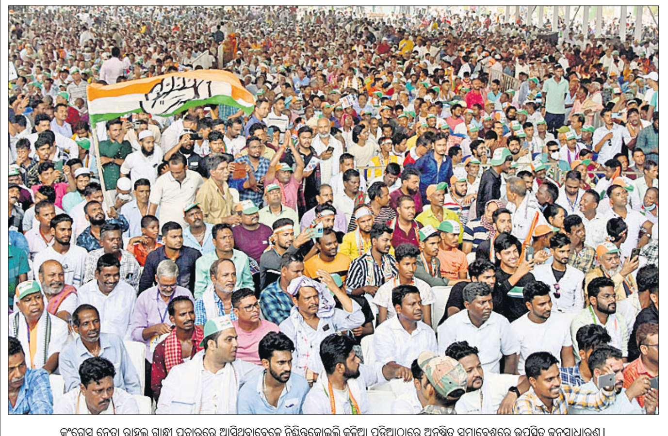
କଂଗ୍ରେସ ନେତା ରାହୁଲ ଗାନ୍ଧୀ ପ୍ରଚାରରେ ଆସିଥିବାବେଳେ ନିଶ୍ଚିତକୋଇଲି କୁଳିଆ ପଡ଼ିଆଠାରେ ଅନୁଷ୍ଠିତ ସମାବେଶରେ ଉପସ୍ଥିତ ଜନସାଧାରଣ।