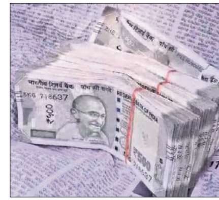
କମିଶନରେଟ୍ ପୋଲିସ୍ ପକ୍ଷରୁ ଓମ୍‌ପେଡ଼୍ ଛକରେ ଯାଅବେଲେ କାରୁ ମିଳିଥିବା ଟଙ୍କା।

ଶୁଣିକିତ ନିର୍ବାଚନ ପାଇଁ ପୋଲିସ୍ ପକ୍ଷରୁ ଯାଅ କଡ଼ାକଡ଼ି କରାଯାଇଛି। ବିଭିନ୍ନ ସ୍ଥାନରେ ଟଙ୍କା, ମଦ, ଅସ୍ତ୍ରଶସ୍ତ୍ର ଓ ବେଆଇନ ସାମଗ୍ରୀ କାରବାର ଉପରେ ନଜର ରଖାଯାଉଛି। ରାଜଧାନୀ ଭୁବନେଶ୍ୱରରେ କମିଶନରେଟ୍ ପୋଲିସ୍‌ର ବିଭିନ୍ନ ଥାନା ପକ୍ଷରୁ ମଧ୍ୟ କୋରଦାର ଟେକିଂ ଓ କୁକିଂ କରାଯାଉଛି। ଶନିବାର ରାତିରେ