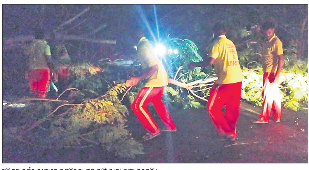
ଅଗ୍ନିଶମ କର୍ମଚାରୀମାନେ ଉପୁଡ଼ିଥିବା ଗଛ କାଟି ରାସ୍ତା ସଫା କରୁଛନ୍ତି।

ରାସ୍ତାରେ ଯାନବାହନ ଚଳାଚଳ ବାଧାପ୍ରାପ୍ତ ହୋଇଥିଲା। ଖବର ପାଇ ବେଗୁନିଆ ଓ କଳାପଥର ଅଗ୍ନିଶମ କର୍ମଚାରୀ ରାସ୍ତାରୁ ଗଛକୁ ଚିତ୍କୁ ହଟାଇବା ପରେ ଯାତାୟତ ସ୍ୱାଭାବିକ ହୋଇଥିଲା।