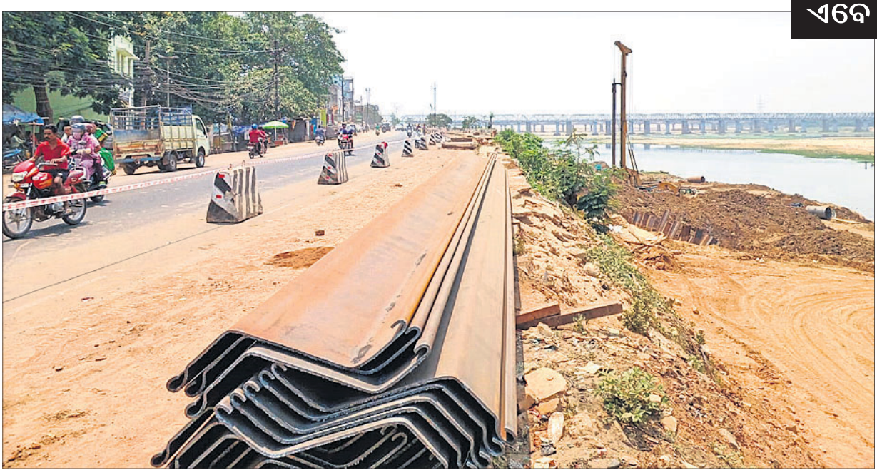
କଟକ ଖାନ୍ ନଗର ରିଂରୋଡ଼ର ଗଛ କଟାଯାଇ ରାସ୍ତା ସଂପ୍ରସାରଣ କରାଯାଇଛି।