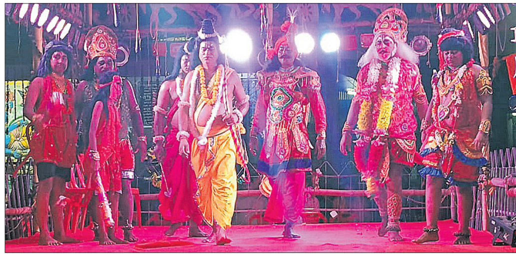
ମୁଣ୍ଡମୁହାଣ ରାମ ନାଟ୍ୟ ସଂସଦ ପକ୍ଷରୁ କଳାକାରମାନେ ରାମଲୀଳା ନାଟକ ପରିବେଷଣ କରୁଛନ୍ତି।