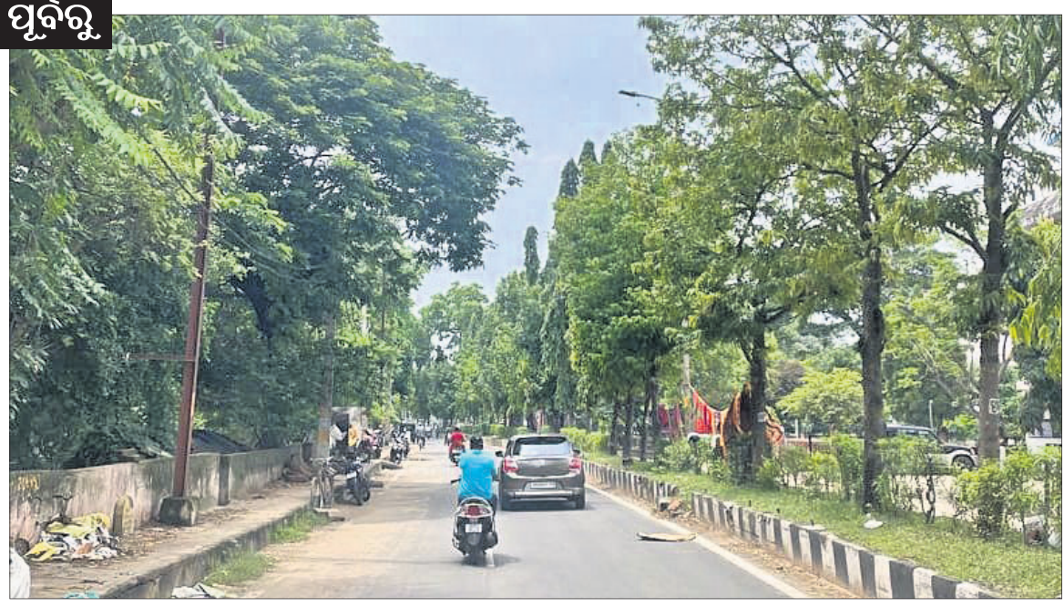
କଟକ ଖାନନଗର ରିଂରୋଡ଼ ଉଭୟ ପାର୍ଶ୍ୱରେ ଥିବା ଗଛ।

ସେଲଫି ପଠାଇବା ସମୟରେ ନିଜର ନାମ ଏବଂ ମୋବାଇଲ ନମ୍ବର ଦେବାକୁ ଭୁଲନ୍ତୁ ନାହିଁ। ଯୋଗ୍ୟ ବିବେଚିତ ଫଟୋ ପ୍ରକାଶ ପାଇବ।