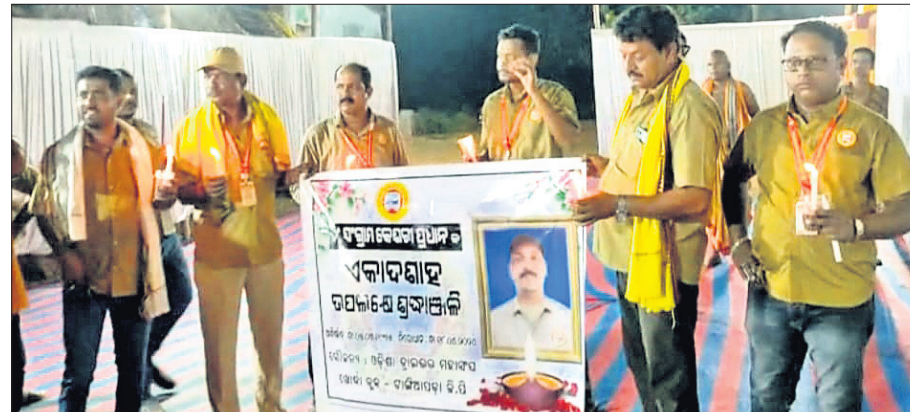
ଅଗେ ଚାକର ଦ୍ୱାଦଶାହରେ ଭ୍ରାତୃଭର ମହାସଂଘ ପକ୍ଷରୁ କ୍ୟାଣ୍ଡେଲ ଶୋଭାଯାତ୍ରା କରାଯାଇଛି।

ଖୋର୍ଦ୍ଧା, (ପ୍ରଭାତ ପାଣିଗ୍ରାହୀ) ୨୮୪ ଅଗେଚାକର ସଂଗ୍ରାମ ପ୍ରଧାନଙ୍କ ଦ୍ୱାଦଶାହ କାର୍ଯ୍ୟରେ ଯୋଗଦେଇ ଓଡ଼ିଶା ଭ୍ରାତୃଭର ମହାସଂଘ, ଖୋର୍ଦ୍ଧା ଶାଖା କ୍ୟାଣ୍ଡେଲ ଶୋଭାଯାତ୍ରା କରିଛନ୍ତି। ଖୋର୍ଦ୍ଧା ବୁକ ଚାଲିଆପଢ଼ା ପଞ୍ଚାୟତ ଅଧୀନ ଅରାଜ ଗ୍ରାମର ଅଗେଚାକର ସଂଗ୍ରାମ ପ୍ରଧାନଙ୍କ ଅସ୍ଥୁ ଅବସ୍ଥାରେ ମୃତ୍ୟୁ ଘଟିଥିଲା। ସେ ପରିବାରର ଏକମାତ୍ର