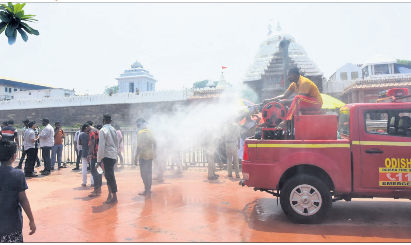
ପ୍ରବନ୍ଧ ଗୌଡ଼ପାପ ଯୋଗୁ ରବିବାର ପୁରୀ ଶ୍ରୀମନ୍ଦିର ସମ୍ମୁଖରେ ଶୁଭାଳୁକ ଉପରେ ପାଣି ସିଞ୍ଚନ କରାଯାଇଛି।