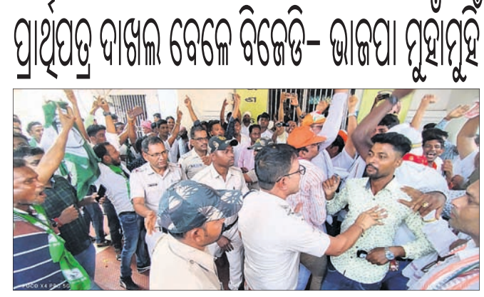
ପୁରୀ, ୨୯/୪ (ଅଭିମତ)