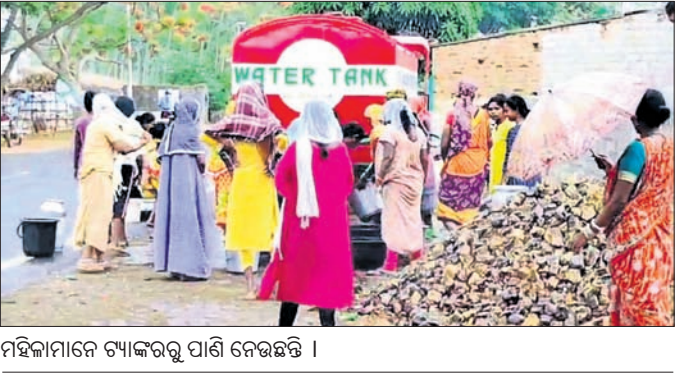
ମହିଳାମାନେ ଚ୍ୟାକରରୁ ପାଣି ନେଇଛନ୍ତି ।

କରିଛନ୍ତି। ଏପରି କାଳିଆପଡ଼ା ଗ୍ରାମରେ ଦେଖିବାକୁ ମିଳୁଥିବା ବେଳେ ରବିବାର ପାଣିପାଇଁ ମହିଳାମାନେ ରାସ୍ତାରେକୋ କରିଥିଲେ। ଏହି ଘଟଣା ପରେ କାଳିଆପଡ଼ା ଏବଂ ତଳକାଳିଆପଡ଼ା ଗ୍ରାମକୁ ଜଣେ ବ୍ୟକ୍ତି ଚ୍ୟାକର ଯୋଗେ ଜଳ ଯୋଗାଣ କରିଥିଲେ। ଜଳ ଯୋଗାଣ କରିଥିବା ସମ୍ପୂର୍ଣ୍ଣ ବ୍ୟକ୍ତି ଜଣକ ହେଉଛନ୍ତି ଗ୍ରାମର ଉତ୍କଳ ନାଏକ।