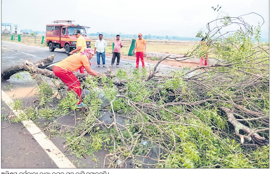
ଅଗ୍ନିଶମ କର୍ମଚାରୀ ରାସ୍ତା ଉପରୁ ଗଛ କାଟି ହଟାଇଛନ୍ତି।

ରାସ୍ତା ଅବରୋଧ ହୋଇଛି। ସୋମବାର ମଧ୍ୟାହ୍ନ ପ୍ରାୟ ୨ ଘଣ୍ଟେ ଏହି କାଳବୈଶାଖୀ ତାଣ୍ଡବ ରଚିଲା। ବଜ୍ରପାତରେ ଜଣେ ବ୍ୟକ୍ତି ଗୁରୁତର ହୋଇଛନ୍ତି। କଲ୍ୟାଣସିଂହପୁର ଓ କୋଲନରା ଅଗ୍ନିଶମ କର୍ମଚାରୀ ଗଛଗୁଡ଼ିକୁ କାଟି ରାସ୍ତା ସଫା କରୁଛନ୍ତି। ସମ୍ପୂର୍ଣ୍ଣ ଭାବେ ଏହି ଗଛ କଟା ଶେଷ ହୋଇନାହିଁ। ମୁଖ୍ୟ ରାସ୍ତା ଅବରୋଧ ହଟାଇବା କାର୍ଯ୍ୟ ସରବରାହ ବନ୍ଦ ରହିଥିଲା। ମଙ୍ଗଳବାର ବକଳା କାମ ଶେଷ ହେବ ବୋଲି ସୂଚନା ମିଳିଛି।