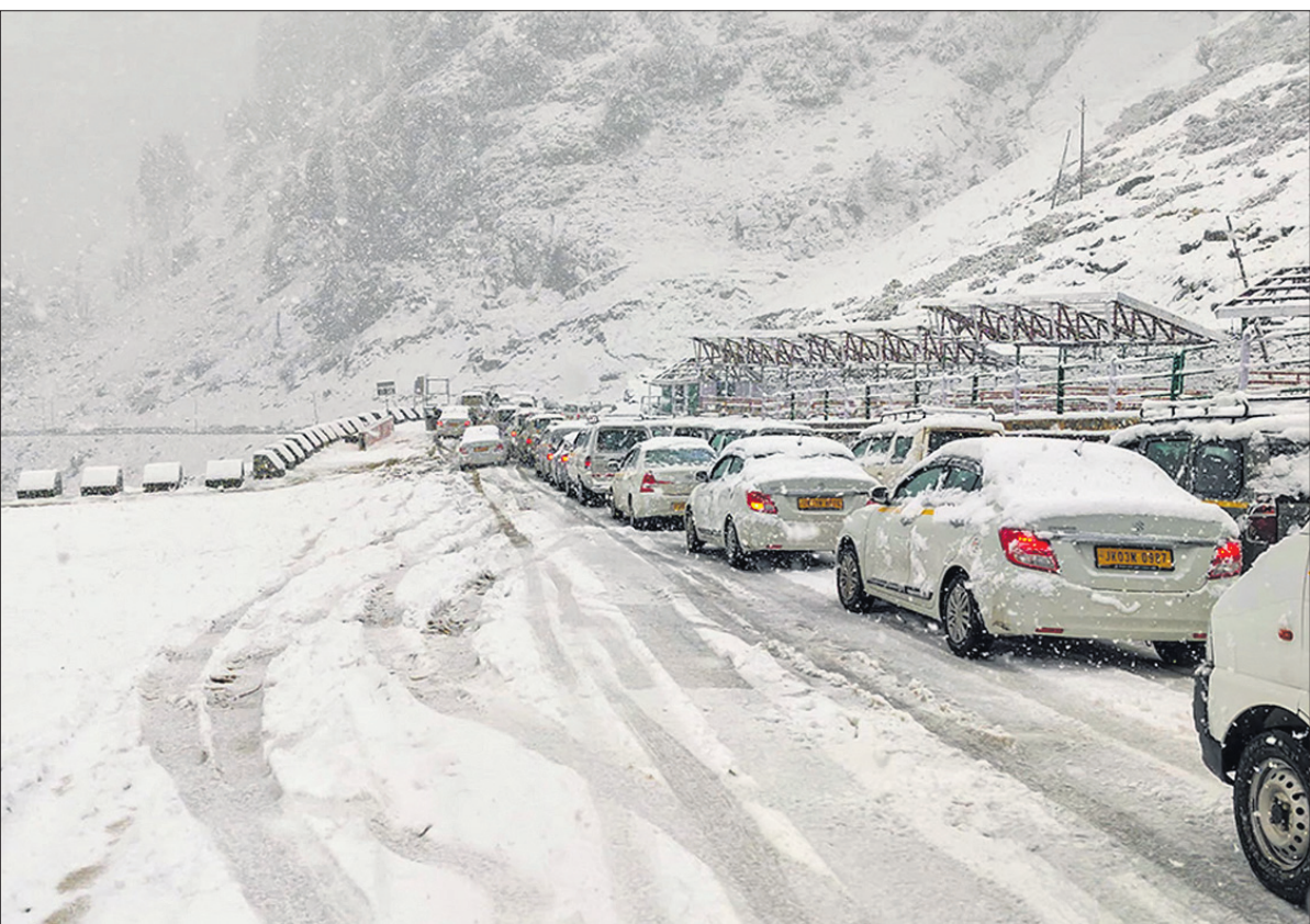
ଓଡ଼ିଶାରେ ପ୍ରଚଣ୍ଡ ବୌଦ୍ଧିପାତ, ସେପଟେ କଞ୍ଚୁକଞ୍ଚୁର ଅନୁଭବରେ ପ୍ରବଳ ଚୁଆରପାତ ନେଇ ରାସ୍ତାରେ ଗ୍ରୀଟିକ ଜାମ୍ ଦେଖାଦେଇଛି।

ବିଭିନ୍ନ ଅଭିନେତ୍ରୀ ଦିୟା ମିର୍ଜା ସୋମବାର ନିଜ ଇନ୍ଦ୍ରାଗ୍ରାମ ହାଣ୍ଡିରେ ଏକ ଭିଡ଼ିଓ ଶେୟାର କରିଛନ୍ତି। ଏହି ଭିଡ଼ିଓରେ ସେ ତାଙ୍କ ପୁଅ ଅଭ୍ୟାସୀଙ୍କ ସହ ଖାର୍ଜିଆଭଙ୍ଗ କରୁଛନ୍ତି।