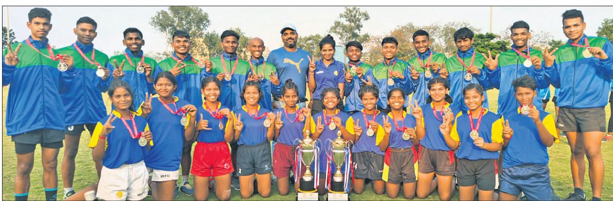
ରନଅପ୍ ଟ୍ରଫି ସହ କିର୍ ବାଲିକା ଓ ବାଳକ ରଗ୍‌ବା ଦଳ।