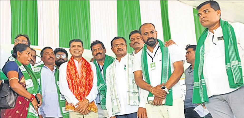
କାଳିମେଳା ଷ୍ଟାଡ଼ିୟମରେ ସୋମବାର ଆୟୋଜିତ ନିର୍ବାଚନୀ ସଭାରେ ବିଜେଡି ନେତା କାର୍ତ୍ତିକ ପାଣିଆନ ଓ ଅନ୍ୟ ନେତୃବୃନ୍ଦ।