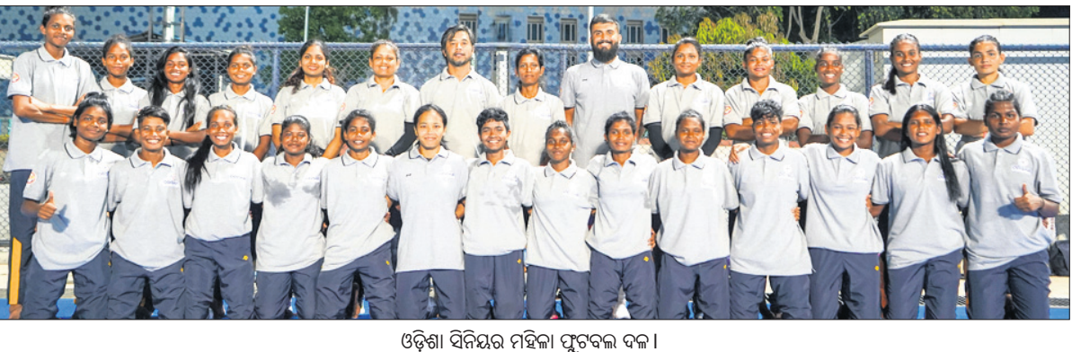
ଓଡ଼ିଶା ସିନିୟର ମହିଳା ପୁଟବଲ ଦଳ।