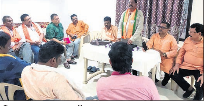
ବୈଠକରେ ଆଲୋଚନା କରାଯାଉଛି।