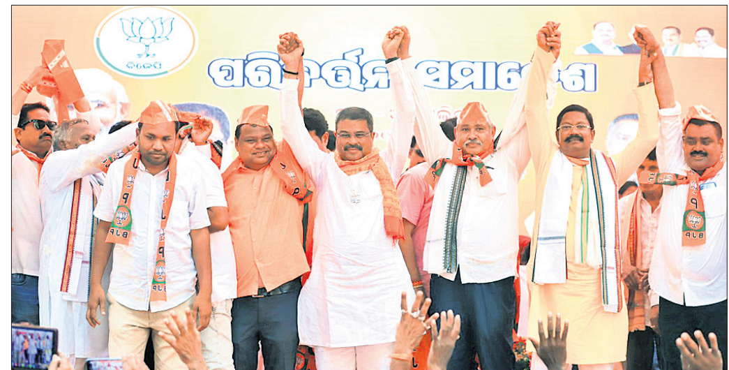
ଠାକୁରଗଡ଼ରେ ଅନୁଷ୍ଠିତ ପରିବର୍ତ୍ତନ ସମାବେଶ ଓ ମିଶ୍ରଣ ପର୍ବରେ କେନ୍ଦ୍ରମନ୍ତ୍ରୀଙ୍କ ସହ ଅନ୍ୟ ନେତାମାନେ।