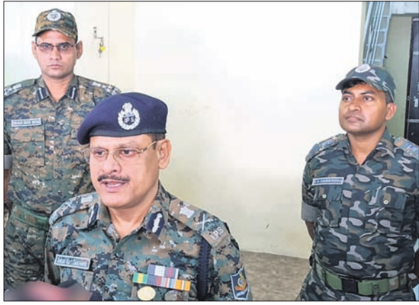
ଖବରଦାତା ସମ୍ମିଳନୀରେ ପୋଲିସ୍ ମହାନିର୍ଦ୍ଦେଶକ ସୂଚନା ଦେଉଛନ୍ତି।