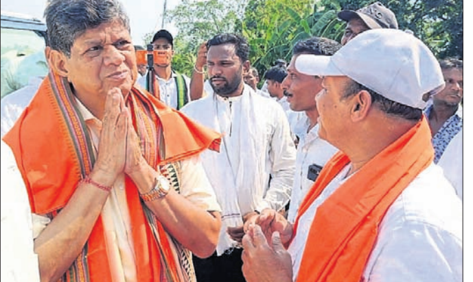
ବିଧାୟକ ସୌମ୍ୟରଞ୍ଜନ ପଟ୍ଟନାୟକ ଲୋକଙ୍କ ସହ ଆଲୋଚନା କରୁଛନ୍ତି।