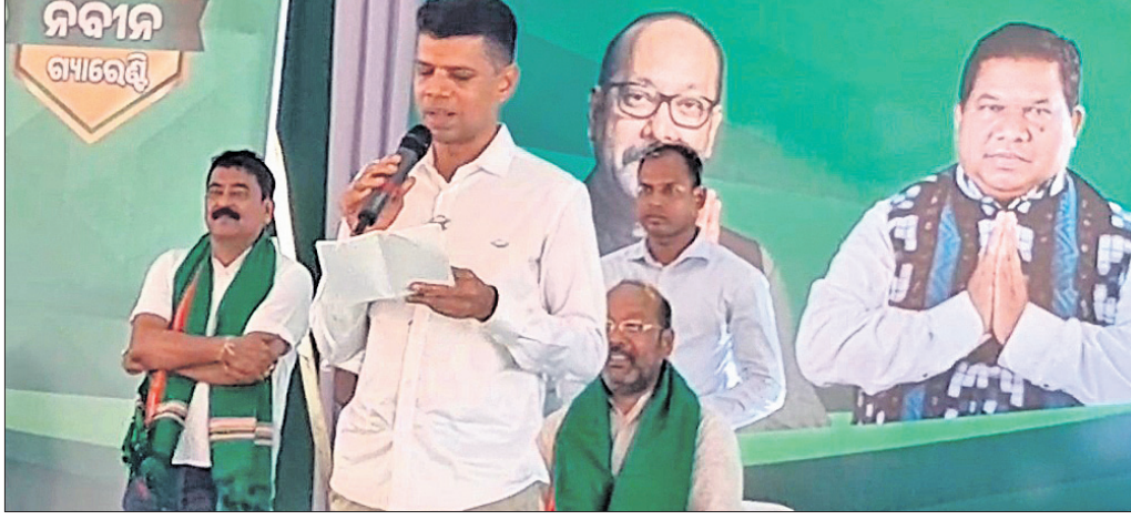
ମୋହନାଠାରେ ୫-ଟି ଅଧ୍ୟକ୍ଷ କାର୍ଯ୍ୟକ୍ରମ ପ୍ରଚାର କରୁଛନ୍ତି।