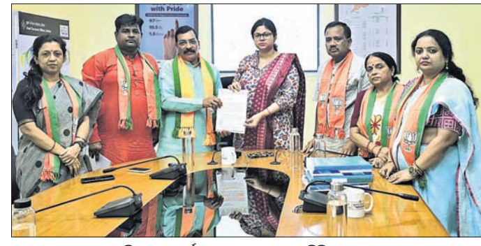
ସିଦ୍ଧାନ୍ତ କାର୍ଯ୍ୟକ୍ରମରେ ଭାଜପା ପ୍ରତିନିଧି ଦଳ।