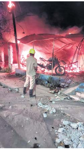
ଅଗ୍ନିଶମ ବିଭାଗ କର୍ମଚାରୀ ନିଆଁ ଲିଭାଇଛନ୍ତି।

ବ୍ରହ୍ମପୁର ଗାଉନ ଥାନା ଅନ୍ତର୍ଗତ ଆସିବା ରୋଡ ନାଳାଦ୍ରୁ ବିହାରରେ ଥିବା ଏକ ସେକେଣ୍ଡ ହ୍ୟାଣ୍ଡ ଗାଡି ବିକ୍ରୟ ଗୋଦାମରେ ବୁଧବାର ବିଳମ୍ବ ରାତିରେ ଅଗ୍ନିକାଣ୍ଡ ଘଟିଛି। ଏଥିରେ ୯ଟି ବାଇକ୍ ଓ ଗୋଟିଏ ସ୍କୁଟି ସହ ଗୋଦାମରେ ଥିବା ଅନ୍ୟାନ୍ୟ ସାମଗ୍ରୀ ପୋଡିଯାଇଛି।