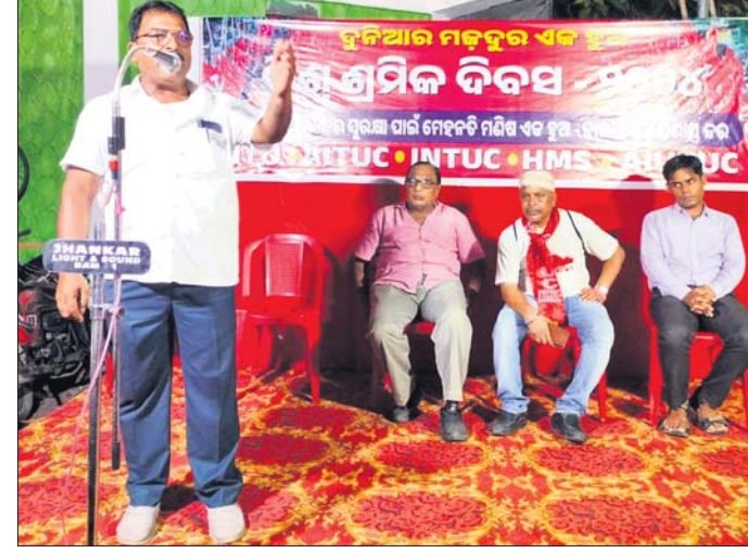
ସମାବେଶରେ ଉପସ୍ଥିତ କେନ୍ଦ୍ରୀୟ ଶ୍ରମିକ ସଂଗଠନ ନେତା

ବ୍ରହ୍ମପୁରରେ ବୁଧବାର ବିଶ୍ୱ ଶ୍ରମିକ ଦିବସ କେନ୍ଦ୍ରୀୟ ଶ୍ରମିକ ସଂଗଠନଗୁଡ଼ିକ ପକ୍ଷରୁ ପାଳିତ ହୋଇଯାଇଛି। ସିଆଇଟିସି, ଏଆଇଟିସି, ଏଟଏଏଏ ଏବଂ ଏଆଇଟିସି ପକ୍ଷରୁ ମିଳିତ ଭାବେ ପୁରୁଣା ବସଷ୍ଟାଣ୍ଡ ପାଖରେ ଆୟୋଜିତ ଜନ ସମାବେଶରେ ଭାଜପା ନେତୃତ୍ୱାଧୀନ ଏନଡିଏ ସରକାରଙ୍କ ଶ୍ରମିକ ବିରୋଧୀ କଳା ଆଇନର ନିନ୍ଦା କରାଯାଇଥିଲା।