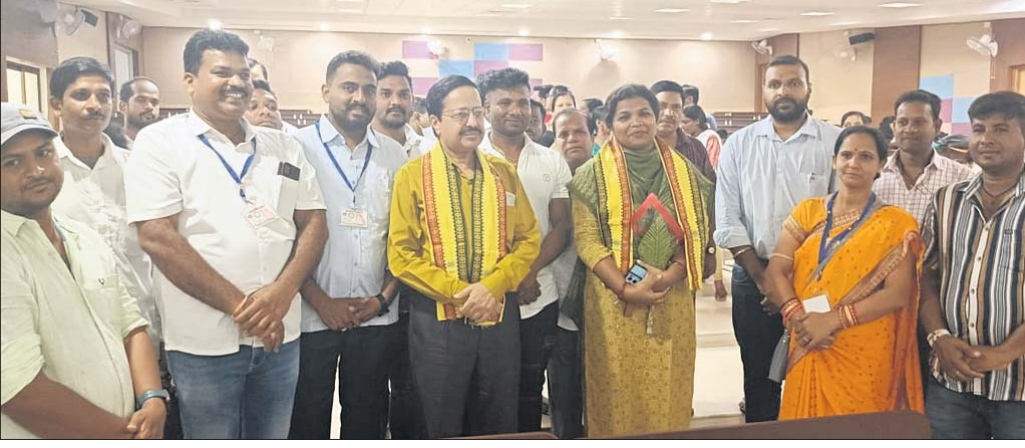
ଆଲୋଚନା ସଭାରେ ଏମକେସିଜି ପ୍ରିଦ୍ଧପାଲ, ଅନ୍ୟାନ୍ୟ ଅଧିକାରୀ ଓ କର୍ମଚାରୀ।