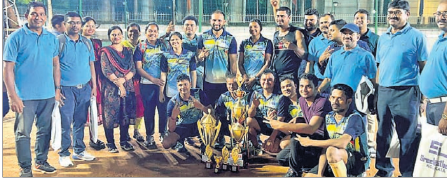
ଅତିଥିକ ଗହଣରେ ଚାମ୍ପିୟନ ଦଳର ଖେଳାଳି ।

ସଚିବାଳୟ ଅନ୍ତର୍ଭାଗୀୟ କ୍ରୀଡା ଭୁବନେଶ୍ୱର, ୨୫ (ସରୋଜ କେନା) ସଚିବାଳୟ ଅନ୍ତର୍ଭାଗୀୟ ଭଲିବଲ୍ (ପୁରୁଷ) ଏବଂ ପ୍ରୋ ବଲ୍ (ମହିଳା) ପ୍ରତିଯୋଗିତାରେ ଖାଦ୍ୟ ଯୋଗାଣ ଓ ଖାଉଟି କଲ୍ୟାଣ ବିଭାଗ ଚାମ୍ପିୟନ ଆଖ୍ୟା ଅର୍ଜନ କରିଛି । ଖାଦ୍ୟ ଯୋଗାଣ ଓ ଖାଉଟି କଲ୍ୟାଣ ବିଭାଗର ସାଂସ୍କୃତିକ ସଂସଦ ଦ୍ୱାରା ଏପ୍ରିଲ ୩ରୁ ସଚିବାଳୟ ମିଳିତ ସ୍ଥଳରେ ଆୟୋଜିତ ହୋଇଥିଲା । ଏହି ପ୍ରତିଯୋଗିତା । ଏଥିରେ ୨୯ଟି ବିଭାଗ ଅଂଗ୍ରହଣ