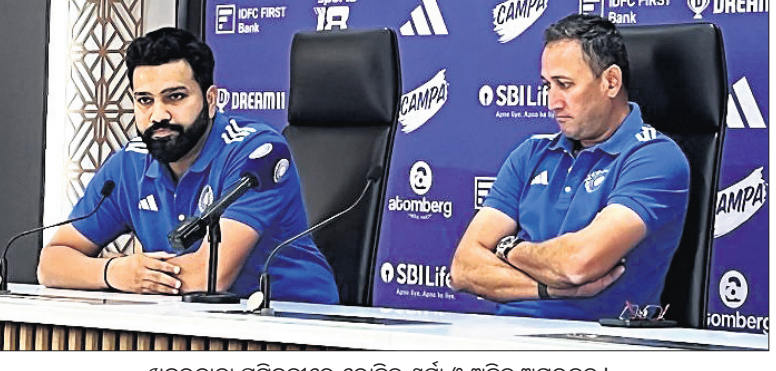
ଖବରଦାତା ସମ୍ମିଳନୀରେ ରୋହିତ ଶର୍ମା ଓ ଅଜିତ୍ ଅଗରକର ।