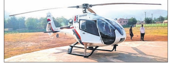
ଭେକାନାଳ ସହର ମହିଷାପାତ ପଲିକ୍ସି ପଡ଼ିଆରେ ଜରୁରୀ ଅବତରଣ କରିଥିବା ହେଲିକପ୍ଟର ।

ଭେକାନାଳ ସହର ମହିଷାପାତ ପଲିକ୍ସି ପଡ଼ିଆରେ ରୁଚୁବାର ସକାଳ ୬ଟା ୧୦ରେ ଏକ ହେଲିକପ୍ଟର ଜରୁରୀ ଅବତରଣ କରିଥିଲା । ଏହା ଦେଖି ଗ୍ରାମୀଣ ଲୋକେ ଛାନିଆ ହୋଇଯାଇଥିଲେ । ଉକ୍ତ ହେଲିକପ୍ଟରରେ ଜଣେ ପାଇଲଟ୍, ଜଣେ ଇଞ୍ଜିନିୟର ଏବଂ ଅନ୍ୟ ୩ଜଣ ଯାତ୍ରୀ ଥିଲେ । ପାଗ ଖରାପ କିମ୍ବା ଯାନ୍ତ୍ରିକ ତ୍ରୁଟି ଯୋଗୁ ହେଲିକପ୍ଟରଟି ଜରୁରୀ ଅବତରଣ କରିଥିବା ନେଇ ଆଲୋଚନା କୋର୍ଟ ଧରିଥିଲା । ସେହିପରି ନିର୍ବାଚନ ସମୟ ହୋଇଥିବାରୁ ଏହାକୁ