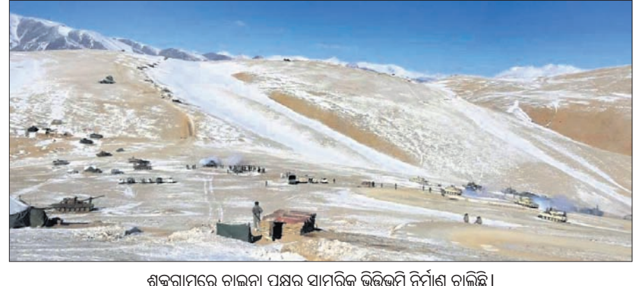
ଶଙ୍କୁଗାମ୍ରେ ଚାଇନା ପକ୍ଷରୁ ସାମରିକ ଭିତ୍ତିକୁ ନିର୍ମାଣ ଚଳାଇଛି ।

ଶଙ୍କୁଗାମ୍ରେ ୭୦ କି.ମି. ରାସ୍ତା ନିର୍ମାଣ କରିଥିବା ୨୦୧୯ରେ ଭାରତୀୟ ଗଣମାଧ୍ୟମରେ ବିଚାର ପ୍ରକାଶ ପାଇଥିଲା । ନିକଟରେ ପ୍ରକାଶିତ ଖବର ଅନୁଯାୟୀ ଚାଇନା ଏବଂ ପାକିସ୍ତାନ ଉକ୍ତ ଉପତ୍ୟକାରେ ଆଉ ଏକ ରାସ୍ତା ନିର୍ମାଣ ଯୋଜନା କରୁଛି । ସିଆରେନ୍ ଯାକିଶ୍ୱର ପିଓକେର ପୂଜାପ୍ରଦାନକର୍ତ୍ତା ଶଙ୍କୁଗାମ୍ ଉପତ୍ୟକା ଦେଇ ଏହି ରାସ୍ତା ନିର୍ମାଣ ଯୋଜନା ହୋଇଛି । ପାକିସ୍ତାନ ଓ ଚାଇନା ମଧ୍ୟରେ ବର୍ତ୍ତମାନର ରାସ୍ତାଠାରୁ ଏହା ୩୫୦ କିଲୋମିଟର କମ୍ ହେବ । ଏଲଏସି ଚାଇନା ସୈନ୍ୟ ପରିବହନ ପାଇଁ ଏହା ଏକ ଅତିରିକ୍ତ ରାସ୍ତା ହେବ । ଚାଇନାର ପିପୁଲ୍ ଲିବରେଶନ ଆର୍ମି (ପିଏଲଏ)ର ଏହି କାର୍ଯ୍ୟ ଉଦ୍ଦେଶ୍ୟପୂର୍ଣ୍ଣ ଛୁଟି ଦୃଷ୍ଟି କରିବା ବୋଲି ବିଚାର କରାଯାଉଛି । ଦ୍ୱିତୀୟ ପରିବର୍ତ୍ତନ ଲାଗି ଚାଇନାର ବେଆଇନ ଉଦ୍ୟମ ବିରୋଧରେ ଭାରତ ପ୍ରତିବାଦ ଜଣାଇଛି । ଭାରତ ଏହାର ସ୍ୱାର୍ଥର ସୁରକ୍ଷା ପାଇଁ ଆବଶ୍ୟକ ପଦକ୍ଷେପ ନେବାର ଅଧିକାର ରହିଛି ବୋଲି ବହିର୍ବାସୀ ପାର ମନ୍ତ୍ରଣାଳୟ ମୁଖପାତ୍ର କହିଛନ୍ତି ।