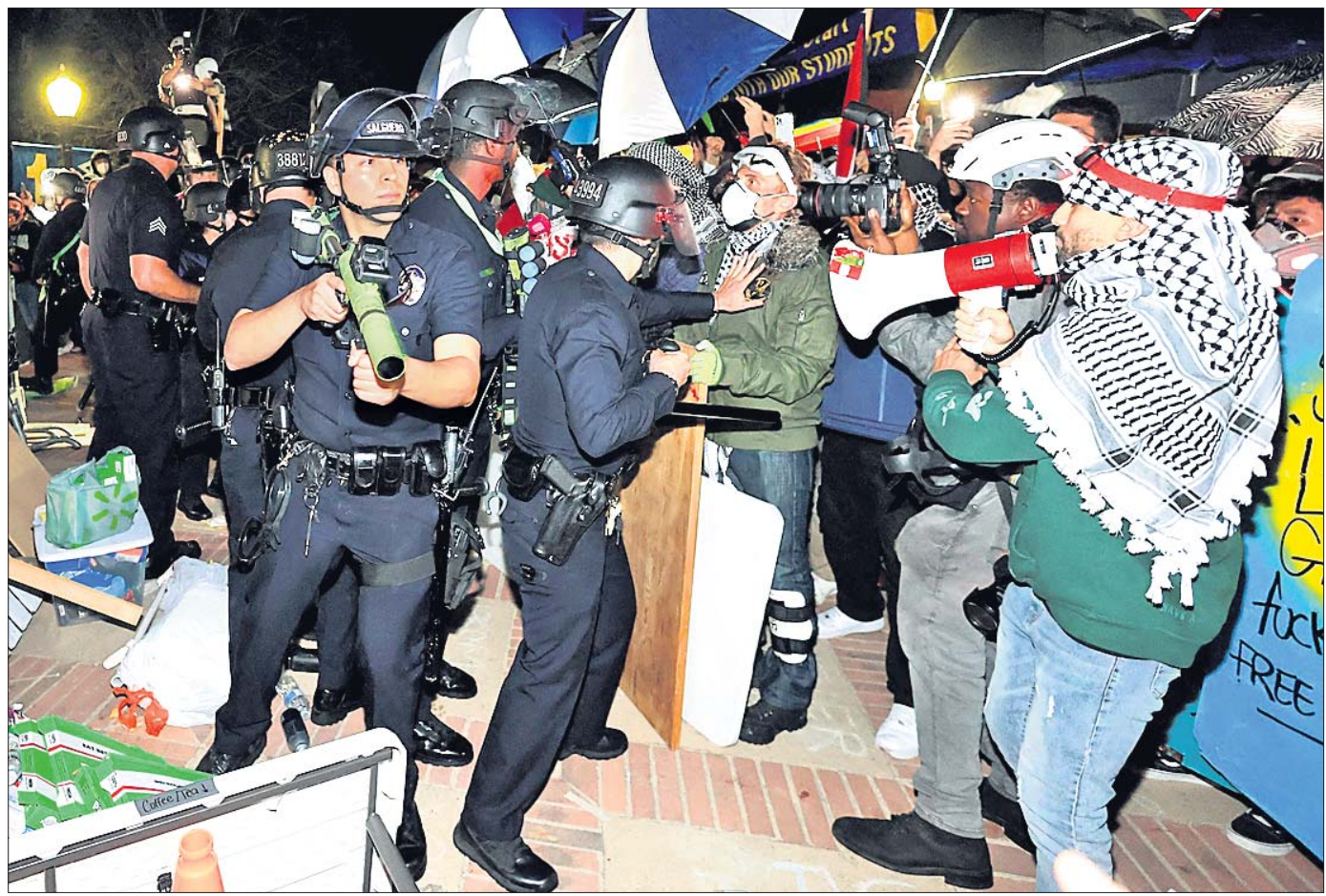
କାଲିଫର୍ନିଆ ପୋଲିସ୍ ଯୁଦ୍ଧବିରୋଧୀ କ୍ୟାମ୍ପସ୍ରେ ପଶି ବିସ୍ଫୋରଣ ଘଟାଇବା ପାଇଁ ଷ୍ଟୁଡେଣ୍ଟସ୍ ଫାୟାର କରୁଛି।

କାଲିଫର୍ନିଆର ଲସ୍ ଏଞ୍ଜେଲସ୍ରେ ଚଳୁଥିବା ଯୁଦ୍ଧବିରୋଧୀ ଆନ୍ଦୋଳନରେ ପୋଲିସ୍ ବର୍ବରତା ଚାଲିଛି। ପୋଲିସ୍ ଯୁଦ୍ଧବିରୋଧୀ କ୍ୟାମ୍ପସ୍ରେ ପଶି ବିସ୍ଫୋରଣ ଘଟାଇବା ପାଇଁ ଷ୍ଟୁଡେଣ୍ଟସ୍ ଫାୟାର କରୁଛି।