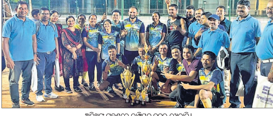
ଅତିଥିକ ଗହଣରେ ଚାମ୍ପିୟନ ଦଳର ଖେଳାଳି।

ସଚିବାଳୟ ଅନ୍ତର୍ଭାଗୀୟ କ୍ରୀଡ଼ା ଭୁବନେଶ୍ୱର, ୨୫ (ସରୋଜ କେନା) ସଚିବାଳୟ ଅନ୍ତର୍ଭାଗୀୟ ଭଲିବଲ୍ (ପୁରୁଷ) ଏବଂ ପ୍ରୋ ବଲ୍ (ମହିଳା) ପ୍ରତିଯୋଗିତାରେ ଖାଦ୍ୟ ଯୋଗାଣ ଓ ଖାଉଟି କଲ୍ୟାଣ ବିଭାଗ ଚାମ୍ପିୟନ ଆଖ୍ୟା ଅର୍ଜନ କରିଛି।