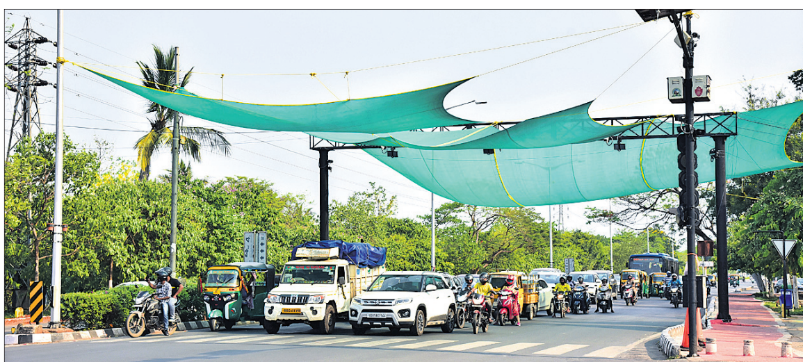
ଖରାବୁ ଯାତ୍ରାକୁ ସୁରକ୍ଷା ଦେବାକୁ ବିଏମ୍‌ସି ପକ୍ଷରୁ ନାଲକୋ ଗ୍ରାମିକ ଛକ (କଳିଙ୍ଗ ହସିଦାଳ ନିକଟ)ରେ ରାସ୍ତା ଉପରେ ଗ୍ରାନ୍ ସେଡ୍ ଗଠାଯାଇଛି।