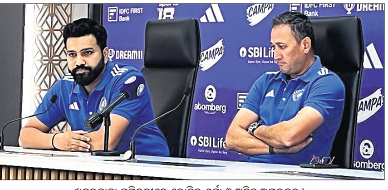
ଖବରଦାତା ସମ୍ମିଳନୀରେ ରୋହିତ ଶର୍ମା ଓ ଅଜିତ ଅଗରକର।

ପୂର୍ଣ୍ଣା, ୨୫ (ପି.ଟି.) ଆମେରିକା ଓ ଫ୍ଲୋରିଡାରେ ଖେଳାଯିବାକୁ ଥିବା ୨୦ କ୍ରିକେଟ ବିଶ୍ୱକପ ପାଇଁ ୧୫ ଜଣିଆ ଭାରତୀୟ ଦଳ ମଙ୍ଗଳବାର ଦୋଷଣା କରାଯାଇଥିଲା। ଏହି ଦଳକୁ ନେଇ ବିଭିନ୍ନ ମହଲରେ ମିଶ୍ର ପ୍ରତିକ୍ରିୟା ଦେଖିବାକୁ ମିଳିଛି। ଗୁରୁବାର ଭାରତୀୟ ଦଳର ଅଧିନାୟକ ରୋହିତ ଶର୍ମା ଓ ମୁଖ୍ୟ ଚୟନକର୍ତ୍ତା ଅଜିତ ଅଗରକର ଏକ ଖବରଦାତା ସମ୍ମିଳନୀ କରିଥିଲେ।