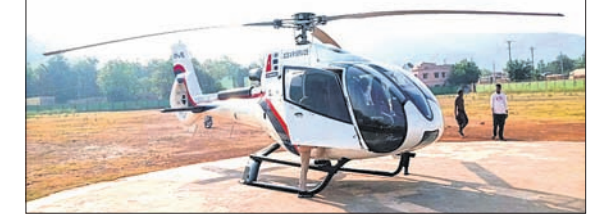
ଭେକାନାଳ ସହର ମହିଷାପାଟ ପଲିକ୍ଲିନିକ୍ ପଡ଼ିଆରେ ଜରୁରୀ ଅବତରଣ କରିଥିବା ହେଲିକପ୍ଟର ।

ଭେକାନାଳ ସହର ମହିଷାପାଟ ପଲିକ୍ଲିନିକ୍ ପଡ଼ିଆରେ ରୁଡ୍‌କାର ସକାଳ ୬ଟା ୧୦ରେ ଏକ ହେଲିକପ୍ଟର ଜରୁରୀ ଅବତରଣ କରିଥିଲା ।