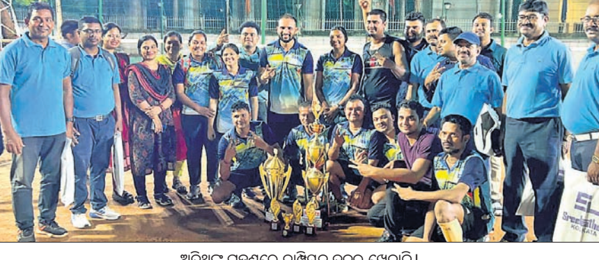
ଅତିଥିକ ଗହଣରେ ଚାମ୍ପିୟନ ଦଳର ଖେଳାଳି।

ଭୁବନେଶ୍ୱର, ୨୫ (ସରୋଜ କେନା) ସତିବାଳୟ ଅନ୍ତର୍ଭାଗୀୟ ଭଲିବଲ୍ (ପୁରୁଷ) ଏବଂ ପ୍ରୋ ବଲ୍ (ମହିଳା) ପ୍ରତିଯୋଗିତାରେ ଖାଦ୍ୟ ଯୋଗାଣ ଓ ଖାଉଟି କଲ୍ୟାଣ ବିଭାଗ ଚାମ୍ପିୟନ ଆଖ୍ୟା ଅର୍ଜନ କରିଛି। ଖାଦ୍ୟ ଯୋଗାଣ ଓ ଖାଉଟି କଲ୍ୟାଣ ବିଭାଗର ସାଂସ୍କୃତିକ ସଂସଦ ଦ୍ୱାରା ଏପ୍ରିଲ ୩ରୁ ସତିବାଳୟ ମିଳି ଷ୍ଟାଡିୟମରେ ଆୟୋଜିତ ହୋଇଥିଲା। ଏହି ପ୍ରତିଯୋଗିତା। ଏଥିରେ ୨୯ଟି ବିଭାଗ ଅଂଶଗ୍ରହଣ