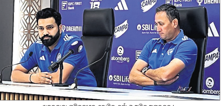
ଖବରଦାତା ସମ୍ମିଳନୀରେ ରୋହିତ ଶର୍ମା ଓ ଅଭିଷେକ ଅଗରକର।

ପୁଣ୍ୟାଳ, ୨୫ (ପି.ଟି.) ଆମେରିକା ଓ ଫ୍ଲୋରିଡାରେ ଖେଳାଯିବାକୁ ଥିବା ୨୦ କ୍ରିକେଟ ବିଶ୍ୱକପ ପାଇଁ ୧୫ ଜଣିଆ ଭାରତୀୟ ଦଳ ମଙ୍ଗଳବାର ଦୋଷଣା କରାଯାଇଥିଲା। ଏହି ଦଳକୁ ନେଇ ବିଭିନ୍ନ ମହଲରେ ମିଶ୍ର ପ୍ରତିକ୍ରିୟା ଦେଖିବାକୁ ମିଳିଛି। ଗୁରୁବାର ଭାରତୀୟ ଦଳର ଅଧିନାୟକ ରୋହିତ ଶର୍ମା ଓ ମୁଖ୍ୟ ଚୟନକର୍ତ୍ତା ଅଭିଷେକ ଅଗରକର ଏକ ଖବରଦାତା ସମ୍ମିଳନୀ କରିଥିଲେ। ଫର୍ମରେ ନ ଥିବା ହାର୍ଦ୍ଦିକ ପାଣ୍ଡ୍ୟଙ୍କୁ ଉପ ଅଧିନାୟକ ଦୋଷଣା କରାଯିବାକୁ ବିଭିନ୍ନ ମହଲରେ ସମାଲୋଚନା କରାଯାଇଥିଲା। ତେବେ ଅଗରକର ଏହାକୁ ଠିକ୍ ନିଷ୍ପତ୍ତି ବୋଲି କହିଛନ୍ତି। ହାର୍ଦ୍ଦିକ ଯାହା କରନ୍ତି ଅନ୍ୟ କୌଣସି ଖେଳାଳି ଏହା କରିବା ସମ୍ଭବ ନୁହେଁ। ତେଣୁ ବର୍ତ୍ତମାନ ହାର୍ଦ୍ଦିକଙ୍କ ବିକଳ ମିଳିବା ଅସମ୍ଭବ ବୋଲି କହିଛନ୍ତି ଅଗରକର। ସେହିପରି ଫିଟ୍ ଥିବାରୁ ହାର୍ଦ୍ଦିକ କ୍ଷତ୍ରିୟ ଭାବରେ ଚୟନ ହୋଇଥିବା ସେ କହିଛନ୍ତି। ଏପରି କି ବିନା ଆଲୋଚନାରେ ହିଁ ହାର୍ଦ୍ଦିକଙ୍କୁ ଉପ ଅଧିନାୟକ ଦୋଷଣା କରାଯାଇଥିଲା। ସେ ଶେଷ ଥର ପାଇଁ ୨୦୨୩ ଦିନିକିଆ କ୍ରିକେଟ ବିଶ୍ୱକପରେ ଅନ୍ତର୍ଦ୍ଦାତା କ୍ରିକେଟ ଖେଳିଥିଲେ। ପୁଣ୍ୟାଳ ଇଣ୍ଡିଆନ୍ ପାଇଁ ହାର୍ଦ୍ଦିକ ଖେଳୁଥିବା ବେଳେ ସମ୍ପୂର୍ଣ୍ଣ ଫିଟ୍ ଅଛନ୍ତି। ହାର୍ଦ୍ଦିକଙ୍କ ଉପସ୍ଥିତି ରୋହିତଙ୍କୁ ସମ୍ପୂର୍ଣ୍ଣ ପ୍ରଦାନ କରିବ ବୋଲି ଅଗରକର କହିଛନ୍ତି। ଉଲ୍ଲେଖଯୋଗ୍ୟ ଯେ, ଆଇପିଏଲ୍ ୨୦୨୪ରେ ରୋହିତ ଶର୍ମାଙ୍କ ସ୍ଥାନରେ ପୁଣ୍ୟାଳ ଇଣ୍ଡିଆନ୍ ହାର୍ଦ୍ଦିକଙ୍କୁ ଅଧିନାୟକ ଦାୟିତ୍ୱ ଦେଇଥିଲା। ସେହିପରି ଦ୍ୱିତୀୟ ଉତ୍ତରାଧିକାରୀ ଭାବରେ ମଧ୍ୟକ୍ରମରେ ଜଣେ ବ୍ୟାଟର ଆବଶ୍ୟକ ଥିବାରୁ ଲୋକେଶ ରାହୁଲଙ୍କ ବଦଳରେ ସଞ୍ଜୁ ସାମସନଙ୍କୁ ସୁଯୋଗ ମିଳିଲା ବୋଲି କହିଛନ୍ତି ଅଗରକର। ରାହୁଲ ନିସ୍ୱସନ୍ଦେହରେ ଜଣେ ଚମତ୍କାର ଖେଳାଳି। ତେବେ ସଞ୍ଜୁ ସାମସନ ମଧ୍ୟକ୍ରମରେ ଖେଳିବାର ଦକ୍ଷତା ରଖୁଥିବାରୁ ତାଙ୍କୁ ପ୍ରାଥମିକତା ଦିଆଗଲା ବୋଲି ଅଗରକର କହିଛନ୍ତି। ସେହିପରି ରିକ୍ତ ସିଂ ଓ ଶୁଭମନ ଗିଲଙ୍କୁ ବାଦ୍ ଦେବା ଏକ କଷ୍ଟକର ନିଷ୍ପତ୍ତି ଥିଲା ବୋଲି