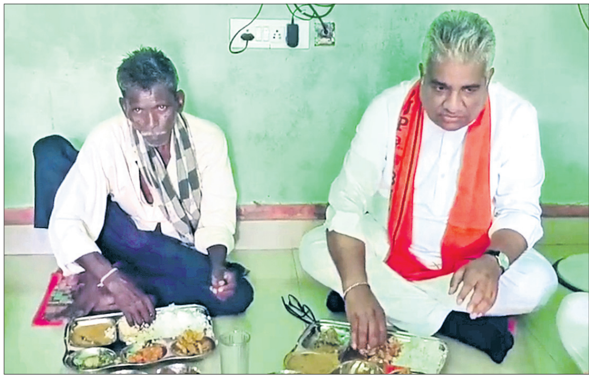
ଦଳିତ ପରିବାରରେ ଭୋଜନ କରୁଛନ୍ତି କେନ୍ଦ୍ରମନ୍ତ୍ରୀ ଭୂପେନ୍ଦ୍ର ଯାଦବ ।