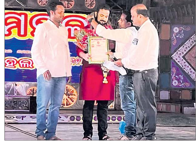
ଜଣେ ଅତିଥିଙ୍କୁ ସମର୍ପଣ କରାଯାଇଛି ।

ରଘୁଲପୁର ବ୍ଲକ ଅନ୍ତର୍ଗତ ବଡ଼କଲସ୍ତ୍ର ପଞ୍ଚାୟତ ମଧ୍ୟବନ ହିଲ୍ସା ପୂଜା କମିଟି ପଞ୍ଚାୟତ ମଧ୍ୟବନ ହିଲ୍ସା ପୂଜା କମିଟି ପ୍ରତିଭା ସମ୍ମାନ ଉତ୍ସବ ଅନୁଷ୍ଠିତ ହୋଇଯାଇଛି।