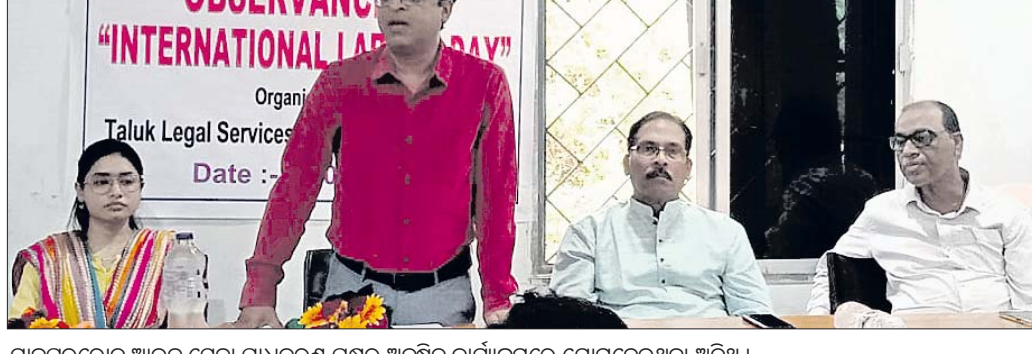
ଯାଜପୁରରେ ଆଇନ ସେବା ପ୍ରାଧିକରଣ ପକ୍ଷରୁ ଅନୁଷ୍ଠିତ କାର୍ଯ୍ୟକ୍ରମରେ ଯୋଗଦେଇଥିବା ଅତିଥି ।

ଯାଜପୁରରେ ଆଇନ ସେବା ପ୍ରାଧିକରଣ (ଲିଗାଲ ସେଲ୍ ସର୍ଭିସେସ୍) ପକ୍ଷରୁ ବିଶ୍ୱ ଶ୍ରମିକ ଦିବସ ପାଳିତ ହୋଇଯାଇଛି।