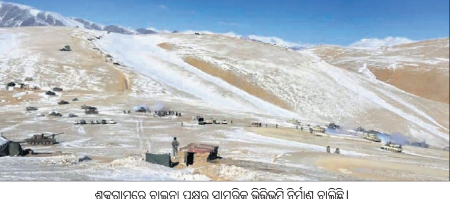
ଶକ୍ତରାମ୍ରେ ଚାନ୍ଦନା ପକ୍ଷରୁ ସାମରିକ ଭିତ୍ତିକୂଳି ନିର୍ମାଣ ଚାଲିଛି ।

ନୂଆଦିଲ୍ଲୀ, ୨୧୫ ପୂର୍ବ ଲଦାଖ ଅନ୍ତର୍ଗତ ପ୍ରକୃତ ନିୟନ୍ତ୍ରଣ ରେଖା (ଏଲଏସଏ) ଅଞ୍ଚଳରେ ସେନା ଅନୁପ୍ରବେଶ କରାଇ ଚାନ୍ଦନା ଉତ୍ତେଜନାପୂର୍ଣ୍ଣ ସ୍ଥିତି ଜାରି ରଖୁଥିବାବେଳେ ସିଆରେନ୍ ନିକଟବର୍ତ୍ତୀ ଶକ୍ତରାମ୍ ଉପତ୍ୟକାରେ ସାମରିକ ଭିତ୍ତିକୂଳି ନିର୍ମାଣ କରୁଛି । ଏହା ଭାରତ ପାଇଁ ସାମରିକ ବିପଦ ସୃଷ୍ଟି କରୁଛି । ପାକ୍ ଅଧିକୃତ ଜମି (ପିଓକେ) ଅନ୍ତର୍ଗତ ଶକ୍ତରାମ୍ ଉପତ୍ୟକା ରଣନୈତିକ ଦୃଷ୍ଟିରୁ ଗୁରୁତ୍ୱପୂର୍ଣ୍ଣ ଅଞ୍ଚଳ । ବହୁବର୍ଷ ହେଲା ଚାନ୍ଦନା ଏଲଏସଏରେ ଅନୁପ୍ରବେଶ କରିଆରେ ଭାରତ ଉପରେ ସାମରିକ ଚାପ ଜାରି ରଖୁଛି । ଚାନ୍ଦନା ଏହି ଅନୁପ୍ରବେଶ ଏକ କୌଶଳଗତ ଯୋଜନା । ଉଭୁ ଅଞ୍ଚଳରେ ସ୍ଥାୟୀ ଉପସ୍ଥିତି ଲକ୍ଷ୍ୟରେ ଚାନ୍ଦନା ଏଲଏସଏରେ ଚାନ୍ଦନା ରଖିଛି । ଚାନ୍ଦନା ସହ ଭାରତର ୩,୪୮୮ କି.ମି ସୀମା ରହିଥିବାବେଳେ ବେଙ୍ଗ ପକ୍ଷରୁ ଏହାକୁ ଉଲ୍ଲଙ୍ଘନ କରିବା ଓ ଅନୁପ୍ରବେଶ କରାଯିବା ଘଟଣା ସମ୍ପର୍କରେ ଅନ୍ତରାଳୀୟ ସମ୍ପର୍କରେ ଏବେ ପିଓକେରେ