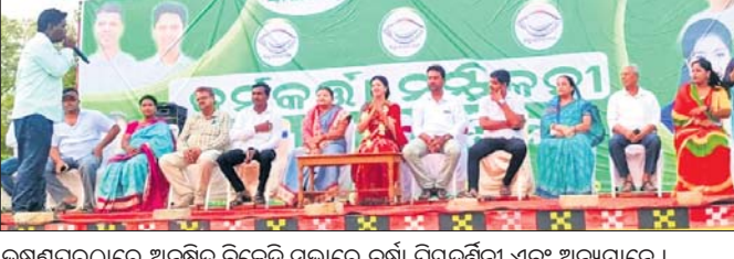
ଭୁବନେଶ୍ୱରରେ ଅନୁଷ୍ଠିତ ବିଜେଡି ସଭାରେ ଧର୍ମଶାଳାରେ ପ୍ରଥମ ଥର ପାଇଁ ପ୍ରମୁଖ୍ୟ ଧର୍ମଶାଳାରେ ସଭା ଅନୁଷ୍ଠିତ ହେବ।

ବୈଜ୍ଞାନିକ ଯୁଗର ଅନୁଷ୍ଠିତ ସଭାରେ ଧର୍ମଶାଳାରେ ପ୍ରଥମ ଥର ପାଇଁ ପ୍ରମୁଖ୍ୟ ଧର୍ମଶାଳାରେ ସଭା ଅନୁଷ୍ଠିତ ହେବ। ଏହାକୁ ନେଇ ଅନୁରୋଧ କରାଯାଇଛି।