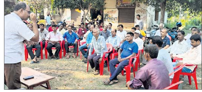
ଶ୍ରମିକ ଦିବସରେ ଯୋଗଦେଇଥିବା ଅତିଥି ଉଦ୍‌ବୋଧନ ଦେଉଛନ୍ତି ।