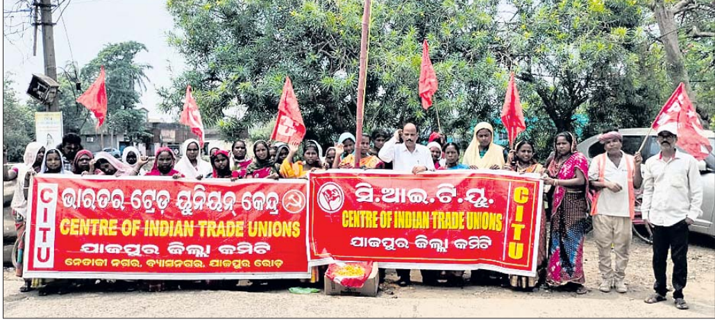
ବିଶ୍ୱ ଶ୍ରମିକ ଦିବସ ଯାଜପୁର ଜିଲ୍ଲା ସିଆଇଟିୟୁ ପକ୍ଷରୁ ବାହାରିଥିବା ଶୋଭାଯାତ୍ରା ।

ଯାଜପୁରରେ, ୨୫ (ପବିତ୍ର ରଞ୍ଜନ ମହାନ୍ତି): ଯାଜପୁର ଜିଲ୍ଲା ସିଆଇଟିୟୁ ପକ୍ଷରୁ ବିଶ୍ୱ ଶ୍ରମିକ ଦିବସ ପାଳିତ ହୋଇଯାଇଛି।