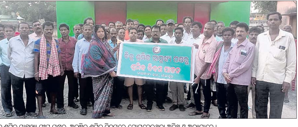
ବିଜୁ ଶ୍ରମିକ ସାମ୍ମୁଖ୍ୟ ସଂଘ ପକ୍ଷରୁ ଅନୁଷ୍ଠିତ ଶ୍ରମିକ ଦିବସରେ ଯୋଗଦେଇଥିବା ଅତିଥି ଓ ଅନ୍ୟମାନେ।

ବୈଜ୍ଞାନିକ ଯୁଗର ଅନୁଷ୍ଠିତ ସଭାରେ ଧର୍ମଶାଳାରେ ପ୍ରଥମ ଥର ପାଇଁ ପ୍ରମୁଖ୍ୟ ଧର୍ମଶାଳାରେ ସଭା ଅନୁଷ୍ଠିତ ହେବ। ଏହାକୁ ନେଇ ଅନୁରୋଧ କରାଯାଇଛି।