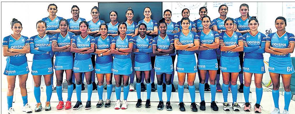
ଭାରତୀୟ ମହିଳା ହକି ଦଳ ।

ବାଲାଦେଶକୁ ହରାଇଲା ଭାରତ ବିଜୟ ହାସଲ କରିଛି ଥିବାପରେ ମଧ୍ୟ ଭାରତ ସମେତ ପୁରୁଷ ଟେନିସ୍ ବିଜେତା ଭାବେ ପରିଚିତ ଭାରତୀୟ ଟେନିସ୍ ପୁରସ୍କାର ପ୍ରଦାନ କରାଯାଇଛି।