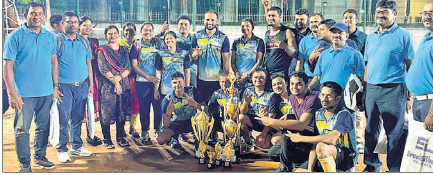
ଅତିଥିକ ଗହଣରେ ଚାମ୍ପିୟନ ଦଳର ଖେଳାଳି।

ସଚିବାଳୟ ଅନ୍ତର୍ଭାଗୀୟ କ୍ରୀଡ଼ା ଭୁବନେଶ୍ୱର, ୨୫ (ସରୋଜ କେନା) ସଚିବାଳୟ ଅନ୍ତର୍ଭାଗୀୟ ଭଲିବଲ୍ (ପୁରୁଷ) ଏବଂ ପ୍ରୋ ବଲ୍ (ମହିଳା) ପ୍ରତିଯୋଗିତାରେ ଖାଦ୍ୟ ଯୋଗାଣ ଓ ଖାଉଟି କଲ୍ୟାଣ ବିଭାଗ ଚାମ୍ପିୟନ ଆଖ୍ୟା ଅର୍ଜନ କରିଛି।