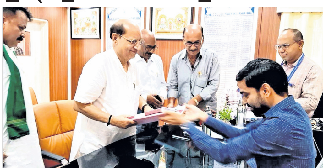
ବରିଷ୍ଠ ନେତା ପ୍ରସନ୍ନ ଆଚାର୍ଯ୍ୟ ଶୁକ୍ରବାର ପ୍ରାର୍ଥପତ୍ର ଦାଖଲ କରୁଛନ୍ତି।