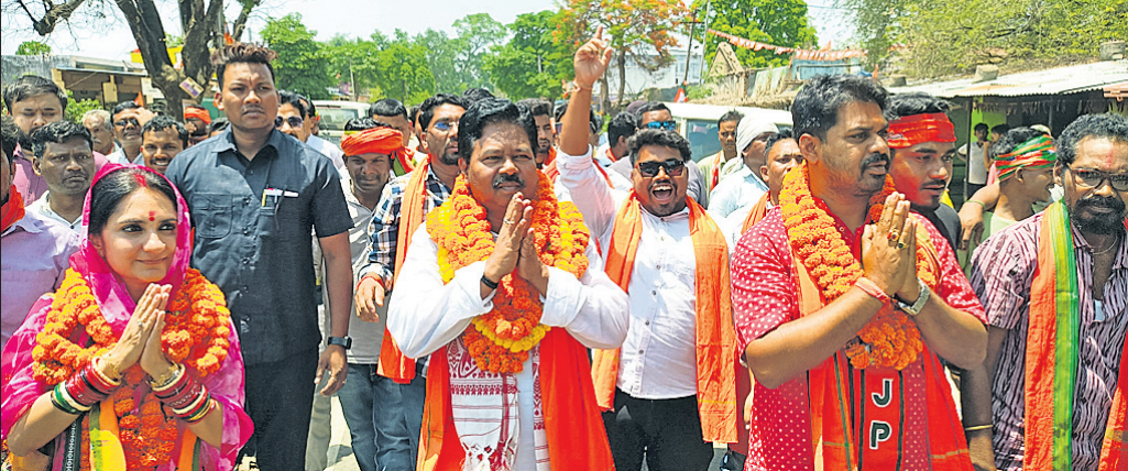
ପ୍ରାର୍ଥୀଙ୍କ ସହ କେନ୍ଦ୍ରମନ୍ତ୍ରୀ ଭୋଟ ଭିକ୍ଷା କରୁଛନ୍ତି ।

କେନ୍ଦ୍ର ଆବିବାଦି ବ୍ୟାପାର ତଥା ଜନଶକ୍ତି ମନ୍ତ୍ରୀ ବିଶ୍ୱେଶ୍ୱର ଚୁଡ଼ ଶୁକ୍ରବାର ଦିଲ୍ଲିରେ ନୂଆପଡ଼ା ଜିଲ୍ଲା ଗସ୍ତରେ ଆସି ଭାରତୀୟ ଜନତା ପାର୍ଟିର ପଥପ୍ରାନ୍ତ ନିର୍ବାଚନୀ ସଭାରେ ଯୋଗଦେଇ ଭୋଟ ଭିକ୍ଷା କରିଥିଲେ ।