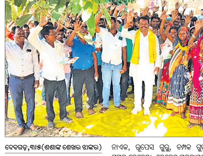
ଦେବଗଡ଼,୩୫୫(ଶଶାଙ୍କ ଶେଖର ଝାଙ୍କର)

ରିଆମାଳ କୁଳ ଗୁଣ୍ଡିଆପାଲି ଗ୍ରାମ ପଞ୍ଚାୟତର ପେଣ୍ଡ୍ରାଖୋଳ ଗ୍ରାମରେ ଦେବଗଡ଼ ଜିଲ୍ଲା କଂଗ୍ରେସ ପକ୍ଷରୁ ଏକ ନିର୍ବାଚନୀ ସଭା ଅନୁଷ୍ଠିତ ହୋଇଯାଇଛି।