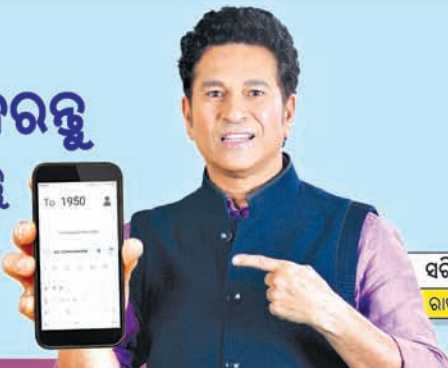
ସଚିବ ତେଜୁକବର ରାଷ୍ଟ୍ରୀୟ ଆବେଦନ, ଭସିଆର

<ECI> ଖେତ୍ତ <EPIC No.> ଲେଖି 1950କୁ ଏସଏମଏସ୍ ପଠାନ୍ତୁ କିମ୍ବା elections24.eci.gov.in ପରିଦର୍ଶନ କରନ୍ତୁ