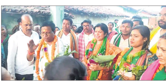
ବେଳଖଣ୍ଡି ଅଞ୍ଚଳରେ ସାଂସଦ ବିଧାୟକ ପ୍ରାର୍ଥୀଙ୍କ ପ୍ରଚାର ।

କଳାହାଣ୍ଡିର ଅଗ୍ରଣୀ ସ୍ମାରକୀ ନାଟ୍ୟ ସଂସ୍ଥା ପକ୍ଷରୁ ଚୁରୁକାଠେଇ ଭବାନୀପାଟଣା କଳାହାଣ୍ଡି ଲେଖକ କଳା ପରିଷଦଠାରେ ନାଟ୍ୟ କର୍ମଶାଳା ଉଦ୍‌ଘାଟିତ ହୋଇଯାଇଛି ।