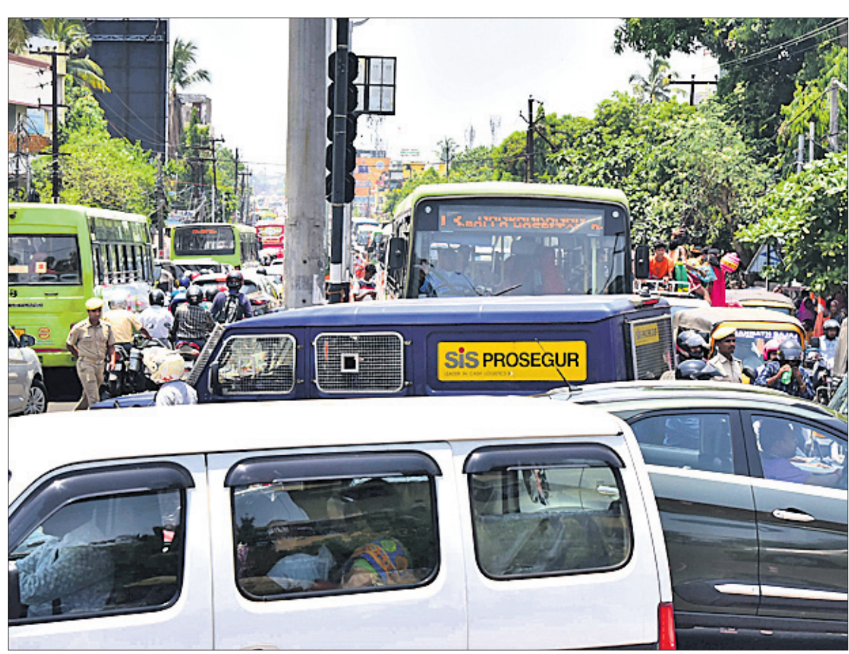
ନାମାଙ୍କନପତ୍ର ଦାଖଲ କରିବାକୁ ପ୍ରାର୍ଥୀମାନେ ଶୋଭାଦାଣ୍ଡରେ ଯାଉଥିବାବେଳେ ଶୁକ୍ରବାର ଭୁବନେଶ୍ୱର ରବି ଚକ୍ର ଛକ ନିକଟରେ ସୃଷ୍ଟି ହୋଇଥିବା ଗ୍ରାମିକ ଜାମ୍।