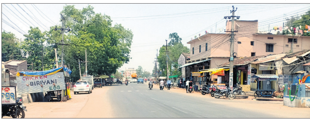
କେସିଙ୍ଗା ସହରର ଆମ୍ବେଡକର ଛକ ଶୂନ୍ୟଶାନ୍ତ ।