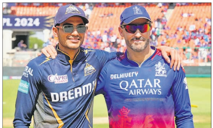
ଶୁଭମନ ବିଲ୍ ଓ ପାଫ ଭୁବେସୁୟା

ବ୍ୟାଟ୍ସମ୍ୟାନ ବେଙ୍ଗାଳୁରୁ (ଆରସିବି) ଓ ଗୁଜରାଟ ଗାଜେଟ୍ ମଧ୍ୟରେ ମ୍ୟାଚ ଅନୁଷ୍ଠିତ ହେବ। ଭୁବେସୁୟା ଯାକ ଦଳର ପ୍ରଦର୍ଶନରେ ସ୍ଥିରତା ରହିନାହିଁ।