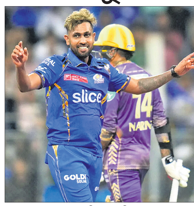
ଭଲ୍ ବୋଲି ମନାସରେ ଭଲ୍ ବୋଲି ମୁମ୍ବାଇ ଇଣ୍ଡିଆନ୍ସର ମୁମ୍ବାଇ ଧୂଳିସାତ।

ମୁମ୍ବାଇ ଧୂଳିସାତ ହୋଇଛି। ଅନ୍ୟପକ୍ଷରେ କରତ୍ତୀର ପକ୍ଷରେ ହେଇଛି ପକ୍ଷ।