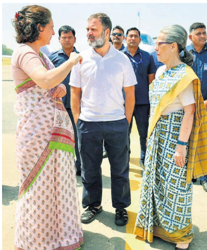
ରାଏବରେଲି ଲୋକ ସଭା ଆସନ ନିମନ୍ତେ ନାମାଙ୍କନପତ୍ର ଦାଖଲ ପାଇଁ ଶୁକ୍ରବାର ପହଞ୍ଚିଥିବା କଂଗ୍ରେସ ନେତା ରାହୁଲ ଗାନ୍ଧୀଙ୍କ ସହ ମା' ସୋନିଆ ଗାନ୍ଧୀ ଓ ଭଉଣୀ ପ୍ରିୟଙ୍କା ଗାନ୍ଧୀ ଭଦ୍ରା ଆଲୋଚନାରେ ।