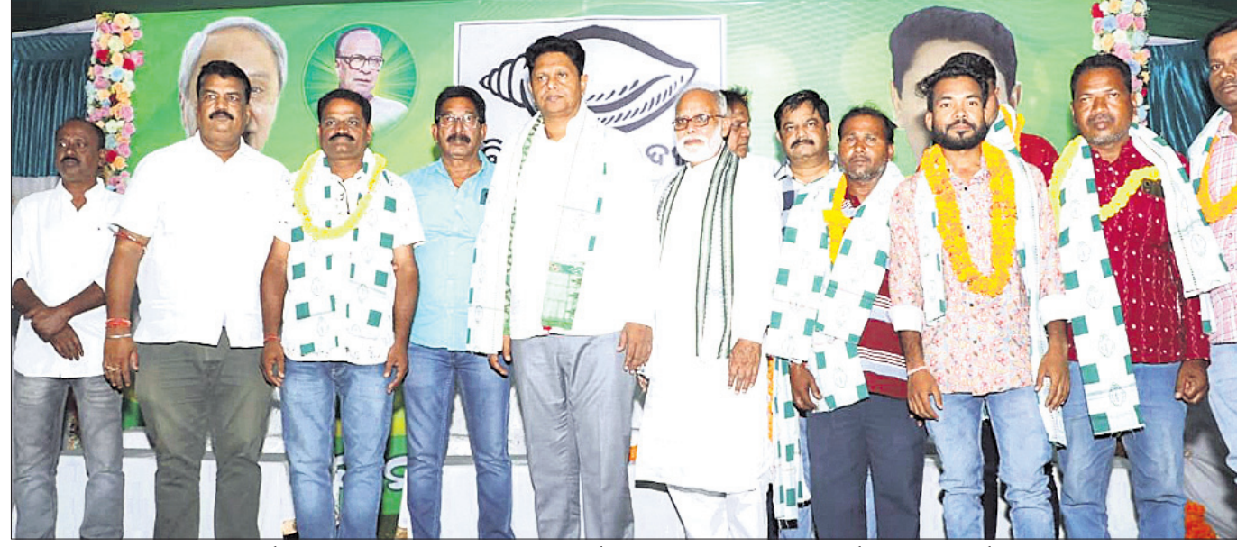
ସମ୍ବଲପୁର ଲୋକ ସଭା କ୍ଷେତ୍ର ଅନ୍ତର୍ଗତ ଭାଲୁପାଲି ନିକଟସ୍ଥ ବିଜୁ ଜନତା ଦଳର କାର୍ଯ୍ୟାଳୟଠାରେ ଆୟୋଜିତ ମିଶ୍ରଣ ପର୍ବରେ ନେତା ଓ କର୍ମୀମାନେ।

ତାଙ୍କ ମୁହଁକୁ ପଢ଼ିବେ କଥା କହିନାହାନ୍ତି। ରେଞ୍ଜାଲି ନିର୍ବାଚନ ମଣ୍ଡଳୀ ପାଇଁ ରାଜ୍ୟ ସରକାରଙ୍କ ପକ୍ଷରୁ ବିଜୁ ଜନତାଦଳର କାମ କରାଯାଇଛି। ମନ୍ଦିର, ମସଜିଦ, ଚର୍ଚ୍ଚ, ରାସ୍ତାଘାଟ ଲୋକେ ଯାହା କାମ ଦାବି କରିଥିଲେ, ତାହା ପୂରଣ କରାଯାଇଛି। ତେଣୁ କି ଆପଣମାନେ ଅସଲ କଥାକୁ ବୁଝି ବିଜୁ ଜନତା ଦଳରେ ସାମିଲ ହେବାର ନିଷ୍ପତ୍ତି ନେଇଥିବାରୁ ମୁଁ ବୁଦ୍ଧି, କୃଷିବାଣୀ, ଖାଦ୍ୟ ପୁରଣା, ପାନୀୟ ଜଳ, ଆବାସ ଏବଂ ବିଜୁ ଚିତ୍ରପଟ୍ଟି ପ୍ରସଙ୍ଗରେ ମିଶ୍ରଣ ପର୍ବରେ ଶତାଧିକ କର୍ମୀ ସାମିଲ ହୋଇ କାର୍ଯ୍ୟକ୍ରମକୁ ସଫଳ କରିଥିଲେ।