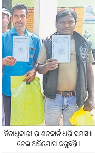
ହତାଧିକାରୀ ରାଗନକାର୍ଡ ଧରି ସମସ୍ୟା ନେଇ ଅଭିଯୋଗ କରୁଛନ୍ତି।

ପ୍ରତ୍ୟେକ ବ୍ୟକ୍ତିଙ୍କ ଜୀବନ ସୁଧୁ ମୂଲ୍ୟବାନ। ଏଭଳି ମହତ ଉଦ୍ଦେଶ୍ୟ ରଖି ରାଜ୍ୟ ସରକାର ଖାଦ୍ୟ ସୁରକ୍ଷା ଯୋଜନାରେ ସାମିଲ ହେବାକୁ ବିଜୁ ସ୍ୱାସ୍ଥ୍ୟ କାର୍ଡ ଦାଖଲ କରିଛନ୍ତି।