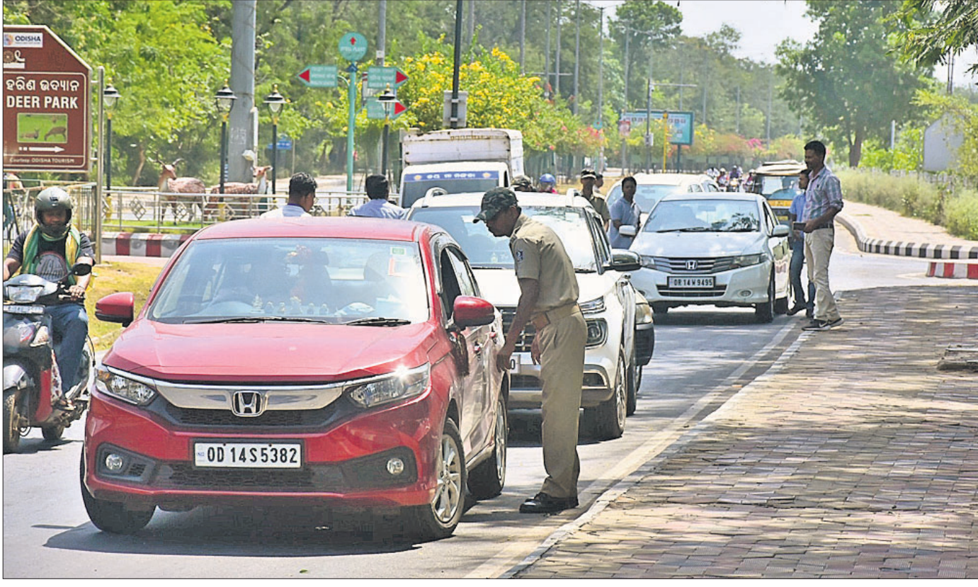
ନିର୍ବାଚନ ପାଇଁ ରାଉରକେଲା ରିଜିଷ୍ଟ୍ରେସନରେ ପୋଲିସ୍ ପକ୍ଷରୁ ଗୁଡିଫୋଟର ଚେକିଂ କରାଯାଇଛି।

ଟ୍ରକ ଧକ୍କାରେ ମୁବକ ମୃତ୍ୟୁ... ରାଉରକେଲା, ୩୫ (ସଙ୍ଗୀତା ଜେନା) ସେକ୍ଟର-୩ ଥାନା ଅନ୍ତର୍ଗତ ସେକ୍ଟର-୨ ଏନ୍-ଏସି ମାର୍ଗରେ ଶୁକ୍ରବାର ଅପରାହ୍ଣରେ ଏକ ଅକ୍ସିଡେଣ୍ଟ ଘଟିଥିଲା।