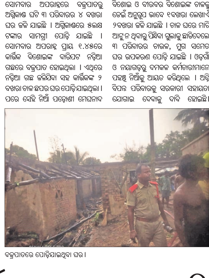
ବକ୍ରପାତରେ ପୋଡ଼ିଯାଇଥିବା ଘର ।