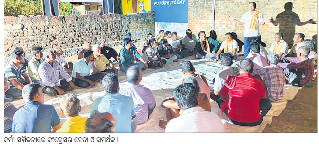
କର୍ମୀ ସମ୍ମିଳନୀରେ କଂଗ୍ରେସର ନେତା ଓ ସମର୍ଥକ ।

ଯୋଗୁ ସମସ୍ୟା ସୃଷ୍ଟି କୋଇଛି । ମହାନଦୀ ଓଡ଼ିଶାର ଜୀବନରେଖା ହୋଇଥିବା ବେଳେ ଚିରସ୍ରୋତା ମହାନଦୀ ଏବେ ସତ୍ୟ ହରାଇବାକୁ ବସିଛି । ଫଳରେ ମହାନଦୀ କୁଳବର୍ତ୍ତୀ ଗାନ୍ଧୀ, ଜନସାଧାରଣ ଏହାର କୁପରିଚାଳନା ଭୋଗିବାକୁ ଯାଉଛି । ମହାନଦୀର ଏପରି ସ୍ଥିତିକୁ ଦେଖି ପରିବେଶବିତ୍ ଓ ବୃଦ୍ଧିକାରିମାନେ ତୀବ୍ର ପ୍ରତିକ୍ରିୟା ପ୍ରକାଶ କରୁଥିବା ବେଳେ ରାଜ୍ୟ ଗ୍ରାମର ମହାନଦୀର ଜୀବିକା ଗଭୀର ଭାବେ ପ୍ରଭାବିତ ହୋଇଛି । ଦୈନିକ ମହାନଦୀରୁ ମାଛଧରି ବ୍ୟବସାୟ କରି ମହାନଦୀରେ ନୟାଗଡ଼କୁ ପାନୀୟ ଜଳ ପ୍ରତିପୋଷଣ ହେଉଥିବା ମହାନଦୀର ବେଉଣା ଚାଲିଯିବା ପରେ ସେମାନଙ୍କ ପରିବାର ଆର୍ଥିକ ଅନାଚନ ମଧ୍ୟରେ ଗତି କରୁଛନ୍ତି । ଅନେକ ବ୍ୟବସାୟ ଛାଡ଼ି ଦାଦନ ମୁହାଁ ହୋଇଛନ୍ତି । ଏହା ସହ ଗୁଲାନ ମାଛ ବଜାରରେ ମହାନଦୀର ମଧୁର ମାଛ ସ୍ୱପ୍ନ ପାଲଟିଗଲାଣି । ଅପରପକ୍ଷେ ଶତାଧିକ ଗାନ୍ଧୀ ନଦୀ ପଠାରେ ବିଭିନ୍ନ ପିନି ପରିବା ଗାନ୍ଧୀ କରି ପରିବାର ପ୍ରତିପୋଷଣ କରୁଥିବା ବେଳେ ସାମ୍ପ୍ରତିକ ପରିସ୍ଥିତିରେ ଜଳସ୍ରୋତ ହ୍ରାସ ସାଙ୍ଗକୁ ବାଲି ପୋତି ହୋଇଯିବା