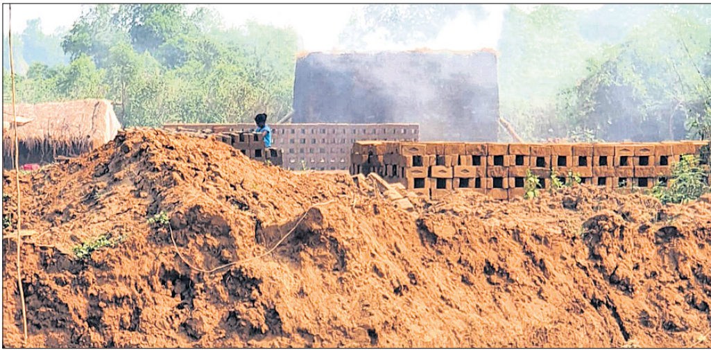
ତାତି ବଢ଼ୁଛି, ଜଙ୍ଗଲ ନଷ୍ଟ ସହ ପରିବେଶ ପ୍ରଦୂଷଣ

ଜଙ୍ଗଲ ପୁରୁଣା ଅଭାବକୁ ନଷ୍ଟ ହେଉଛି । ଉତ୍କଳା ଜଙ୍ଗଲରେ ନୂତନ ଚାଚା ଲଗାଇ ଜଙ୍ଗଲ ସୃଷ୍ଟି କରିବା ପାଇଁ ସରକାର ବହୁ ଅର୍ଥ ବ୍ୟୟ କରୁଥିଲେ ମଧ୍ୟ ଆଶାନ୍ୱରୁତ ପରିବେଶ ପ୍ରଦୂଷିତ ହେବା ସହିତ ତାତି ଭାବେ ସୁପକ ମିଳୁନାହିଁ । ଗୋଟିଏ ପଟେ ଜଙ୍ଗଲ ଅବସ୍ଥାରେ ବୃଦ୍ଧି ଅନ୍ୟପଟେ ନୂତନ ଜଙ୍ଗଲ ସୃଷ୍ଟିରେ ଶିଥିଳତା ପରିବେଶ