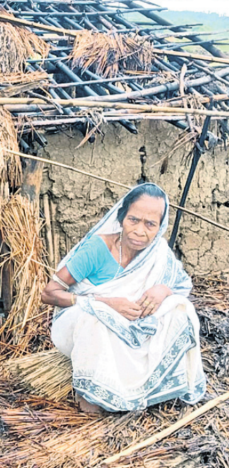
କାଳବୈଶାଖୀ ପ୍ରଭାବରେ କ୍ଷତିଗ୍ରସ୍ତ ହୋଇଥିବା ଘର ।