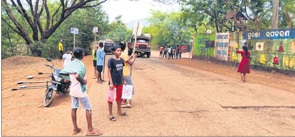
ଛାତ୍ରୀଛାତ୍ର ଯୁ୍ କାର୍ତ୍ତ ଧରି ଗାଡ଼ି ଚାଳକଙ୍କୁ ସଚେତନ କରୁଛନ୍ତି ।