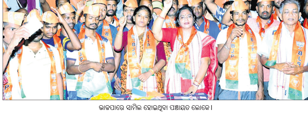
ଭାଜପାରେ ସାମିଲ ହୋଇଥିବା ପଞ୍ଚାୟତ ଲୋକେ ।