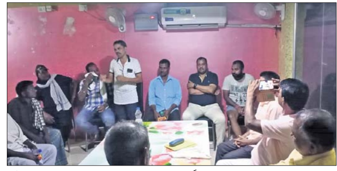
ବୈଠକରେ ଯୋଗଦେଇଥିବା ଭାଜପା ନେତା ଓ କର୍ମୀ ।