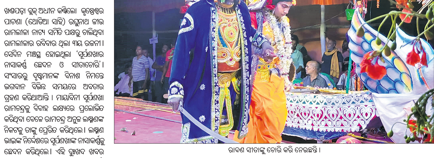
ରାବଣ ସୀତାକୁ ଚୋରି କରି ନେଉଛନ୍ତି ।

ରାବଣ ସୀତାକୁ ଚୋରି କରି ନେଉଛନ୍ତି । ହନୁମାନ ସୀତାକୁ ଠାବ କରିବାକୁ ଯାଇ ସର ନିକ୍ଷେପ କରିଥିଲେ ।