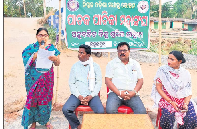
ସମାବେଶରେ ଯୋଗଦେଇଥିବା ପାଟିକା ମହାସଂଘର କର୍ମକର୍ମୀ ।