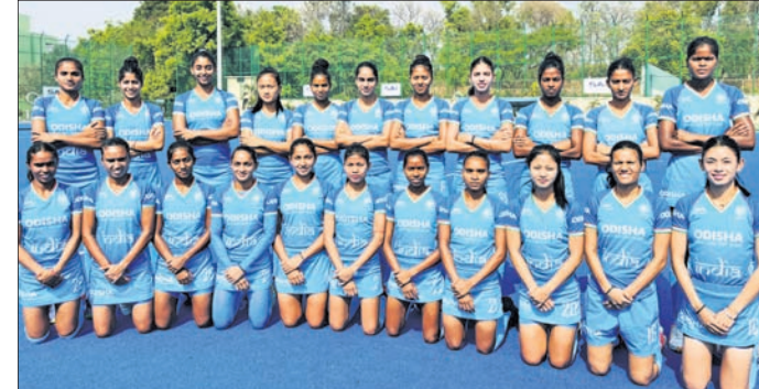
ଝୁରୋପ ଚୁର୍ ପାଇଁ ମନୋନୀତ ଭାରତୀୟ ଜୁନିୟର ମହିଳା ହକି ଦଳ।

ଜୁନିୟର ମହିଳା ହକି ଦଳରେ ଓଡ଼ିଶାର ୪ ଖିଳାଳୀ ନାମିତ।