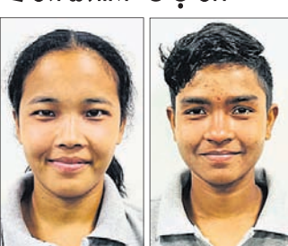
ଏସ୍. ଲିକ୍ଷା କର୍ମ ମାଳତୀ ମୁଖା

ଭୁବନେଶ୍ୱର, ୬୫ (ତପନ ସାଓ): ଝାଡ଼ଖଣ୍ଡକୁ ୨-୦ରେ ହରାଇଲା ଓଡ଼ିଶା।