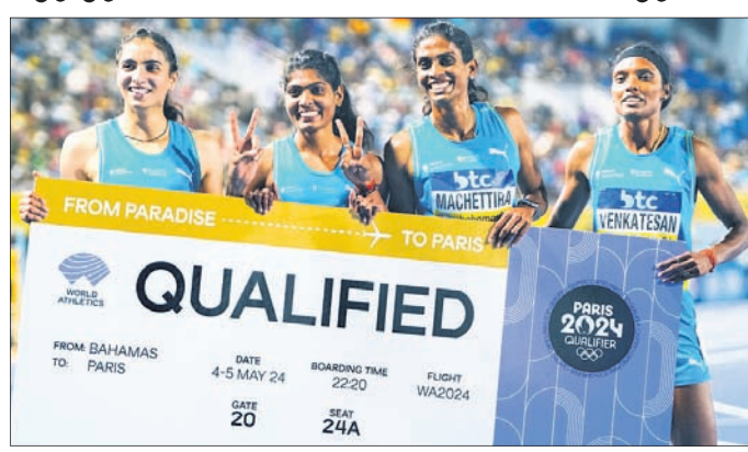
ଅଲିମ୍ପିକ୍ସ ଯୋଗ୍ୟତା ପାଇଥିବା ଭାରତୀୟ ମହିଳା ରିଲେ ଦଳ।

ପୁରୁଷ, ମହିଳା ରିଲେ ଦଳକୁ ଅଲିମ୍ପିକ୍ସ ଯୋଗ୍ୟତା ମିଳିଛି।