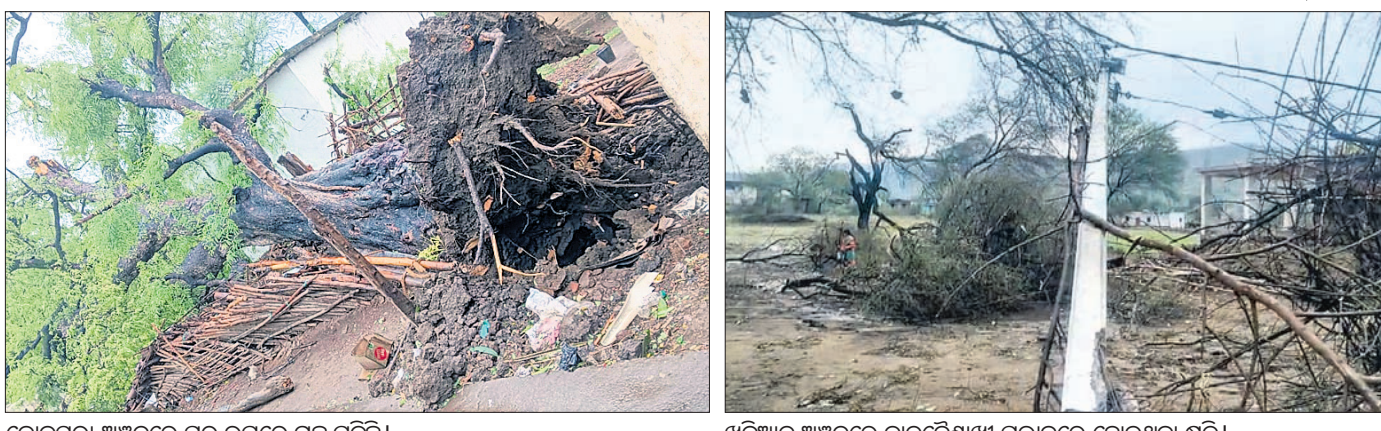
କୋକସରା ଅଞ୍ଚଳରେ ଘର ଉପରେ ଗଛ ପଡ଼ିଛି ।