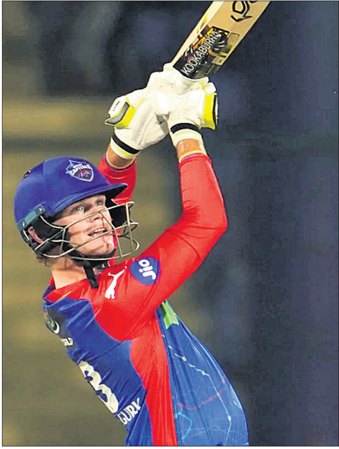
ଛକା ମାରିବା ଅବସରରେ ଜେକ୍ ଫ୍ରେଜର ମ୍ୟାକଗ୍ରାନ୍

ଆଇପିଏଲ୍ କାର୍ଯ୍ୟସୂଚୀ (ଆଜିର ମ୍ୟାଚ) ହାଇଦ୍ରାବାଦ ବନାମ ଲକ୍ଷ୍ନୌ ସ୍ଥାନ: ହାଇଦ୍ରାବାଦ ସମୟ: ସନ୍ଧ୍ୟା ୭.୩୦ ପ୍ରସାରଣ: ଷ୍ଟାର ସ୍ପୋର୍ଟ୍ସ