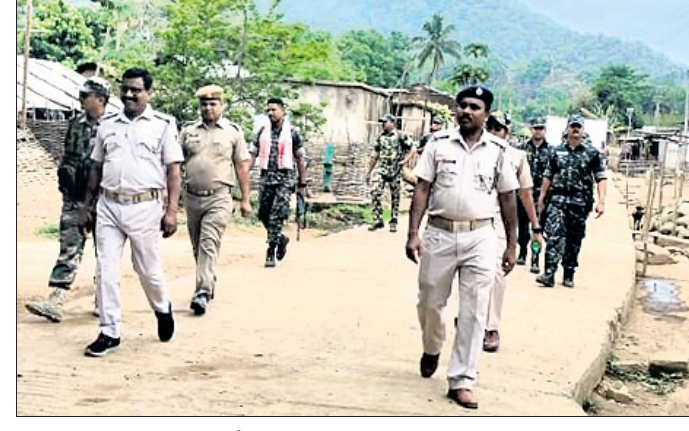
ବଦଳାସାହିଠାରେ ଫ୍ଲାଗମାର୍ଚ୍ଚ କରାଯାଇଛି । ବାରିକ, ବଦଳାସାହି, ଗୋଇସାହି ମତଦାନ କରିବାକୁ ଜନସାଧାରଣଙ୍କୁ ଆଦି ସ୍ଥାନରେ ନିର୍ଭୟର ସହ ସଚେତନ କରାଯାଇଥିଲା ।