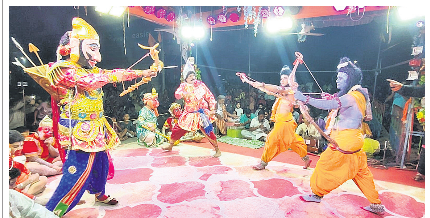
ବଲାଙ୍ଗୀର ଜଗନ୍ନାଥପଡ଼ାଠାରେ ରାମଜୀ ନାଟ୍ୟ ସଂସଦ ପକ୍ଷରୁ ଚାଲିଥିବା ପ୍ରସିଦ୍ଧ ରାମଲୀଳାରେ ଶ୍ରୀରାମ-ଲକ୍ଷ୍ମଣଙ୍କ ସହ ଲଙ୍କାସେନାର ଏକ ମୁହୂର୍ତ୍ତ ଦୃଶ୍ୟ ।