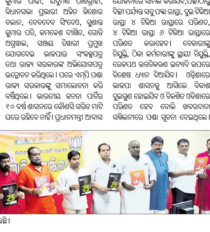
ଭାଇପାର ସଂକଳ୍ପପତ୍ର ଉନ୍ମୋଚନ କରାଯାଇଛି ।

ଭାଇପା କ୍ଷମତାକୁ ଆସିଲେ ବିକଶିତ ଓଡ଼ିଶା ହେବ । ଭାଇପା କ୍ଷମତାକୁ ଆସିଲେ ବିକଶିତ ଓଡ଼ିଶା ହେବ । ଭାଇପା କ୍ଷମତାକୁ ଆସିଲେ ବିକଶିତ ଓଡ଼ିଶା ହେବ ।