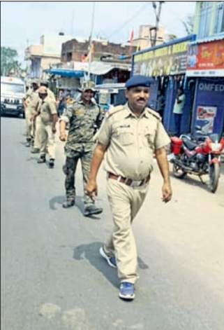
ବାଉଁଶୁଣୀ, ୭୫ (ଦେବାଶିଷ ନେପାକ)

ବୌଦ୍ଧ ଜିଲ୍ଲା ବାଉଁଶୁଣୀ ପୋଲିସ ପକ୍ଷରୁ ଆରମ୍ଭୀୟ ନିର୍ବାଚନକୁ ଆସି, ପୁଲ୍ଲ ଓ ନିରପେକ୍ଷ ଭାବେ କରାଯାଇ ପ୍ରକାଶନ କରିବାକୁ ନିର୍ଦ୍ଦେଶ ଦିଆଯାଇଛି । ବାଉଁଶୁଣୀ ଥାନା ପୋଲିସର ଅଧିକାରୀମାନେ ଏହା ଉପରେ ଗୁରୁତ୍ୱ ଦେଇ ଉପସ୍ଥାପନ କରିଛନ୍ତି । କର୍ମଚାରୀମାନଙ୍କୁ ନିର୍ଦ୍ଦେଶ ଦିଆଯାଇଛି ।