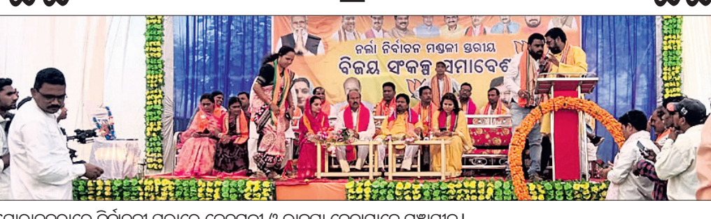
ସୋରାଡ଼େଇରେ ନିର୍ବାଚନୀ ସଭାରେ କେନ୍ଦ୍ରମନ୍ତ୍ରୀ ଓ ଭାଇପା ନେତାମାନେ ମଞ୍ଚାସୀନ ।

ସୋରାଡ଼େଇରେ ନିର୍ବାଚନୀ ସଭାରେ କେନ୍ଦ୍ରମନ୍ତ୍ରୀ ଓ ଭାଇପା ନେତାମାନେ ମଞ୍ଚାସୀନ । ସୋରାଡ଼େଇରେ ନିର୍ବାଚନୀ ସଭାରେ କେନ୍ଦ୍ରମନ୍ତ୍ରୀ ଓ ଭାଇପା ନେତାମାନେ ମଞ୍ଚାସୀନ ।