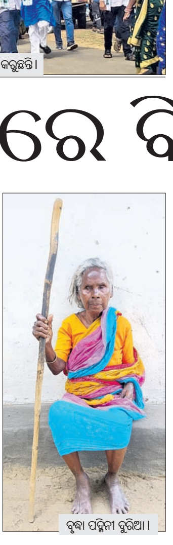
ବୃଦ୍ଧା ପୂଜା ପୁରିଆ ।

ଦୁର୍ଦ୍ଦିନରେ ବିଚ୍ଛୁଛି ଜୀବନ । ଦୁର୍ଦ୍ଦିନରେ ବିଚ୍ଛୁଛି ଜୀବନ । ଦୁର୍ଦ୍ଦିନରେ ବିଚ୍ଛୁଛି ଜୀବନ ।