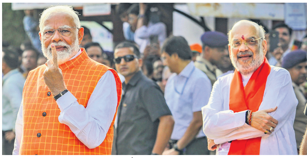
ଭୁବନେଶ୍ୱର ଅହମ୍ମଦାବାଦର ଏକ ବୁଥରେ ମଙ୍ଗଳବାର ପୂର୍ବାହ୍ନରେ ଭୋଟ ଦେବା ପରେ ପ୍ରଧାନମନ୍ତ୍ରୀ ନରେନ୍ଦ୍ର ମୋଦି କାଳି ଲଗା ଆଙ୍ଗୁଠି ଦେଖାଉଛନ୍ତି। ନିକଟରେ ଅଛନ୍ତି ସ୍ୱରାଷ୍ଟ୍ର ମନ୍ତ୍ରୀ ଅମିତ ଶାହା।