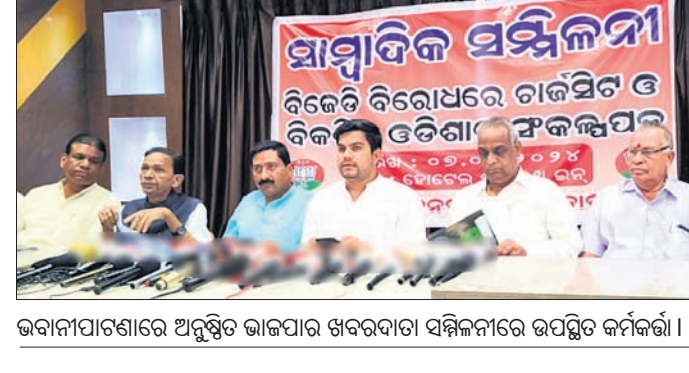
ଭବାନୀପାଟଣାରେ ଅନୁଷ୍ଠିତ ଭାଇପାର ଖବରଦାତା ସମ୍ମିଳନୀରେ ଉପସ୍ଥିତ କର୍ମକର୍ତ୍ତା ।

ଓଡ଼ିଶାର ବିକାଶ ଓଡ଼ିଆ ଲୋକ କରିବେ । ଓଡ଼ିଶାର ବିକାଶ ଓଡ଼ିଆ ଲୋକ କରିବେ । ଓଡ଼ିଶାର ବିକାଶ ଓଡ଼ିଆ ଲୋକ କରିବେ ।