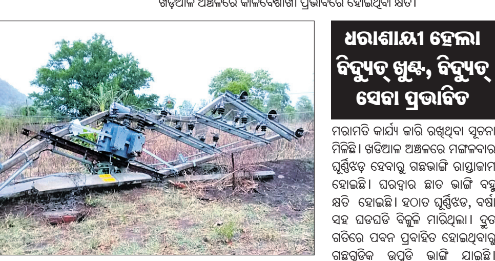
କୋକସରା ଅଞ୍ଚଳରେ ଖୁଣ୍ଟଭାଙ୍ଗି ଗ୍ରାହ୍ୟକର୍ମ ପଡ଼ିଛି ।

କୋକସରା ଓ ଖୁଣ୍ଟଭାଙ୍ଗି ଗ୍ରାହ୍ୟକର୍ମ ପଡ଼ିଛି । କୋକସରା ଅଞ୍ଚଳରେ ଖୁଣ୍ଟଭାଙ୍ଗି ଗ୍ରାହ୍ୟକର୍ମ ପଡ଼ିଛି । କୋକସରା ଅଞ୍ଚଳରେ ଖୁଣ୍ଟଭାଙ୍ଗି ଗ୍ରାହ୍ୟକର୍ମ ପଡ଼ିଛି । କୋକସରା ଅଞ୍ଚଳରେ ଖୁଣ୍ଟଭାଙ୍ଗି ଗ୍ରାହ୍ୟକର୍ମ ପଡ଼ିଛି ।