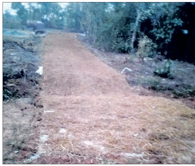
ଲୋକସିଂହା, ୭୫(ସୁଶାନ୍ତ ବାରିକ)

କଂକ୍ରିଟ ପତା ଆଦି ସ୍ଥାନରେ ମାଟି ରାସ୍ତା ପାଇ ପୁଣି ଅନ୍ୟତ୍ର କାମ କରାଯାଇଛି ବୋଲି ଗ୍ରାମବାସୀ ଅଭିଯୋଗ କରିଛନ୍ତି । କାମ ମଧ୍ୟ ନିମ୍ନମାନର ହୋଇଥିବା ଗ୍ରାମବାସୀ ଅଭିଯୋଗ କରିଛନ୍ତି । ବସ୍ତୁର ସହିତ ସ୍ଥାନଗୁଡ଼ିକରେ କାମ କଂକ୍ରିଟ ନ କରି ଅନ୍ୟତ୍ର କରାଯାଇଛି । ଏହାକୁ ନେଇ ଗ୍ରାମବାସୀ ଅସନ୍ତୋଷ ଏବଂ ବ୍ୟକ୍ତି କରୁଛନ୍ତି । ୨୦୨୩-୨୪ ଆର୍ଥିକ ବର୍ଷ ପାଇଁ ପଞ୍ଚାୟତରାଜ ବିଭାଗ ପକ୍ଷରୁ ଆଇଡିଏଏଫ ପାଣ୍ଟି ୬ ଲକ୍ଷ ବ୍ୟୟ ଅଟକଳରେ ବସ୍ତୁର କଂକ୍ରିଟକରଣ ଲାଗି ଅନୁଦାନ ମିଳିଛି । କିନ୍ତୁ ବସ୍ତୁରେ କଂକ୍ରିଟ ନ କରି ଗ୍ରାମର ପୋଖରୀ ଛୁଡ଼ା ଏବଂ ଛେଳିଆପତ ଗୁଡ଼ିକ ନିକଟରେ ନିର୍ମାଣ ହୋଇଛି । ବସ୍ତୁର କୁଦାଳପଡ଼ାଠାରୁ ଛୁଇଁ, ଚେପେ ଏ ସମ୍ପର୍କରେ ସଠିକ ପ୍ରହରା ମଣ୍ଡପକୁ ପାଏନଖାଲ ରୁଆଁ,