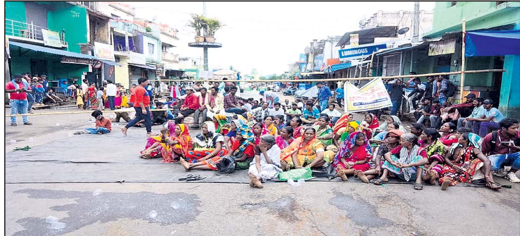
ପଞ୍ଚାୟତ ସମିତି କାର୍ଯ୍ୟକର୍ମର ମୁଖ୍ୟ ଫାଟକରେ ତାଲା ପକାଇ ଧାରଣା ଦିଆଯାଇଛି ।

କୋଟଗଡ଼, ୭।୫ (ସଂକ୍ଷେପ ବକ୍ତାବଳୀ): କୋଟଗଡ଼ ବ୍ଲକ୍ ଓରା ପଞ୍ଚାୟତ ଓ ପାଖାପାଖି ଅଞ୍ଚଳରେ ଦୀର୍ଘଦିନ ହେଲା ବିସମ୍ବନ୍ଧବଦ୍ଧ ଓ ଲିଓ ମୋବାଇଲ ସେବା ମିଳୁନି । ଫଳରେ ଲୋକଙ୍କୁ ବହୁ ଅସୁବିଧାର ସମ୍ମୁଖୀନ ହେବାକୁ ପଡୁଛି । ଏହାର ପ୍ରତିବାଦରେ ମଙ୍ଗଳବାର ପ୍ରଶ୍ନାସନ ବିରୋଧରେ ଓରା