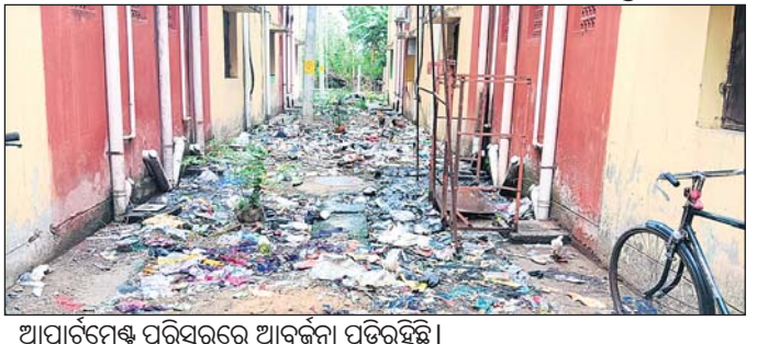
ଆପାର୍ଟମେଣ୍ଟ ପରିସରରେ ଆବରଣା ପଡ଼ିରହିଛି ।

ବ୍ରହ୍ମପୁର ମହାନଗର ନିଗମ (ବିଜଏମ୍‌ସି) ପକ୍ଷରୁ ନିର୍ଦ୍ଦିଷ୍ଟ ଆବାସ ଆପାର୍ଟମେଣ୍ଟଗୁଡ଼ିକ ବର୍ତ୍ତମାନ ବିପଦସଙ୍କୁଳ ହୋଇପଡ଼ିଛି । ପୁରୁଣା ପାଇଁ ଯେଠାରେ ରହୁଥିବା ଲୋକେ ଆପାର୍ଟମେଣ୍ଟ ଛାଡ଼ିବାକୁ ଚେତାବନୀ ଦେଇଛନ୍ତି । ମହାନଗରର ୨୭ ନଂ ଖାର୍ଡି ଅନ୍ତର୍ଗତ ନେହେରୁ ନଗର ୧୦ମ ଲେନ ରାଜୀବ ଆବାସ ଆପାର୍ଟମେଣ୍ଟରେ ଏଭଳି ସ୍ଥିତି ଉଦ୍ଭୁତ ହେଇଛି । ଏହି ଆପାର୍ଟମେଣ୍ଟରେ ମାଲିକ ସାହି, ଶାଳିଆବନ୍ଧ ସାହି, ଆଲନା ବନ୍ଧ, ଗୁଡ଼ପ ରୋଡ଼ ଓ ଡିପ୍ ସାହିର ବହୁ ବାସିନ୍ଦା ୫ ବର୍ଷ ହେଲା ରହି ଆସୁଛନ୍ତି । ହେଲେ ଏଠାରେ ଦୀର୍ଘଦିନ ହେଲା ପାଣି ସମସ୍ୟା ଲାଗି ରହିଛି । ଛାତ ବିପଦସଙ୍କୁଳ ଅବସ୍ଥାରେ ଥିବାବେଳେ ଅସାଧ୍ୟାବଳୀ ପରିବେଶ ସୃଷ୍ଟି ହୋଇଛି । ଏଠାରେ ଏଠାରେ 'କେ' ଯାଏଁ ବୁକ୍ ରହିଛି । ୫୦୦ରୁ ଊର୍ଦ୍ଧ୍ଵ ପରିବାର ଏଠାରେ ରହୁଛନ୍ତି । ୪ଟି ବୁକ୍ ପାଇଁ ୨ଟି ଓ ଆଉ ୬ଟି ବୁକ୍ ପାଇଁ ୨ଟି ପାଣି ମୋଟର ରହିଛି । ତେବେ ମୋଟରଗୁଡ଼ିକ ଦୀର୍ଘଦିନ ଧରି ଖରାପ ହୋଇଯାଇଥିବାରୁ ପାଣି ମିଳୁନାହିଁ ।