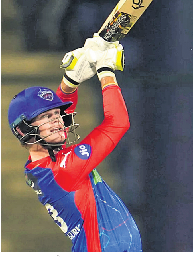
ଛକା ମାରିବା ଅବସରରେ ଜେକ୍ ଫ୍ରେଜର ମ୍ୟାକଗ୍ରୁକ୍।

ଆଇପିଏଲ୍ କାର୍ଯ୍ୟସୂଚୀ (ଆଜିର ମ୍ୟାଚ୍) ହାଇଦ୍ରାବାଦ ବନାମ ଲକ୍ଷ୍ନୌ ସ୍ଥାନ: ହାଇଦ୍ରାବାଦ ସମୟ: ସନ୍ଧ୍ୟା ୭.୩୦ ପ୍ରସାରଣ: ଷ୍ଟାର୍ ସ୍ପୋର୍ଟ୍ସ୍