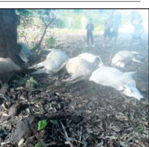
ମୃତ ଗୋରୁମାନେ ।

ଦାରିଙ୍ଗବାଡି/ବ୍ରାହ୍ମଣୀ, ୭।୫ (ଅରୁଣ ସାହୁ/ମନୋରଞ୍ଜନ ରଣା)