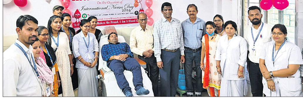
କାର୍ଯ୍ୟକ୍ରମରେ ଉପସ୍ଥିତ ସେବିକାମାନେ।