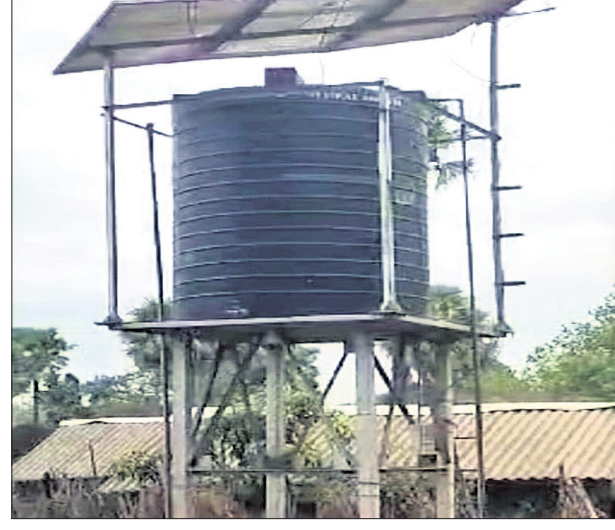
ଅଟଳ ହୋଇପଡ଼ିଥିବା ସୋଲାର ଜଳ ପ୍ରକଳ୍ପ।

ପଟିଆ, ୮୫ (ଭାସ୍କର ରାଓ) ପାନୀୟ ଜଳ ପ୍ରକଳ୍ପ ଅଟଳ ଯୋଗୁ ଗ୍ରାମବାସୀ ଜଳକଷ୍ଟ ଭୋଗୁଛନ୍ତି। ବାରମ୍ବାର ପ୍ରଶାସନ ନିକଟରେ ଅଭିଯୋଗ କରି କିଛି ସୁଫଳ ମିଳିନି। ଏପରି ଅବସ୍ଥାରେ ଜାରି ରହିଲେ ଆଗାମୀ ଦିନରେ ବ୍ଲକ୍ ଘରୋଇ କରିବେ ବୋଲି ପଟିଆ ବ୍ଲକ୍ ସଦର ପଞ୍ଚାୟତ ସିଦ୍ଧାନ୍ତୀଗୁଡ଼ା (ବି )ଗ୍ରାମ ପୁଞ୍ଜା ଓ ଗ୍ରାମବାସୀ ତେତାବନୀ ଦେଇଛନ୍ତି। ଏହି ଗ୍ରାମରେ ୩୫୦୦ ଉର୍ଦ୍ଧ୍ୱ ପରିବାର ବସବାସ କରୁଥିବା ବେଳେ ଗ୍ରାମରେ ଥିବା ନଳକୂପରୁ ଜଳ ପାଣି ବାହାରୁନାହିଁ। ଏନେଇ ପ୍ରଶାସନ ନିକଟରେ ବାରମ୍ବାର ଅଭିଯୋଗ କରିବା ପରେ ଗ୍ରାମବାସୀଙ୍କ ପାଇଁ ଏକ ସୋଲାର ଜଳ ପ୍ରକଳ୍ପ ବ୍ୟବସ୍ଥା ହୋଇଥିଲା।