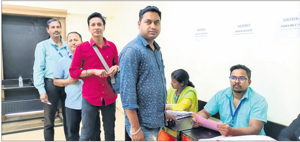
ପୋଷ୍ଟାଲ ବାଲଟରେ ଭୋଟ ଦେବାକୁ ଧାଡ଼ିରେ ଅପେକ୍ଷାରତ ଖବରଦାତାମାନେ।