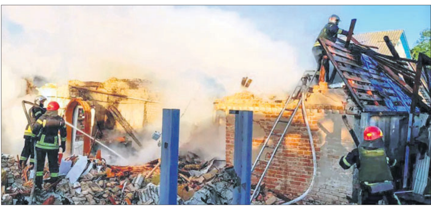
ରୁଷିଆ ମିଶାଇଲ ମାଡ଼ରେ ଯୁକ୍ତମୁକ୍ତ ଏକ ଶକ୍ତି ପ୍ରକଳ୍ପ ଧ୍ୱସ୍ତଧିକୃତ ହୋଇଯାଇଛି।

କନ୍ୟାପୁର, ୮୫: ରାଜସ୍ଥାନର ସଂକଳିତ ମାଧ୍ୟମରେ ଜିଲ୍ଲାରେ ବନାସ ନଦୀ ସେତୁ ନିକଟରେ ସଡ଼କ ଦୁର୍ଘଟଣା ଘଟି ଗୋଟିଏ ପରିବାରର ୬ ସଦସ୍ୟଙ୍କ ମୃତ୍ୟୁ ଘଟିଛି।