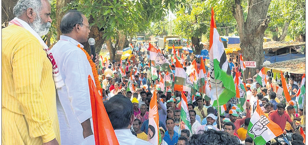
କୋରାପୁଟ ଜିଲ୍ଲା ନନ୍ଦପୁର ବ୍ଲକର ରୁଧିର ବିଜେଡି (ଉପର) ଓ କଂଗ୍ରେସ(ତଳ) କାର୍ଯ୍ୟକର୍ତ୍ତାମାନେ ଶକ୍ତି ପ୍ରଦର୍ଶନ କରୁଛନ୍ତି।