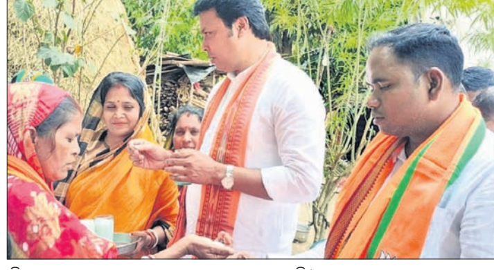
ବିପ୍ଳବ ଦେବ ଜଣେ ଭୋଟରଙ୍କ ସହ ଆଲୋଚନା କରୁଛନ୍ତି।

ମାଲକାନଗିରି ନିର୍ବାଚନମଣ୍ଡଳୀ ଭାଜପା ପାଇଁ ତ୍ରିପୁରା ପୂର୍ବତନ ମୁଖ୍ୟମନ୍ତ୍ରୀ ତଥା ରାଜ୍ୟ ସଭା ସଦସ୍ୟ ବିପ୍ଳବ କୁମାର ଦେବ ରୁଧିରାଣୀ ମାଲକାନଗିରି ବିଧାନସଭା ନିର୍ବାଚନମଣ୍ଡଳୀ ଅନ୍ତର୍ଗତ କାଲିମେଳା ବ୍ଲକ୍ ଏମ୍ପିଏ ୬୫, ଏମ୍ପିଏ ୬୬, ଏମ୍ପିଏ ୬୭, ଏମ୍ପିଏ ୬୮, ଏମ୍ପିଏ ୬୯, ଏମ୍ପିଏ ୭୦, ଏମ୍ପିଏ ୭୧ ଓ ଏମ୍ପିଏ ୭୨ ଆଦି ଗ୍ରାମରେ ଆୟାଜିତ ସାଧାରଣ ସଭାରେ ଯୋଗଦେଇଥିଲେ। ମାଲକାନଗିରି ଆସନର ଭାଜପା ପ୍ରାର୍ଥୀ