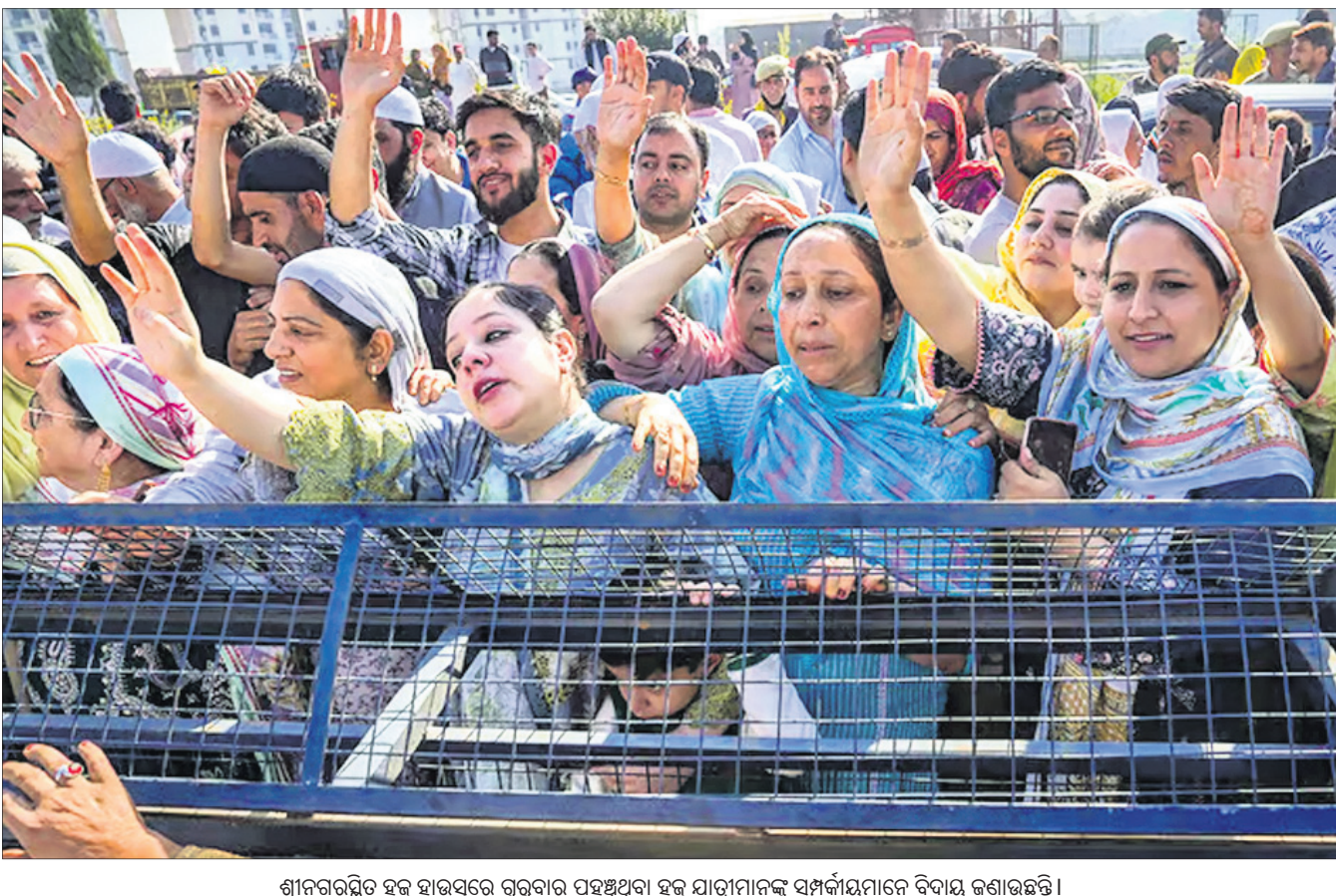
ଶ୍ରୀନଗରରୁ ହକ୍ ହାଇସ୍କରେ ଗୁରୁବାର ପହଞ୍ଚିଥିବା ହକ୍ ଯାତ୍ରୀମାନଙ୍କୁ ସମ୍ବର୍ଦ୍ଧନାମାନେ ବିଦାୟ ଜଣାଉଛନ୍ତି।

ଆନ୍ଧ୍ରପ୍ରଦେଶର ଏନ୍‌ଡିଆର ଜିଲାର ଏକ ଚେକ୍‌ପୋଷ୍ଟରେ ଗୁରୁବାର ଗୋଟିଏ ଟ୍ରକରୁ ନଗଦ ୮ କୋଟି ଟଙ୍କା ଜବତ କରାଯାଇଛି। ଏହି ମାମଲାରେ ପୋଲିସ୍ ୨ ଜଣଙ୍କୁ ଅଟକ ରଖିଛି। ଗୁରୁବାର ସକାଳୁ ଏକ ପାଇକ୍ ବୋମ୍ବେଇ ଟ୍ରକ୍ ଯାଉଥିବାବେଳେ ଗରିକାପାଟୁ ଚେକ୍‌ପୋଷ୍ଟରେ ପୋଲିସ୍ ଏହାକୁ ଅଟକାଇ ତଲାସି କରିଥିଲା। ଟ୍ରକର ଗୁପ୍ତ କ୍ୟାବିନରେ ୮ କୋଟି ଟଙ୍କା ଲୁଚାଇ ନିଆଯାଉଥିବାବେଳେ ଏହା ଚେକ୍ ବେଳେ ଧରା ପଡ଼ିଥିଲା। ଏହି ଟଙ୍କା ଟ୍ରକ୍ ଯୋଗେ ହାଇଦ୍ରାବାଦରୁ ଗୁଣ୍ଡର ନିଆଯାଉଥିବା ସ୍ଥାନୀୟ ପୋଲିସ୍ ଅଧିକାରୀ ସୂଚନା ଦେଇଛନ୍ତି। ତେବେ ନଗଦ ଟଙ୍କା ଜିଲ୍ଲା ତଦତ୍ତକାରୀ ଦଳକୁ ଖୁବ୍‌ଶୀଘ୍ର ହସ୍ତାନ୍ତର କରାଯିବ ଏବଂ ରାଜ୍ୟ ନିର୍ବାଚନ ଅଧିକାରୀଙ୍କ ପକ୍ଷରୁ ପରବର୍ତ୍ତୀ କାର୍ଯ୍ୟାନୁଷ୍ଠାନ ଗ୍ରହଣ କରାଯିବ ବୋଲି ସେ କହିଛନ୍ତି। ସୂଚନାଯୋଗ୍ୟ, ଆସନ୍ତା ୧୩ରେ ଆନ୍ଧ୍ରପ୍ରଦେଶର ସମସ୍ତ ୨୫ ଲୋକ ସଭା ଓ ୧୭୫ ବିଧାନସଭା ଆସନରେ ନିର୍ବାଚନ ଅନୁଷ୍ଠିତ ହେବ।