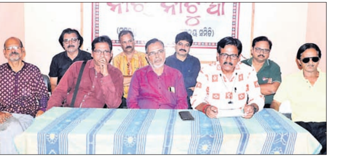
ଖବରଦାତା ସମ୍ମିଳନୀରେ ସମ୍ବଲପୁରର କଳାକାରମାନେ ।

ସମ୍ବଲପୁର ଏକ ପୁରାତନ ସଂସ୍କୃତି ସମ୍ପନ୍ନ ସହର । ସହରର କଳାକାରମାନେ ଏ ଅଞ୍ଚଳର ଲୋକ ସଂସ୍କୃତି ତଥା ଲୋକ ନୃତ୍ୟ, ଲୋକ ସଙ୍ଗୀତ ଓ ନାଟକକୁ ଦେଶ ବିଦେଶରେ ପ୍ରଦର୍ଶନ କରି ଅଞ୍ଚଳ ତଥା ରାଜ୍ୟ ପାଇଁ ସମ୍ମାନ ଆଣିପାରିଛନ୍ତି । ତେବେ ଦେଶ ବିଦେଶରେ ସୁନାମ ଆଣି ପାରିଥିବା ସେହି କଳାକାରମାନଙ୍କ ନିଜର କଳା ପ୍ରଦର୍ଶନ ପାଇଁ ସମ୍ବଲପୁର ସହରରେ ରଙ୍ଗମଞ୍ଚ ନାହିଁ । ଅଭାବିତ ଅଭାବିତ କଳାକାରମାନେ ଲୋକକଳା କଣ ନଥିବାରୁ ସମୟ ଅନୁସାରେ ଦାଣ୍ଡ ଦୁଆରେ କଳାକାରମାନେ ଲୋକକଳା ଅଭାବିତ କରିବାକୁ ବାଧ୍ୟ ହୋଇଛନ୍ତି । କଳାକାରମାନେ ସଂସ୍କୃତି ବିଭାଗ ଏବଂ ପ୍ରଶାସନକୁ ଏହି ବିଷୟରେ ବାରମ୍ବାର ଜଣାଇଛନ୍ତି । ବିଶେଷକରି ନାଟକ ତଥା ଲୋକ ମହୋତ୍ସବକୁ ଦୃଷ୍ଟିରେ ରଖି ଏକ ବୃହତ୍ ମୁକ୍ତିରଙ୍ଗ ନିର୍ମାଣ କରିବାକୁ କଳାକାରମାନେ ଦାବି କରିଆସିଛନ୍ତି । ସଂସ୍କୃତିର ସୁରକ୍ଷା, ଗବେଷଣା ଓ ପ୍ରଦର୍ଶନ