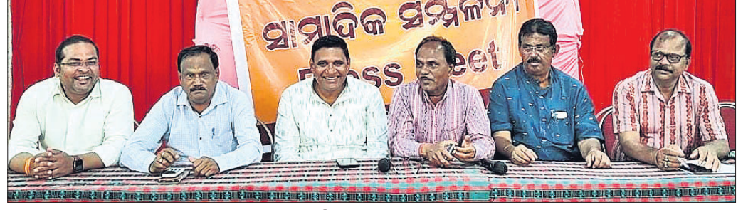
ଖବରଦାତା ସମ୍ମିଳନୀରେ ଭାଜପା ନେତୃତ୍ୱ ।