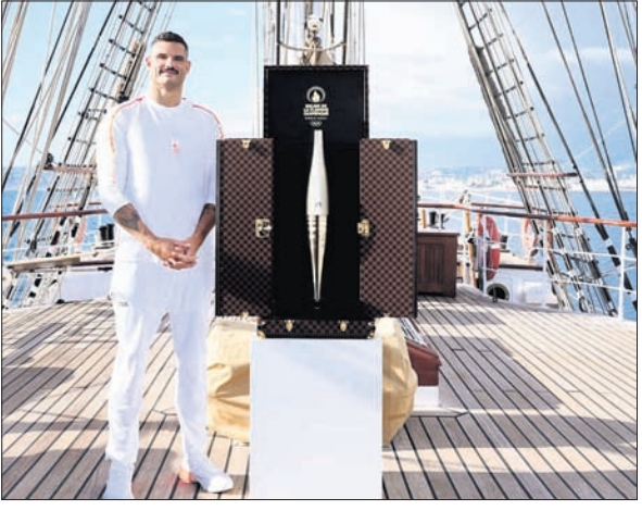
ଅଲିମ୍ପିକ ମଶାଳ ସହ ଜଣେ ମଶାଳବାହକ।

ମାର୍ଚ୍ଚେଲେ, ୯୫ (ପି.ଟି.) ପ୍ରାୟ ଦଶନ୍ଧି ପାଖରେ ଅବସ୍ଥିତ ସହର ମାର୍ଚ୍ଚେଲେରେ ଗୁରୁବାର ଆରମ୍ଭ ହୋଇଛି ଅଲିମ୍ପିକ ମଶାଳ ଯାତ୍ରା। ଏପ୍ରିଲ ୧୬ ତାରିଖରେ ଦଶନ୍ଧି ଗ୍ରାମର ଏଥେନ୍ସରେ ଥିବା ପୁରାତନ ଗେମ୍ ଭେନ୍ୟାରେ ମଶାଳରେ ଅଗ୍ର ସଂଯୋଗ କରାଯାଇଥିଲା। ଏହାପରେ ବେଲେନା ନାମକ କାହାଳରେ ଏହାକୁ ପ୍ୟାରିସ୍ ଅଲିମ୍ପିକ୍ସ ପ୍ରେରଣ କରାଯାଇଥିଲା। ୧୦୦୦ ନୌକା ସହ ପରେଡ଼ କରି ଏହି କାହାଳି ଗୁରୁବାର ମାର୍ଚ୍ଚେଲେରେ ପହଞ୍ଚିଥିଲା। ଗୁରୁବାର ଠାରୁ ଅଲିମ୍ପିକ ଆରମ୍ଭ ହେବା ପର୍ଯ୍ୟନ୍ତ ମଶାଳ ପ୍ରାୟତଃ ୧୧ ସପ୍ତାହ ବ୍ୟାପୀ ରାସ୍ତା କରିବ। ୪୫୦ ସହରରେ ୧୦୦୦୦ ଜଣ ମଶାଳ ବାହକ ଏହି ଯାତ୍ରାରେ ଅଂଶ ଗ୍ରହଣ କରିବେ। ଗୁରୁବାର ମାର୍ଚ୍ଚେଲେର ପୂର୍ବତନ