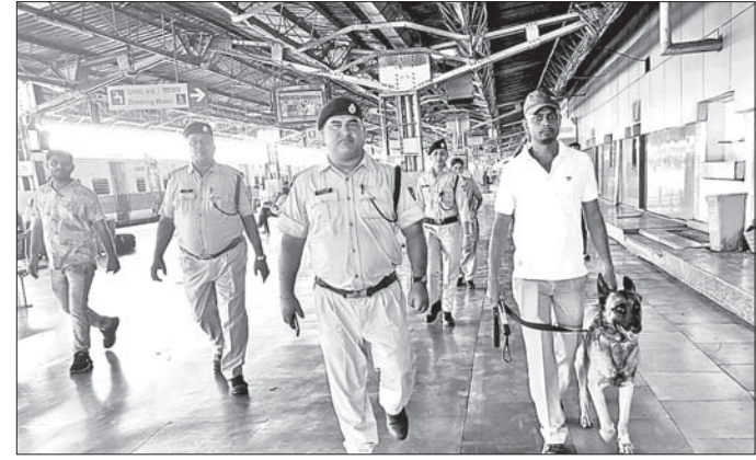
ଷ୍ଟେଶନ ପରିସରରେ ତତ୍ ସ୍ୱାତନ୍ତ୍ର ଅଭିଯାନ ସମୟରେ ଶୀତଳଭଣ୍ଡାର ନିର୍ମାଣରେ ଅହେତୁକ ବିଳମ୍ବ ହେବାର ଫଟୋ