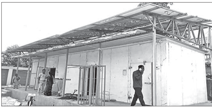
ପାନପୋଷ ଅବସ୍ଥାରେ ଶୀତଳଭଣ୍ଡାର ନିର୍ମାଣରେ ଅହେତୁକ ବିଳମ୍ବ ହେବାର ଫଟୋ

ରାଉରକେଲା ସହରାଞ୍ଚଳ ଓ ଶିଳ୍ପାଞ୍ଚଳରେ ଥିବା ପରିବାହନ ଉପରେ ଗୁଡ଼ିକ ଉପରେ ଲାଠିକଟା, କୁଆଁରପୁଣ୍ଡା, ନୁଆଁଗାଁ ଓ ବିଶ୍ୱା କୁକର ଚାଷୀ ଏବଂ ବିକାଳା ନିର୍ଭର କରିଥାନ୍ତି। ମାତ୍ର ବହୁ ସମୟରେ ଚାଷୀ ଓ ବେପାରୀଙ୍କ ପରିସରରେ ବିକ୍ରି ହୋଇ ନ ପାରି ନଷ୍ଟ ହେଉଥିବା ଦେଖିବାକୁ ମିଳିଥାଏ। ଫଳରେ ସେମାନଙ୍କୁ ବ୍ୟାପକ କ୍ଷତି ସହିବାକୁ ପଡ଼ିଥାଏ। ପରିସରରେ କିଛି ଦୀର୍ଘଦିନ ଧରି ସଂରକ୍ଷିତ ରହିବାର ଚାହୁଁଛନ୍ତି ଲକ୍ଷ୍ୟ କରି ଆରମ୍ଭରେ ପକ୍ଷରୁ ଟାଣି ହୋଇ ଶୀତଳଭଣ୍ଡାର ନିର୍ମାଣ ପାଇଁ ନିଷ୍ପତ୍ତି ନିଆଯାଇଛି। ଟାଣି ହୋଇ ଶୀତଳଭଣ୍ଡାର ନିର୍ମାଣ ପାଇଁ ନିଷ୍ପତ୍ତି ନିଆଯାଇଛି। ଟାଣି ହୋଇ ଶୀତଳଭଣ୍ଡାର ନିର୍ମାଣ ପାଇଁ ନିଷ୍ପତ୍ତି ନିଆଯାଇଛି।