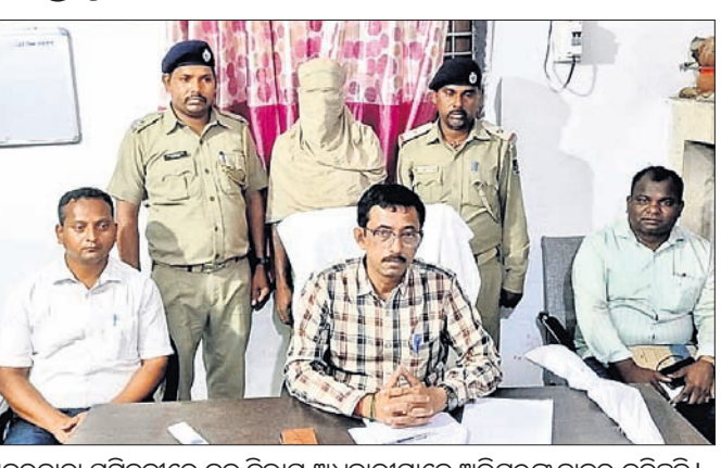
ଖବରଦାତା ସମ୍ମିଳନୀରେ ବନ ବିଭାଗ ଅଧିକାରୀମାନେ ଅଭିଯୁକ୍ତଙ୍କୁ ହାଜର କରିଛନ୍ତି ।

ସମ୍ବଲପୁର ଜିଲ୍ଲା ରେଭେନ୍ସା ବନଖଣ୍ଡ ନାକଟାଦେଉଳ ବନାଞ୍ଚଳ ଅନ୍ତର୍ଗତ ଲାଞ୍ଜିମାଳ ସଂରକ୍ଷିତ ଜଙ୍ଗଲରୁ ଗତ ୭ତାରିଖ ଦିନ ବିଭାଗ ଏକ କଳରାପତରିଆ ବାଘର ମୃତଦେହ ଠାବ କରିଥିଲା । ବାଘ ହତ୍ୟା ଘଟଣାରେ ସମ୍ପୂର୍ଣ୍ଣ ନାକଟାଦେଉଳ ଥାନା ଅନ୍ତର୍ଗତ ସେବାହାଲ ଗ୍ରାମର ଜଣେ ଶିକାରୀଙ୍କୁ ବନ ବିଭାଗ ଗିରଫ କରିଛି । ତାଙ୍କଠାରୁ ଏକ ଦେଶୀ ବନ୍ଧୁକ ଜବତ କରାଯାଇଛି । ଗୁରୁବାର ତାଙ୍କୁ କୋର୍ଟଚାଲାଣ କରାଯାଇଥିଲା । ହେଲେ ଜାମିନ ନାମାଣ୍ଡର ହେବାରୁ ତାଙ୍କୁ ଜେଲ ହାଜତକୁ ପଠାଇ ଦିଆଯାଇଛି । ତେବେ ବାଘ ଶିକାର ଘଟଣାରେ ଅନ୍ୟ କେତେଜଣଙ୍କ ସମ୍ପୂର୍ଣ୍ଣ ରହିଛି । ତଦନ୍ତ ପ୍ରକ୍ରିୟାରେ ବାଧା ଉପସ୍ଥିତ ଆଶଙ୍କା ଥିବାରୁ ଗିରଫ ଅଭିଯୁକ୍ତ ଏବଂ ଏଥିରେ ସମ୍ପୂର୍ଣ୍ଣ ଅନ୍ୟ ଶିକାରୀମାନଙ୍କ ନାମକୁ ଗୁପ୍ତ ରଖାଯାଇଛି । ଗୁରୁବାର ନାକଟାଦେଉଳ ବନାଞ୍ଚଳ ଅଧିକାରୀଙ୍କ କାର୍ଯ୍ୟାଳୟରେ