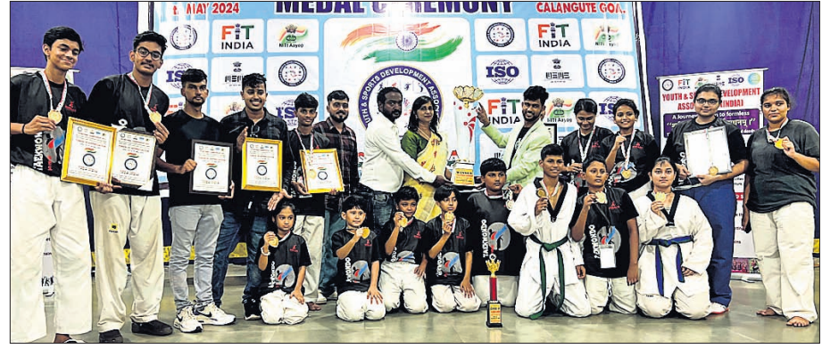
ସଫଳତା ହାସଲ କରିଥିବା ଟୀମକୋଣ୍ଡା ଖେଳାଳି ଓ ତମ ସଦସ୍ୟ।