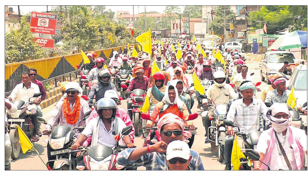
ବାଇକ୍ ଶୋଭାଯାତ୍ରାରେ ସାମିଲ ହୋଇଥିବା କୃଷକମାନେ ।

ବରଗଡ଼ ଜିଲ୍ଲା ସଂଯୁକ୍ତ କୃଷକ ସଂଗଠନ ପକ୍ଷରୁ ଗୁରୁବାର ଅତୀତ ନିର୍ବାଚନମଣ୍ଡଳୀ ଅଧୀନ ଭେଡ଼େନରୁ ବିରାଟ ବାଇକ୍ ଶୋଭାଯାତ୍ରା ବାହାରି ଭୋଟରକୁ ସଚେତନ କରିଛି । ମଦ, ମାଂସ ନୁହେଁ, ଭୋଗ୍ ହେବ ପ୍ରସଙ୍ଗ ନାମାବଳି ଦେଇ ଶୋଭାଯାତ୍ରା ବରପାଲି, ବରଗଡ଼ ଏବଂ ଅତୀତ ନିର୍ବାଚନମଣ୍ଡଳୀ କରି ସଚେତନତା ସୃଷ୍ଟି କରିଥିଲା । ଜିଲ୍ଲାରେ ଆସନ୍ତା ୨୦ତାରିଖ ସାଧାରଣ ନିର୍ବାଚନ ପାଇଁ ମତଦାନ ଥିବାବେଳେ ସଂଯୁକ୍ତ କୃଷକ ସଙ୍ଗଠନ ନିର୍ବାଚନ ଭିତ୍ତିକ ପ୍ରସଙ୍ଗ ରଖି କରିଥିବା ଏହି ଶୋଭାଯାତ୍ରା ସବୁଠାରୁ ବଡ଼ ଆନ୍ଦୋଳନ ବୋଲି ସଙ୍ଗଠନ ନେତୃମଣ୍ଡଳୀ ପ୍ରକାଶ କରିଛନ୍ତି ।