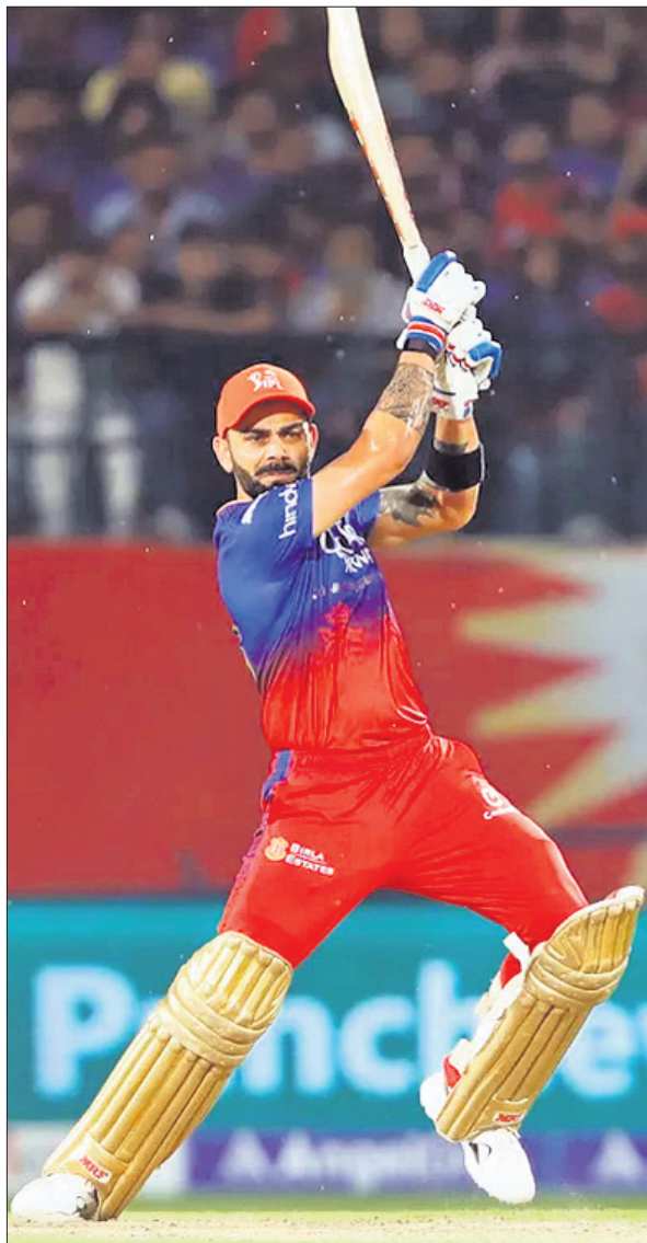
ଶର୍ ଖେଳିବା ଅବସରରେ ବିରାଟ କୋହଲି।

ଧର୍ମଶାଳା, ୯୫ ଇତିଆର ପ୍ରମିୟର ଲିଭ (ଆଇପିଏଲ)ରେ ପଞ୍ଜାବ କିଙ୍ଗ୍ସ ବିପକ୍ଷରେ ଅର୍ଦ୍ଧଶତକ ହାସଲ କରିଛନ୍ତି ରୟାଲ ଚ୍ୟାଲେଞ୍ଜର୍ସ ବେଙ୍ଗାଲୁରୁ(ଆରସିବି)ର ବିରାଟ କୋହଲି। କୋହଲି ଚଳିତ ସିଜନର ପଞ୍ଚମ ଅର୍ଦ୍ଧଶତକ ସହ ୯୨ ରନ୍ କରିଥିବା ବେଳେ ଆରସିବି ୨୦ ଓଭରରେ ୬ ରନକେଟ ହରାଇ ୨୪୧ ରନ୍ କରିଛି। ଜବାବରେ ଖବର ପ୍ରସ୍ତୁତ ବେଳକୁ ପଞ୍ଜାବ ୫ ଓଭରରେ ୧ ରନକେଟ ହରାଇ ୬୧ ରନ୍ କରିଛି। ପଞ୍ଜାବ କିଙ୍ଗ୍ସ ପକ୍ଷରୁ ବିଦ୍ୟୁତ୍ କାଭେରସ୍ତା ଏହି ମ୍ୟାଚରେ ପଦାର୍ପଣ କରିଥିଲେ। ଧର୍ମଶାଳାରେ ପଞ୍ଜାବ ଟ୍ୱେଣ୍ଟି ପ୍ରଥମେ ବୋଲିଂ ନିଷ୍ପତ୍ତି ନେଇଥିଲା। ପଞ୍ଜାବ ପକ୍ଷରୁ ପଦାର୍ପଣକାରୀ କାଭେରସ୍ତା ଘାତକ ବୋଲିଂ କରିଥିଲେ। ସେ ଫାଟ୍ ଡୁପ୍ଲେସି(୯) ଓ ଓଲି କ୍ୟାକ୍(୧୨)କୁ ଆଉଟ କରିବା ସହ ପଞ୍ଜାବକୁ ଭଲ ଆରମ୍ଭ ଦେଇଥିଲେ। ଏପରିକି କାଭେରସ୍ତାଙ୍କ ବଲ୍ରେ କୋହଲିଙ୍କ ଦୁଇଟି କ୍ୟାଚ୍ ହାତଛତା କରିଥିଲା ପଞ୍ଜାବ। ଖାତା ଖୋଲିବା ପୂର୍ବରୁ ଆଣ୍ଟିଗୋଷ ଶର୍ମା ଓ ୨୬ ରନ୍ରେ ବ୍ୟାଟିଂ କରୁଥିବା ବେଳେ ରିଲି ରୋଷୋ ଏକ କ୍ୟାଚ୍ ହାତଛତା କରିଥିଲେ। ବିରାଟ କୋହଲି ଧୀମା ଆରମ୍ଭ କରିଥିଲେ ମଧ୍ୟ ପରେ ରନ୍ ଗତି ବଦଳାଇଥିଲେ। ୪୩ ରନ୍ରେ ୨