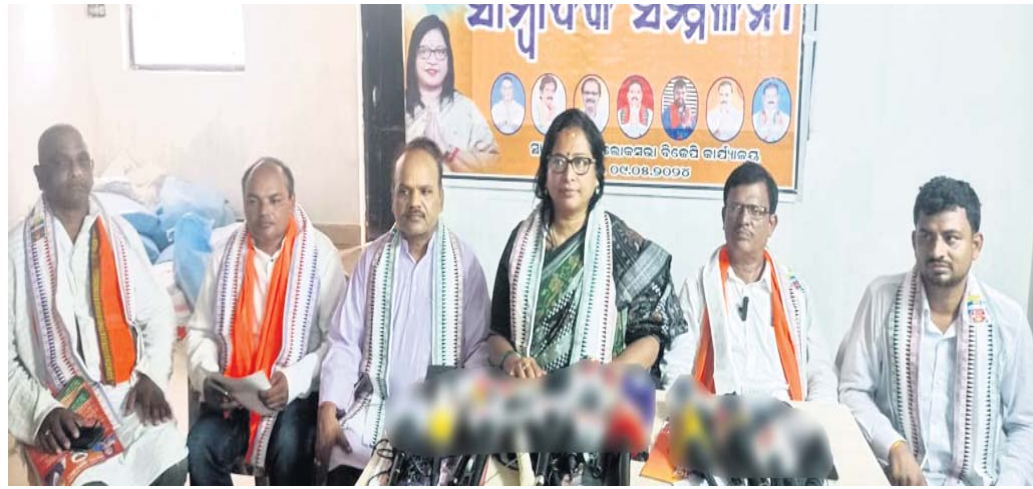
ଖବରଦାତା ସମ୍ମିଳନୀରେ ଏମପି ପ୍ରାର୍ଥୀ ଓ ଅନ୍ୟମାନେ ।