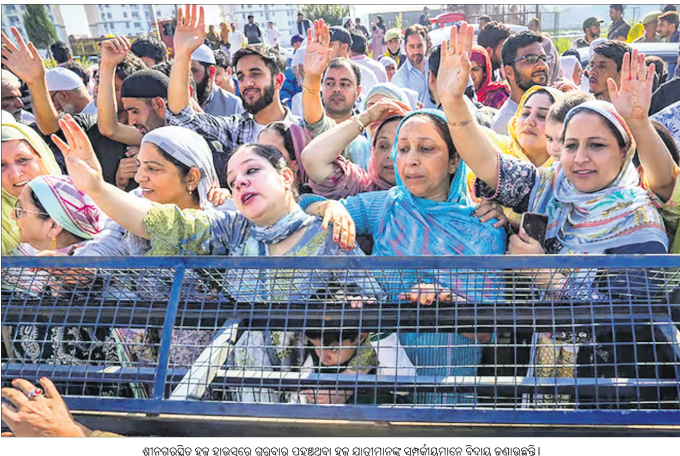
ଶ୍ରୀନଗରରୁ ହକ୍ ଯାତ୍ରୀଙ୍କୁ ଗୁରୁବାର ପହଞ୍ଚିଥିବା ହକ୍ ଯାତ୍ରୀମାନଙ୍କୁ ସମ୍ବର୍ଦ୍ଧନାରେ ବିଦାୟ ଜଣାଉଛନ୍ତି।

ହାଇଦ୍ରାବାଦ, ୯୫ ଆନ୍ଧ୍ରପ୍ରଦେଶର ଏନ୍‌ଡିଆର ଜିଲାର ଏକ ଚେକ୍‌ପୋଷ୍ଟରେ ଗୁରୁବାର ଗୋଟିଏ ଟ୍ରକରୁ ନଗଦ ଟଙ୍କା କୋଟିଟଙ୍କା ଜବତ କରାଯାଇଛି। ଏହି ମାମଲାରେ ପୋଲିସ୍ ୨ ଜଣଙ୍କୁ ଅଟକ ରଖିଛି। ଗୁରୁବାର ସକାଳୁ ଏକ ପାଇକ୍ ବୋକ୍ସେଇ ଟ୍ରକ୍ ଯାଉଥିବାବେଳେ ଚଳିତାପାଟୁ ଚେକ୍‌ପୋଷ୍ଟରେ ପୋଲିସ୍ ଏହାକୁ ଅଟକାଇ ତଲାସି କରିଥିଲା। ଟ୍ରକର ଗୁପ୍ତ କ୍ୟାବିନରେ ୮ କୋଟି ଟଙ୍କା ଲୁଚାଇ ନିଆଯାଉଥିବାବେଳେ ଏହା ଚେକ୍ ବେଳେ ଧରା ପଡ଼ିଥିଲା। ଏହି ଟଙ୍କା ଟ୍ରକ୍ ଯୋଗେ ହାଇଦ୍ରାବାଦରୁ ଗୁଣ୍ଡୁର ନିଆଯାଉଥିବା ସ୍ଥାନୀୟ ପୋଲିସ୍ ଅଧିକାରୀ ସୂଚନା ଦେଇଛନ୍ତି। ତେବେ ନଗଦ ଟଙ୍କା ଜିଲ୍ଲା ତଦନ୍ତକାରୀ ଦଳକୁ ଖୁବ୍‌ଶୀଘ୍ର ହସ୍ତାନ୍ତର କରାଯିବ ଏବଂ ରାଜ୍ୟ ନିର୍ବାଚନ ଅଧିକାରୀଙ୍କ ପକ୍ଷରୁ ପରବର୍ତ୍ତୀ କାର୍ଯ୍ୟାନୁଷ୍ଠାନ ଗ୍ରହଣ କରାଯିବ ବୋଲି ସେ କହିଛନ୍ତି। ସୂଚନାଯୋଗ୍ୟ, ଆସନ୍ତା ୧୩ରେ ଆନ୍ଧ୍ରପ୍ରଦେଶର ସମସ୍ତ ୨୫ ଲୋକ ସଭା ଓ ୧୭୫ ବିଧାନସଭା ଆସନରେ ନିର୍ବାଚନ ଅନୁଷ୍ଠିତ ହେବ।