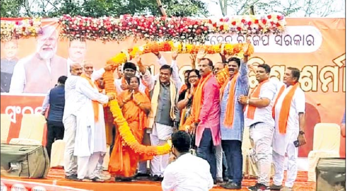
ଆସାମ ମୁଖ୍ୟମନ୍ତ୍ରୀ ହିମନ୍ତ ବିଶ୍ୱଶର୍ମାଙ୍କୁ ଅନ୍ୟ ନେତାମାନେ ସ୍ୱାଗତ କରୁଛନ୍ତି।

ଆସାମ ମୁଖ୍ୟମନ୍ତ୍ରୀ ହିମନ୍ତ ବିଶ୍ୱଶର୍ମା ରୁରୁବାର ଖଲିକୋଟରେ ଭାଜପା ପାଇଁ ନିର୍ବାଚନ ପ୍ରଚାର କରିଛନ୍ତି।