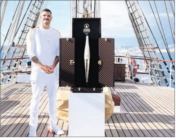
ଅଲିମ୍ପିକ ମଶାଳ ସହ ଜଣେ ମଶାଳବାହକ।

ମାର୍ଚ୍ଚେଲେ, ୯୫ (ପି.ଟି.) ପ୍ରାଚୀନ ଦକ୍ଷିଣ ପାର୍ଶ୍ୱରେ ଅବସ୍ଥିତ ସହର ମାର୍ଚ୍ଚେଲେରେ ଗୁରୁବାର ଆରମ୍ଭ ହୋଇଛି ଅଲିମ୍ପିକ ମଶାଳ ଯାତ୍ରା। ଏପ୍ରିଲ ୧୬ ତାରିଖରେ ଦକ୍ଷିଣ ଗ୍ରୀସର ଏଥେନ୍ସରେ ଥିବା ପୁରାତନ ଗେପ୍ସ ଡେମ୍ପାରେ ମଶାଳରେ ଅଗ୍ନି ସଂଯୋଗ କରାଯାଇଥିଲା। ଏହାପରେ ବେଲେମ ନାମକ କାହାଳରେ ଏହାକୁ ପ୍ୟାରିସ୍ ଅଲିମ୍ପିକ୍ସ ପ୍ରେରଣ କରାଯାଇଥିଲା। ୧୦୦୦ ନୌକା ସହ ପରେଡ୍ କରି ଏହି କାହାଳଟି ଗୁଆଦାଳ ମାର୍ଚ୍ଚେଲେରେ ପହଞ୍ଚିଥିଲା। ଗୁରୁବାର ଠାରୁ ଅଲିମ୍ପିକ ଆରମ୍ଭ ହେବା ପର୍ଯ୍ୟନ୍ତ ମଶାଳ ପ୍ରାଚୀନ ୧୧ ସପ୍ତାହ ବ୍ୟାପୀ ରାସ୍ତା କରିବ। ୪୫୦ ସହରରେ ୧୦୦୦୦ ଜଣ ମଶାଳ ବାହକ ଏହି ଯାତ୍ରାରେ ଅଂଶ ଗ୍ରହଣ କରିବେ। ଗୁରୁବାର ମାର୍ଚ୍ଚେଲେର ପୂର୍ବତନ