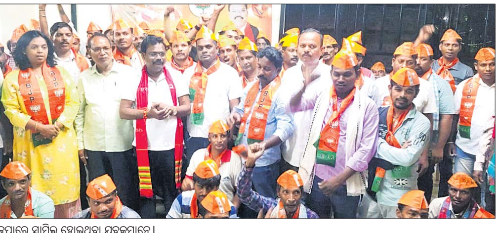
ଭାଜପାରେ ସାମିଲ ହୋଇଥିବା ମୁଖ୍ୟମନ୍ତ୍ରୀମାନେ ।