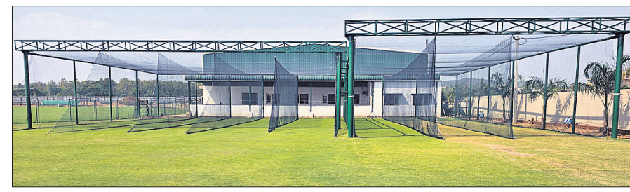
ଅଭ୍ୟାସ ପାଇଁ ପ୍ରସ୍ତୁତ ଏମ୍ଜିଏମ୍ ସ୍କୁଲ ଅଫ୍ ସ୍ପୋର୍ଟ୍ସର କ୍ରିକେଟ ଏକାଡେମୀର ଦେଖି।