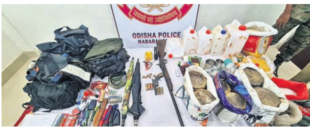
ଜବତ ବିଚାରକ ସହ ମାଓବାଦୀଙ୍କ ବ୍ୟବହୃତ ସାମଗ୍ରୀ।