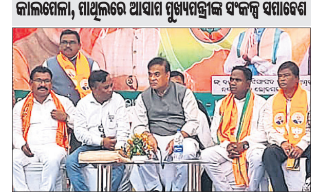
ଏମ୍ପିଜି ଗ୍ରାମରେ ଗୁରୁବାର ଭାଜପା ସଂକଳ୍ପ ସମାବେଶରେ ଆସାମ ମୁଖ୍ୟମନ୍ତ୍ରୀ ହିମତ ବିଶ୍ୱଶର୍ମା ଓ ଅନ୍ୟ ନେତାମାନେ।

ଓଡ଼ିଶାରେ ଭାଜପା ସରକାର ଜଲେ ମାଲକାନଗିରିରେ ନୟନ ନୁହେଁ, ଗାଁର ନାଁ ଦିଆଯିବ ବୋଲି ଆସାମ ମୁଖ୍ୟମନ୍ତ୍ରୀ ହିମତ ବିଶ୍ୱଶର୍ମା କହିଛନ୍ତି। ଗୁରୁବାର ସେ ମାଲକାନଗିରି ଜିଲ୍ଲା ଗସ୍ତକରି ପ୍ରଥମେ କାଲିମେଳା ବ୍ଲକ୍ ଏମ୍ପିଜି ଗ୍ରାମ ଓ ମାଧୁଲିରେ ଆୟୋଜିତ ବିଜୟ ସଂକଳ୍ପ ସମାବେଶରେ ଯୋଗଦେଇଥିଲେ। ଏଥିରେ ବିଶ୍ୱଶର୍ମା କହିଥିଲେ, ମୁଖ୍ୟମନ୍ତ୍ରୀ ନବୀନ ପଟ୍ଟନାୟକ ରାଜ୍ୟର ସାତେ ୪ କୋଟି ଲୋକଙ୍କୁ ନୁହେଁ, କେବଳ ପାଣିଆନୁ ହିଁ ସ୍ୱେଦ ଓ ଭଲପାଇବା ଦେଉଛନ୍ତି। ମାଲକାନଗିରି ଜିଲ୍ଲାରେ ଅନେକ ହଜାର ବଙ୍ଗାୟ ଭାଷା ଲୋକଙ୍କ ରହୁଥିବା ବେଳେ ଶିକ୍ଷକ ନାହାନ୍ତି। ତେଣୁ ବଙ୍ଗାୟ ଭାଷାରେ ଶିକ୍ଷାଦାନ ଠିକ୍ ଭାବେ ହେଉନାହିଁ। ବଙ୍ଗାୟ ଭାଷା ଗ୍ରାମକୁ ସଂଖ୍ୟାରେ ନାମିତ କରାଯାଉଛି। ଜେଲରେ ଅଭିଯୁକ୍ତଙ୍କୁ ସଂଖ୍ୟା ଦିଆଯାଇଥାଏ। ଗ୍ରାମର ନାମ ସଂଖ୍ୟାରେ ନାମିତ କରାଯାଏ