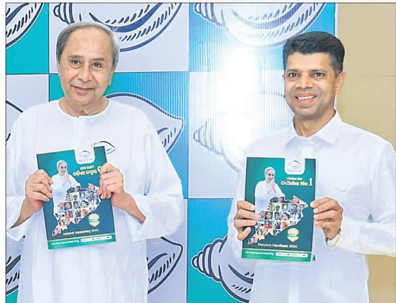
ଚଳିତ ବିଧାନସଭା ନିର୍ବାଚନ ପାଇଁ ବିଜେଡି ସଭାପତି ନବୀନ ପଟ୍ଟନାୟକ ଓ ଦଳର ବରିଷ୍ଠ ନେତା କାର୍ତ୍ତିକ ପାଣିଗ୍ରାହୀଙ୍କ ଦ୍ୱାରା ପଢ଼ାଯାଇଥିବା ଇସ୍ତାହାର ଉନ୍ମୋଚନ କରୁଛନ୍ତି।