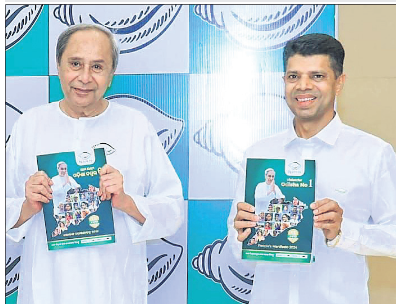
ଚଳିତ ନିର୍ବାଚନ ପାଇଁ ବିଜେଡି ସଭାପତି ନବୀନ ପଟ୍ଟନାୟକ ଓ ଦଳର ବରିଷ୍ଠ ନେତା କାର୍ତ୍ତିକ ପାଣିଗ୍ରାହୀଙ୍କୁ ଗୁରୁତ୍ୱପୂର୍ଣ୍ଣ ଭାବରେ ଉଲ୍ଲେଖ କରାଯାଇଛି।