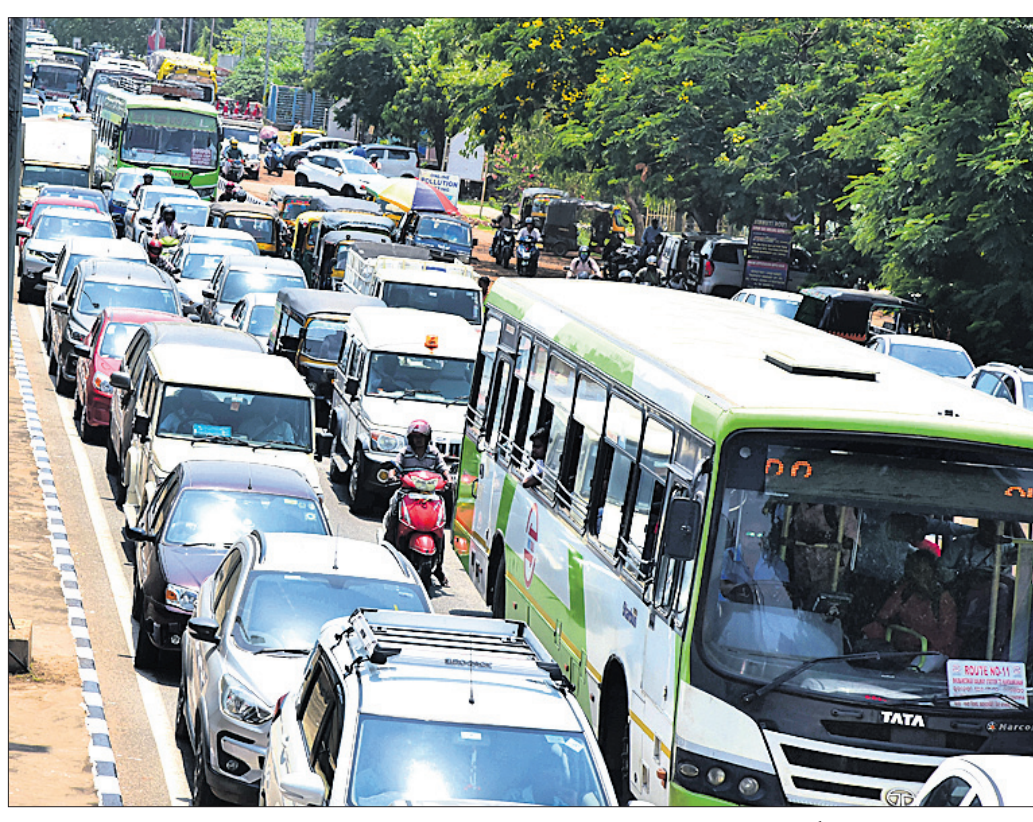
ଭୁବନେଶ୍ୱର ବେଲ୍ ମାଲପୁରା ୧୬ ନମ୍ବର ଜାତୀୟ ରାଜପଥର ବାଣୀବିହାର ଛକରୁ ଆଚାର୍ଯ୍ୟବିହାର ଛକ ପର୍ଯ୍ୟନ୍ତ ଓଭରବ୍ରିଜ୍ ପାର୍ଶ୍ୱ ରାସ୍ତାରେ ଗ୍ରାମିକ କାମ୍ ।