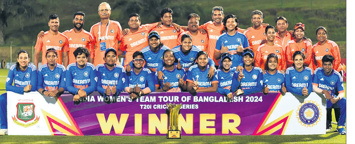
ବିଜୟୀ ଟ୍ରଫି ସହ ଭାରତୀୟ ମହିଳା କ୍ରିକେଟ ଦଳ।