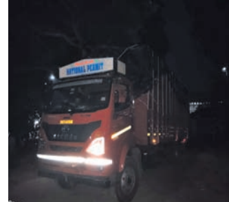
ପୋଲିସ ପହଞ୍ଚିବା ପରେ ବକରଙ୍ଗ ଦଳର କର୍ମଚାରୀମାନେ ଗୋରୁକୁ ଉଦ୍ଧାର କରି ପୋଲିସ ଜିମା ଦେଇଥିଲେ । ଉଦ୍ଧାର ଗୋରୁକୁ ସ୍ଥାନୀୟ ଏକ ଗୋଷାଳାରେ ଗାଡ଼ି ଅଟକାଇବା ବେଳେ ଘଟଣାସ୍ଥଳକୁ ଏକ ମାମଲା (ନଂ. ୧୬୮/୨୪) ରୁକ୍ତକରି ହୋଇଯାଇଥିଲେ । ଖବରପାଇ ନାଟୁଣୀ ଅଧିକ ତଦନ୍ତ ଚଳାଇଛି ।