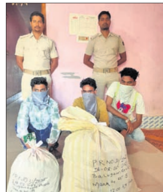
ଅଭିଯୁକ୍ତମାନେ ଗଞ୍ଜେଇ କେଉଁଠୁ ଆଣିଲେ ଏବଂ କେଉଁଠାରେ ନେଉଥିଲେ ସେ ନେଇ ତଦନ୍ତ ଚାଲିଛି ବୋଲି ପୋଲିସ କହିଛି ।