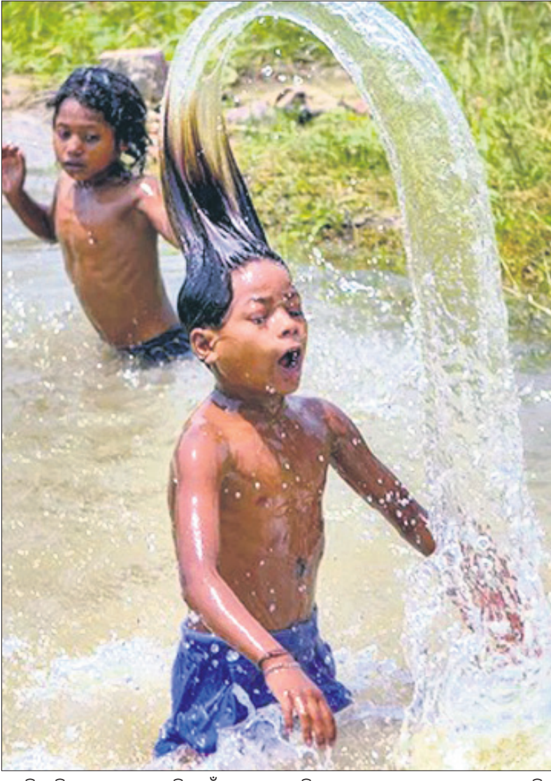
ଓଃ କି ଶାନ୍ତି ! ପ୍ରଚଣ୍ଡ ଗ୍ରୀଷ୍ମରୁ ପ୍ରାଣି ପାଇଁ ଅମୃତସରରେ ପିଲାମାନେ ଏକ ଜଳାଶୟରେ ଗାଧୋଉଛନ୍ତି।

କରିଛି। ନିର୍ବାଚନରେ ପ୍ରଚାର କରିବା ମୌଳିକ କ୍ଷମା ସାଧିଧାନିକ ଅଧିକାର ନୁହେଁ। ଏପରିକି ଏହା ଆଇନଗତ ଅଧିକାର ନୁହେଁ ବୋଲି ଇତି ସର୍ବୋଚ୍ଚ ଅଦାଲତଙ୍କୁ ଜଣାଇଛି। ନିର୍ବାଚନ ଲଢ଼ୁ ନ ଥିବା କୌଣସି ରାଜନେତାଙ୍କୁ ଏପର୍ଯ୍ୟନ୍ତ ପ୍ରଚାର ପାଇଁ ଅନ୍ତରାଣ ଜାମିନ ପ୍ରଦାନ କରାଯାଇ ନାହିଁ। ଏପରିକି ପ୍ରାର୍ଥୀ ଜେଲରେ ଥିଲେ ତାଙ୍କୁ ନିଜ ପାଇଁ ପ୍ରଚାର କରିବାକୁ ମଧ୍ୟ ଅନ୍ତରାଣ ଜାମିନ ଦିଆଯାଇ ନ ଥାଏ। ଶୁକ୍ରବାର କେନ୍ଦ୍ରୀୟ ଶାନ୍ତି ଆନ୍ଦୋଳନରେ ରାୟ ପ୍ରକାଶ ପାଇବାକୁ ଥିବାବେଳେ ଏହାର ଦିନକ ପୂର୍ବରୁ ଇତି ସତ୍ୟପାଠ ଛବିଆରେ ଏହାର ବିରୋଧ କରିଛି। ଦିଲ୍ଲୀ ମୁଖ୍ୟମନ୍ତ୍ରୀଙ୍କ ଗିରଫଦାରିକୁ ଚ୍ୟାଲେଞ୍ଜ କରି ଦାଏର ପିଟିଂନର ମଧ୍ୟ ଶୁକ୍ରବାର ଶୁଣାଣି ହେବ। କେନ୍ଦ୍ରୀୟ ଶାନ୍ତି ୨୧୧ ରିପୋର୍ଟ ହୋଇ ତିହାର ଜେଲରେ ଅଛନ୍ତି। ଗତ ୭ ତାରିଖରେ ଜଷ୍ଟିସ୍ ସଞ୍ଚାୟ ଖାରା ଓ ଦାପକର ଦବାଳ ଖଣ୍ଡପାଠ ଜାମିନ ଆବେଦନର ରାୟ ସଂରକ୍ଷିତ ରଖିଥିଲେ।