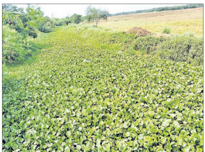
ନାଳରେ ଜମି ରହିଥିବା କଳିକଟି ଦଳ । ନିଷ୍ଠାସନ ପାଇଁ କଣାସ ପଞ୍ଚାୟତ ସମିତି କାର୍ଯ୍ୟାଳୟଠାରୁ ଗୋଟିଏ ନାଳ ବନ୍ଧାଣା କରାଯାଏ ସତ୍ତ୍ୱେ, ଦାମୋଦରପୁର, ବୁପୁର ଏବଂ ବ୍ରହ୍ମପଡ଼ା ବେଳ ଚଳିକା