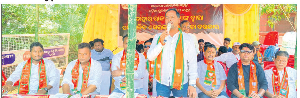
ରେଭେନ୍‌ଶା ବିଶ୍ୱବିଦ୍ୟାଳୟ ସମ୍ମୁଖରେ ଭାଜପା ଯୁବମୋର୍ଚ୍ଚା ପକ୍ଷରୁ ଧାରଣା ।