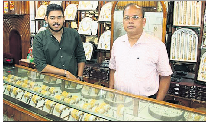
ଭୁବନେଶ୍ୱର, ୯।୫ (ଅନୁରାଧା ମହାରଣା)

ଅକ୍ଷୟ ଚୁଡ଼ାନ୍ତ ଅବସରରେ ଗହଣା ପ୍ରତିଷ୍ଠାନ ରାଧାଗୋବିନ୍ଦ ରାୟ ଗ୍ରାଣ୍ଟସନ୍ ପକ୍ଷରୁ ସ୍ୱତନ୍ତ୍ର ଅଫର ଘୋଷଣା କରାଯାଇଛି । ଅକ୍ଷୟ ଚୁଡ଼ାନ୍ତ ପରି ଏକ ଶୁଭଦିନରେ ଗ୍ରାହକ ସୁନା କିଣିବାକୁ ଆଗ୍ରହ ପ୍ରକାଶ କରୁଥିବାବେଳେ ଶୋ'ରୁ' ପକ୍ଷରୁ ରିହାତି ଯୋଜନା କରାଯାଇଛି । ସୁନାଗହଣାର ଗ୍ରାମ୍ ପ୍ରତି ୭୫% ଡିସ୍କାଣ୍ଟ ଓ ହାରା ଗହଣାର ଗଢ଼ା ମଲ୍ଟି ଉପରେ ୩୦% ପ୍ରତିଶତ ପର୍ଯ୍ୟନ୍ତ ରିହାତି ଉପଲବ୍ଧ ରହିଛି । ଏହା ସହ ଗ୍ରାହକମାନଙ୍କୁ ନୂଆ ସୁନାଗହଣା କିଣିବା ପରେ କମ୍ପ୍ୟୁଟରରେ ଲନୁସ୍‌ସାମାନ୍ୟ ଓ ପୁରୁଣା ଗହଣା ବଦଳାଇଲେ ଗ୍ୟାରେଣ୍ଟେଡ୍ ବ୍ୟାଙ୍କ ଯୋଜନା ପ୍ରଚଳିତ ଅଛି । ହାରା ଗହଣାରେ ୧୦୦ ପ୍ରତିଶତ ଏନ୍‌ୟୁଆଇଟି