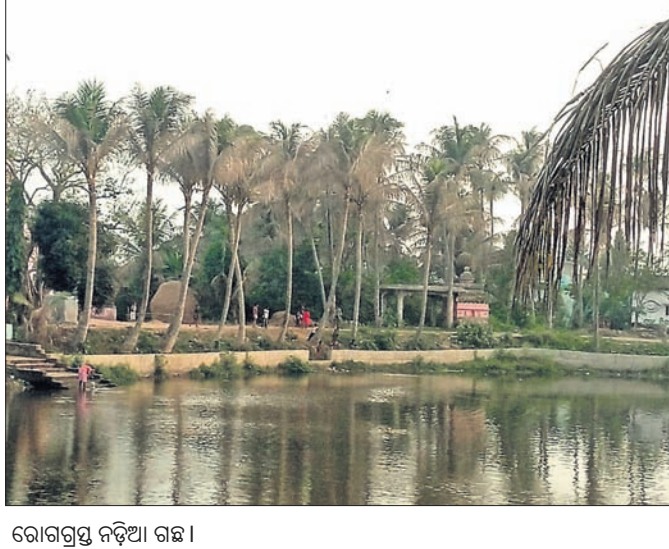
ରୋଗଗ୍ରସ୍ତ ନଡ଼ିଆ ଗଛ ।