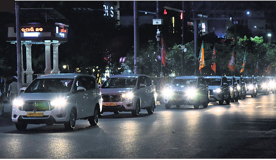
ପ୍ରଧାନମନ୍ତ୍ରୀ ନରେନ୍ଦ୍ର ମୋଦି ଶୁକ୍ରବାର ରାତିରେ ଭୁବନେଶ୍ୱର ଜନପଥରେ ନିର୍ବାଚନୀ ରୋଡ୍ ଶୋ' କରିବେ । ଏହାକୁ ସମର୍ଥନ କରିବା ପାଇଁ ଭାଜପା ପକ୍ଷରୁ ଗୁରୁବାର ସନ୍ଧ୍ୟାରେ ରିହର୍ସାଲ କରାଯାଇଥିଲା । ଏଥିରେ କେନ୍ଦ୍ରମନ୍ତ୍ରୀ ଭୂପେନ୍ଦ୍ର ଯାଦବ, ଭୁବନେଶ୍ୱର ଏମ୍ପି ପ୍ରାଥୀ ଅପରାଜିତା ଷଡ଼ଙ୍ଗାଙ୍କ ସମେତ ଭାଜପା ନେତା ଓ କର୍ମୀମାନେ ଯୋଗଦେଇଥିଲେ । ଏହି ଅବସରରେ କମିଶନରେଟ ପୋଲିସ୍ ପକ୍ଷରୁ କାର୍ଯ୍ୟକାରୀ ରିହର୍ସାଲ ମଧ୍ୟ କରାଯାଇଥିଲା ।