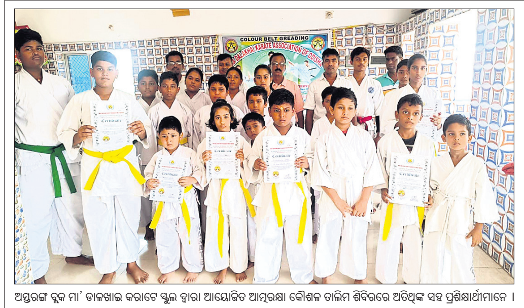
ଆତ୍ମରକ୍ଷା କୁଳ ମା' ତାଳଖାଇ କରାଚେ ସ୍କୁଲ ଦ୍ୱାରା ଆୟୋଜିତ ଆତ୍ମରକ୍ଷା କୌଶଳ ତାଲିମ ଶିବିରରେ ଅତିଥି ସହ ପ୍ରଶିକ୍ଷାଧୀନୀମାନେ ।

ଅଟକାଇବାକୁ ଚେଷ୍ଟା କରିଥିଲେ । ହେଲେ ସେ କାର୍ ନ ଅଟକାଇ ଯିଲା । ପୋଲିସ ଖୁବ୍ ବୋଧକୁ ଧକ୍କା ଦେଇ ଫେରାର ହୋଇଯାଇଥିଲେ । ଫଳରେ ସେଠାରେ ଉପସ୍ଥିତ ଥିବା ପୋଲିସ କର୍ମଚାରୀ ଆହତ ହୋଇଥିଲେ । ଏହାପରେ ଅନ୍ୟ କର୍ମଚାରୀମାନେ ଅଭିଯୁକ୍ତଙ୍କ ପଞ୍ଜା କରି କାର୍ କରାଯିବା ସହ ଅଭିଯୁକ୍ତଙ୍କୁ ଯାଞ୍ଚ ବେଳେ ସେ ନିଶା ସେବନ କରି ଗାଡ଼ି ଚାଳନା କରୁଥିବା ଜଣାପଡ଼ିବା ପରେ ଅଭିଯୁକ୍ତଙ୍କ କାର ଜବତ କରାଯିବା ସହ ତାଙ୍କୁ ଗିରଫ କରାଯାଇଥିଲା ।