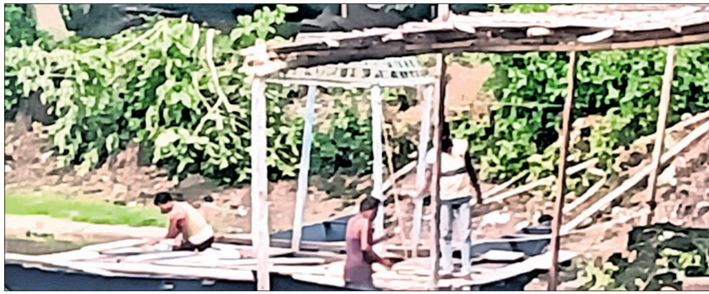
ଚନ୍ଦନ ପୋଖରୀରେ ସାକ୍ଷୀଗୋପାଳ ଠାକୁରଙ୍କ ଚାପଖେଳ ପାଇଁ ଚାପ ପ୍ରସ୍ତୁତି କରାଯାଇଛି ।

ସାକ୍ଷୀଗୋପାଳ, ୯୫ (ପ୍ରଶାନ୍ତ ବାରିକ/କିଶୋର ମହାପାତ୍ର):