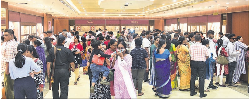
ଭୁବନେଶ୍ୱର, ୧୦.୫.୨୦ (ଅକ୍ଷୟ ଦାଶ)

■ ବେଶରେ ୧୫ରୁ ୨୦% କାରବାର ବୃଦ୍ଧି ■ ରାଜ୍ୟରେ ୧୦୦ କୋଟିରୁ ଅଧିକ ବ୍ୟୟ