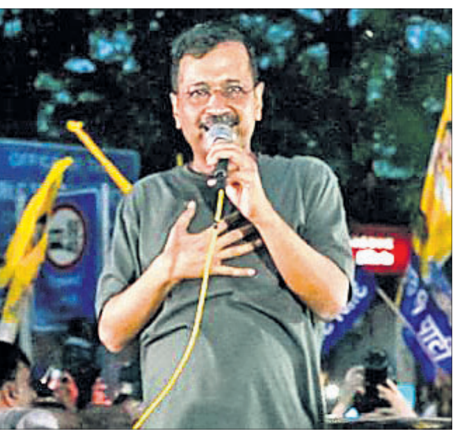
ତିହାର ଜେଲରୁ ବାହାରିବା ପରେ କେଜ୍‌ରିୱାଲ୍ ଦଳୀୟ କର୍ମୀ ଓ ସମର୍ଥକମାନଙ୍କୁ ସମ୍ବୋଧନ କରୁଛନ୍ତି।

ନୂଆଦିଲ୍ଲୀ, ୧୦୧୫(ପି.ଟି.) ସୁପ୍ରିମକୋର୍ଟ ଶୁକ୍ରବାର ଅନ୍ତରାଣ କାମିନି ପ୍ରଦାନ କରିବାର କିଛି ଘଣ୍ଟା ପରେ ଦିଲ୍ଲୀ ମୁଖ୍ୟମନ୍ତ୍ରୀ ଅରବିନ୍ଦ କେଜ୍‌ରିୱାଲ୍ ତିହାର ଜେଲକୁ ପୁଲୁକିଛନ୍ତି। ସେ ଭଗବାନ ହନୁମାନଙ୍କୁ ଧନ୍ୟବାଦ ଜଣାଇବା ସହ ଏକଜୁତ୍ରବାଦ ବିରୋଧରେ ଲଢ଼େଇ ପାଇଁ ଜନସାଧାରଣଙ୍କ ସମର୍ଥନ ଲୋଡ଼ିଛନ୍ତି। ଲୋକ ସଭା ନିର୍ବାଚନରେ ପ୍ରଚାର ନିମନ୍ତେ କେଜ୍‌ରିୱାଲ୍ଙ୍କୁ ସର୍ବୋଚ୍ଚ ଅଦାଲତ ଲୁଟ୍ ୧ ପର୍ଯ୍ୟନ୍ତ ଅନ୍ତରାଣ କାମିନି ପ୍ରଦାନ କରିଛନ୍ତି। ଜେଲରେ ବାହାରିବା ବେଳେ ଆମ୍ ଆଦମ୍ନୀ ପାର୍ଟି ନେତା ଓ କର୍ମୀମାନେ ପୋଲିସକୁ ସୂଚନା ଦିଆଯାଇଥିଲା। ଗୁଜରାଟ ସାଜବର ସେଲ୍ ପୋଲିସ ଏହି ମାମଲାର ତଦନ୍ତ ଜାରି ରଖିଛି। ପୁରୀନାୟକ, ଗତ ୬ ତାରିଖରେ ଗୁଜରାଟର ୨୫ ଲୋକ ସଭା ଆସନରେ ନିର୍ବାଚନ ଅନୁଷ୍ଠିତ ହୋଇଥିଲା।