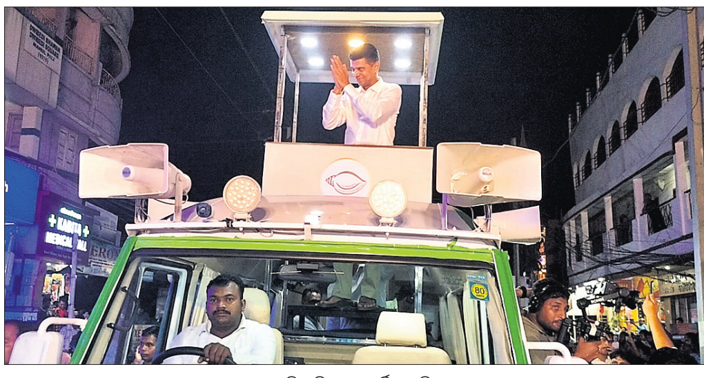
ରାଉରକେଲାଠାରେ ବିଜେଡି ନେତା କାର୍ତ୍ତିକ ପାଣ୍ଡିଆନଙ୍କ ରୋଡ୍ ଶୋ।