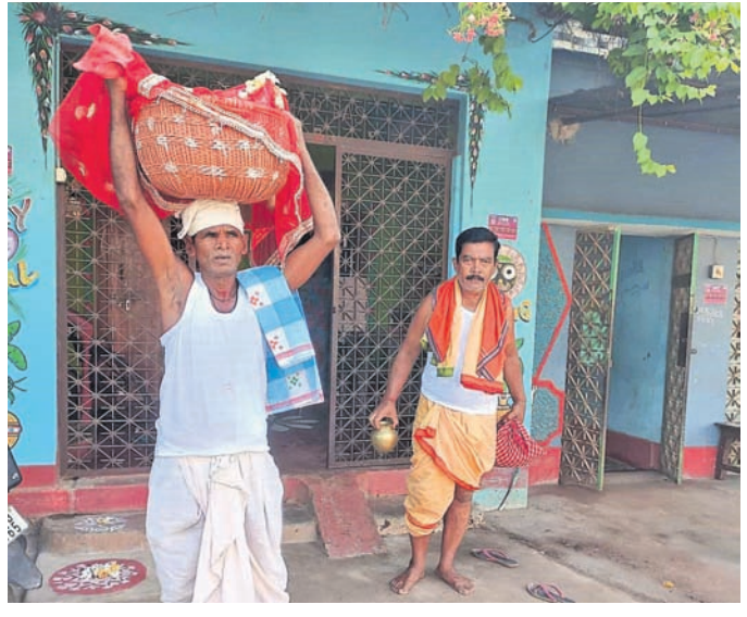
କଟେ ଚାଷୀ ଅଖୁମୁଠି ଅନୁକୂଳ ପାଇଁ ଗୋକେଲରେ ବିହନ ନେଇ ଜମିକୁ ଯାଉଛନ୍ତି।

ନୟାଗଡ଼ ଜିଲ୍ଲା ରଣପୁର ଏନ୍ଏସି ଓ ବ୍ଲକ୍ ୩୭୯ ପଞ୍ଚାୟତ ସହ ଏନ୍ଏସିରେ ଶୁକ୍ରବାର ଚାଷୀମାନଙ୍କ ମହାପର୍ବ ଅକ୍ଷୟ ତୃତୀୟା ପାଳନ ହୋଇଯାଇଛି। ଏନ୍ଏସି ଓ ବ୍ଲକ୍ ୬୦ ପ୍ରତିଶତ ପରିବାର ଅକ୍ଷୟ ତୃତୀୟା ପାଳନ କରୁଥିବା ବେଳେ ଏହା କେବଳ ପରମ୍ପରା ବଞ୍ଚାଇବାକୁ ପାଳନ କରୁଛୁ ବୋଲି ବହୁ ଚାଷୀ କହିଛନ୍ତି। ଚାଷୀମାନେ ଚାଷ ପ୍ରତି ଦିନକୁ ଦିନ ବିପୁଷ ହେଉଥିବା ଏହାଦ୍ୱାରା ପ୍ରମାଣ ମିଳିଛି। ଅକ୍ଷୟ ତୃତୀୟାରେ ଚାଷୀମାନେ ସକାଳୁ ସ୍ନାନ ସାରି ଘରେ ଥିବା ଧାନ ବିହନ, କୋଦାନ, ଗୋଗି, କଉଡ଼ି, ପଇସା, ଗୋଗ ଗୁଆ, ଭୋଗ, ଧୂପ ଧରି ଚାଷକମିରେ ପହଞ୍ଚି ପ୍ରଥମେ ଗୋଟିଏ କୋଣରେ ମାଟି ଖୋଳି ଧାନ, ପଇସା ଓ କଉଡ଼ିକୁ ପୋତିଥାନ୍ତି। ପରେ ସେହି ସ୍ଥାନରେ ଗୁଆ ବସାଇ ଧୂପ ଓ ଫୁଲ ଦେଇ ପୂଜା କରିଥାନ୍ତି। ଅକ୍ଷୟ ତୃତୀୟାଠାରୁ ଚାଷୀ ଆଉ ଚାଷକାମ କରିବାକୁ ମନ୍ତ୍ରୀ ନାହାନ୍ତି। ଚାଷ କମି ପଡ଼ିଥାଏ। ପଡ଼ିଲାଣି।