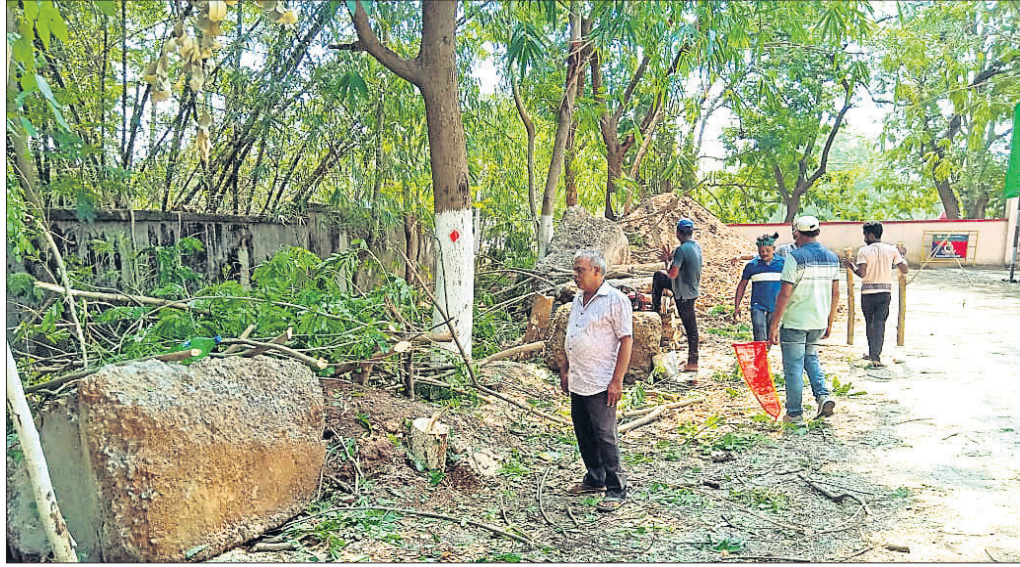
ରାସ୍ତା ପାର୍ଶ୍ୱରୁ ଗଛକାଟିବାକୁ ନେଇ ଲୋକେ ବିରୋଧ କରୁଛନ୍ତି।