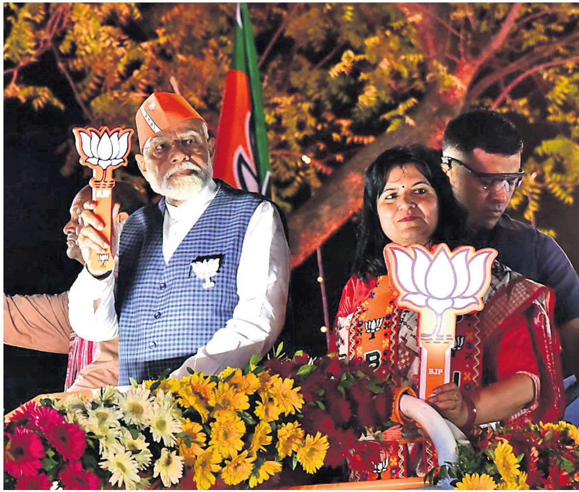
ପ୍ରଧାନମନ୍ତ୍ରୀ ନରେନ୍ଦ୍ର ମୋଦି ଶୁକ୍ରବାର ରାତିରେ ଭୁବନେଶ୍ୱର ଜନପଥର ଭାଙ୍ଗିପା କାର୍ଯ୍ୟକ୍ରମରେ ଚାଲି ରୋଡ୍ ଶୋ' କରି ନିର୍ବାଚନ ପ୍ରଚାର କରୁଛନ୍ତି। ନିକଟରେ ଅଛନ୍ତି ଭୁବନେଶ୍ୱର ଲୋକ ସଭା ଭାଙ୍ଗିପା ପ୍ରାଥମିକ ଅପରାଜିତା ଷଡ଼ଙ୍ଗୀ ।