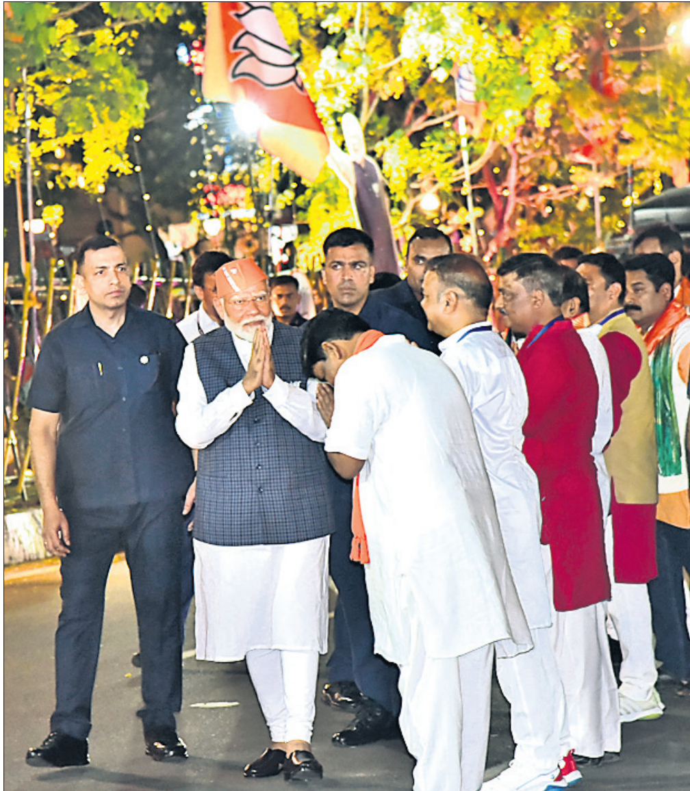
ଭୁବନେଶ୍ୱର ଜନପଥରେ ଶୁକ୍ରବାର ରାତିରେ ରୋଡ୍ ଶୋ ଆରମ୍ଭ ପୂର୍ବରୁ ପ୍ରଧାନମନ୍ତ୍ରୀ ନରେନ୍ଦ୍ର ମୋଦି ବିମାନବନ୍ଦରୁ କଢ଼ା ସୁରକ୍ଷାରେ ଆସି ଭାଙ୍ଗପା ରାଜ୍ୟ କାର୍ଯ୍ୟାଳୟ ସମ୍ମୁଖରେ ପହଞ୍ଚିବା ପରେ ଦଳର ନେତାମାନେ ସ୍ୱାଗତ କରୁଛନ୍ତି।