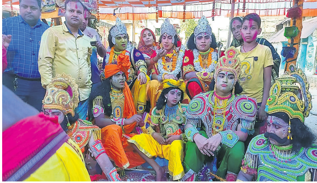
ରାମଲୀଳା ଶେଷରେ ରାମଚନ୍ଦ୍ରଙ୍କ ରାଜାଭିଷେକ।

ନୟାଗଡ଼, ୧୦/୫ (ଲୋକନାଥ ମିଶ୍ର) ନୟାଗଡ଼ ପୁରୁଣା ସହରରେ ପୂଜା ପାଉଥିବା ଜଗନ୍ନାଥ ମହାପ୍ରଭୁଙ୍କର ରଥଯାତ୍ରା ପାଇଁ ସନ୍ଧ୍ୟା ୫ଟାରେ ଅକ୍ଷୟ ତୃତୀୟାରେ ଆରମ୍ଭ ହୋଇଛି ରଥ ନିର୍ମାଣ। ରଥର ନୂଆ ଚକ ଓ ଅଖା ଶୁଭ ଦିଆଯାଇଛି। ସେହିପରି ନୟାଗଡ଼ରେ ଆରମ୍ଭ ହୋଇଛି ଚନ୍ଦନ ଯାତ୍ରା। ସନ୍ଧ୍ୟା ସାଢ଼େ ୬ଟାରେ ଜଗନ୍ନାଥଙ୍କର ଚକଟି ପ୍ରତିମା ମଦନମୋହନ ସାଗର ପୋଖରୀରେ ଯାଇ ଚାପ ଖେଳିଥିଲେ। ରାତି ସାଢ଼େ ୯ଟାରେ ପୁଣି ଚାପ ଖେଳି ଶ୍ରୀମନ୍ଦିରକୁ ଫେରିଲେ।