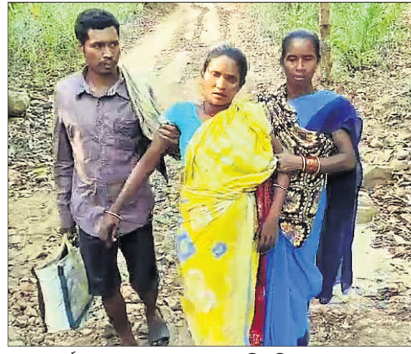
ଗର୍ଭବତୀଙ୍କୁ ଚଳାଇ ଚଳାଇ ନେଉଛନ୍ତି ପରିବାର ଲୋକେ।

କଳାହାଣ୍ଡି ଜିଲ୍ଲାରେ ପୁଣି ଜନନୀ ମନ୍ତ୍ରଣାର ଏକ ଚିତ୍ର ସାମଗ୍ରୀକୁ ଆସିଛି। ରାସ୍ତା ନ ଥିବାରୁ ଗାଁକୁ ଆସିବାକୁ ଯାଇପାରିଲା ନାହିଁ। ପଲରେ ୪ କି.ମି. ଚାଲି ଚାଲି ଚାନ୍ଦିନୀନାମା ଗଲେ ଗର୍ଭବତୀ ମିଳିଲା। ଏକଲି ଏକ ଅଭାବନୀୟ ଘଟଣା ଦେଖିବାକୁ ମିଳିଛି ଭବାନୀପାଟଣା ସଦର ବ୍ଲକ୍ ଚାନ୍ଦିନୀ ପଞ୍ଚାୟତ ପୋରଡ଼ାଗ୍ରାମରେ। ଗାଁର ଲିଟ୍ଟି ମାଟିକ ସ୍ତ୍ରୀ ମାଣ୍ଡେ ମାଟିକ ଶୁକ୍ରବାର ସକାଳୁ ଗର୍ଭ ମନ୍ତ୍ରଣା ହେବାକୁ ଡାକ୍ତରଖାନା ନେବା ପାଇଁ ପରିବାର ଲୋକେ ବାହାରିଥିଲେ। ଏହି ସମୟରେ ସେମାନେ ଆସୁଲାରୁ ଫୋନ୍ କରିଥିଲେ। କିନ୍ତୁ ଗାଁକୁ ଯିବା ପାଇଁ ରାସ୍ତା ନ ଥିବାରୁ ଆସୁଲାନ୍ତୁ