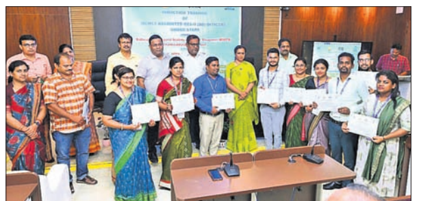
ଶୁକ୍ଳଚିତ ଓ ସାଧୁରୀ ଆଚରଣ କଲେ ବିଭାଗୀୟ କର୍ମଚାରୀ ତଥା ଶାସନ ସଚିବ ଅଶ୍ୱତ୍ଥ ସିଂହ, ମୁଖ୍ୟ ଅତିଥି ଭାବେ ଯୋଗଦେଇ ଶିକ୍ଷାସେବା ଅଧିକାରୀମାନେ ବିଭିନ୍ନ କ୍ଷେତ୍ରରେ ଅଧିକାରୀଙ୍କୁ କର୍ତ୍ତବ୍ୟ ବିଷୟରେ ଅବଗତ ହେବାକୁ ଆହ୍ୱାନ ଦେଇଥିଲେ।

ବିଦ୍ୟାଳୟ ଓ ଗଣଶିକ୍ଷା ବିଭାଗ ପକ୍ଷରୁ ଭୁବନେଶ୍ୱରସ୍ଥିତ ମଧ୍ୟସ୍ଥର ଦାସ ଆଞ୍ଚଳିକ ଆର୍ଥିକ ପରିଚାଳନା ଏକାଡେମୀରେ ଓଡ଼ିଶା ଶିକ୍ଷା ସେବା (ଓଇଏସ୍) ଅଧିକାରୀଙ୍କ ପ୍ରବେଶକାଳୀନ ପ୍ରଶିକ୍ଷଣ ଶୁକ୍ରବାର ଉଦ୍‌ଘାଟିତ ହୋଇଥିଲା। ବିଭାଗୀୟ କର୍ମଚାରୀ ତଥା ଶାସନ ସଚିବ ଅଶ୍ୱତ୍ଥ ସିଂହ, ମୁଖ୍ୟ ଅତିଥି ଭାବେ ଯୋଗଦେଇ ଶିକ୍ଷାସେବା ଅଧିକାରୀମାନେ ବିଭିନ୍ନ କ୍ଷେତ୍ରରେ ଅଧିକାରୀଙ୍କୁ କର୍ତ୍ତବ୍ୟ ବିଷୟରେ ଅବଗତ ହେବାକୁ ଆହ୍ୱାନ ଦେଇଥିଲେ। ପ୍ରଥମେ ନିଜ