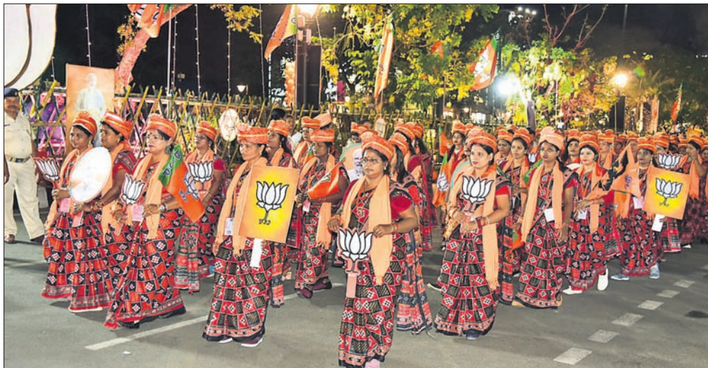
ମୋଦିଙ୍କ ରୋଡ୍ ଶୋ ରାଡ଼ି ସମ୍ମୁଖରେ ସମଲପୁରୀ ବସ୍ତ୍ର ପରିଧାନ କରି ଯାଉଥିବା ଭାଙ୍ଗପା ନେତ୍ରୀ ଓ କର୍ମୀ।