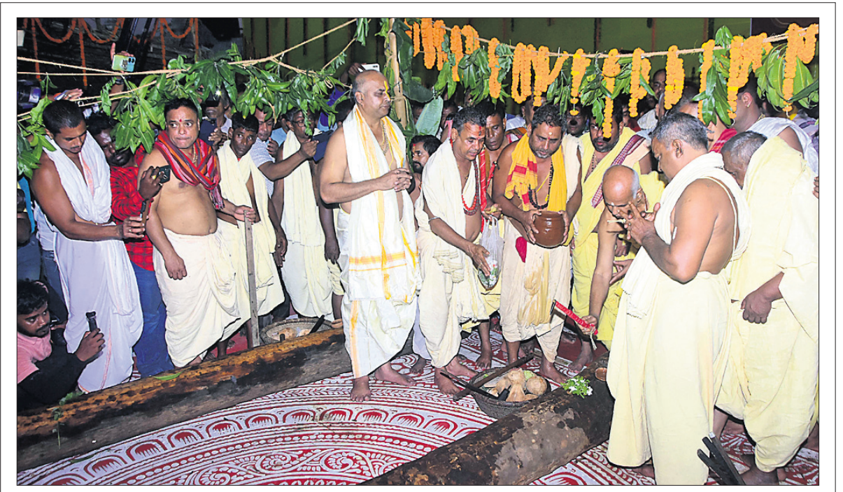
ପୁରୀ: ପବିତ୍ର ଅକ୍ଷୟ ତୃତୀୟାରେ ଶୁକ୍ରବାର ଶ୍ରୀମନ୍ଦିର କାର୍ଯ୍ୟାଳୟ ସମ୍ମୁଖରେ ଚିକିତ୍ସା ଧଉରା କାଠକୁ ବିଧିବିଧାନ ଅନୁଯାୟୀ ଶ୍ରେଣ୍ଡିୟ ବ୍ରାହ୍ମଣମାନେ ପୂଜାର୍ଚ୍ଚନା କରି ରଥକାଠ ଅନୁକୂଳ କରୁଛନ୍ତି।

ତୁରନ୍ତ ଯୁକ୍ତି ଦାଖଲ କରିବାକୁ ଡିଇଓମାନଙ୍କୁ ନିର୍ଦ୍ଦେଶ ଦିଆଯାଇଛି। ଏହାପରେ ୫୨୯ ଟଙ୍କା ମଧ୍ୟରୁ ହୋଇଥିଲା। ହେଲେ ମାତ୍ର ୪ କୋଟି ୫ ଲକ୍ଷ ୩୮ ହଜାର ୧୦୧ ଟଙ୍କା ବିନିଯୋଗ ପତ୍ର(ଯୁକ୍ତି) ଦାଖଲ ହୋଇଥିବାବେଳେ ୯ କୋଟି ୩୪ ଲକ୍ଷ ୫୫ ହଜାର ୪୬୭ ଟଙ୍କାର ହିସାବ ଏଯାବତ୍ ମିଳି ପାରିନାହିଁ। ଅନୁଗୋଳ, ବାଲେଶ୍ୱର, କନ୍ଧମାଳ ଓ କେନ୍ଦ୍ରାପଡ଼ା ଜିଲ୍ଲା ଶିକ୍ଷାଧିକାରୀ (ଡିଇଓ) ସମସ୍ତ ଯୁକ୍ତି ଦାଖଲ କରିଥିବାବେଳେ ବାକି ୨୬ ଜିଲ୍ଲାରେ ତଥା ହୋଇନାହିଁ।