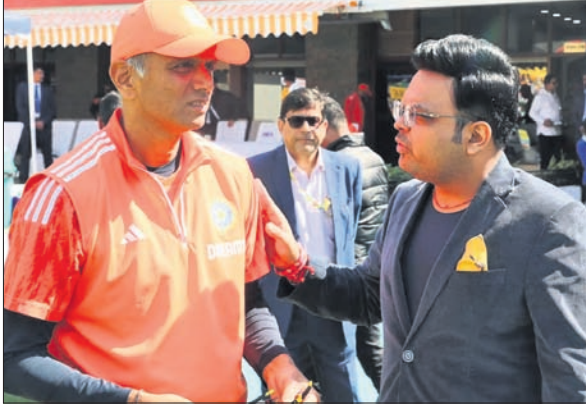
ରାହୁଲ ଭ୍ରାତୃ ଓ ଜୟ ଶାହା

ପୂର୍ଣ୍ଣା, ୧୦୫ (ପି.ଟି.): ଆପଣା ମାସରେ ହେବାକୁଥିବା ଅନ୍ତର୍ଜାତୀୟ ଟି୨୦ କ୍ରିକେଟ ବିଶ୍ୱକପ୍ରେ ଭାରତୀୟ ଦଳର ପୁଷ୍ପା କୋର୍ ରାହୁଲ ଭ୍ରାତୃଙ୍କ କାର୍ଯ୍ୟକାଳ ଶେଷ ହେବ। କିନ୍ତୁ ସେ ଏହି ପଦବୀରେ ପୁଣି ରହିବାକୁ ଚାହଁଲେ ଆବେଦନ କରିବାକୁ ପଡ଼ିବ ବୋଲି କହିଛନ୍ତି ଭାରତୀୟ କ୍ରିକେଟ କଣ୍ଟ୍ରୋଲ ବୋର୍ଡ (ବିସିଆଇ) ସାଧାରଣ ସମ୍ପାଦକ ଜୟ ଶାହା। ବିସିଆଇ ପ୍ରକୃତରେ ଭ୍ରାତୃ ଏବଂ ତାଙ୍କ ସପୋର୍ଟ ସ୍ୱାମ୍ୟଙ୍କ ଲାଗି ୨ ବର୍ଷ ପାଇଁ ରୁକ୍ତି କରିଥିଲା। ଗତବର୍ଷ ନଭେମ୍ବରରେ ୫୦୦ଓର ବିଶିଷ୍ଟ ବିଶ୍ୱକପ୍ ଶେଷ ହେବା ପରେ ଏହି ମିଆଦକୁ ବୃଦ୍ଧି କରାଯାଇଥିଲା। ରୁହୁବାର ସ୍ଥାନୀୟ ବିସିଆଇ କାର୍ଯ୍ୟକ୍ରମରେ ଖବରଦାତାମାନଙ୍କ ସହ ଏକ ବାର୍ତ୍ତାକାପ ବେଳେ