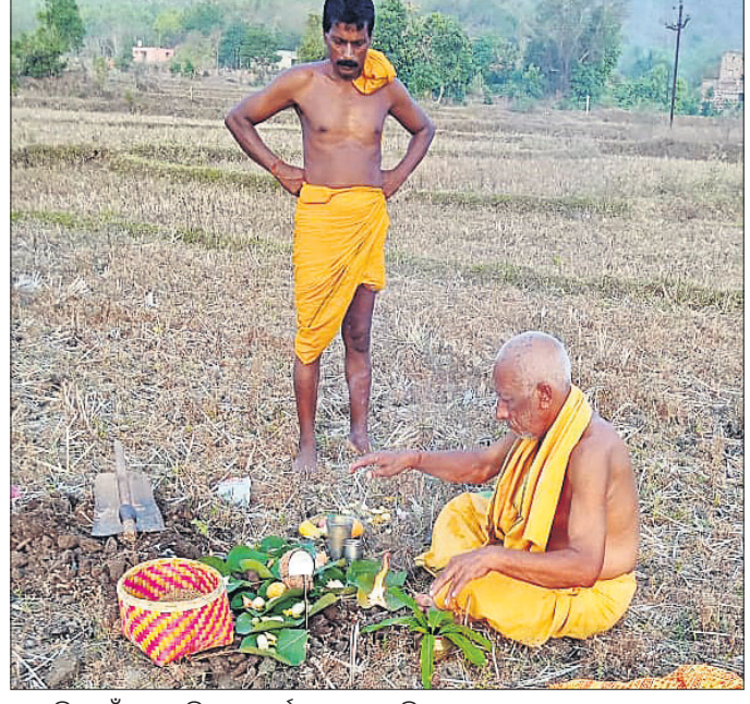
ଅଖୁମୁଠି ପାଇଁ ଚାଷ କରିବେ ପୂଜାର୍ଚ୍ଚନା କରାଯାଇଛି।

ଅମଳକୁ ପରମ୍ପରା ଅନୁସାରେ ଅକ୍ଷୟ ତୃତୀୟାରେ ଅଖୁ ମୁଠି ଅନୁକୂଳ କରୁଛୁ। ମାତ୍ର ଗାଁ ଗହଳରେ ଆଉ ହଳ ବଳଦ, ଶଗଡ଼ ଦେଖିବାକୁ ମିଳୁନି। ଚାଷ କାର୍ଯ୍ୟ