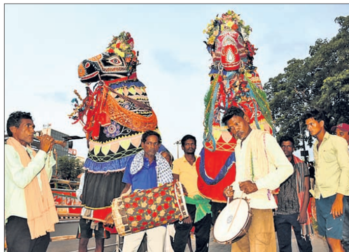
ଜନପଥର ବିଭିନ୍ନ ସ୍ଥାନରେ କଳାକାରମାନେ କଳା ପ୍ରଦର୍ଶନ କରି ପ୍ରଧାନମନ୍ତ୍ରୀ ମୋଦିଙ୍କୁ ସ୍ୱାଗତ କରୁଛନ୍ତି।