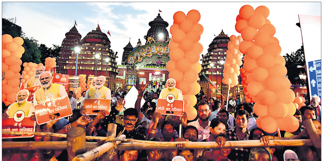
ପ୍ରଧାନମନ୍ତ୍ରୀଙ୍କ ରୋଡ୍ ଶୋ'କୁ ଦେଖିବା ଲାଗି ରାମ ମନ୍ଦିର ସମ୍ମୁଖରେ ଲୋକଙ୍କ ସମାଗନ।