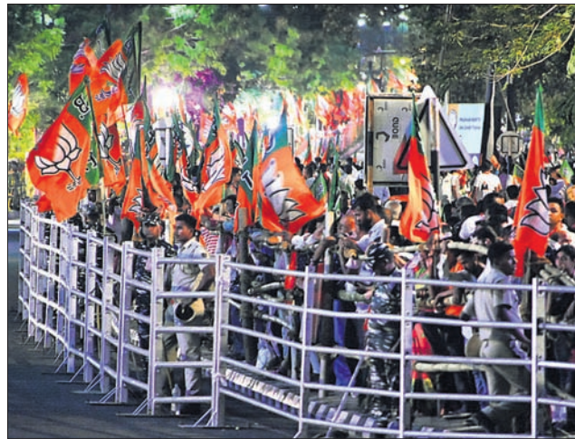
ରୁପାଲି ଛକ ବ୍ୟାରିକେଡ୍ ଭିତରେ ଭିଡ଼ ଏବଂ ମୋଦି ମୁଖା ପିଛାଏବା ଉତ୍ସାହିତ କର୍ମୀ।