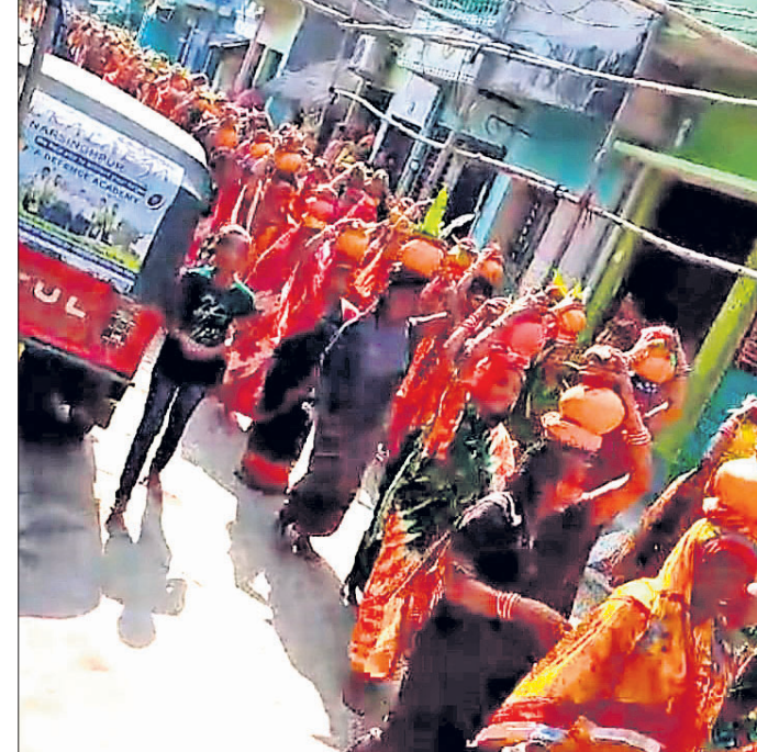
ମହିଳାମାନେ କଳସଯାତ୍ରାରେ ଯାଉଛନ୍ତି।