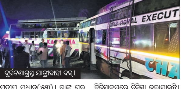
ସୁବର୍ଣ୍ଣପୁର-ସମ୍ବଲପୁର ରାସ୍ତାର ଉଲୁଣ୍ଡା କୁଳୁଚିତ୍ତ ଚୁଡ଼ପାଲି ଛକରେ ଶୁକ୍ରବାର ରାତିରେ ସଡ଼କ ଦୁର୍ଘଟଣା ଘଟିଛି। ଚୁଡ଼ପାଲି ରାସ୍ତାରେ ୨ ଯାତ୍ରୀବାହୀ ବସ୍ ମଧ୍ୟରେ ମୁହାଁମୁହିଁ ଧକ୍କା ହେବା ଫଳରେ ଘଟଣାସ୍ଥଳରେ ଭ୍ରାତୃଭରଙ୍କ ମୃତ୍ୟୁ ହୋଇଛି। ମୃତ ଭ୍ରାତୃଭରଙ୍କ ନାମ

ସୋନପୁର, ୧୦୫ (ମୁଖ୍ୟମନ୍ତ୍ରୀ ଶରପଥୀ) ସୁବର୍ଣ୍ଣପୁର-ସମ୍ବଲପୁର ରାସ୍ତାର ଉଲୁଣ୍ଡା କୁଳୁଚିତ୍ତ ଚୁଡ଼ପାଲି ଛକରେ ଶୁକ୍ରବାର ରାତିରେ ସଡ଼କ ଦୁର୍ଘଟଣା ଘଟିଛି। ଚୁଡ଼ପାଲି ରାସ୍ତାରେ ୨ ଯାତ୍ରୀବାହୀ ବସ୍ ମଧ୍ୟରେ ମୁହାଁମୁହିଁ ଧକ୍କା ହେବା ଫଳରେ ଘଟଣାସ୍ଥଳରେ ଭ୍ରାତୃଭରଙ୍କ ମୃତ୍ୟୁ ହୋଇଛି। ମୃତ ଭ୍ରାତୃଭରଙ୍କ ନାମ