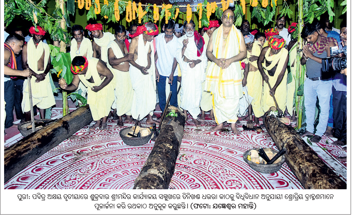
ପୁରୀ: ପବିତ୍ର ଅକ୍ଷୟ ତୃତୀୟାରେ ଶୁକ୍ରବାର ଶ୍ରୀମନ୍ଦିର କାର୍ଯ୍ୟାଳୟ ସମ୍ମୁଖରେ ତିନିଖଣ୍ଡ ଧରା କାଠକୁ ବିଧିବିଧାନ ଅନୁଯାୟୀ ଶ୍ରୋତ୍ରୀୟ ବ୍ରାହ୍ମଣମାନେ ପୂଜାର୍ଚ୍ଚନା କରି ରଥକାଠ ଅନୁକୂଳ କରୁଛନ୍ତି।

ପୁରୀ, ୧୦୫ (ଅଜିତ କୁମାର ମହାନ୍ତି) ୧୦ରେ ସ୍ୱାର ପିଟାଯାଇ ବିଭିନ୍ନ ନୀତି ଅନୁସ୍ଥିତ ହୋଇଥିଲା। ମଧ୍ୟାହ୍ନ ଧୂପ ପଢ଼ା ହେବା ପରେ ଭୋଗ ଓ ଯାତାୟତ ପରେ ନକ୍ଷତ୍ର ବଦାପନା ହୋଇଥିଲା। ଶ୍ରୀମନ୍ଦିରକୁ ଜନ୍ମଦେବତା ବିଜେ କରିବେ। ତେଣୁ ଶ୍ରୀମନ୍ଦିର ସ୍ୱତନ୍ତ୍ର ଓ ରଥ ସଂହିତା ଅନୁଯାୟୀ, ବୈଶାଖ ଶୁକ୍ଳପକ୍ଷ ତୃତୀୟା ତଥା ପବିତ୍ର ଅକ୍ଷୟ ତୃତୀୟାରେ ଶୁକ୍ରବାର ରଥଯାତ୍ରା ପାଇଁ ରଥ ନିର୍ମାଣ କାର୍ଯ୍ୟର ଶୁଭ ଅନୁକୂଳ ନୀତି ସମ୍ପନ୍ନ ହୋଇଛି। ଶନିବାରଠାରୁ ରଥଖଳାରେ ରଥ ନିର୍ମାଣ କାର୍ଯ୍ୟ ଆରମ୍ଭ ହେବ। ଅକ୍ଷୟ ତୃତୀୟାରେ ଶ୍ରୀମନ୍ଦିରରେ ବିଶେଷ ନୀତି ଅନୁସ୍ଥିତ ହୋଇଛି। ଭୋଗ ଧରା ରଥଖଳାରେ ରଥଖଳାରେ ହୋମ ସମ୍ପନ୍ନ କରିଥିଲେ। ଶ୍ରୀମନ୍ଦିରକୁ ବୈଷ୍ଣବାଗ୍ନି ଆଣି ହୋମରେ ଅଗ୍ନି ସ୍ଥାପନ କରାଯାଇଥିଲା। ନୃସିଂହ ମନ୍ତ୍ରରେ ଆହୁତି ସହ ମା' ଦକ୍ଷିଣାକାଳୀଙ୍କ ମନ୍ତ୍ରରେ ତିନୋଟି କୁରାଡ଼ିକୁ ଅଭିମନ୍ତ୍ରିତ କରି ପୂଜା କରାଯାଇଥିଲା। ଶ୍ରୀମନ୍ଦିରରୁ ଗାଣା ପୂଜାପଠା ଆଜ୍ଞାପାଳ ଧରି ଆଗରେ ଏବଂ ବିଜେ ପ୍ରତିମା ପଛୁଆରେ ଶ୍ରୀମନ୍ଦିର ନିକଟ ରଥଖଳାକୁ ବିଜେ କରିଥିଲେ। ପୂର୍ବରୁ ଶ୍ରୀମନ୍ଦିର କାର୍ଯ୍ୟାଳୟ ସମ୍ମୁଖରେ ତିନିଖଣ୍ଡ ଧରା କାଠକୁ ବିଧିବିଧାନ ଅନୁଯାୟୀ ଧୂଆଁଯାଇ ରଖାଯାଇଥିଲା। ଶ୍ରୋତ୍ରୀୟ