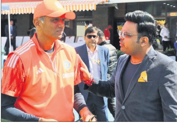
ରାହୁଲ ଭ୍ରାତୃଭିତ ଓ ଜୟ ଶାହା।

ପୂୟାଳ, ୧୦୫(ପି.ଟି.): ଆସନ୍ତା ମାସରେ ହେବାକୁଥିବା ଅନ୍ତର୍ଜାତୀୟ ଟି୨୦ କ୍ରିକେଟ ବିଶ୍ୱକପ୍ରେ ଭାରତୀୟ ଦଳର ପୁଷ୍ପା କୋର୍ ପୂୟାଳ ଭ୍ରାତୃଭିତକ କାର୍ଯ୍ୟକାଳ ଶେଷ ହେବ। କିନ୍ତୁ ସେ ଏହି ପଦବୀରେ ପୁଣି ରହିବାକୁ ଚାହଁଲେ ଆବେଦନ କରିବାକୁ ପଡ଼ିବ ବୋଲି କହିଛନ୍ତି ଭାରତୀୟ କ୍ରିକେଟ କଣ୍ଟ୍ରୋଲ ବୋର୍ଡ (ବିସିଆଇ) ସାଧାରଣ ସମ୍ପାଦକ ଜୟ ଶାହା। ବିସିଆଇ ପ୍ରକୃତରେ ଭ୍ରାତୃଭିତ ଏବଂ ତାଙ୍କ ସପୋର୍ଟ ସ୍ୱାମ୍ୟଙ୍କ ଲାଗି ୨ ବର୍ଷ ପାଇଁ ରୁକ୍ତି କରିଥିଲା। ଗତବର୍ଷ ନଭେମ୍ବରରେ ୫୦୦ଓର ବିଶିଷ୍ଟ ବିଶ୍ୱକପ୍ ଶେଷ ହେବା ପରେ ଏହି ମିଆଦକୁ ବୃଦ୍ଧି କରାଯାଇଥିଲା। ରୁକୁବାର ସ୍ଥାନୀୟ ବିସିଆଇ କାର୍ଯ୍ୟକ୍ରମରେ ଖବରଦାତାମାନଙ୍କ ସହ ଏକ ବାର୍ତ୍ତାକାପ ବେଳେ