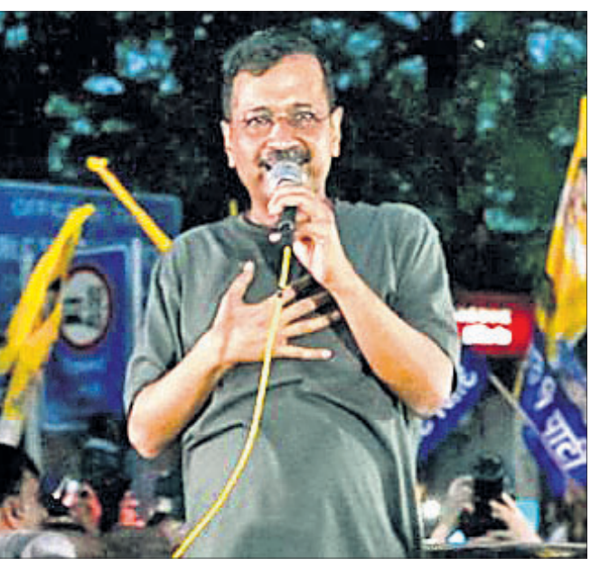
ତିହାର ଜେଲରୁ ବାହାରିବା ପରେ କେଜ୍‌ରିୱାଲ୍ ଦଳୀୟ କର୍ମୀ ଓ ସାମର୍ଥକମାନଙ୍କୁ ସମ୍ବୋଧନ କରୁଛନ୍ତି।

ନୂଆଦିଲ୍ଲୀ, ୧୦୧୫(ପି.ଟି.) ସୁପ୍ରିମକୋର୍ଟ ଶୁକ୍ରବାର ଅନ୍ତରାଣ କାମିନ ପ୍ରଦାନ କରିବାର କିଛି ଦଣ୍ଡ ପରେ ଦିଲ୍ଲୀ ମୁଖ୍ୟମନ୍ତ୍ରୀ ଅରବିନ୍ଦ କେଜ୍‌ରିୱାଲ୍ ତିହାର ଜେଲକୁ ପୁଲୁକିଛନ୍ତି। ସେ ଭଗବାନ ହନୁମାନଙ୍କୁ ଧନ୍ୟବାଦ ଜଣାଇବା ସହ ଏକଜୁତ୍ରବାଦ ବିରୋଧରେ ଲଢ଼େଇ ପାଇଁ ଜନସାଧାରଣଙ୍କ ସମର୍ଥନ ଲୋଡ଼ିଛନ୍ତି। ଲୋକ ସଭା ନିର୍ବାଚନରେ ପ୍ରଚାର ନିମନ୍ତେ କେଜ୍‌ରିୱାଲ୍ଙ୍କୁ ସର୍ବୋଚ୍ଚ ଅବାଲତ ଲୁଟ୍ ୧ ପର୍ଯ୍ୟନ୍ତ ଅନ୍ତରାଣ କାମିନ ପ୍ରଦାନ କରିଛନ୍ତି। ଜେଲରେ ବାହାରିବା ବେଳେ ଆମ୍ ଆଦମ୍ନୀ ପାର୍ଟି ନେତା ଓ କର୍ମୀମାନେ ତୋଳ ବଜାଇ ଓ ସ୍ତୋତ୍ରାଦି ବେଳ ତାଙ୍କୁ ସ୍ୱାଗତ କରିଥିଲେ। ଏକ କାର୍ତ୍ତ ସନ୍ତୁଷ୍ଟରେ ଛିଡ଼ାହୋଇ ସେ ଦଳୀୟ କର୍ମୀ ଓ ସାମର୍ଥକମାନଙ୍କୁ ସମ୍ବୋଧିତ କରିଥିଲେ। ଭାରତ ମାତା କା ଜୟ, ଇନ୍ଦ୍‌ଜିଲାଦ ଜିଆବାଦ ସ୍ତୋତ୍ରାଦି ବେଳ କରିବା ପରେ ଅପରାହ୍ଣ ୧ଟା ବେଳେ ଖବରଦାତା ସମ୍ମିଳନୀକୁ ସମ୍ବୋଧନ କରିବା ପରେ ଅପରାହ୍ଣ ୧ଟା ବେଳେ ଖବରଦାତା ସମ୍ମିଳନୀକୁ ସମ୍ବୋଧନ ଆଶୀର୍ବାଦକୁ ମୁଁ ଆପଣମାନଙ୍କ ଗହଣକୁ ଫେରିଆସିଛି। ଜନସାଧାରଣଙ୍କ ଭଲପାଇବା ଓ ଆଶୀର୍ବାଦ ପାଇଁ ସେ ସେମାନଙ୍କୁ ଧନ୍ୟବାଦ ଜଣାଇଛନ୍ତି।