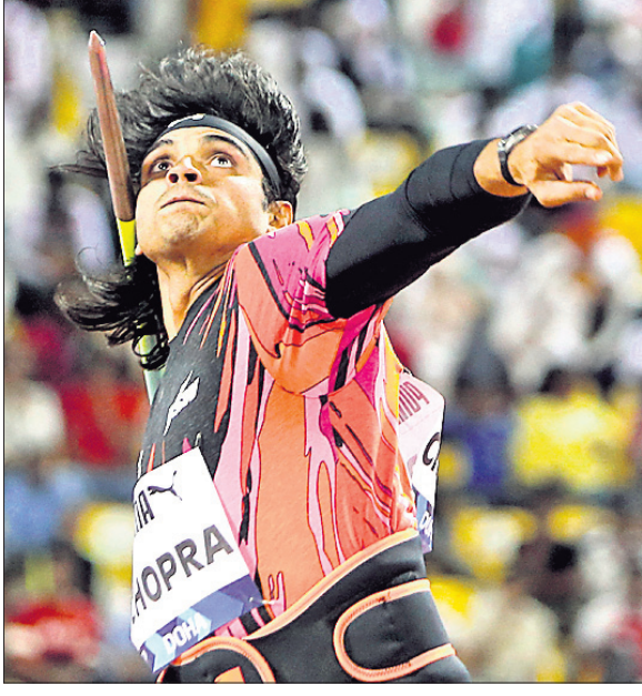
ଜାଭେଲିନ୍ ପ୍ରୋ ଅବସରରେ ନୀରଜ ଚୋପ୍ରା।