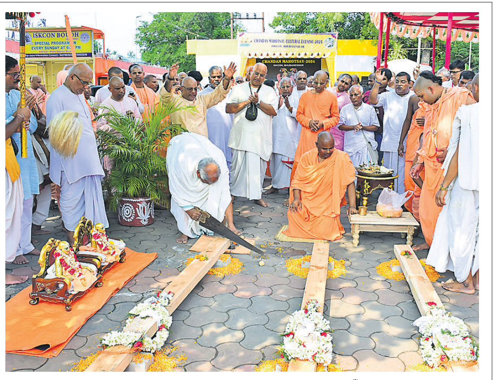
ଅକ୍ଷୟ ତୃତୀୟାରେ ଶୁକ୍ରବାର ଇନ୍ଦ୍ର ମନ୍ଦିରରେ ରଥଯାତ୍ରା ପାଇଁ ଶୁକ୍ରବାର ରଥକାଠ ଅନୁକୂଳ କରାଯାଇଛି।