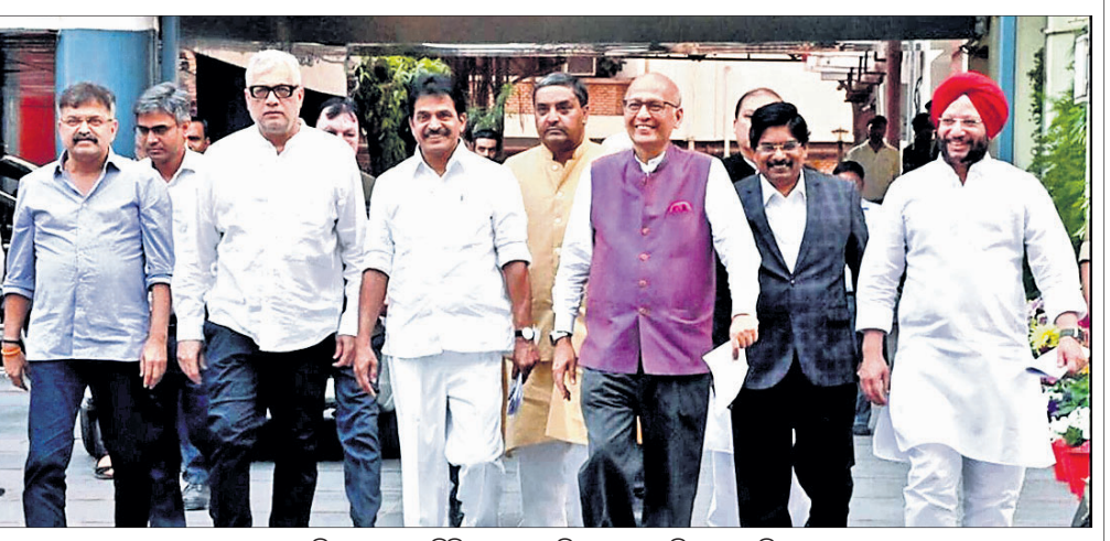
ଇଣ୍ଡିଆ ବ୍ଲକ୍ ପ୍ରତିନିଧିମାନେ ଇସିଆଇକୁ ଭେଟି ଫେରୁଛନ୍ତି।