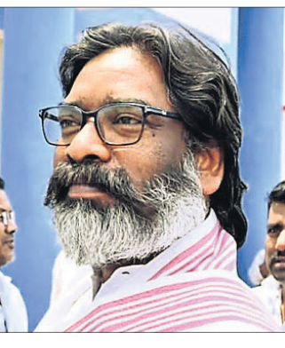
ହେମନ୍ତ ସୋରେନ୍ ନୂଆଦିଲ୍ଲୀ, ୧୦୧୫

କମି ଦୁର୍ନୀତି ସହ ଜଡ଼ିତ ମନିଲଣ୍ଡର୍ ମାମଲାରେ ଗିରଫ ହୋଇ ଜେଲରେ ଥିବା ଖଡ଼ିଶିର୍ ପୂର୍ବତନ ମୁଖ୍ୟମନ୍ତ୍ରୀ ହେମନ୍ତ ସୋରେନ୍‌ଙ୍କ ଅନ୍ତରାଣ କାମିନ ଆବେଦନର ଶୁଣାଣି ଆସନ୍ତା ୧୩ ତାରିଖରେ ହେବ। ପ୍ରବର୍ତ୍ତନ ନିର୍ଦ୍ଦେଶାଳୟ (ଇଡି) ଗିରଫଦାରିକୁ ଚ୍ୟାଲେଞ୍ଜ କରି ଜେଏମ୍‌ଏମ୍ ନେତା କରିଥିବା ଆବେଦନର ରାୟ ଘୋଷଣା କରିବାରେ ହାଇକୋର୍ଟ ବିଳମ୍ବ କରୁଥିବାରୁ ଏହା ବିରୋଧରେ ତାଙ୍କ ପିଟିଶନର ଶୁଣାଣିକୁ ସୁପ୍ରିମକୋର୍ଟ ବନ୍ଦ କରିଦେଇଛନ୍ତି। ରାୟ ଘୋଷଣାରେ ବିଳମ୍ବ ବିରୋଧରେ ସୋରେନ୍‌ଙ୍କ ଆବେଦନ ପ୍ରାସଙ୍ଗିକତା ହରାଇଥିବା କଣ୍ଠସ୍ୱ ସଞ୍ଜାଏ ଖାନ୍ନା ଏବଂ ଦାବକର ଦରାଜ ଖଣ୍ଡପାଠ କହିଛନ୍ତି। ପୂର୍ବ ଶୁଣାଣି ବେଳେ ସୁପ୍ରିମକୋର୍ଟ ଗିରଫଦାରି ବିରୋଧରେ ସୋରେନ୍‌ଙ୍କ ଆବେଦନ ଉପରେ ରାୟ ପ୍ରକାଶ କରିବାକୁ ହାଇକୋର୍ଟକୁ କହିଥିଲେ। ହାଇକୋର୍ଟ ଫେବୃଆରୀ ୨୮ରୁ ରାୟ ସଂରକ୍ଷିତ ରଖୁଥିବାରୁ ଏଥିରେ ଅସନ୍ତୋଷ ବ୍ୟକ୍ତ କରିବା ସହ ନିମନ୍ତେ ସଭା ନିର୍ବାଚନରେ ପ୍ରଚାର ନିମନ୍ତେ କରାଯାଇଥିବା ଆବେଦନରେ ଉଲ୍ଲେଖ ଦେବାକୁ ଏଡିଆର ନିବେଦନ କରିଛି।