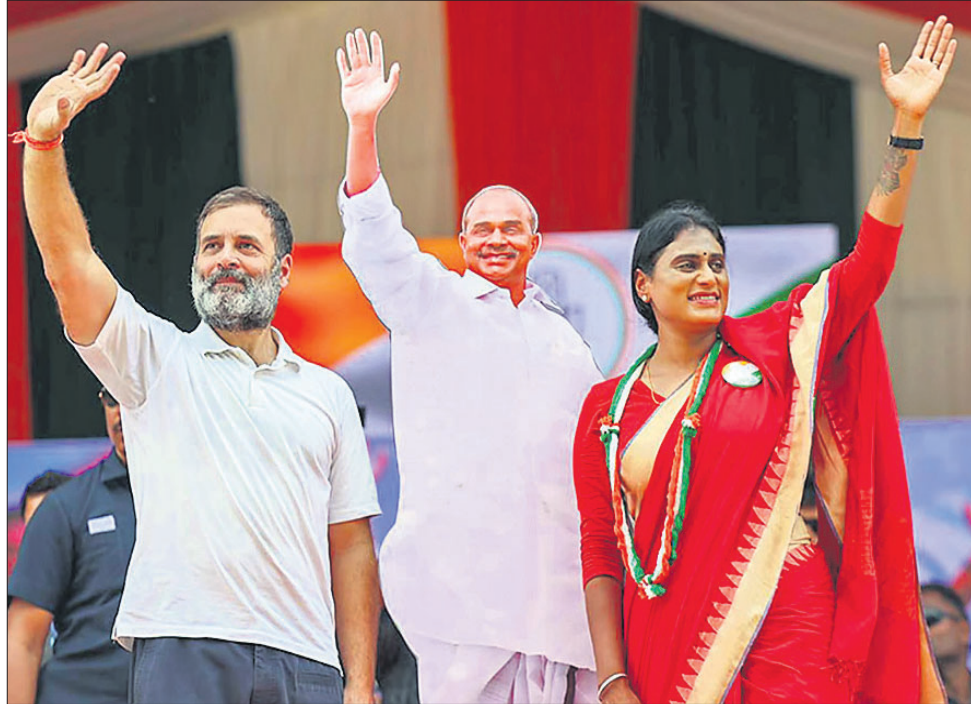
ଆନ୍ଧ୍ରପ୍ରଦେଶର କଟ୍ଟାପାରେ ଶନିବାର କଂଗ୍ରେସ ନେତା ରାହୁଲ ଗାନ୍ଧୀ ନେତୃତ୍ୱ ଉଲ୍ଲସ ସହ ନିର୍ବାଚନ ପ୍ରଚାର କରୁଛନ୍ତି।

ପ୍ରଧାନମନ୍ତ୍ରୀ ନରେନ୍ଦ୍ର ମୋଦିଙ୍କ ସହ ଖୋଲା ବିତର୍କ ଆହୁନି କିନ୍ତୁ କଂଗ୍ରେସ ନେତା ରାହୁଲ ଗାନ୍ଧୀ ଶନିବାର ଗ୍ରହଣ କରିଛନ୍ତି। ଯଦି ପ୍ରଧାନମନ୍ତ୍ରୀ ବିତର୍କରେ ସାମିଲ ହେବାକୁ ପ୍ରସ୍ତୁତ କି ବୋଲି ରାହୁଲ ପ୍ରଶ୍ନ କରିଛନ୍ତି।