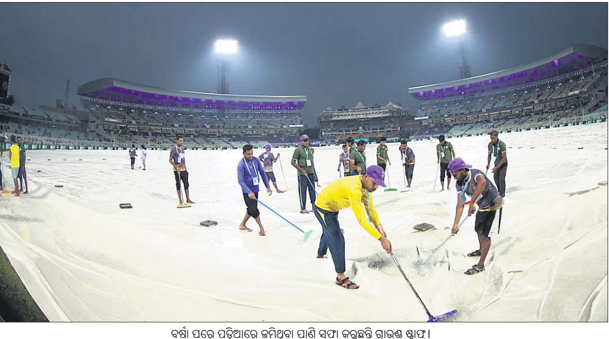
ବର୍ଷା ପରେ ପଡ଼ିଆରେ ଜମିଥିବା ପାଣି ସଫା କରୁଛନ୍ତି ଗ୍ରାଉଣ୍ଡ ଷ୍ଟାଫ୍।

ରୋମ୍, ୧୧:୫୫ (ପି.ଟି.) କ୍ରିଷ୍ ମାନ୍ୟତାର ଏକ ନୟନ ଗ୍ଲାନରେ ଥିବା ଚେନିସ୍ ଖେଳାଳି ସର୍ବିୟାର ନୋଭାକ୍ ଜୋକୋଭିଚ୍ ମୁଣ୍ଡରେ ବୋତଲ ବାଜି ଆହତ ହୋଇଛନ୍ତି। ଇଟାଲିଆନ୍ ଓପନର ମ୍ୟାଚ୍ ପରେ ଏହି ଘଟଣା ଘଟିଥିଲା। ଜଣେ ଫ୍ୟାନ୍‌ଙ୍କୁ ଅଗୋଚ୍ରାଫ୍ ଦେଉଥିବା ବେଳେ ସେ ଆହତ ହୋଇଥିଲେ। ଚାଇଟଲ ଜିଟିବା ପରେ ପ୍ରଥମ ଧାଡ଼ିରେ ବସିଥିବା ଜଣେ ଫ୍ୟାନ୍ ଅଗୋଚ୍ରାଫ୍ ମାରିଥିଲେ। ଅଗୋଚ୍ରାଫ୍ ପାଇଁ ଫ୍ୟାନ୍ ଜଣକ ଜୋକୋଭିଚ୍‌ଙ୍କ ହାତକୁ ଚୋକ୍‌କ୍‌କ୍ ବଜାଇଥିବା ବେଳେ ତାଙ୍କ ବ୍ୟାକ୍‌ପ୍ୟାକରେ ଥିବା ଏକ ଆଲୁମିନିୟମ ପାଣି ବୋତଲ ଜୋକୋଭିଚ୍‌ଙ୍କ ମୁଣ୍ଡରେ ପଡ଼ିଥିଲା। ଫଳରେ ସେ ସାମାନ୍ୟ ଆହତ ହୋଇଥିଲେ। ସେ ତଳେ ପଡ଼ି ଯାଇଥିବା ବେଳେ ତାଙ୍କୁ ପୁରୁଷାକର୍ମୀ ଲକର ରୁମ୍‌କୁ ନେଇଥିଲେ। ପରେ ସୋସିଆଲ୍ ମିଡ଼ିଆ ସାଇଟ୍ 'ଏକ୍ସ'ରେ ପୋଷ୍ଟ କରାଯାଇଥିବା ବେଳେ ପୁଣି ଥିବା କହିଛନ୍ତି ଜୋକୋଭିଚ୍। ବିଭିନ୍ନ ସୋସିଆଲ୍ ମିଡ଼ିଆରେ ହୋଇଥିବା ପୋଷ୍ଟକୁ ନେଇ ସେ ଫ୍ୟାନମାନଙ୍କୁ ଧନ୍ୟବାଦ ଜଣାଇଥିଲେ। ସେ ଏବେ ସ୍ଥୁଳ ଥିବାବେଳେ ହୋଟେଲ ରୁମ୍‌ରେ ବିଶ୍ରାମ ନେଉଥିବା ପ୍ରକାଶ କରିଛନ୍ତି। ମୁଣ୍ଡରେ ସାମାନ୍ୟ ଫୁଲ୍ ରହିଥିବା ବେଳେ ସେ ଆଇସ୍ ପ୍ୟାକ ଲଗାଇଥିବା ପ୍ରକାଶ କରିଥିଲେ। ସାଧାରଣତଃ ମ୍ୟାଚ୍ ପରେ ପ୍ରେସ୍ କନ୍ଫରେନ୍ସରେ ଭାଗ ନେଉଥିବା ଜୋକୋଭିଚ୍ ସିଧା ଡାକ୍ତରଙ୍କୁ ଭେଟିଥିଲେ। ସେ ସମ୍ପୂର୍ଣ୍ଣ ସ୍ଥୁଳ ଥିବା ବେଳେ ରବିବାର ପରବର୍ତ୍ତୀ ମ୍ୟାଚ୍ ଖେଳିବେ। ପ୍ରେସ୍ କ୍ୟାମ୍ପାୟନ କୋରେସ୍‌ନ୍ ପଡ଼ିଥିଲା। ଫଳରେ ସେ ସାମାନ୍ୟ ଆହତ ହୋଇଥିଲେ। ସେ ତଳେ ପଡ଼ି ଯାଇଥିବା ବେଳେ ତାଙ୍କୁ ପୁରୁଷାକର୍ମୀ ଲକର ରୁମ୍‌କୁ ନେଇଥିଲେ। ପରେ ସୋସିଆଲ୍ ମିଡ଼ିଆ ସାଇଟ୍ 'ଏକ୍ସ'ରେ ପୋଷ୍ଟ କରାଯାଇଥିବା ବେଳେ ପୁଣି ଥିବା କହିଛନ୍ତି ଜୋକୋଭିଚ୍।