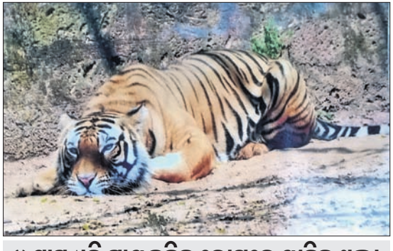
୪ ମାସ ଧରି ସ୍ୱାୟତ୍ତଚଳିତ ରୋଗରେ ପୀଡ଼ିତ ଥିଲା

ଆଇଓଏସ୍ରେ ପ୍ରୋଫାଇଲ୍ ଫଟୋ ସ୍ଥିନଶର୍ ଚଳୁ କରୁଥିବା ସ୍ୱାସ୍ଥ୍ୟାୟ ନୂଆଦିଲ୍ଲୀ, ୧୧:୫ ଆଇଓଏସ୍ରେ ପ୍ରୋଫାଇଲ୍ ଅପରେଟିଂ ସିଷ୍ଟମ ଥିବା ଫୋଟୋଗ୍ରାଫିକରେ ସ୍ୱାସ୍ଥ୍ୟାୟ ମୂର୍ଦ୍ଧ୍ୟ ପ୍ରୋଫାଇଲ୍ ଫଟୋର ସ୍ଥିନଶର୍ ନେଇପାରିବେ ନାହିଁ। ପୂର୍ବରୁ ଥିବା ଏହି ସ୍ୱିଚ୍ଚାୟୁ ସମ୍ପୂର୍ଣ୍ଣ ରୂପେ ବନ୍ଦ କରିବାକୁ ମେଡ଼ା ମାଲିକାନାରେ ଥିବା ସ୍ୱାସ୍ଥ୍ୟାୟ ପ୍ରଫୁଲ୍ଲି ଚଳାଇଛି। ତନ୍ମଧ୍ୟ- ବିନାଜନ୍ତପୋ ପକ୍ଷରୁ ଶନିବାର ଏ ସମ୍ପର୍କିତ ଏକ ତେମୋର ସ୍ଥିନଶର୍ ଶେୟାର କରାଯାଇଛି। ସ୍ୱାସ୍ଥ୍ୟାୟରେ ପ୍ରୋଫାଇଲ୍ ଫଟୋର ସ୍ଥିନଶର୍ ନେବାକୁ କେହି ଉଦ୍ୟମ କଲେ ସ୍ଥିନରେ ଏକ ମେସେଜ୍ ଦେଖିବାକୁ ମିଳିବ। 'ଆପଣଙ୍କ ପ୍ରୋଫାଇଲ୍ ଫଟୋ ସ୍ଥିନଶର୍' ରୁ କି ହୋଇପାରିବ ବୋଲି ଏଥିରେ ଉଲ୍ଲେଖ ରହିବ। ସମସ୍ତ ମୂର୍ଦ୍ଧ୍ୟଙ୍କୁ ପୁଷ୍ପା-୪