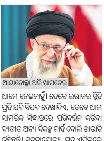
ଆୟାତୋଲା ଅଲି ଖାମେନେଇ

ତେହରାନ, ୧୨୫: ମଧ୍ୟପ୍ରାନ୍ତରେ ଉତ୍ତରଜମା ବଢ଼ିଥିବାବେଳେ ଇରାନର ପୂର୍ବତନ ବହିର୍ଦ୍ଧାପାର ମନ୍ତ୍ରୀ ସୟିଦ୍ କମଲ ଖାରାଜି ଇସ୍ଲାମକୁ ଆଣବିକ ବୋମାରେ ଆକ୍ରମଣ ଧମକ ଦେଇଛନ୍ତି। ଏବେ ଇରାନ ସୁପ୍ରିମ ଲିଡର ଆୟାତୋଲା ଅଲି ଖାମେନେଇଙ୍କ ଉପଦେଶ ଥିବା ଖାରାଜି କହିଛନ୍ତି, ଇସ୍ଲାମକୁ ପଛୁ ଇରାନ ପ୍ରତି ବିପଦ ଦେଖାଦେଲେ ଏହା ଆଣବିକ ନୀତିରେ ପରିବର୍ତ୍ତନ କରିବାକୁ ବାଧ୍ୟ ହେବ। ଆଣବିକ ବୋମା ପ୍ରସ୍ତୁତ କରିବାକୁ କୌଣସି ନିଷ୍ପତ୍ତି ନିକଟସ୍ଥ ଏକ ହାଲ-ଓଫେରେ ପରିଷ୍ଟା ଯାଉଥିବା କାର୍ତ୍ତିକ ଏକ ବସ ସହ ଧକ୍କା ହୋଇଥିଲା। କାରରେ ଥିବା ଅନ୍ୟ ୨