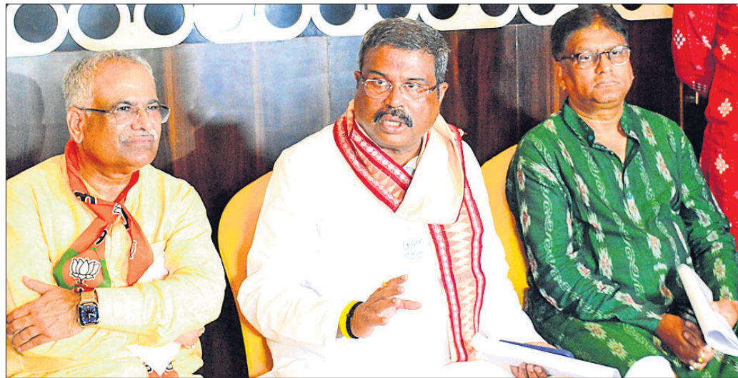
ରବିବାର ସମ୍ବଲପୁରରେ ଆୟୋଜିତ ଖବରଦାତା ସମ୍ମିଳନୀରେ କେନ୍ଦ୍ରମନ୍ତ୍ରୀ ତଥା ସମ୍ବଲପୁର ଲୋକ ସଭା ଭାଇପା ପ୍ରାର୍ଥୀ ଧର୍ମେନ୍ଦ୍ର ପ୍ରଧାନଙ୍କ ସହିତ ଭାଇପାର ଅନ୍ୟ ନେତୃବର୍ଗ

ପଞ୍ଚୁରିରେ ଥିବା ଶୁଆ ଭଳି ଯାହା ଶିଖାଯାଉଛି ମୁଖ୍ୟମନ୍ତ୍ରୀ ତାହା କହୁଛନ୍ତି। ତିଏମକେର ଭାଷା କହୁଛନ୍ତି ମୁଖ୍ୟମନ୍ତ୍ରୀ। ଓଡ଼ିଆ ଅର୍ଥାତ୍ କଥା ସେ କେମିତି ବୁଝିବେ। ଏ ସବୁକୁ ନେଇ ପ୍ରଶ୍ନ କଲେ ତାଙ୍କୁ କଷ୍ଟ ହେବା ସ୍ୱାଭାବିକ ବୋଲି କହିଛନ୍ତି କେନ୍ଦ୍ରମନ୍ତ୍ରୀ ତଥା ସମ୍ବଲପୁର ଲୋକ ସଭା ଭାଇପା ପ୍ରାର୍ଥୀ ଧର୍ମେନ୍ଦ୍ର ପ୍ରଧାନ। ରବିବାର ପୂର୍ବାହ୍ନରେ ବୁଢ଼ାଗଜାପୁର ଏକ ହୋଟେଲରେ ଆୟୋଜିତ ଖବରଦାତା ସମ୍ମିଳନୀରେ ଧର୍ମେନ୍ଦ୍ର ମୁଖ୍ୟମନ୍ତ୍ରୀ ନବୀନ ପଟ୍ଟନାୟକ ଏକ ଭିତ୍ତି ଓ ମାଧ୍ୟମରେ ପ୍ରଧାନମନ୍ତ୍ରୀଙ୍କୁ ପଚାରିଥିବା ପ୍ରଶ୍ନର ଉତ୍ତର ଦେଇଥିଲେ। ପ୍ରଧାନମନ୍ତ୍ରୀ ପଚାରିଥିବା ମୂଳ ପ୍ରଶ୍ନର ଉତ୍ତର ମୁଖ୍ୟମନ୍ତ୍ରୀଙ୍କୁ ଜଣାଅଛି କି ବୋଲି ସେ ପ୍ରଶ୍ନ କରିଥିଲେ। ସେ କହିଛନ୍ତି ମୁଖ୍ୟମନ୍ତ୍ରୀ ଅନେକ ବିଷୟରେ ଅବଗତ ନାହାନ୍ତି। ତାଙ୍କୁ ଦିଆଯାଉଥିବା ଲେଖାକୁ ପଢ଼ି ଭିତ୍ତି ଓ ମାଧ୍ୟମରେ କେବଳ ଉପପାଦନ କରୁଛନ୍ତି। ମୁଖ୍ୟମନ୍ତ୍ରୀଙ୍କୁ ୪ଟି ଅଣଓଡ଼ିଆ ଗ୍ୟାଙ୍ଗ୍ ଯେଉଁ ରହିଛନ୍ତି। ତେଣୁ ଓଡ଼ିଆ ଲୋକେ ମୁଖ୍ୟମନ୍ତ୍ରୀଙ୍କ ନ୍ୟାୟରୁ ବଞ୍ଚିତ ହେଉଛନ୍ତି ବୋଲି କହିଛନ୍ତି ଧର୍ମେନ୍ଦ୍ର। ୨୦୧୪ରେ ଓଡ଼ିଆ ଭାଷା ଶାସ୍ତ୍ରୀୟ ମାନ୍ୟତା ପାଇବା ପରେ ଶିକ୍ଷା ବିଭାଗର ସେଣ୍ଟ୍ରାଲ ଇନ୍‌ଷ୍ଟିଚ୍ୟୁଟ ଅଫ୍ ଇଣ୍ଡିଆନ ଲାଙ୍ଗୁଏଜ୍(ସିଆଇଆଇଏଏଲ୍) ରାଜ୍ୟ ସରକାରଙ୍କୁ ଖଣ୍ଡେ ଜମି ମାଗିଥିଲେ। ଏହାର ୫ବର୍ଷ ପରେ ରାଜ୍ୟ ସରକାର ଜମି ଦେବା ବଦଳରେ ଏକ ଘର ଦେଇଥିଲେ। ଉକ୍ତ ଘରେ ସେଣ୍ଟ୍ରାଲ ଅଫ୍ ଏକ୍ସଲେଣ୍ଟ ଫର୍ କ୍ଲାସିକାଲ୍ ଓଡ଼ିଆ ସେଣ୍ଟ୍ରାଲ ଗ୍ରାପନ କରାଗଲା। ଏହାବ୍ୟତୀତ ମୋଦି ସରକାରଙ୍କ ପକ୍ଷରୁ କେନ୍ଦ୍ରୀୟ ଭାରତୀୟ ଭାଷା ପ୍ରତିଷ୍ଠାନର ଭୁବନେଶ୍ୱରସ୍ଥିତ ପୂର୍ବାଞ୍ଚଳ ଆଞ୍ଚଳିକ ଭାଷା କେନ୍ଦ୍ରର ବିକାଶ ପାଇଁ ୩୦ କୋଟି