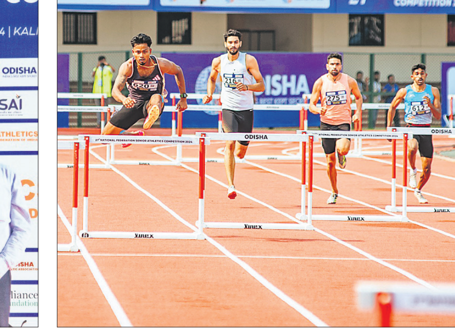
ପୁରୁଷ ୪୦୦ ମିଟର ହର୍ତ୍ତଳ ଅବସରରେ ପ୍ରତିଯୋଗୀମାନେ।