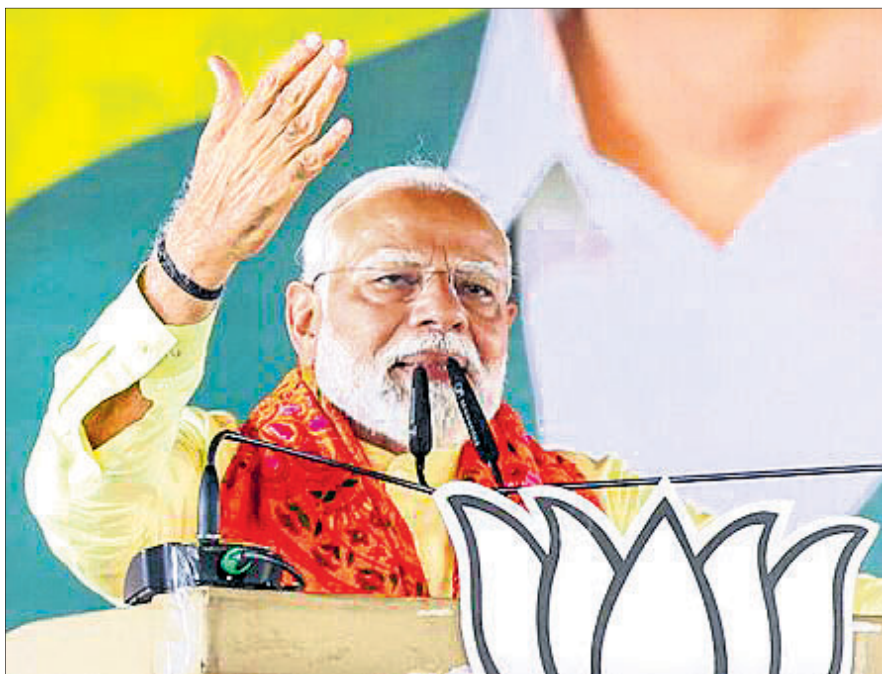
ପଶ୍ଚିମବଙ୍ଗର ହାତୀଗଞ୍ଜରେ ଭାଜପାଙ୍କ ଏକ ସଭାକୁ ସମ୍ବୋଧିତ କରୁଛନ୍ତି ପ୍ରଧାନମନ୍ତ୍ରୀ ନରେନ୍ଦ୍ର ମୋଦି।