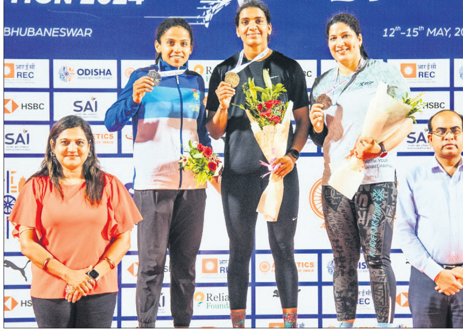
ମହିଳା କାଉଲିନ୍‌ ପ୍ରୋର ପଦକ ବିଜେତାକୁ ଅତିଥି ପୁରସ୍କୃତ କରୁଛନ୍ତି।