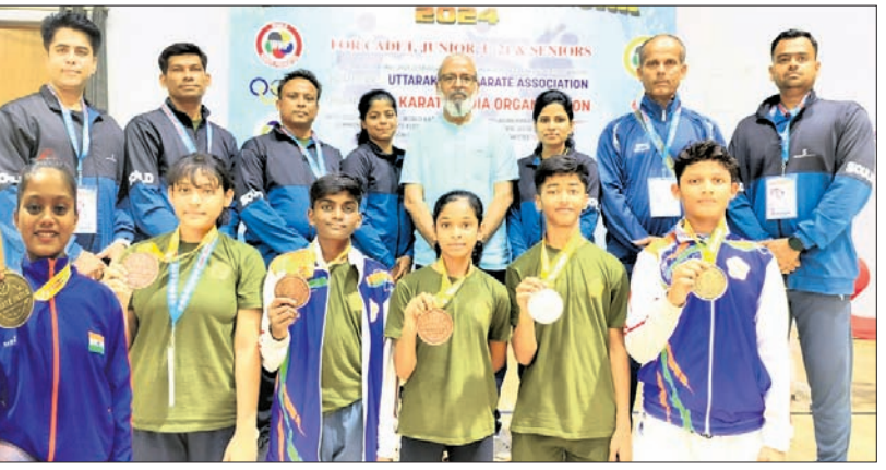
କର୍ମକର୍ମୀଙ୍କ ସହ ପଦକ ବିଜେତା ଓଡ଼ିଶା କ୍ରୀଡ଼ା କୋଚ୍‌ସମାଜରେ।