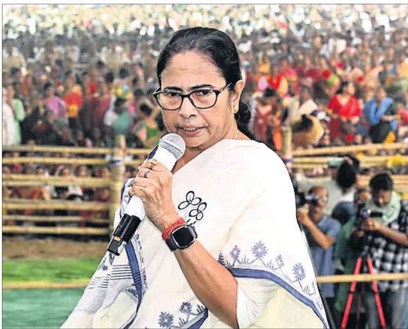
ପଶ୍ଚିମବଙ୍ଗ ମୁଖ୍ୟମନ୍ତ୍ରୀ ମମତା ବାନାର୍ଜୀଙ୍କ ଫାଇଲ ଫଟୋ।