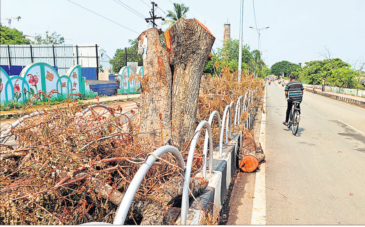
ରୌଦ୍ରପାପ ବୃଦ୍ଧି ପାଇଥିବାବେଳେ କଟକ ଯୋଡ଼ା ଟିଆରୋଡ଼ ଡିଭିଜନରେ ଥିବା ବଡ଼ବଡ଼ ଗଛକୁ କାଟି ଦିଆଯାଇଛି।

ଅଭିନେତା ରାଜକୂମାର ରାଓଙ୍କ ଅଭିନୀତ ଫିଲ୍ମ 'ଶ୍ରୀକାନ୍ତ' ବକ୍ସ ଅଫିସରେ ଭଲ ବ୍ୟବସାୟ କରିଛି। ଏଥିରେ ଦର୍ଶକ ତାଙ୍କ ଅଭିନୟକୁ ଖୁବ୍ ପସନ୍ଦ କରିଛନ୍ତି।