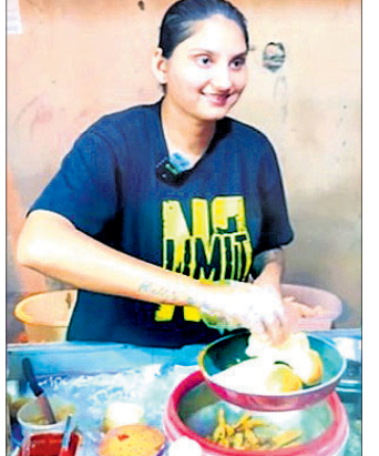
ପାକିସ୍ତାନର କରାଟା ସହରର କ୍ୟାଣ୍ଟିନେମେଣ୍ଟ ରେଳ ଷ୍ଟେସନ ନିକଟରେ ଏକ ଫୁଡ୍ ଷ୍ଟଲ୍ ରହିଛି, ଯାହା ଏକ ହିନ୍ଦୁ ପରିବାର ଦ୍ୱାରା ପରିଚାଳିତ ହେଉଛି।

କରାଟା: ଭାରତରେ ଅନେକ ପ୍ରକାରର ଖାଦ୍ୟ ମିଳିଥାଏ। ଲୋକମାନେ ନିଜ ଇଚ୍ଛା ଅନୁସାରେ ବିଭିନ୍ନ ହୋଟେଲ ଓ ରେଷ୍ଟୁରାଣ୍ଟରେ ଅନେକ ପ୍ରକାରର ସ୍ୱାଦିଷ୍ଟ ଖାଦ୍ୟ ଖାଇବାକୁ ପସନ୍ଦ କରୁଥାନ୍ତି। ଭାରତରେ ଏପରି ଅନେକ ଫୁଡ୍ ଷ୍ଟଲ୍ ରହିଛି, ଯେଉଁଠାରେ ବିଭିନ୍ନ ଦେଶର ଅନେକ ପ୍ରସିଦ୍ଧ ଖାଦ୍ୟ ଉପଲବ୍ଧ ରହିଥାଏ, ଯାହାର ମଜା ଭାରତୀୟମାନେ ନେଇଥାନ୍ତି। ଅନ୍ୟପକ୍ଷରେ ପାକିସ୍ତାନରେ ମଧ୍ୟ ଏକ ଭାରତୀୟ ଫୁଡ୍ ଷ୍ଟଲ୍ ବେଶ୍ ପ୍ରସିଦ୍ଧିଲାଭ କରିଛି। ଏହି ଫୁଡ୍ ଷ୍ଟଲ୍ରେ ମିଳୁଥିବା ଭାରତୀୟ ଖାଦ୍ୟକୁ ସ୍ଥାନୀୟ ଲୋକେ ବେଶ୍ ପସନ୍ଦ କରୁଥିବା ଜଣାପଡ଼ିଛି।