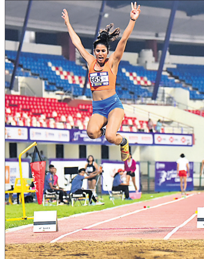
କଳିଙ୍ଗ ଷ୍ଟାଡ଼ିୟମରେ ସୋମବାର ଲଙ୍କାକମ୍ପ ଅବସରରେ ଜଣେ ମହିଳା ଆଥଲେଟ୍ ।