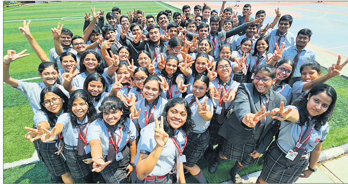
ସୋମବାର ବିବିଧତର ଦଶମ, ଦ୍ୱାଦଶ ପରୀକ୍ଷାପତ୍ର ପ୍ରକାଶ ପାଇବା ପରେ ଭୁବନେଶ୍ୱରସ୍ଥିତ ଓଡ଼ିଏମ୍ ସ୍କୁଲର ଛାତ୍ରାଛାତ୍ରୀମାନେ ଖୁସି ମନାଉଛନ୍ତି।