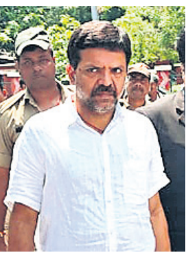
ସ୍ୱାଧୀନ ପ୍ରାର୍ଥା ପିଣ୍ଡ ଦାଣ୍ଡକୁ କୋର୍ଟ ଚାଲାଣ କରାଯାଇଛି ।

ଅନ୍ତର୍ଜାତୀୟ ଉତ୍ତର ଦକ୍ଷିଣ ପରିବହନ କରିତର (ଆଇଏନ୍ଏସ୍‌ପିସି) ପାଇଁ ଚାନ୍ଦିଆର ବନ୍ଦର ପ୍ରମୁଖ ହବ୍ ହେବାକୁ ଯାଉଛି, ଯାହା ଭାରତକୁ ଭାରତ ବେଳ ରୁକ୍ମିଆ ସହ ସଂଯୋଗ କରିବ । ଏହି ମଲ୍ଟି-ମୋଡ୍ ପରିବହନ ପ୍ରକଳ୍ପ ଦ୍ୱାରା ଭାରତକୁ ଭାରତ, ଆଫଗାନିସ୍ତାନ, ଆମେରିକା, ଆଜରବାଇଜାନ, ରୁକ୍ମିଆ, କେନ୍ଦ୍ରୀୟ ଏସିଆ ଏବଂ ୟୁରୋପକୁ ମାଲ୍ ପରିବହନ ହୋଇପାରିବ । ସୋମବାର ଇଣ୍ଡିଆନ ପୋର୍ଟ୍ସ ଟ୍ରଷ୍ଟ (ଆଇପିଟିଏଲ୍) ଏବଂ ଭାରତର ପୋର୍ଟ୍ ଆଣ୍ଡ ମେରିଟାଇମ୍ ଅର୍ଗାନାଇଜେସନ୍ ମଧ୍ୟରେ ରୁକ୍ମି ସ୍ୱାକ୍ଷର ହୋଇଥିଲା ।