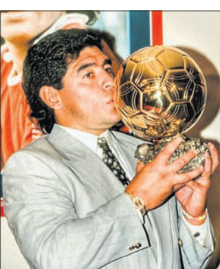
ଗୋଲ୍ଡେନ୍ ବଲ୍ ସହ ଡିଏଗୋ ମାରାଡୋନା

ଆର୍ଜେଣ୍ଟିନାର ପୁରୁଷ ଫୁଟବଲ୍ ଦଳର ଉପାଧିକାରୀ ଗୋଲ୍ଡେନ୍ ବଲ୍ ନିଲାମିଙ୍କୁ ରୋକିବା ପାଇଁ ପ୍ରୟାସ କରିଛନ୍ତି।