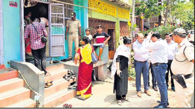
ମତଦାନ ସଂଗ୍ରହ କାର୍ଯ୍ୟ ତଦାରଖ କରୁଛନ୍ତି ନିର୍ବାଚନ ପର୍ଯ୍ୟବେକ୍ଷକ ଓ ଅନ୍ୟମାନେ।

ପର୍ଯ୍ୟନ୍ତ ପ୍ରଚାର ଖରା ଓ ଅସହ୍ୟ ବୁଲୁଥିବା ଯୋଗୁ ଅନେକ ଭୋଟର ମତଦାନ ପାଇ ଘରୁ ବାହାରିନଥିବା କେତେକଙ୍କ ସମାପକ ମତବ୍ୟକ୍ତ କରୁଛନ୍ତି। ଆଉ କେତେକଙ୍କ ମତରେ ଲାଗାମଛଡ଼ା ଦରବୁଦ୍ଧି ନିୟନ୍ତ୍ରଣରେ ଉଭୟ କେନ୍ଦ୍ର ଓ ରାଜ୍ୟ ସରକାର ବିଫଳ ଯୋଗୁ ଭୋଟର ବିମୁଖ ହୋଇଯାଇଥିବାରୁ ଗଣତନ୍ତ୍ର ମହାପର୍ବରେ ସାମିଲ ହୋଇନାହାନ୍ତି ବୋଲି କହିଛନ୍ତି।