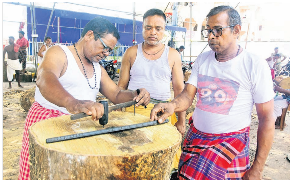
ପୁରୀ ରଥଖଳାରେ ଚକ ନିର୍ମାଣ ନିମନ୍ତେ ବୃକ୍ଷ କାଠରେ ମାପ ନେଉଛନ୍ତି ମହାରଣା ସେବକମାନେ ।