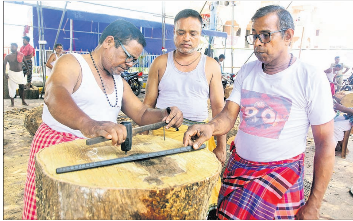
ପୁରୀ ରଥଖଳାରେ ଚକ ନିର୍ମାଣ ନିମନ୍ତେ ବୃକ୍ଷ କାଠରେ ମାପ ନେଉଛନ୍ତି ମହାରଣା ସେବକମାନେ ।