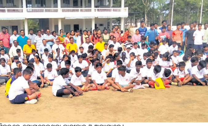
ଶିବରରେ ଯୋଗଦେଇଥିବା ଛାତ୍ରଛାତ୍ରୀ ଓ ଅନ୍ୟମାନେ।

ସାରାଦୀପ ବନ୍ଦର ଗ୍ରୀଷ୍ମକାଳୀନ ଖେଳକୁଳ ପ୍ରଣୟଣ ଉଦ୍‌ଯାପିତ