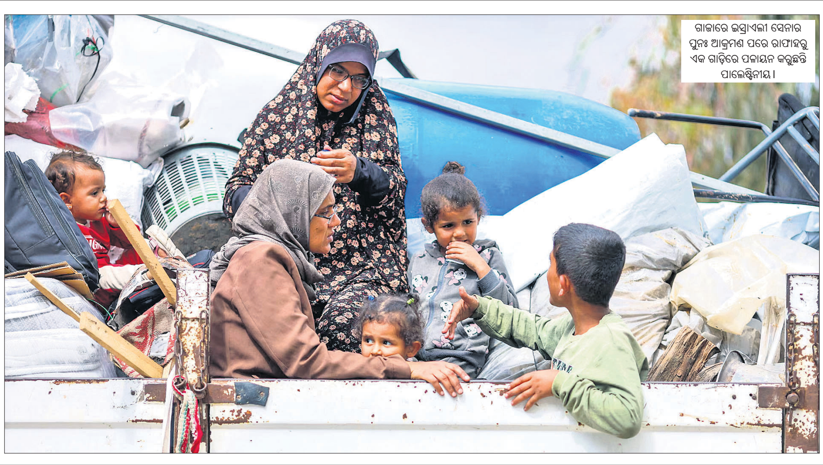
ଗାଡ଼ରେ ଲମ୍ବାଧିକ ସମୟ ପୁନଃ ଆକ୍ରମଣ ପରେ ରାମାହର ଏକ ଗାଡ଼ିରେ ପଲାଇନ କରୁଛନ୍ତି ପାଲେଷ୍ଟିନୀୟ।

ଆଇନଜୀବୀମାନେ ଖାଉଟି ସୁରକ୍ଷା ଆଇନ ପରିସରରେ ଆସୁନାହାନ୍ତି। ତେଣୁ ସେବା ପ୍ରଦାନରେ କମ୍ ହେଲେ, ସେଥିପାଇଁ ସେମାନଙ୍କ ବିରୋଧରେ ଖାଉଟି ଅଭିଯୋଗରେ ମୋକଦ୍ଦମା ଦାଏର କରାଯାଇପାରିବ ନାହିଁ ବୋଲି ସୁପ୍ରିମକୋର୍ଟ ମଙ୍ଗଳବାର କହିଛନ୍ତି।