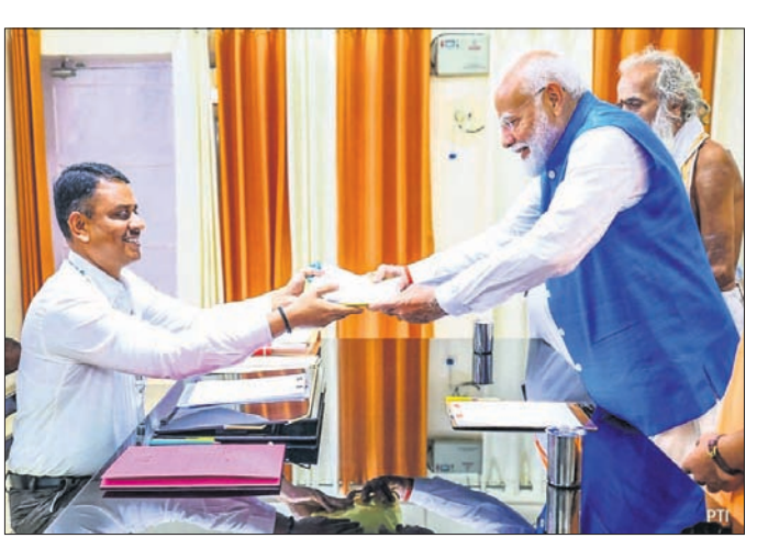
ବାରାଣସୀ ଜିଲ୍ଲାପାଳ ନିକଟରେ ନାମାଙ୍କନପତ୍ର ଦାଖଲ କରୁଛନ୍ତି ପ୍ରଧାନମନ୍ତ୍ରୀ ନରେନ୍ଦ୍ର ମୋଦି।

ପ୍ରଧାନମନ୍ତ୍ରୀ ନରେନ୍ଦ୍ର ମୋଦି ମଙ୍ଗଳବାର ବାରାଣସୀ ସଂସଦୀୟ ଆସନରୁ ନାମାଙ୍କନପତ୍ର ଦାଖଲ କରିଛନ୍ତି।