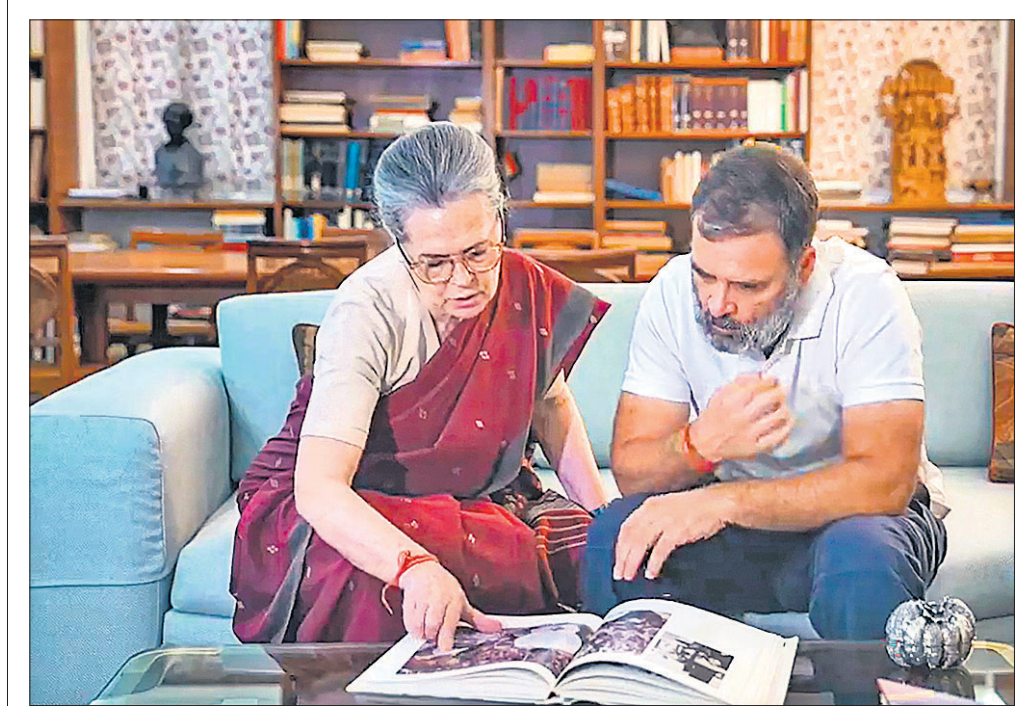
ଅମେଠି ଓ ରାୟବରେଲି ସଂସଦୀୟ ଆସନରେ ଗଣ୍ଡା ପରିବାରର ଅବଦାନ ସମ୍ପର୍କିତ ଆଲୋଚନା କଂଗ୍ରେସ ନେତ୍ରୀ ସୋନିଆ ଗାନ୍ଧୀ ଏବଂ ତାଙ୍କ ପୁଅ ରାହୁଲ ଗାନ୍ଧୀ ଦେଖୁଛନ୍ତି।

ଦିଲ୍ଲୀ ଅବକାରୀ ନୀତି ଦୁର୍ନୀତି ମାମଲାରେ ଆପ୍ ଆଦମା ପାର୍ଟି (ଆପ୍)କୁ ଅଭିଯୁକ୍ତ କରାଯିବ ବୋଲି ପ୍ରବର୍ତ୍ତନ ନିର୍ଦ୍ଦେଶାଳୟ (ଇତି) ମଙ୍ଗଳବାର ଦିଲ୍ଲୀ ହାଇକୋର୍ଟକୁ ଜଣାଇଛି।