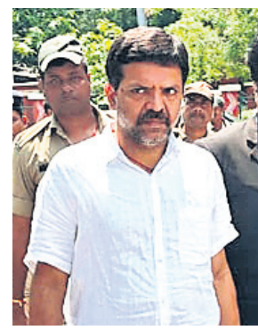
ସ୍ୱାଧୀନ ପ୍ରାର୍ଥା ପିଣ୍ଡ ଦାଣ୍ଡକୁ କୋର୍ଟ ଚାଲାଣ କରାଯାଇଛି ।

ଅନ୍ତର୍ଜାତୀୟ ଉତ୍ତର ଦକ୍ଷିଣ ପରିବହନ କ୍ଷେତ୍ରରେ (ଆଇଏନ୍ଏସ୍‌ପି) ପାଇଁ ଚାନ୍ଦିଆର ବନ୍ଦର ପୂର୍ଣ୍ଣ ହେବାକୁ ଯାଉଛି, ଯାହା ଭାରତକୁ ଭାରତୀୟ ବନ୍ଦର ରୁକ୍ମିଆ ସହ ସଂଯୋଗ କରିବ । ଏହି ମଲ୍ଟି-ମୋଡ୍ ପରିବହନ ପ୍ରକଳ୍ପ ଦ୍ୱାରା ଭାରତକୁ ଭାରତ, ଆଫଗାନିସ୍ତାନ, ଆମେରିକା, ଆଜରବାଇଜାନ, ଚୁଇଆ, କେନ୍ଦ୍ରୀୟ ଏସିଆ ଏବଂ ୟୁରୋପକୁ ମାଲ୍ ପରିବହନ ହୋଇପାରିବ । ସୋମବାର ଇଣ୍ଡିଆନ ପୋର୍ଟ୍ ଏବଂ ଇଭାନର ପୋର୍ଟ୍ ଆଣ୍ଡ ମେରିଟାଇମ୍ ଅର୍ଗାନାଇଜେସନ୍ ମଧ୍ୟରେ ରୁକ୍ମି ସ୍ୱାକ୍ଷର ହୋଇଥିଲା ।