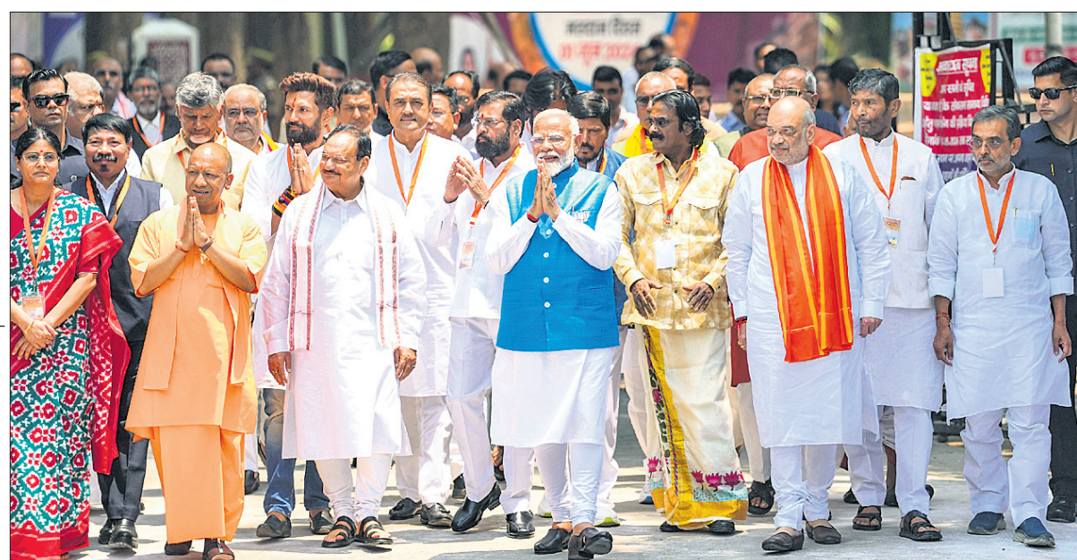
ପ୍ରଧାନମନ୍ତ୍ରୀ ନରେନ୍ଦ୍ର ମୋଦି ମଙ୍ଗଳବାର ଭବନପୁରରେ ବାରାଣସୀ ଲୋକ ସଭା ଆସନ ପାଇଁ ନାମାଙ୍କନପତ୍ର ଦାଖଲ କରିବାକୁ ଯିବାବେଳେ ଚାକ ସହ ଭିକ୍ଷୁକ ସ୍ୱରାଷ୍ଟ୍ରମନ୍ତ୍ରୀ ଅମିତ୍ ଶାହା, ଭବନପୁରରେ ପୁଞ୍ଜିପ୍ରାପ୍ତ ସୋନା ଆଦିତ୍ୟନାଥ, ରାଜ୍ୟ ରାଷ୍ଟ୍ରମନ୍ତ୍ରୀ ଅଧ୍ୟକ୍ଷ ଜେ.ପି. ନନ୍ଦା ଏବଂ ଏନ୍‌ଡିଏ ବଳଗୁଡ଼ିକର ପ୍ରମୁଖ ନେତାମାନେ। (ବିପୋର୍ଟ କାହାଣୀ/ଅନ୍ତର୍ଜାତୀୟ ପୃଷ୍ଠାରେ)