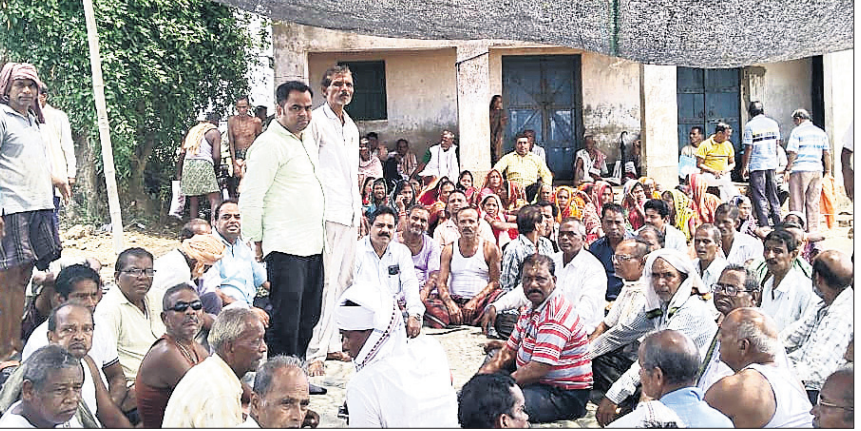
ମା' ବରୁଣେଇ କୃଷକ ଏକତା ମଞ୍ଚର ସଦସ୍ୟମାନେ ତ୍ରିଲୋଚନପୁରରେ ପ୍ରତିବାଦ ସଭା କରୁଛନ୍ତି।

କୁଜଙ୍ଗ, ୧୫ମେ (ମନୋଜ ପ୍ରଧାନ): କୁଜଙ୍ଗ ତହସିଲ ଅନ୍ତର୍ଗତ ପଟେପୁର, ଗଣକପୁର ଅଞ୍ଚଳରେ ଲେସ୍‌ସ୍‌ଡେଭଲ୍ମେଣ୍ଟ କମ୍ପାନୀ ପକ୍ଷରୁ ବିଚ୍ଛାଯାଉଥିବା ପାଇପ ଲାଇନ କାର୍ଯ୍ୟକୁ ମଙ୍ଗଳବାର ବିରୋଧ କରାଯାଇଛି।