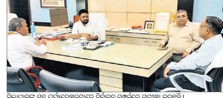
ଜିଲ୍ଲାପାଳଙ୍କ ସହ ପର୍ଯ୍ୟବେକ୍ଷକମାନେ ନିର୍ବାଚନ ସମ୍ପର୍କରେ ସମୀକ୍ଷା କରୁଛନ୍ତି।

ଜଗତସିଂହପୁର ଜିଲ୍ଲାରେ ୨୦୨୪ ସାଧାରଣ ନିର୍ବାଚନକୁ ଅବାଧ, ନିରପେକ୍ଷ ଓ ସ୍ୱଚ୍ଛତାର ସହ ସମ୍ପାଦନ କରିବା ପାଇଁ ୩ ଜଣ ପର୍ଯ୍ୟବେକ୍ଷକ ନିଯୁକ୍ତ ହୋଇଛନ୍ତି।