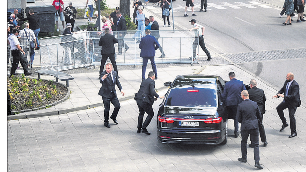
ସ୍ୱୋଭାକିଆର ପ୍ରଧାନମନ୍ତ୍ରୀ ରବର୍ଟ ପିକୋଙ୍କୁ ଆତତାୟୀକ ଭୁଲିମାଡ଼ ପରେ ସୁରକ୍ଷା ଅଧିକାରୀମାନେ ତାଙ୍କ କାରୁକୁ କର୍ତ୍ତନ କରି ନେଉଛନ୍ତି।

ସ୍ୱେଡୋପାୟ ପାର୍ଲିମେଣ୍ଟ ନିର୍ବାଚନକୁ ୩ ସପ୍ତାହ ବାକି ଥିବାବେଳେ ରୁସ୍‌ବାର ସ୍ୱୋଭାକିଆର ପ୍ରଧାନମନ୍ତ୍ରୀ ରବର୍ଟ ପିକୋଙ୍କୁ ହତ୍ୟା ଉଦ୍ୟମ ହୋଇଛି।