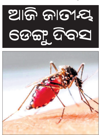
ଅବଗତ ହେବା ନିହାତି ଦରକାର। ଡେଙ୍ଗୁ କରାଯାଏ ତେବେ ତାହା କି ଆକାର ଧାରଣକରେ ସେନେଇ ଅନେକ ନିର୍ଦ୍ଦିଷ୍ଟ ରହିଛି।

ଆମେ ସମ୍ପୂର୍ଣ୍ଣ ହେଉଥିବା ସ୍ୱାସ୍ଥ୍ୟ ସମସ୍ୟାରୁ ମଧ୍ୟରେ ଡେଙ୍ଗୁ ଅନ୍ୟତମ। ଏଥିରୁ ମଣି ହେଉଛି ଏହାର ବାହକ। ପ୍ରାରମ୍ଭରୁ ଡେଙ୍ଗୁର ଚିକିତ୍ସା କରା ନ ଗଲେ ପରବର୍ତ୍ତୀ ସମୟରେ ତାହା ଗୁରୁତର ଆକାର ଧାରଣ କରିବା ସହ ଅକାଳ ମୃତ୍ୟୁକୁ ଡାକିଆଣିଥାଏ।