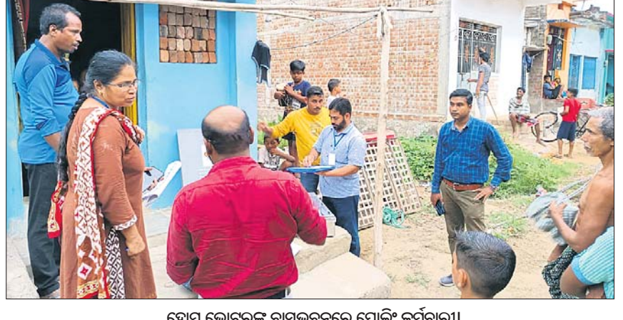
ହୋମ ଭୋଟିଂର ବାସକରଣରେ ପୋଲିଂ କର୍ମଚାରୀ

ଆସିବା ୧୫୦୫ (ପୁରୋଧ ନାଥ ସାହୁ) ଆସିବା ଲୋକ ସଭା ଓ ବିଧାନସଭା ଆସନ ଲାଗି ଆସିବା ୨୦ ତାରିଖରେ ଭୋଟ ହେବ। ଏହା ପୂର୍ବରୁ ୮୫୫୫ ରୁ ଉର୍ଦ୍ଧ୍ୱ ବୟସ ଓ ଶତ ପ୍ରତିଶତ ବିଦ୍ୟାଳୟ ହୋମ ଭୋଟିଂ ହୋଇଛି।