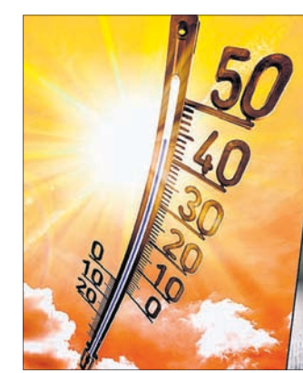
ମୃତ୍ୟୁର ୧% ମୃତ୍ୟୁ ହିନ୍ଦୁସ୍ତାନ ପ୍ରଭାବରେ ହେଉଥିବା ଏହି ଅଧ୍ୟୟନ କହିଛି। ପ୍ରତିବର୍ଷ ଗ୍ରୀଷ୍ମଋତୁରେ ହିନ୍ଦୁସ୍ତାନ କାରଣରୁ ୧.୫୩ ଲକ୍ଷରୁ ଅଧିକ ବ୍ୟକ୍ତି ପ୍ରାଣ ହରାଉଥିବାବେଳେ ସମୁଦାୟ ମୃତ୍ୟୁର ପ୍ରାୟ ୧୫% ସଂଖ୍ୟା ହିନ୍ଦୁସ୍ତାନରେ ଘଟୁଛି।

ବିଶ୍ୱରେ ପ୍ରତି ବର୍ଷ ପ୍ରାୟ ୧.୫୩ ଲକ୍ଷ ହରାଉଛନ୍ତି ୧.୫୩ ଲକ୍ଷ କାନୁବେରା, ୧୫।୫ ପ୍ରଚଣ୍ଡ ଗ୍ରୀଷ୍ମ ପ୍ରବାହ ଯୋଗୁ ବିଶ୍ୱରେ ପ୍ରତି ବର୍ଷ ୧.୫୩ ଲକ୍ଷରୁ ଅଧିକ ବ୍ୟକ୍ତି ପ୍ରାଣ ହରାଉଛନ୍ତି। ସେଥିମଧ୍ୟରୁ ସର୍ବାଧିକ ମୃତ୍ୟୁ ଭାରତରେ ହେଉଥିବା ନେଇ ଅଣ୍ଟୋଲିଆର ମୋନାଖ ବିଶ୍ୱବିଦ୍ୟାଳୟ ପକ୍ଷରୁ କରାଯାଇଥିବା ଏକ ଅଧ୍ୟୟନରୁ ଜଣା ପଡ଼ିଛି।