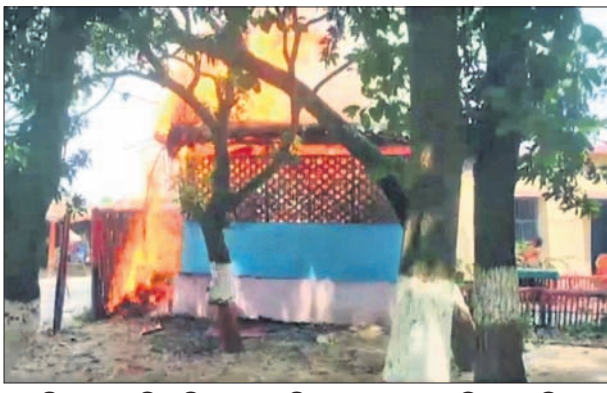
ବିହାର ଅରାରିଆ ଜିଲ୍ଲା ତାରାବାଡ଼ି ଆନାକୁ ଲୋକେ ଜଳି ଦେଇଛନ୍ତି।

ପାଟଣା, ୧୮।୫ ବିହାର ଅରାରିଆରେ ଜଣେ ବ୍ୟକ୍ତି ଓ ତାଙ୍କ 'ନାବାଳିକା' ସ୍ତ୍ରୀଙ୍କ ହାଜତମୃତ୍ୟୁ ପରେ ସମଗ୍ର ଅଞ୍ଚଳ ଅଶାନ୍ତ ହୋଇପଡ଼ିଛି। ମହିଳାଙ୍କ ବୟସ ୧୮ ହୋଇ ନ ଥିବା ଦର୍ଶାଇ ପୋଲିସ ଉଭୟଙ୍କୁ ବିବାହର ୨ ଦିନ ପରେ ତାରାବାଡ଼ି ଆନାକୁ ନେଇଥିଲା। ଗୁରୁବାର ଅପରାହ୍ଣରେ ଆନା ହାଜତରୁ ଦୁହିଙ୍କ ମୃତଦେହ ଠାବ ହୋଇଥିଲା। ତେବେ ପୋଲିସ ମାଡ଼ରେ ଦମ୍ପତିଙ୍କ ମୃତ୍ୟୁ ଘଟିଥିବା