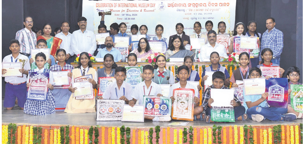
ଓଡ଼ିଶା ରାଜ୍ୟ ଜନଜାତି ସଂଗ୍ରହାଳୟରେ ଶିକ୍ଷା ଅର୍ଜନ ପାଇଁ ସଂଗ୍ରହାଳୟ ବିକସ ପାଇନ ଅବସରରେ ଅତିଥିକ ସହ ଚିତ୍ରକଳା ଶିବିରରେ ଯୋଗଦେଇଥିବା ଛାତ୍ରାଛାତ୍ରୀମାନେ।