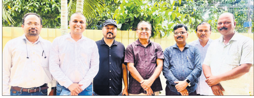
ନବଗଠିତ ପ୍ରକାଶକ ସଂଘର କର୍ମକର୍ମୀମାନେ ।