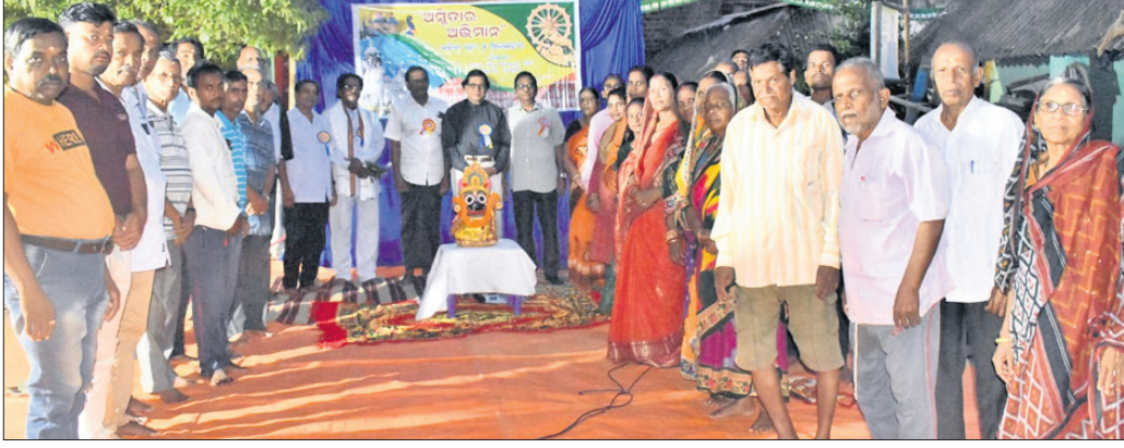
ଆଲୋଚନାଚକ୍ରରେ ଉପସ୍ଥିତ ଅତିଥି ଏବଂ ଅନ୍ୟମାନେ।