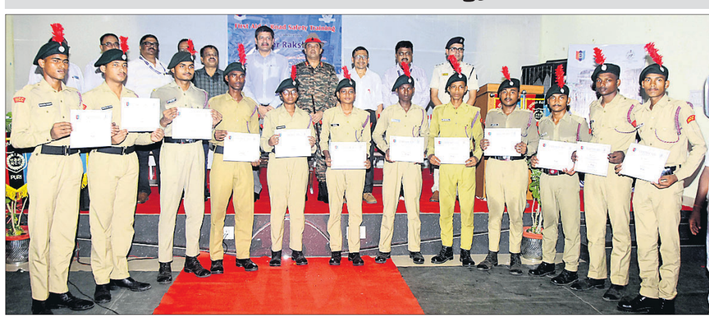
କାର୍ଯ୍ୟକ୍ରମରେ ଅତିଥିକ ଗହଣରେ ସାର୍ବିପିକେଟ୍ ପାଇଥିବା ପ୍ରଶିକ୍ଷିତ କ୍ୟାଡେଟମାନେ।

ଘଣ୍ଟା ଗୁରୁତ୍ୱପୂର୍ଣ୍ଣ। ଏହି ସମୟ ମଧ୍ୟରେ ଦୁର୍ଘଟଣାଗ୍ରସ୍ତଙ୍କୁ କିଭଳି ପ୍ରାଥମିକ ଚିକିତ୍ସା ପ୍ରଦାନ କରିହେବ ଓ ତୁରନ୍ତ ହସ୍ପିଟାଲ ପହଞ୍ଚାଯାଇପାରିବ ସେ ଦିଗରେ ପ୍ରଶିକ୍ଷଣ ଦିଆଯାଇଥିଲା। ଜୁନିୟର ରକ୍ଷକମାନେ ସଡ଼କ ସୁରକ୍ଷାର ଦାୟିତ୍ୱ ନିର୍ବାହ କରିବେ। ସେମାନେ ନିଜେ ସମସ୍ତ ନିୟମ ମାନିବା ସହ ନିଜ ପରିବାର, ଆଖିପାଖି ଲୋକ, ସାହିପଡ଼ିଶାରେ