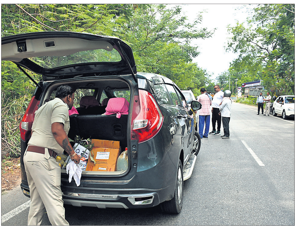
ଆସକ୍ଷା ୨୦ ତାରିଖରେ ରାଜ୍ୟରେ ୨ୟ ପର୍ଯ୍ୟାୟ ନିର୍ବାଚନ ହେବାକୁ ଥିବାବେଳେ ଶନିବାର ଗଞ୍ଜାମ ଜିଲ୍ଲା ସୋରଡ଼଼ାରେ ଜରତ ଛକ ନିକଟରେ ପୋଲିସ ଗାଡ଼ି ଯାଞ୍ଚ ଚଳାଇଛି।