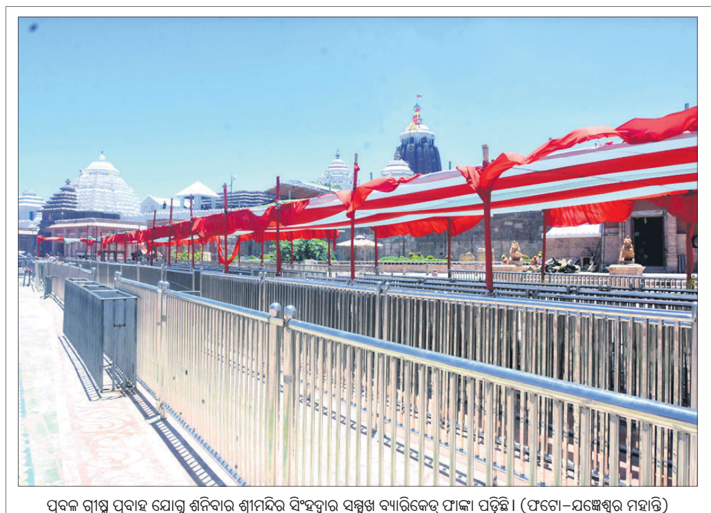
ପ୍ରବଳ ଗ୍ରୀଷ୍ମ ପ୍ରବାହ ଯୋଗୁ ଶନିବାର ଶ୍ରୀମନ୍ଦିର ସିଂହଦ୍ୱାର ସମ୍ମୁଖ ବ୍ୟାରିକେଡ୍ ଫାଙ୍କା ପଡ଼ିଛି।