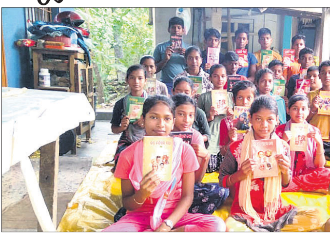
ପିଲାମାନଙ୍କୁ ବହି ପଢ଼ିବା ଲାଗି ସଚେତନ କରାଯାଇଛି।

ବାହାନଗା, ୨୦୧୫(ଅରୁପ କୁମାର ଦାସ ) ବିଦ୍ୟାର୍ଥୀମାନଙ୍କୁ ମୋବାଇଲଠାରୁ ଦୂରେଇ ରଖିବା ଲାଗି ବାଲେଶ୍ୱର ଜିଲ୍ଲା ବାହାନଗା ବ୍ଲକ୍ ବସିପଦା ପଞ୍ଚାୟତ ମନ୍ଦନାପୁର ଶୁକଳପୁର ବେଞ୍ଚ ଓପଦା ପୋଲିସ୍ ଠାକୁର ଦେଖିଥିଲେ। ପୋଲିସ୍ ସାକ୍ଷିପୈକ୍ ଚିମ୍ ସହିତ ରେଞ୍ଜର ମନୋରଞ୍ଜନ ନାୟକ ଏବଂ ମାଲିକ୍ଷେଟ ଭାବେ ଓପଦା ତହସିଲଦାର ମିତାଳି ମଧୁ ଛନ୍ଦା ପାତ୍ରଙ୍କ ଉପସ୍ଥିତିରେ ଶବ ଉଦ୍ଧାର କରାଯାଇଛି। ପୋଲିସ୍ ପକ୍ଷରୁ ଏକ ପ୍ରମାଣ ପାମଲ। ରୁଜୁ କରାଯାଇ ଶବ ବ୍ୟବଚ୍ଛେଦ ପାଇଁ ପଠାଯାଇଛି। କାହୁଁ ଶାଗ ଦେଲିବା ପାଇଁ ଯାଇଥିବା ବେଳେ ହାତୀ ମାରିଦେଇଥିବା ତାଙ୍କ ସ୍ତ୍ରୀ ଶୁକ ସିଂ ଅଭିଯୋଗ କରିଛନ୍ତି। ଶବ ବ୍ୟବଚ୍ଛେଦ ରିପୋର୍ଟ ସହ ତଦନ୍ତ ପରେ ମୃତ୍ୟୁର କାରଣ ଜଣାପଡ଼ିବ ବୋଲି କୁହାଯାଇଛି।