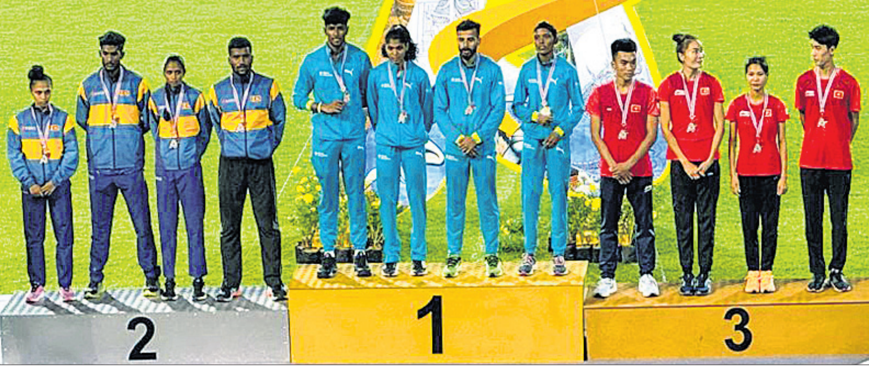
ପୋଡିୟମରେ ସିଆନ ରିଲେ ଚାମ୍ପିୟନଶିପ୍‌ର ସ୍ୱର୍ଣ୍ଣ ପଦକ ବିଜୟୀ ଭାରତୀୟ ମିଳିତ ଟିମ୍ (ମଝି)।

ଭାରତର ମିଳିତ ୪୪୪୦୦ ରିଲେ ଟିମ୍ ଏଠାରେ ସିଆନ ରିଲେ ଚାମ୍ପିୟନଶିପ୍‌ର ଉଦ୍‌ଘାଟନା ସଂସ୍କରଣରେ ଭାଗ୍ୟ ରେକର୍ଡ ଗାଇଁ ସହ ସ୍ୱର୍ଣ୍ଣ ପଦକ ହାସଲ କରିଛି। ତେବେ ଏହି ଟିମ୍ ପ୍ୟାରିସ ଅଲିମ୍ପିକ୍ସ କ୍ୱାଲିଫିକେଶନ ଅଫ ହାସଲ କୋଷ୍ଠା ଶ୍ରୀ ଦାଣ୍ଡି, ଅମୋଗ ଜାକବ ଓ ଶୁଭା ଭେକ୍‌ଟେଶନ ୩ ମିନିଟ ୧୪.୧୨ ସେକେଣ୍ଡ ଗାଇଁ ରେକର୍ଡ ଗଢ଼ିଥିଲେ। ପୂର୍ବରୁ ଗତବର୍ଷ ସିଆନ ଗେମ୍‌ରେ ଭାରତୀୟ ଦଳ ୩:୧୪.୩୪ ଭାଗ୍ୟ ରେକର୍ଡ ଗାଇଁ ସହ ହାଲ୍‌ଫେ ସିଆନ ଗେମ୍‌ରେ ରୌପ୍ୟ ଜିତିଥିଲା। ଏଥିରେ ଶ୍ରୀଲକ୍ଷ୍ମୀ (୩:୧୭.୦୦) ଦ୍ୱିତୀୟ ସ୍ଥାନ ଅଧିକାର କରିଥିବା ବେଳେ ଭିଏତନାମ (୩:୧୮.୪୫) ତୃତୀୟ ହୋଇଥିଲା। ରିଲେର ୪ଟି ଯାକ ଲେଗ୍‌ରେ ଭାରତ ଆଗରେ ରହିଥିଲା। ସୋମବାର ଗାଇଁ ରେକର୍ଡ ରୁ ପ୍ୟାରିସ ଲିଷ୍ଟ ଅଫ୍ ଫ୍ଲାଲ୍ଡ ଆଥଲେଟିକ୍ସ ଚାଲିକାରେ ଭାରତକୁ ୨୧ତମ ସ୍ଥାନ ମିଳିଛି। ମାତ୍ର ପ୍ୟାରିସ ଟିକେଟ ହାସଲ ପାଇଁ ଭାରତୀୟ ଦଳକୁ ୧୫ତମ କିମ୍ବା ୧୬ତମ ସ୍ଥାନ ଆବଶ୍ୟକ ପଡୁଥିଲା।