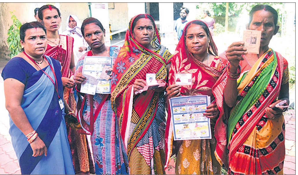
ଝାରସୁଗୁଡ଼ା ବିଧାନସଭା କ୍ଷେତ୍ର ଏକାଡାଲିର ୫୬ ଓ ୫୭ ନଂ. ରୁଥିରେ ମିହିକା ଭୋଟର।

ଓ ଶିଶୁ ଦିନକୁ ଦିନ ତଳକୁ ଯାଉଛି। କେବଳ ବିକାଶ ବୋଲି ପ୍ରଚାର ହେଉଛି। ସାଧାରଣ ଲୋକେ ଦରଦାମ୍ ବୃଦ୍ଧି ନେଇ ବଡ଼ ସମସ୍ୟାରେ ପଡ଼ିଛନ୍ତି। ତେଣୁ ଉଭୟ ରାଜ୍ୟ ଓ କେନ୍ଦ୍ରରେ ସରକାର ପରିବର୍ତ୍ତନ ହେବା ଦରକାର। ସେଥିପାଇଁ ଆମେ ଆମର ଭୋଟ ଏସବୁକୁ ଲକ୍ଷ୍ୟକରି ଦେଇଛୁ ବୋଲି ସେମାନେ କହିଛନ୍ତି। ମଧ୍ୟାହ୍ନରେ ପ୍ରବଳ ଗରମ ଯୋଗୁ ମତଦାନ କେନ୍ଦ୍ରରେ ଗହଳି କମ୍ ରହିଥିଲା। ଅପରାହ୍ଣ ୪ଟାରେ ପୁଣି ଲୋକେ ଧାଡ଼ିରେ ଠିଆହୋଇ ଭୋଟ ଦେଇଥିବା ଦେଖିବାକୁ ମିଳିଥିଲା। ତେବେ ନିର୍ବାଚନ କମିଶନଙ୍କ ସୂଚନାମୁତାୟୀ, ଝାରସୁଗୁଡ଼ାରେ ସକାଳ ୯ଟା ସୁଦ୍ଧା ୯.୯୮% ଏବଂ ବ୍ରଜରାଜନଗରରେ ୯.୭୩% ମତଦାନ ହୋଇଥିବା ବେଳେ ପ୍ରାର୍ଥୀଙ୍କ ୧୧ଟା ସୁଦ୍ଧା ଏହା ଯଥାକ୍ରମେ ୨୫.୧୩% ଓ ୨୫.୫୨% ହୋଇଥିଲା। ତେବେ ପରବର୍ତ୍ତୀ ସମୟରେ ସନ୍ଧ୍ୟା ୫ଟା ସୁଦ୍ଧା ମତଦାନ ୬୦% ଉପରକୁ ଚାଲିଯାଇଥିଲା। ଆମେ ବିଭିନ୍ନ ନିର୍ବାଚନମଣ୍ଡଳ ରୁଲି ଭୋଟରଙ୍କ ମତ ନେବା ପରେ ଏଥିରୁ ଗୋଟିଏ କଥା ସ୍ପଷ୍ଟ ହେଉଛି ଯେ, ଉଭୟ ବିଜେଡି ଏବଂ ଭାଜପା ମଧ୍ୟରେ ଅଧିକାଂଶ ସ୍ଥାନରେ କଡ଼ା ପ୍ରତିଦ୍ୱନ୍ଦ୍ୱିତା ହେଉଛି। ତେବେ ଆସନ୍ତା ଜୁନ ୪ରେ କେଉଁ ଦଳ ଭୋଟରମାନଙ୍କୁ ନିଜ ସପକ୍ଷରେ ନେବାରେ ସଫଳ ହୋଇଛି ତାହା ସ୍ପଷ୍ଟ ହୋଇଯିବ।