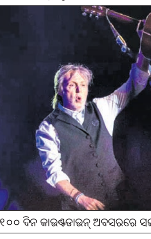
୧୦୦ ଦିନ କାର୍ଯ୍ୟକ୍ରମ ଅବସରରେ ସଙ୍ଗୀତ ପରିବେଷଣ କରୁଛନ୍ତି ପଲ୍ ମ୍ୟାକେର୍ଟନି।

ଭିଡିଓ କ୍ୟାମ୍ପେନ୍ କଞ୍ଚ କରାଯାଇଛି। ୩ ପାରା ଆଥଲେଟ୍ ଏକ ସ୍ୱାଡିୟମ ପାରାଲିମ୍ପିକ୍ସରେ ସାମିଲ ହେବେ ତାହା ଲକ୍ଷ୍ୟ କରାଯାଇଛି। ଏହି କ୍ୟାମ୍ପେନ୍‌ରେ ଲକ୍ଷ କମ୍ପ ଓ ଟ୍ରିପଲ କମ୍ପ ଆଥଲେଟ୍ ଆନାଉଟ ଆସୋମାନି, ବୁଲକ୍ ଚେୟାର ଟେନିସ୍ ଖେଳାଳି ପଲିନ୍ ଡେଭୋଲିଡ ଓ ଦୁଷ୍ପଦାଧିତ ପୁଟବଲ ଖେଳାଳି ରୋଲ୍ ରିଭିଏରଙ୍କୁ ଦେଖିବାକୁ ମିଳିଥିଲା। ପାରାଲିମ୍ପିକ୍ସ ପାଇଁ ୨୮ ଲକ୍ଷ ଟିକେଟ୍ ବିକ୍ରିର ଲକ୍ଷ୍ୟ ରହିଥିବା ବେଳେ ବର୍ତ୍ତମାନ ପୂର୍ଣ୍ଣ ୯ ଲକ୍ଷ ଟିକେଟ୍ ବିକ୍ରି ସରିଲାଣି। ଟିକେଟ୍‌ର ମୂଲ୍ୟ ୧୫ ଡଲାରରୁ ଆରମ୍ଭ ହୋଇ ସର୍ବାଧିକ ୪୯ ଡଲାର ଯାଏ ରହିବ। ଗାୟକ ପଲ୍ ମ୍ୟାକେର୍ଟନି ୧୦୦ ଦିନ କାର୍ଯ୍ୟକ୍ରମ ଅବସରରେ ଓ ଅଲ୍ ଷ୍ଟାଫ୍ ରୁଗେବର ଗୀତ ଗାଇଥିଲେ।