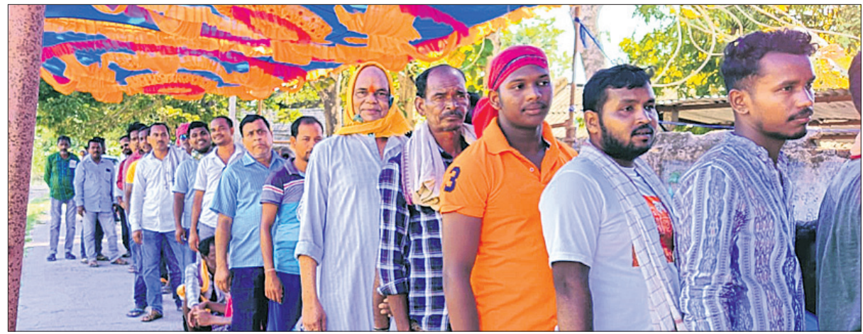
ପୁରୁଷ ଭୋଟରମାନେ ଭୋଟ ଦେବାକୁ ଆସି ଲମ୍ପା ଲାଭନରେ ।

ବୌଦ୍ଧ/କର୍ମାନ୍ତରାଳ, ୨୩।୫ (ଅଜିତ କୁମାର ବାରିକ/ ଆବିଷେଷ ନିମ୍ନ) ବୌଦ୍ଧ ଜିଲ୍ଲା କର୍ମାନ୍ତରାଳ ବିଧାନସଭା ନିର୍ବାଚନମଣ୍ଡଳର ରଜ୍ଜା (ବହ୍ୟା) ପଞ୍ଚାୟତ ଅଧୀନ କିରାସିରା ଓ ମହେଶ୍ୱରପିଣ୍ଡା ବ୍ଲକ୍ରେ ଗତ ୨୦ ତାରିଖରେ ଭୋଟ ଗ୍ରହଣ ବେଳେ ଅନିୟମିତତା ହୋଇଥିବା ବେଳେ ଅଭିଯୋଗ ପରେ ଗୁରୁବାର ଦିନ ଉକ୍ତ ବ୍ଲକ୍ ବ୍ଲକ୍ରେ ସାନି ମତଦାନ ଶାନ୍ତିପୂର୍ଣ୍ଣ ଭାବେ ଶେଷ ହୋଇଛି ।