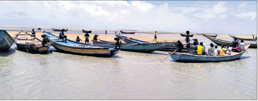
ଭୋଗରାଇ, ୨୩।୫(ପ୍ରବାପ ଦାସ)

କେନ୍ଦ୍ରୀୟ ବଙ୍ଗୋପସାଗରରେ ସୂକ୍ଷ୍ମ ଲହରୀ ପଦ୍ମାବତୀର ଅବପାତରେ ପରିଣତ ହେଉଥିବା ପାଣିପାଗ କାର୍ଯ୍ୟକ୍ରମ ପକ୍ଷରୁ ସୂଚନା ମିଳିଛି । ଏହି ଗଭୀର ଅବପାତ ଅଧିକ ଶକ୍ତିଶାଳୀ ହୋଇ ବନ ଗୋଟାଉଥିବା ବେଳେ ପୂର୍ଣ୍ଣିମା ତିଥିରେ ସମୁଦ୍ର ଗୁରୁବାରଠାରୁ ଅଶାନ୍ତ ହୋଇଛି ।