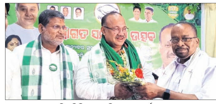
ବିଜେଡି ଜିଲ୍ଲା ସଭାପତିଙ୍କୁ ସ୍ୱାଗତ ସମ୍ବର୍ଦ୍ଧନା ।