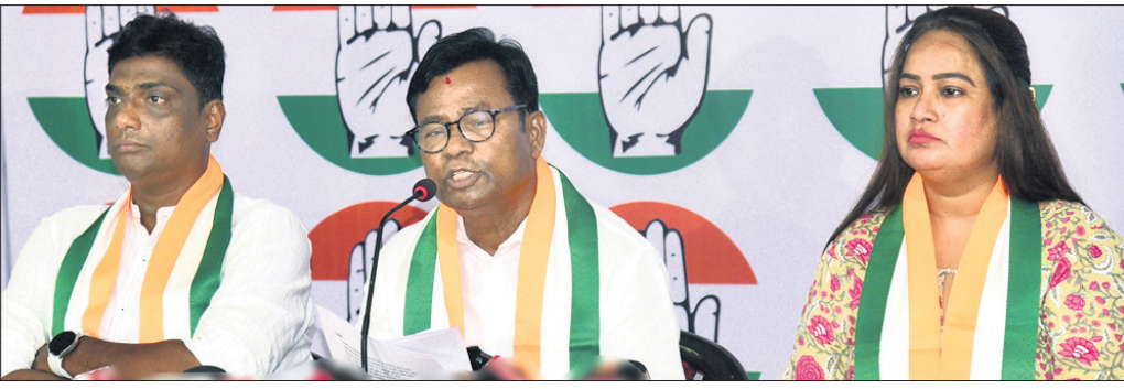
କଂଗ୍ରେସ ଭବନରେ ଅନୁଷ୍ଠିତ ଖବରଦାତା ସମ୍ମିଳନୀରେ କଂଗ୍ରେସ ନେତୃବୃନ୍ଦ।

ଭୁବନେଶ୍ୱର, ୨୩୫ (ଶର୍ମିଷ୍ଠା ପାଣିଗ୍ରାହୀ) ରାଜ୍ୟରେ ୨୪ ବର୍ଷର ନବୀନ ସରକାର ଓ କେନ୍ଦ୍ରରେ ୧୦ ବର୍ଷର ମୋଦି ସରକାର ରାଜ୍ୟର ମଧ୍ୟବିଭା, ନିମ୍ନ ମଧ୍ୟବିଭା ଓ ଗରିବ ଲୋକଙ୍କ ସାମାଜିକ ଦୁର୍ଦ୍ଦଶାର କାରଣ ସାଜିଛନ୍ତି। ଉଭୟ ସରକାର