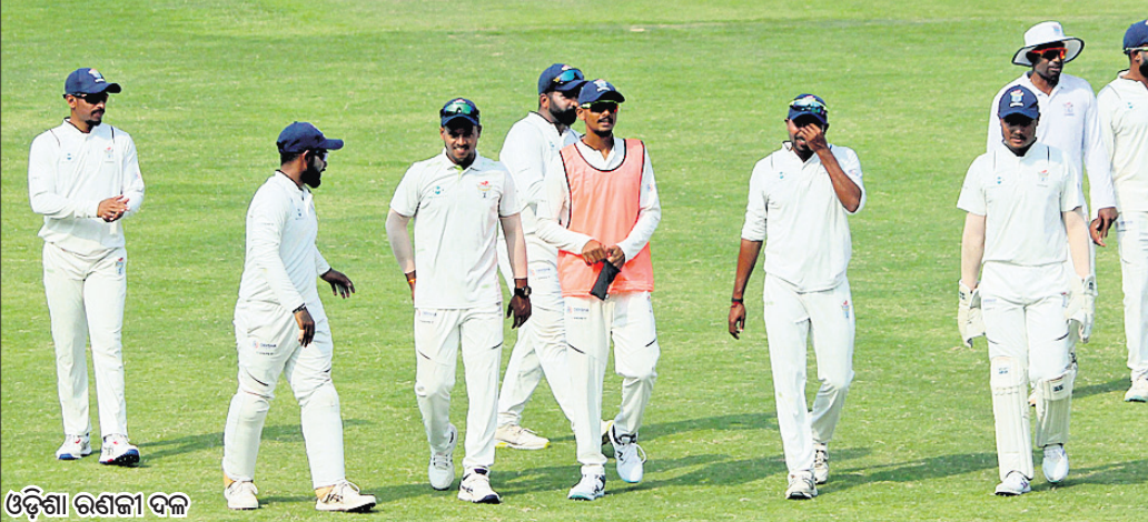
ଓଡ଼ିଶା ରଣକୀ ଦଳ

ପ୍ୟାରିସ୍ ଅଲମ୍ପିକ୍ସ ରହିଥିବାରୁ ଚଳିତ ଦିନ ବାକି ଶହେ ଦିନ କାଉଣ୍ଟ ଡାଉନ୍ ଗୀତରାଏ ପଲ୍ ମ୍ୟାକେଟନ ଛକି ପାରା ଆଥଲେଟ୍ ଲକି ଓଁ ଅଲ୍ ଶୁଖି ଗୁଗେଦର ଗୀତ ହୃଦୟ ଜିଗୁଛି ମିଳି। ଦିବ୍ୟାଙ୍ଗି କରୁ ହେଲେ ପରିବାରେ କିଏ ଟେକଲ ନାକ ଏମାନେ କାମନା ନୁହନ୍ତି ଭାବନା ବଦଳି ଯାଇଛି ଦେଖ ଏକାମୂଳ ଅଛି ଲେଖା ଲାମ୍ପିବଳକୁ ପସିବଳ କରି ରଖିଲେଣି ଦେଖ ଟେକ। -ସୁବାସ ଚନ୍ଦ୍ର ପ୍ରଧାନ