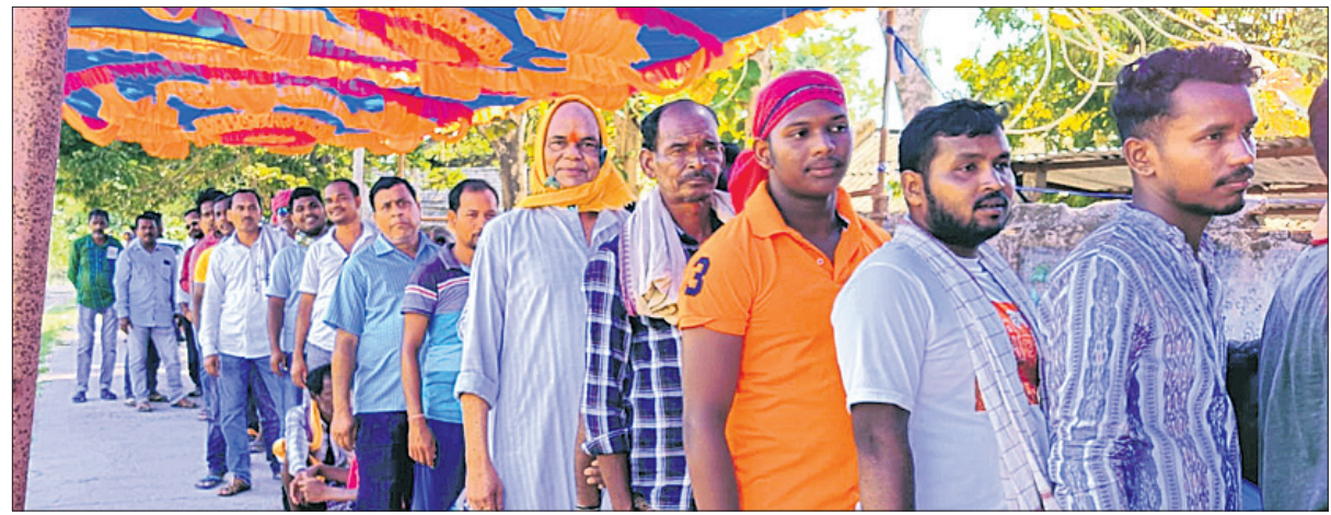
ପୁରୁଷ ଭୋଟରମାନେ ଭୋଟ ଦେବାକୁ ଆସି ଲମ୍ବା ଲାଇନରେ ।

ବୌଦ୍ଧ/କଖାମାଳ, ୨୩।୫ (ଅଜିତ କୁମାର ବାରିକ/ ଆବିଷେଷ ନିମ୍ନ) ବୌଦ୍ଧ ଜିଲ୍ଲା କଖାମାଳ ବିଧାନସଭା ନିର୍ବାଚନମଣ୍ଡଳର ରଜ୍ଜା (ବହ୍ୟା) ପଞ୍ଚାୟତ ଅଧୀନ କିରାସିରା ଓ ମହେଶ୍ୱରପିଣ୍ଡା ବ୍ଲକ୍ରେ ଗତ ୨୦ ତାରିଖରେ ଭୋଟ ଗ୍ରହଣ ବେଳେ ଅନିୟମିତତା ହୋଇଥିବା ବେଳେ ଅଭିଯୋଗ ପରେ ଗୁରୁବାର ଦିନ ଉଚ୍ଚ ବୁଲ୍ ବ୍ଲକ୍ରେ ସାନି ମତଦାନ ଶାନ୍ତିପୂର୍ଣ୍ଣ ଭାବେ ଶେଷ ହୋଇଛି ।