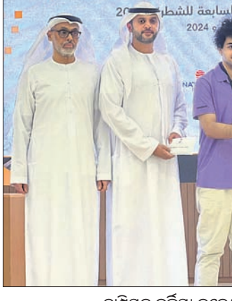
ଦନେଶ୍ୱରଙ୍କୁ ଟ୍ରଫି, ଅର୍ଜୁନ ୨ମ