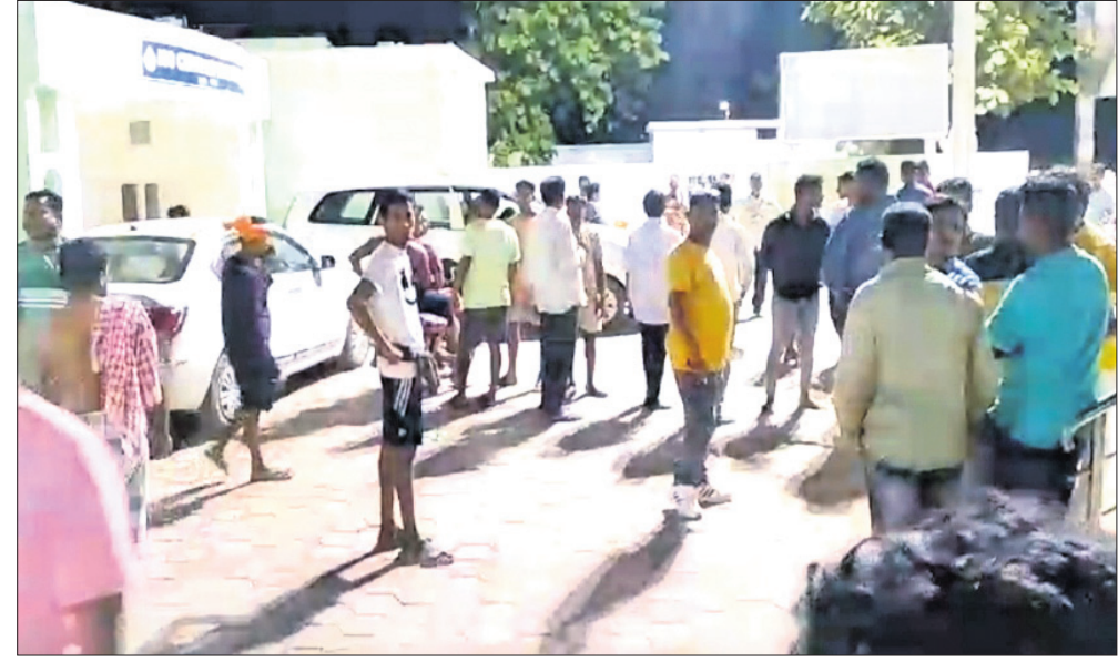
ଗଣଗୋଳ ପରେ ଘରଟିରୁ କିରାଣୀଙ୍କୁ ଡାକାଯାଉଛି।

ରଣପୁର ନିର୍ବାଚନମଣ୍ଡଳର ରଣପୁର ହାଟସାହିତସ୍ଥଳେ ରଣପୁର ବୁଦ୍ଧ ମୁଖ୍ୟ କିରାଣୀଙ୍କ ଘରେ ଚଢ଼ାଉ ହେବ।