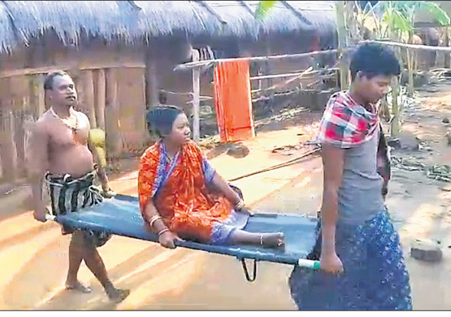
ଜଣେ ମହିଳାଙ୍କୁ ସ୍ତେରରେ ନିଆଯାଉଛି।