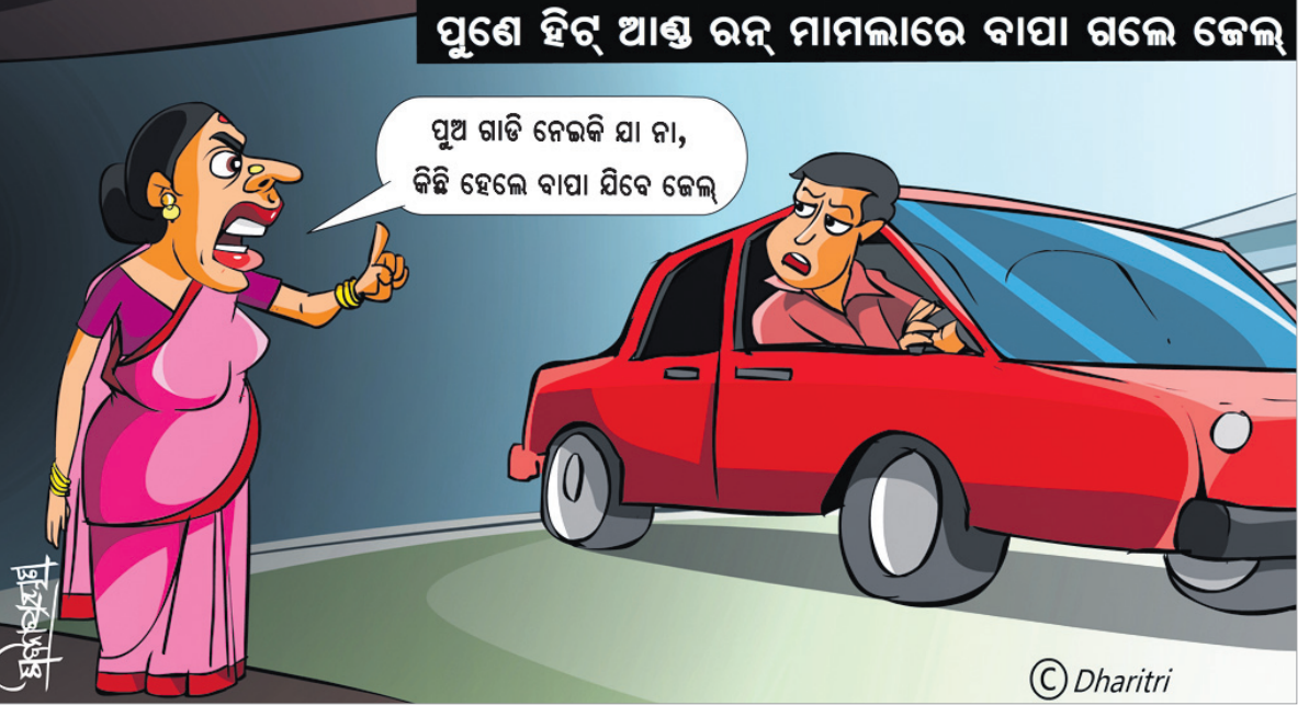
ପୁଣେ ହିନ୍ଦୁ ଆଣ୍ଡ ରନ ମାମଲାରେ ବାପା ଗଲେ କେଲ୍