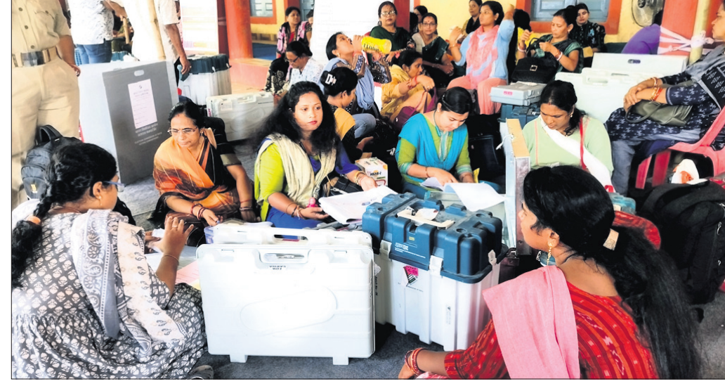
ନୟାଗଡ଼ ସ୍ୱୟଂଶାସିତ ମହାବିଦ୍ୟାଳୟରୁ ଭୋଟ ଗ୍ରହଣ କେନ୍ଦ୍ରକୁ ଯିବା ପାଇଁ ମହିଳା କର୍ମଚାରୀମାନେ ଅପେକ୍ଷା କରିଛନ୍ତି।

ଶନିବାର ପୁରୀ ଲୋକସଭା କ୍ଷେତ୍ରର ରଣପୁର ଓ ନୟାଗଡ଼ ବିଧାନସଭା ନିର୍ବାଚନମଣ୍ଡଳ ଏବଂ କଟକ ଲୋକସଭା କ୍ଷେତ୍ରର ଖଣ୍ଡପଡ଼ା ନିର୍ବାଚନମଣ୍ଡଳରେ ବୁଧକୁ ଗଲେ ପୋଲିଂ ପାର୍ଟି ପ୍ରଚାର କରିବେ ବୋଲି ଆଣ୍ଡା ବାନ୍ଧିଛନ୍ତି।