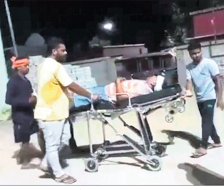
ଆହତ ଭାଜପା କର୍ମୀଙ୍କୁ ଚିକିତ୍ସା ପାଇଁ ନିଆଯାଉଛି।

ରଣପୁର ନିର୍ବାଚନମଣ୍ଡଳର ରଣପୁର ହାଟସାହିତସ୍ଥଳେ ରଣପୁର ବୁଦ୍ଧ ମୁଖ୍ୟ କିରାଣୀଙ୍କ ଘରେ ଚଢ଼ାଉ ହେବ।