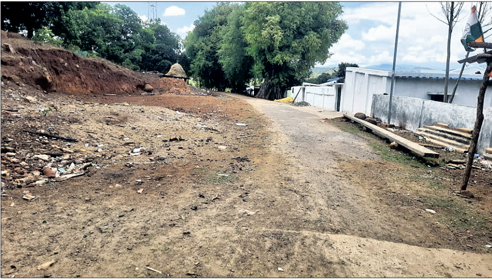
ଅଚଳ ପାଣିଟାଙ୍କି ନିକଟରେ ଗାଁ ଲୋକେ ଓ ଗାଁକୁ ପଡ଼ିଥିବା ରାସ୍ତା ।

ପ୍ରକୃତ ଗ୍ରାମପ୍ରସାରା ଜାରି ରହିଛି । ଏଭଳି ସ୍ଥିତିରେ ମାଲକାନଗିରି ଜିଲାର ବିଭିନ୍ନ ଗ୍ରାମରେ ଦେଖାଦେଇଛି ଜଳ ସଙ୍କଟ । ପୁଣ୍ୟତଃ ପାନୀୟଜଳ ପୁରୁଣା ଗ୍ରାମବାସୀଙ୍କ ପାଇଁ ସ୍ୱପ୍ନ ପାଲଟିଛି । ଦୀର୍ଘବର୍ଷ ହେଲା ଅଚଳ ହୋଇପଡ଼ିଛି ସୋଲାର ପ୍ରକଳ୍ପ ଓ ନଳକୂପ । ଗାଁରେ ଥିବା ଏକମାତ୍ର ନଳକୂପ ଉପରେ ଗ୍ରାମବାସୀ ନିର୍ଭରକରି ଚଳୁଛନ୍ତି । ଲୋକଙ୍କୁ ଆବଶ୍ୟକ ଅନୁସାରେ ପାଣି ମିଳୁ ନ ଥିବାରୁ ଅନୁରୋଧ ସମ୍ମୁଖୀନ ହେଉଛନ୍ତି । ଗାଁଠାରୁ କିଛି କି.ମି. ଦୂରରେ ଚିତ୍ରକୋଣା ଜଳକଣ୍ଠର ଆଇ ମଧ୍ୟ ଜଳକଣ୍ଠ ଭୋଗୁଛନ୍ତି ଲୋକେ । ଏଭଳି ଦେଖିବାକୁ ମିଳିଛି ଚିତ୍ରକୋଣା ବ୍ଲକ୍ ଚମେଳ କ୍ୟାମ୍ପ ପଞ୍ଚାୟତ ବାଲେଶ୍ୱର ଗ୍ରାମରେ ।