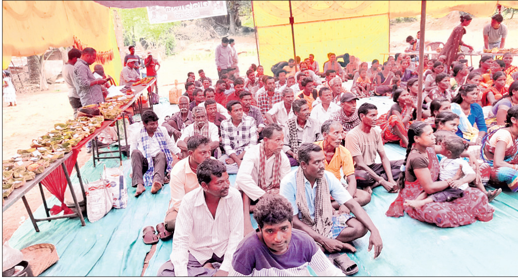
ବିହନ ମେଳାରେ ଯୋଗଦେଇଥିବା ଚାଷୀମାନେ ।

ରାୟଗଡ଼ା ଜିଲ୍ଲା କାଶୀପୁର ବ୍ଲକ୍ ମାଣ୍ଡିବିଶି ପଞ୍ଚାୟତର ମିଳନେଶ୍ୱର ଗ୍ରାମରେ ଶତାଧିକ ଚାଷୀଙ୍କୁ ନେଇ ଏକ ବିହନ ମେଳା ଶନିବାର ଅନୁଷ୍ଠିତ ହୋଇଯାଇଛି ।