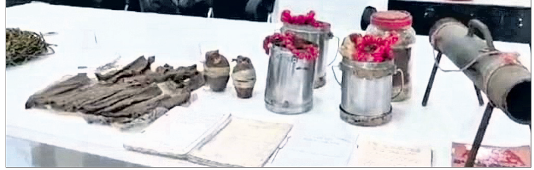
ଜବତ କରାଯାଇଥିବା ମାଓବାଦୀ ସାମଗ୍ରୀ ।

ବଣ୍ଟନ କରାଯାଇଛି । ଅନ୍ୟ କ୍ଷତିଗ୍ରସ୍ତ ସହାୟତା ନିମନ୍ତେ ଉଚ୍ଚ ଅଧିକାରୀଙ୍କୁ ଜଣାଯାଇଛି । ପଲିଥିନ ବଣ୍ଟନ କାର୍ଯ୍ୟକ୍ରମରେ ପାପରମେଟଳା ସରପଞ୍ଚ ନୃସିଂହ ହନାଳ ସହଯୋଗ କରିଥିଲେ ।