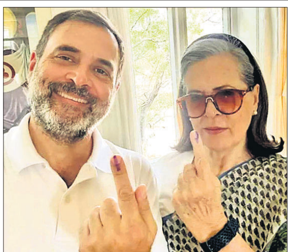
ରାଷ୍ଟ୍ରପତି ଡ୍ରୌପଦୀ ମୁର୍ମୁ ରାଷ୍ଟ୍ରପତି ଭବନ ପରିସରରେ ଭୋଟ ଦେବା ପରେ ପୂର୍ବର କଂଗ୍ରେସ ଅଧକ୍ଷ ରାହୁଲ ଗାନ୍ଧୀ ମା' ସୋନିଆ ପିଙ୍କ ପୋଲି' ରୂପରେ ମତଦାନ କରୁଛନ୍ତି।