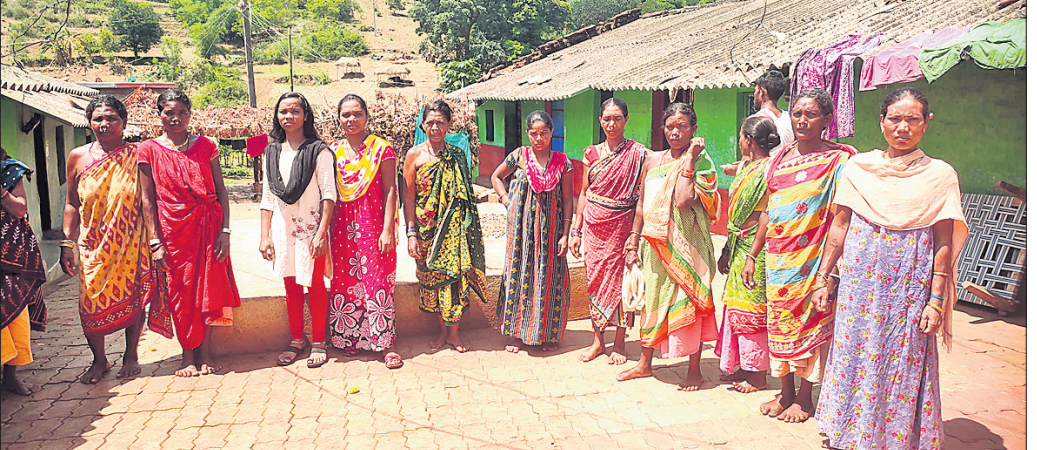
ମଜୁରି ପାଇ ନ ଥିବା ନେଇ ଗ୍ରାମବାସୀ ଅଭିଯୋଗ କରୁଛନ୍ତି।