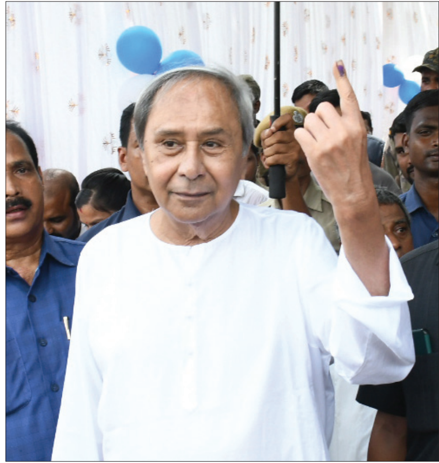
ଭୁବନେଶ୍ୱର ଏକାମ୍ର ନିର୍ବାଚନମଣ୍ଡଳୀ ଅନ୍ତର୍ଗତ ଏରୋଡ୍ରମ୍ ପ୍ରାଇମେରୀ ସ୍କୁଲର ୧୧୪ ନଂ ବ୍ଲକ୍ରେ ଶନିବାର ଭୋଟ ଦେବା ପରେ ଅଭିଭାବକ କାଳି ବିହୁ ଦେଖାଉଛନ୍ତି ମୁଖ୍ୟମନ୍ତ୍ରୀ ନବୀନ ପଟ୍ଟନାୟକ ।