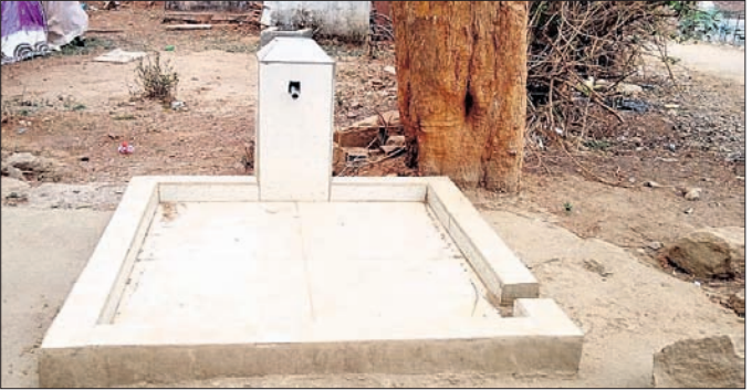
ପାଣି ଆସୁ ନ ଥିବା ଶୁଷ୍କପୋଖୁ।

ବସୁଧା ଯୋଜନାରେ ଗ୍ରାମାଞ୍ଚଳରେ ପାନୀୟ ଜଳ ଯୋଗାଣ ପାଇଁ ଲକ୍ଷ୍ୟାଧିକ ଟଙ୍କା ଖର୍ଚ୍ଚ କରୁଛନ୍ତି ସରକାର। ହେଲେ ପିଇବା ପାଣି ପାଇବାକୁ ବଞ୍ଚିତ ହେଉଛନ୍ତି ଲୋକେ। ସୁନାବେଡ଼ା ପୌର ପରିଷଦ ସାମାଜ ଅଞ୍ଚଳ କୋରାପୁଟ ବ୍ଲକ୍ ଅନ୍ତର୍ଗତ ପଦ୍ମଗୁଡ଼ା ପଞ୍ଚାୟତର ତେରେଙ୍ଗାଗୁଡ଼ା ଗ୍ରାମରେ ପାନୀୟ ଜଳ ଅଭାବ ଦେଖାଦେଇଛି। ଏହି ଗ୍ରାମର ଗୋଟିଏ ପଟେ ରେଳ ଟ୍ରାକ୍ ଥିବା ବେଳେ ଅପରପଟେ ଭାରତମାଳା ଯୋଜନାର ୬ ଥାକିଆ ରାସ୍ତା ରହିଛି। ୧୮୦ ପରିବାରର ପ୍ରାୟ ୬ ଶହରୁ