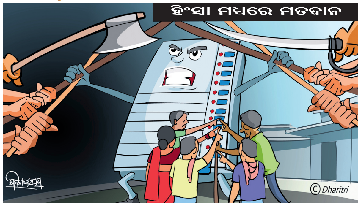
ହିଂସା ମଧ୍ୟରେ ମତଦାନ