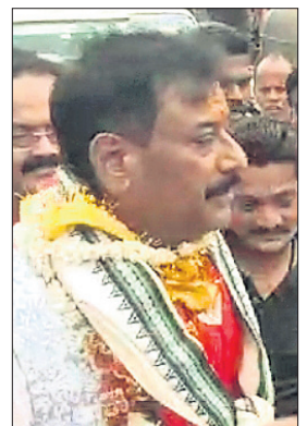
ଖୋର୍ଦ୍ଧା/ବୋଲଗଡ଼, ୨୫.୫ (ପ୍ରଭାତ ପାଣିଗ୍ରାହୀ/ଦେବଦ୍ରୁତ ହୋତା)

ବେଗୁନିଆ ନିର୍ବାଚନମଣ୍ଡଳୀର ବୋଲଗଡ଼ ବ୍ଲକ୍ ଅନ୍ତର୍ଗତ ରାଜସୁନାଖଳା ନିକଟ କାଉଁରପାଟଣାର ୧୧୪ ନମ୍ବର ବ୍ଲକ୍ରେ ଶନିବାର ଭାଙ୍ଗପା ଖୋର୍ଦ୍ଧା ବିଧାନସଭା ପ୍ରାର୍ଥୀ ପ୍ରଶାନ୍ତ