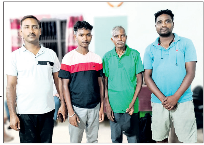
ବୃକ୍ଷ ଝରିଗାଁ ପୋଲିସ୍ ପରିବାର ଲୋକଙ୍କୁ ହସ୍ତାନ୍ତର କରୁଛି ।