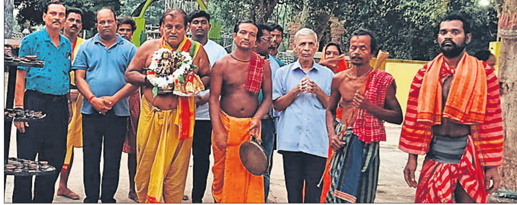
ନିରାକାରପୁର, ୨୭/୫ (ମାଧବ ଚନ୍ଦ୍ର ପଟ୍ଟନାୟକ)

ପବିତ୍ର ଅକ୍ଷୟତୃତୀୟାଠାରୁ ପାରମ୍ପରିକ ରୀତିରେ ଆରମ୍ଭ ହୋଇଥିବା ସ୍ଥାନୀୟ ଅଞ୍ଚଳର ଲକ୍ଷ୍ମଣେଶ୍ୱରୀଙ୍କୁ ଚନ୍ଦନ ଯାତ୍ରା ସୋମବାର ୧୬ ଦିନରେ ପହଞ୍ଚିଛି । ଏହି ଅବସରରେ କପିଳେଶ୍ୱରଦେବ ଓ ମାତା ପାର୍ବତୀଙ୍କୁ ପ୍ରସ୍ତୁତ ଅନୁଷ୍ଠାନ କର୍ତ୍ତୃ, ବୁଧା, ଚନ୍ଦନ ସାମଗ୍ରୀ ଡିସ୍ପୋଜିଟ କରିବା ପାଇଁ ବାସୁଙ୍ଗାପାଟ ସେବକକୁ ଦାୟିତ୍ୱ ଦିଆଯାଇଥିଲା । ପାଟର ମାନ ଅନୁଧ୍ୟାନ ପରେ ପ୍ରଶାସନ ବରାଦ ଦେଇଥିଲା । ଏହାପରେ ବାସୁଙ୍ଗାପାଟ ପ୍ରସ୍ତୁତ କରାଯାଇଥିଲା ।