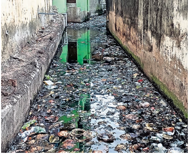
କାଳିବଜାର ମୁଖ୍ୟ ଡ୍ରେନ୍‌ରେ ଜମି ରହିଥିବା ଆବର୍ଜନା।