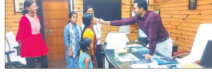
ଖୋର୍ଦ୍ଧା, (ପ୍ରଭାତ ପାଣିଗ୍ରାହୀ) ୨୭/୫

ମିଷ୍ଟାନ୍ତ ଖୁଆଇ ଶୁଭେଚ୍ଛା ଜଣାଇଲେ ଜିଲ୍ଲାପାଳ