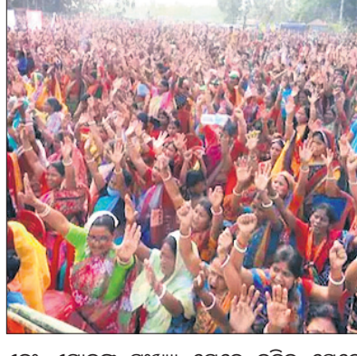
ଏବଂ ଏମାନଙ୍କ ସଂଖ୍ୟା ଯେତେ ବଢ଼ିବ ସେତେ ପୁରକ୍ଷିତ ରହିବ ଆମ ଗଣତାନ୍ତ୍ରିକ ପରମ୍ପରା ଓ ମୂଲ୍ୟବୋଧ।

ମତଦାତାଙ୍କ ଭୂମିକା। ବିଶେଷକରି ଯେଉଁମାନେ କାହାରି ଦ୍ୱାରା ପ୍ରଭାବିତ ନ ହୋଇ ନିର୍ଭୀକ ଭାବେ ମତଦାନ କରନ୍ତି ତାକୁ କୁହାଯାଏ ସଚ୍ଚୋତ ମତଦାତା। ଏମାନେ ଦଳୀୟ ଭାବନାରେ ଅଛନ୍ତେଇ ଭୋଟ ଦିଅନ୍ତି ନାହିଁ କି କାହାରି ପ୍ରଚାର ଓ ପ୍ରଚାରକଦ୍ୱାରା ବଦଳାନ୍ତି ନାହିଁ ମତ। ଯୋଗ୍ୟ ପ୍ରତିନିଧି ତନ୍ତ୍ର ପାଇଁ ବିଭିନ୍ନ ପ୍ରାର୍ଥୀଙ୍କ ଦକ୍ଷତାକୁ ନେଇ ଯେଉଁ ପ୍ରଶ୍ନ ସବୁ ମନକୁ ଆନ୍ଦୋଳିତ କରେ ସେମାନେ ତା'ର ଯଥାର୍ଥ ଉତ୍ତର ଖୋଜନ୍ତି ପ୍ରାର୍ଥୀମାନଙ୍କ କାର୍ଯ୍ୟଧାରା, ପ୍ରତିଷ୍ଠିତ ଓ ରାଜନୈତିକ ପୃଷ୍ଠଭୂମି ଆଧାରରେ। ସେହି ଉତ୍ତର ସାହାଯ୍ୟରେ ସେମାନେ ବିଚ୍ଛିନ୍ନ ଯୋଗ୍ୟ ପ୍ରାର୍ଥୀ। ବାସ୍ତବରେ ଏହିମାନେ ହେଉଛନ୍ତି ଗଣତାନ୍ତ୍ରିକ ସୈନିକ