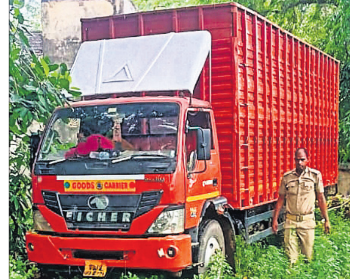
କବଚ ହୋଇଥିବା ଟୋରୁ ବୋହେଇ ଗାଡ଼ି ।

ଖୋର୍ଦ୍ଧା ଜିଲ୍ଲା ୧୬ ନମ୍ବର ଜାତୀୟ ରାଜପଥ ବାଲୁଗାଁ ବାଲପାସ ରାସ୍ତାର ବେଲପଡ଼ା ଛକ ନିକଟରେ ସୋମବାର ଭୋର ପ୍ରାୟ ୪ଟା ସମୟରେ ଆନ୍ଧ୍ରପ୍ରଦେଶ ଚାଲାଣ ହେଉଥିବା ଏକ ଆଇରନ ଜଣ୍ଟେନରକୁ ପୋଲିସ ୬୧ଟି ଟୋରୁକୁ ଉଦ୍ଧାର କରିଛି । ହେଲେ ଡ୍ରାଇଭର ଓ ହେଲପର କୌଶଳକ୍ରମେ ସେଠାରୁ ଖସି ପଳାଇବାରେ ସମର୍ଥ ହୋଇଛନ୍ତି । ଏନେଇ ବାଣପୁର ପୋଲିସ ୨୦୧/୨୪ରେ ଏକ ମାମଲା ରୁଜୁ କରି ତଦନ୍ତ କରୁଛି । ଖବର ନେବାରେ ଜଣାଯାଇଛି, ରବିବାର ବିଳମ୍ବିତ ରାତ୍ରିରେ କୌଶଳ ଗାଡ଼ି ଦୁର୍ଘଟଣାରେ ବେଲପଡ଼ା ଛକଠାରେ ୩ଟି ଗାଈର ମୃତ ଶରୀର ରାସ୍ତା ଉପରେ ସିଧିପୁ ଭାବେ ପଡ଼ି ରହିଥିଲା । ଏଥିରେ ରାସ୍ତା ଅବରୋଧ ହୋଇଥିଲା । ଏହି ସମୟରେ ଆନ୍ଧ୍ର ଅଭିଯୁକ୍ତ ଯାଉଥିବା ଏକ ଆଇରନ ଜଣ୍ଟେନର ଟୋରୁ