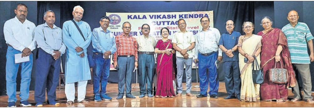
କଟକ କଳାବିକାଶ କେନ୍ଦ୍ରରେ ସୋମବାର ଆୟୋଜିତ ରାଜ୍ୟସ୍ତରୀୟ ଗ୍ରୀଷ୍ମକାଳୀନ ଶିବିରରେ ଉପସ୍ଥିତ ଅତିଥିମାନେ।