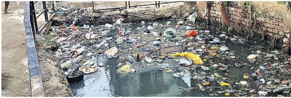
ଭଦ୍ରମଧୁ ସ୍କୁଲ ସମ୍ମୁଖ ମୁଖ୍ୟ ଡ୍ରେନ୍‌ରେ ଜମି ରହିଥିବା ଅପରିଷ୍କାର ପାଣି ଓ ଆବର୍ଜନା।

କରାଯାଇନାହିଁ। କାଳିବଜାର ଓ ଭଦ୍ରମଧୁ ସ୍କୁଲ ସମ୍ମୁଖ ମୁଖ୍ୟ ଡ୍ରେନ୍‌ରେ ଆବର୍ଜନା ଜମି ରହିବାରୁ ପାଣି ନିଷ୍କାସନ ହୋଇପାରୁନାହିଁ। ଫଳରେ ସେଠାରେ ଅସ୍ୱାସ୍ଥ୍ୟକର ପରିବେଶ ସୃଷ୍ଟି ହୋଇଛି। ଏପରି କି ମଶାବଂଶ ବୃଦ୍ଧିରେ ସହାୟକ ହେଉଛି। ଅପରପକ୍ଷରେ ସହରର ମୁଖ୍ୟନାଳରେ ନିର୍ମାଣାଧୀନ ବନ୍ଧୁକ୍ରେନ୍ କାର୍ଯ୍ୟ ଶେଷ ହୋଇପାରୁନାହିଁ। ଯଦ୍ୱାରା ସହରର ବିଭିନ୍ନ ଶାଖା ଡ୍ରେନ୍‌ରୁ ମୁଖ୍ୟ ଡ୍ରେନ୍‌କୁ ଜଳ ନିଷ୍କାସନରେ ବାଧକ ସୃଷ୍ଟି ହୋଇଛି। ଏବେ ପକୋଢ଼ାର କାର୍ଯ୍ୟ ଯେଉଁଠି ଭାବେ ଚାଲିଛି ବର୍ଷାଦିନ ପୂର୍ବରୁ ସମ୍ପୂର୍ଣ୍ଣ ହେବ କି ନାହିଁ ତାହାକୁ ନେଇ ପ୍ରଶ୍ନବାଚୀ ସୃଷ୍ଟି ହୋଇଛି। ତେବେ ମୌସୁମୀ ସମ୍ମୁଖୀନ ହୋଇଥିଲେ। ଏବେ ବି କାଳିବଜାର, ପଟାପୋଲ, ଗହ୍ୱାଡିଆ, ଝୋଲାସାହି, ମେରିଆବଜାର, ଭଦ୍ରମଧୁ ସ୍କୁଲ ସମ୍ମୁଖ ମୁଖ୍ୟ ଡ୍ରେନ୍‌ରୁ ପକୋଢ଼ାର