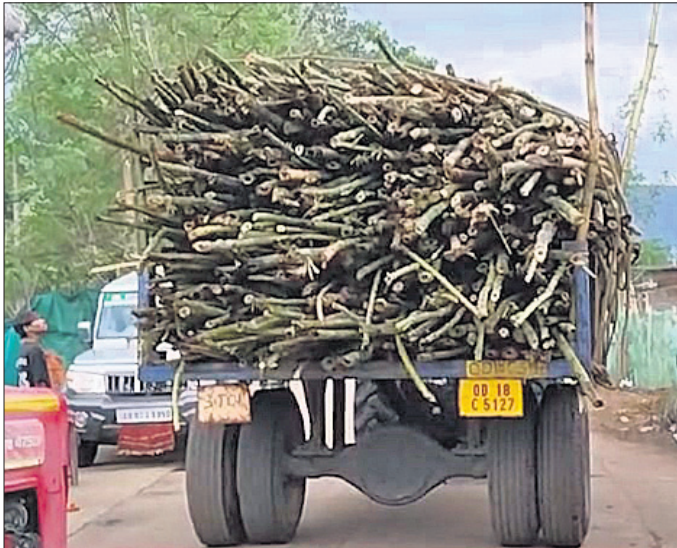
ଗ୍ରାହକର ବାଉଁଶ ଚାଲାଣ କରାଯାଉଛି ।

ଠିକ୍ ଭାବରେ ହେଉ ନ ଥିବା ନିୟମଗିରି ବାସିନ୍ଦା ଅଭିଯୋଗ କରିଛନ୍ତି । ଏଭଳିକି ବାଉଁଶର ପାଇଁ ପ୍ରସିଦ୍ଧ ରାୟଗଡ଼ା ଜିଲାର ନିୟମଗିରି ସମେତ ବିଭିନ୍ନ ଜଙ୍ଗଲ ଏବେ ଲୋପ ପାଇବାକୁ ବସିଯାଇଛି ।