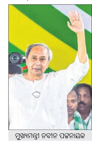
ପୁଖ୍ୟମନ୍ତ୍ରୀ ନବୀନ ପଟ୍ଟନାୟକ

ନୂଆଦିଲ୍ଲୀ, ୨୮/୫ (ପି.ଟି.) ଭାରତୀୟ ଜନତା ପାର୍ଟି (ଭାଜପା) କେବଳ କହିଥାଏ, କିନ୍ତୁ ପାରି ନ ଥାଏ। ଭାଜପା ପୂର୍ବରୁ କର୍ମଚାରୀଙ୍କ ସରକାର ଗଢ଼ିବ ବୋଲି ଦାବି କରିଥିଲା। ହେଲେ ଏଥିରେ ବିଫଳ ହୋଇଥିଲା। ଭାଜପା ନେତାମାନେ ତେଲଙ୍ଗାନାରେ ସରକାର ଗଢ଼ିବ ବୋଲି କହି ବିଫଳ ହୋଇଥିଲେ। ସେହିପରି ହିମାଚଳ ପ୍ରଦେଶରେ ସେମାନେ ଅନୁରୂପ ଦୁଡ଼େଲି ପ୍ରକାଶ କରି ବିଫଳ ହୋଇଥିଲେ। ଓଡ଼ିଶା ନିର୍ବାଚନରେ