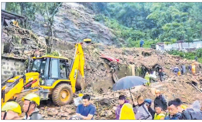
ଭୁଣ୍ଡୁଡ଼ି ପଡ଼ିଥିବା ପଥର କ୍ୱାରିରେ ଉଦ୍ଧାର କାର୍ଯ୍ୟ ଚାଲିଛି।

କେତେକ ଆହତରାଜ୍ୟ ରାଜ୍ୟ ସ୍ତରୀୟ କ୍ଷତିଗ୍ରସ୍ତ ହୋଇଛି। ପୁଖ୍ୟମନ୍ତ୍ରୀ ଲୋକେଶ୍ୱରୀ କେନ୍ଦ୍ରୀୟ ଟ୍ରେଡିଂ କମିଶନ ଦ୍ୱାରା ସହ ନୂତନମାନଙ୍କ ପରିବାର ପାଇଁ ୪ ଲକ୍ଷ ଟଙ୍କା ଲେଖାଏ ଅନୁକମ୍ପାମୂଳକ ସହାୟତା ଘୋଷଣା କରିଛନ୍ତି।