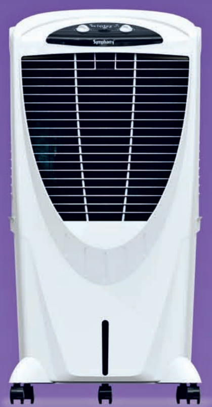
Winter 80 XL

MRP (1N) : ₹11,299/- Offer Price (1N) : ₹10,391/-