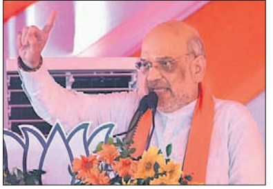
ଗର୍ଭଚିକିତ୍ସା କରି କହିଛନ୍ତି, ତାଙ୍କ ଘ୍ନାନରେ ଜଣେ ଓଡ଼ିଆ କହିପାରୁଥିବା ଏବଂ ପ୍ରଭୁ ଜଗନ୍ନାଥଙ୍କ ଚୈତ୍ୟକୁ ଆହୁରି ବଢ଼ାଇପାରୁଥିବା ନେତାଙ୍କୁ ଆମେ ପୁଖ୍ୟମନ୍ତ୍ରୀ କରିବା। ଓଡ଼ିଆ ପୁଖ୍ୟମନ୍ତ୍ରୀ ନା ତାମିଲ ବାବୁଙ୍କ ଶାସନ ଦରକାର ବୋଲି ସେ ଜନସାଧାରଣଙ୍କୁ ପ୍ରଶ୍ନ କରିଛନ୍ତି। ଓଡ଼ିଶାରେ ଥରେ ଭାଜପା କ୍ଷମତାକୁ ଆସିଲେ ଏଠାକାର ଯୁବତୀଯୁବକଙ୍କୁ ଆଉ ରୋଜଗାର ପାଇଁ ବାହାରକୁ ଯିବାକୁ ପଡ଼ିବ ନାହିଁ। ସକଳ୍ପ ପତ୍ରରେ ଘୋଷଣା କରାଯାଇଛି, ଚିରଫୁଲ୍ଲରେ ବୁଡ଼ିଥିବା ଅର୍ଥ ସମଗ୍ରକୁ ଫେରସ୍ତ କରାଯିବ। ଏହାର କୁତ୍ସାରୀଙ୍କୁ ଓଲଟା ଲଢ଼ାଯିବ। ପୁଷ୍ପା-୪