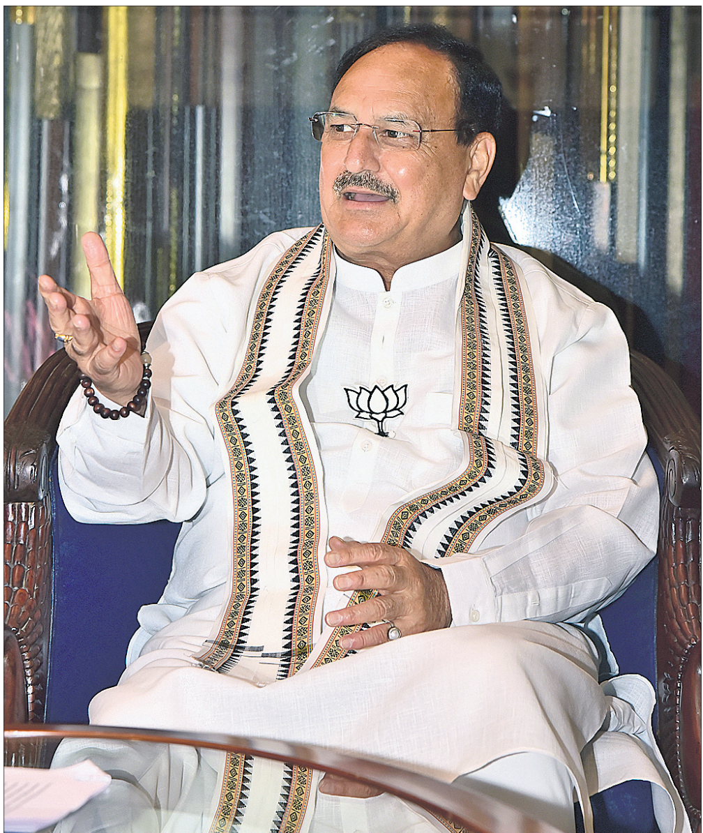
ସାକ୍ଷାତକାର ଜେ.ପି. ନଈ ଭାଜପା ରାଷ୍ଟ୍ରୀୟ ଅଧ୍ୟକ୍ଷ