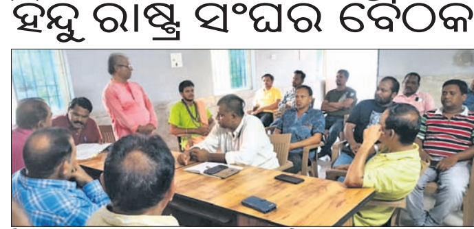
ହିନ୍ଦୁ ରାଷ୍ଟ୍ର ସଂଘର ବୈଠକ