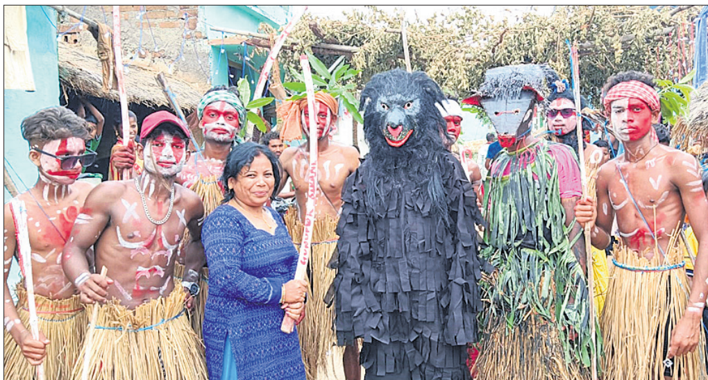
ଶ୍ରଦ୍ଧାଳୁ ବିଭିନ୍ନ ବେଶରେ ସଜିତ ହୋଇ ଗ୍ରାମ ପରିକ୍ରମା କରୁଛନ୍ତି ।

ରାୟଗଡ଼ା ଜିଲା ଗୁଣପୁର ବ୍ଲକ ଭୀମପୁରଗୁଡ଼ା ଗ୍ରାମରେ ୨୪ତମ ଆରମ୍ଭ ହୋଇଥିବା ଘଟଯାତ୍ରା ମଙ୍ଗଳବାର ଉଦ୍‌ଘାଟିତ ହୋଇଛି ।