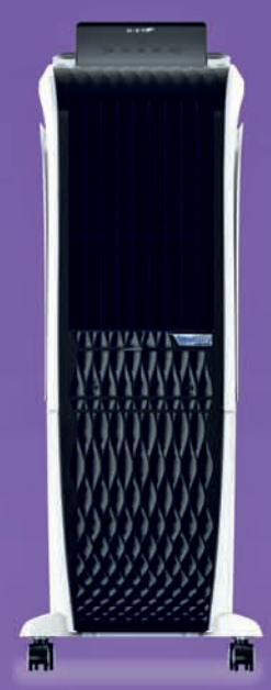
Diet 3D 30i

MRP (1N) : ₹11,299/- Offer Price (1N) : ₹10,391/-