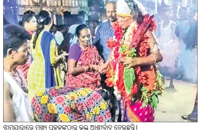
ଝାମୁଯାତ୍ରାରେ ପୁଖ୍ୟ ପୂଜକଙ୍କଠାରୁ ଭକ୍ତ ଆଶୀର୍ବାଦ ନେଉଛନ୍ତି ।