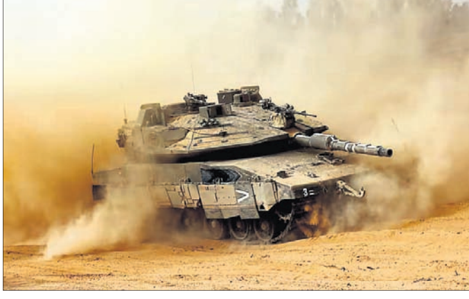
ଗାଜା ସୀମାରେ ଲସ୍‌ଆଂଜେଲିସ୍ ଏକ ଟ୍ୟାକ୍।

କାଏରୋ, ୨୮୫ କୋର୍ଟ ଅଫ୍ ଜଷ୍ଟିସ୍ (ଆଇଭିଜେ) ପକ୍ଷରୁ ରାଫାହରେ ବର୍ତ୍ତମାନ ବନ୍ଦ ପାଇଁ ଲସ୍‌ଆଂଜେଲିସ୍ ନିର୍ଦ୍ଦେଶ ଦିଆଯିବା ସତ୍ତ୍ୱେ ଏଥିରେ ଭୋକ କରିଛନ୍ତି।